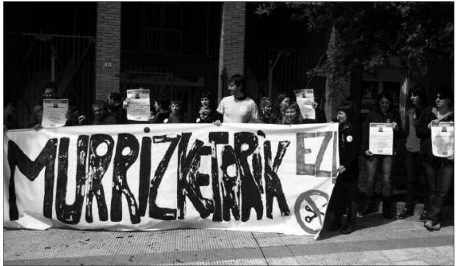
"LOMCE ez, Murrizketarik ez, gure hezkuntza eredu" aldarrikatu zuten.

U darrregi ikastolako langileen ordezkariak igorri digu argazki hau. Eta argazkiarekin, honako oharra: "ikastolan aurreko ostiralean egin genuen elkarteratzearen berri eman nahi dizuet". LAB sindikatuak egin zuen deialdiarekin bat egin ez, LOMCE ez, Murrizketarik ez, gure hezkuntza ereduaren ekimenarekin bat egin zuten irudian diren irakasle eta langileek. "Ikastola guztiei egin zitzaien deialdia eta gure er proposamen honen bat egin genuen". 12.30ean ikastola sarreran elkartu ziren eta Bordatxo aurreko errotondara jaitsi ziren. Han 15 minutuz egon ziren pankartarekin, LOMCE legeari aurkakotasuna adieraziz.