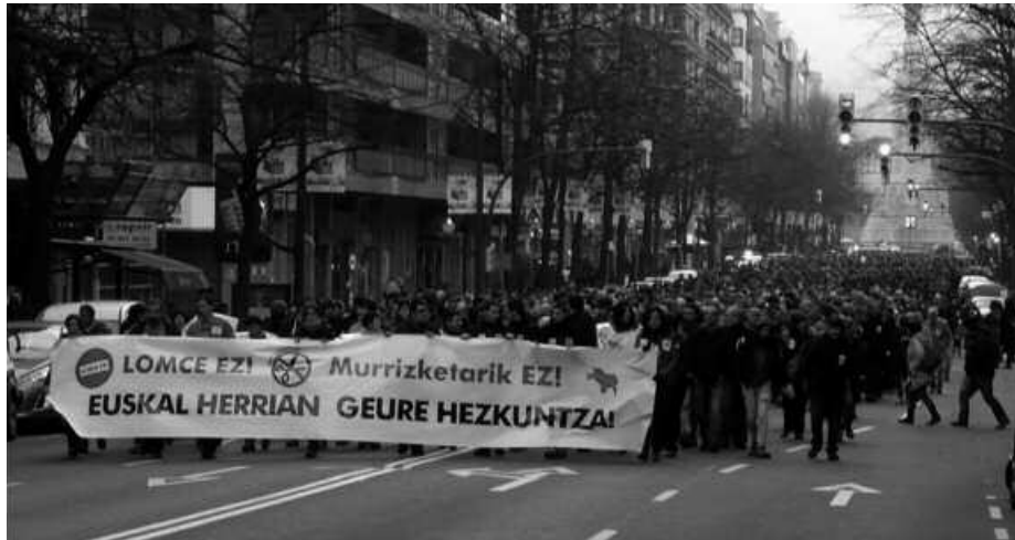
LOMCE legearen aurka mobilizazio ugari egin dituzte euskal ikasleek.

Ebaluazioa. Etapa bakoitza amaitzen duten heinean rebalida edo azterketa "nazionala" burutu beharko dute ikasleek. Hau da, DBH eta Batxilergo notaren %70 etapako nota izango da eta azterketa "nazionalak" %30a balio-