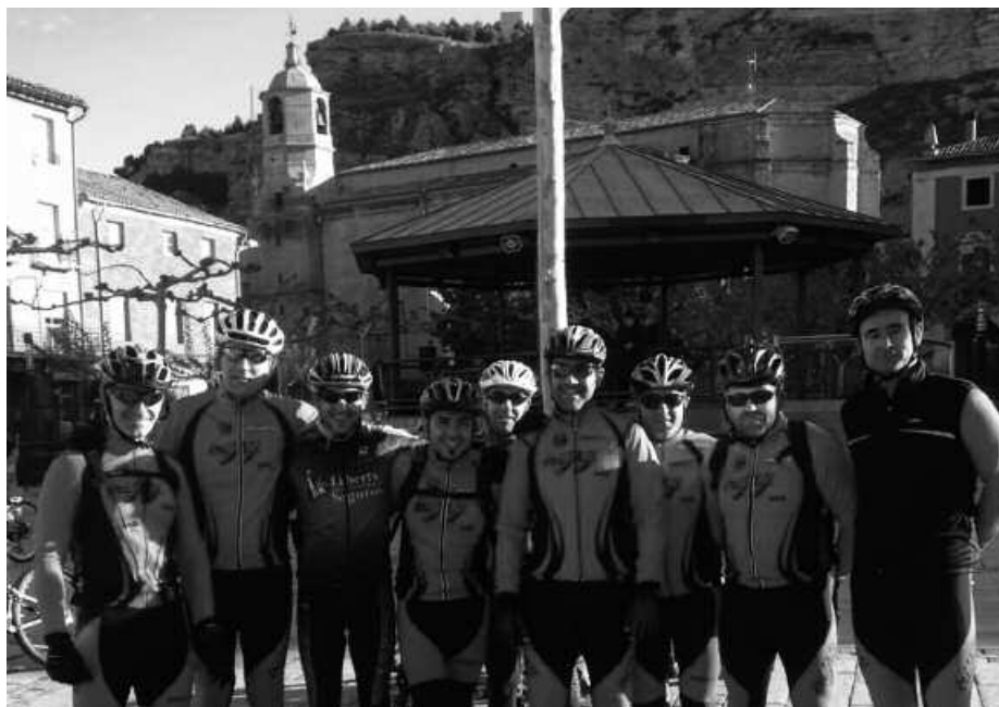
60 kilometroko martxa osatu zuten Usurbildik abiatu ziren bederatzi lagunek.

Apirilaren 21ean, Lodosako X. Martxa burutu zen Nafarroako erriberan, eta bertan izan ziren Usurbilgo Irisasi BTT taldeko bederatzi partaide. "Eguraldi ezinhobea izan zuten gure txirriindulariek probaren hasiera-hasieratik, eta