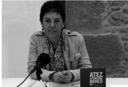
Lege arautegia betetzen duela dio Udalak.

Udalaren prentsa oharrak jasotzen duenez,