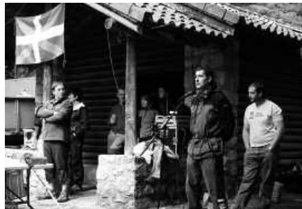
Goiz pasa ederra antolatu dute iganderako.