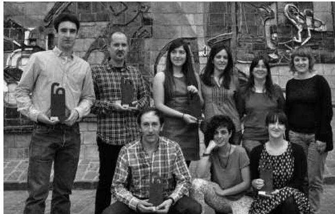
Argazkian dira aurtengo edizioan sarituak izan diren egileak.

tzeko gune berria, eta bada gehiago ere. Beste berrikuntza bat, kasu honetan, CAF-Elhuyar Sarietara aurkeztu diren lanak, kategoria berri batean lehiatzeko aukera izan dute aurtengoa, "Zientzia Gizartean Sorkuntza Beka" izenekoan. "Horren bidez, zientzia eta teknologiaren eta gizartearen arteko elkarreragina sortuko duten proiektuei laguntzea dugu helburu", berri eman dute Elhuyar Fundaziotik.