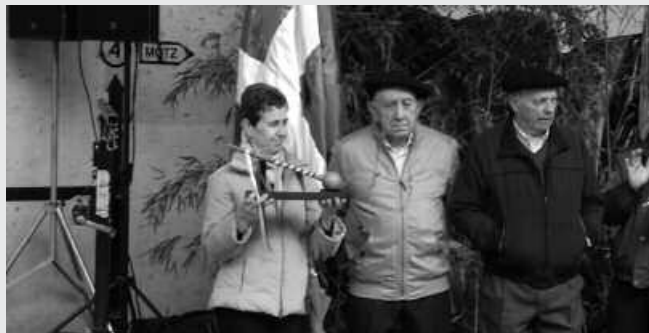
Atzoko eta gaurko dantzariak bildu ziren omenaldian.

Frontoiko dantza taldeen saioa amaituta, Kantu-Taldekoen txanda heldu zen. Hitzordu berezia ospatu