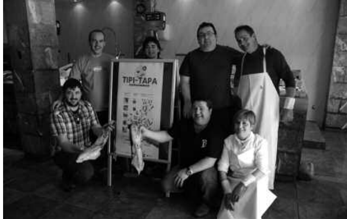
Tabernariak Pello arrandegian, VI. Tipi Tapa iragartzen.

Giroten joateko, tabernariak Pello arrandegian izan dira. Txipiroiak protagonista