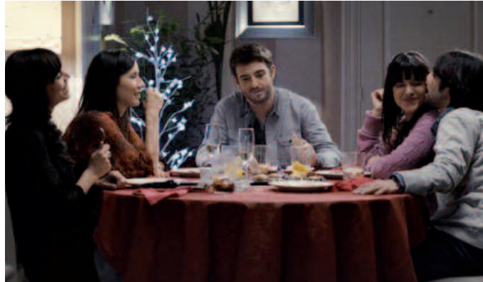
Maiatzaren 3an ostirala, gaueko 22:00etan Sutegin.

Xabik (Gorka Otxoa), Nereak (Barbara Goenaga) eta Mariak (Sara Cozar) osaturiko