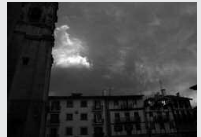
Argazki hau ere ikus ahal izango da.

Iñaki Agirresaroberen "Kolorez kolore" diaporama ikus ahal izango dugu maiatzaren 8an asteazkena, Sutegin. 19:30ean hasiko da proiektzioa.