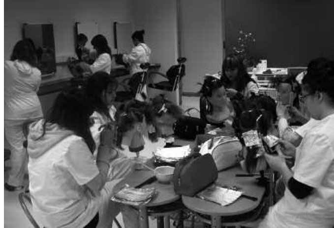
Ekainaren 23an amaituko da izena emateko epea.

zerbitzatu / Gozogintza / Okina / Sukaldaritzak).