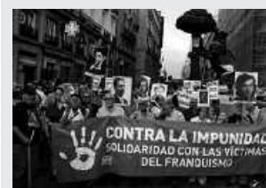
Mozio hau beste udalerrri askotan ere aurkeztu da.

Besteak beste, Francoren altxamendua eta ondorengo diktadura, baita ekintza hauetan parte hartu edota honen guztiaren alde egin zutenak salatzen ditu maiatzaren 28an onarturiko testuak, "berrogei urteetan zehar eragindako triskantza odoltsuengatik". Aldiz, 1936ko uztaileko altxamenduan eta erregimen frankistan errepresaliatuak izan zirenen eskubideen alde agertzen da mozioa eta administrazioei eskubideok bermatzea eskatzen die, egia, justizia eta erreparazioa galdegiteaz gain. Horrekin guztiarekin batera, udaletxeak soilik ez, errepresioa sufritu dutenei, euren senideei eta herritarrei ere, testu hau babesteko deia egiten zaie.