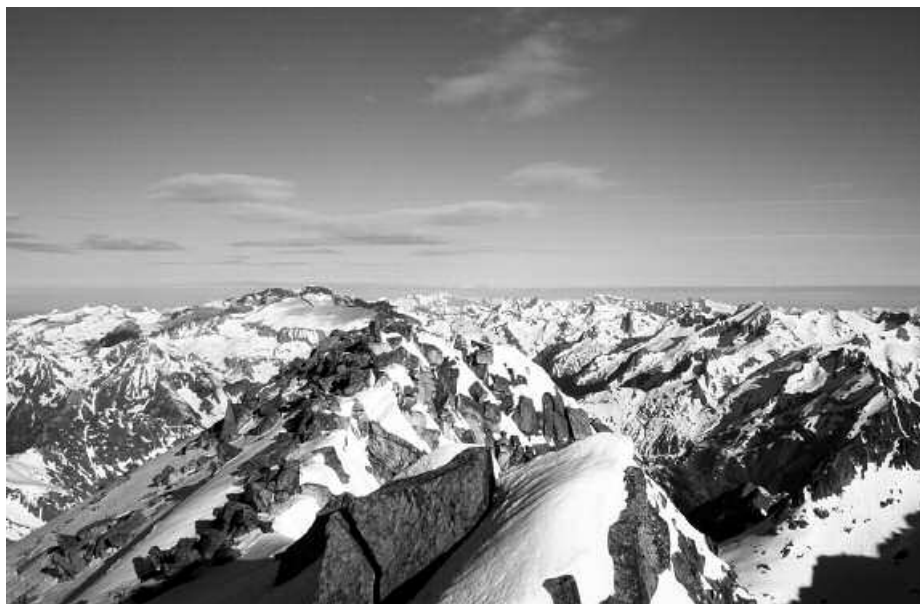
Beste batzuen artean, Maldito mendia ikusten da argazki honetan.