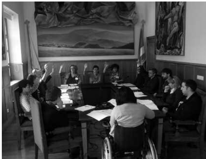
Adineko zentroetako langileen hitzarmenaz ere eztabaidatu zen planoan.