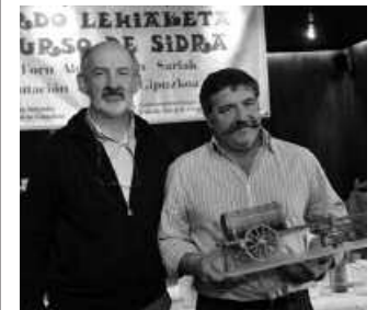
Urdairakoak oroigarria eta 1.000 euro jaso zituen.

Bi helburu nagusi ditu lehiaketak: sagardogilearen elaborazio lana baloratzera eta botilaratutako sagardoa- ren kalitatea saritzea.