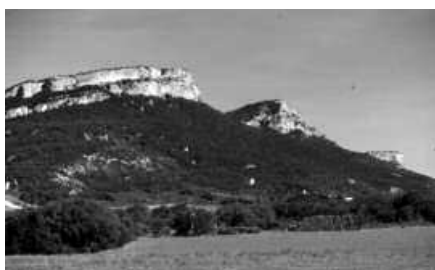
Joan etorria autobusez egingo dute.

N afarroa mendebaldean dago Lokizeko mendizerra. Hango parajeetan zehar ibiltzeko, 18 kilometroko ibilbidea pres-tatu dute Andatzakoek, igande honetako irte-erarako. Narkuetik Urbisurako bidea osatuko dute, tartean, Arlaba mendia eta Lokiz zehar-katuz. Amaieran, otordua egiteko Urbisuko elkarteak bilduko dira guztiak.