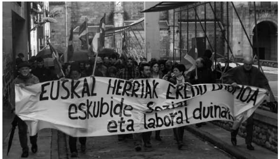
Greba egunean, arratsalde partean manifestazioa egin zen Usurbilen.

Greba eguneko lehen orduak emandakoan berri eman zuten, 9:30ak aldera frontoian burutu zen eguneko lehen batzarrean. Indus- tria guneean grebarekin bat egindako lantegi- ak nagusi zirela zioten. Zenbait lantegi ata- rietan auto batzuk aparkatuta ikusten ziren, baina aipaturikoa, greba orokorrak jarraipen zabala izan zuen herrian ditugun lantegietan. Salbuespen bakarretakoak, Michelin edota Urbil merkatalgunea. Egunean zehar, hainbat pikete informatibo egin ziren batean zein bes- tean, greba orokorrenekin bat egitea eskatze- ko. Urbilen kasuan, Buruntzaldeko udalerrie- tako ehunetik gora herritarrek parte hartu zuten merkatalguneko pikete informatiboan. Ertzain-