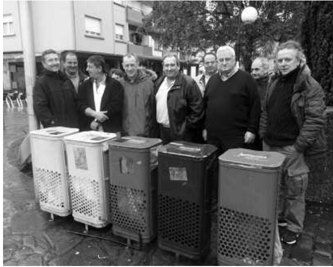
Zuberoako herri txiki batetik etorri ziren larunbatean, atez atekoa ezagutzera.

Sarrikotapeako bizilagun taldea duzue irudian. Sarrikotapea, Zuberoako udalerritxiki bat da, 240 biztanlekoa. Larunbat goizean Usurbilen izan ziren, hemen burutzen den atez ateko bilketa sistema ezagutzen. Orain arte bezala, hondakinak nahasian bildu eta zabortegetietara garraiatzeko ereduaren aurrean, bestelako alternatibak badirela ezagutzeko aukera izan zuten. Hain zuzen, Ipar Euskal Herriko hondakinen biltoki lanak egingo lituzkeen zabortege bat eraikiko dieten mehatxupean bizi dira Sarrikotapeako eta inguruetako bizilagunak. Egitasmo honen aurka lanean ari da, ekainaren 1ean Usurbilen bisitan izan genuen lagun tal-