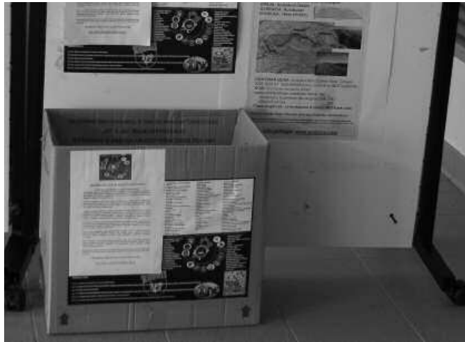
Kiroldegiaren sarreran dago janaria uzteko kutxa.

Elkartasun ekimen honetan parte hartzera deitzen dute motozaleek. "Zuen guztion laguntza eskatzen dugu ideia hau aurrera eraman ahal izateko, ez baitugu diru edo ospa bila egiten, denok hain beha-