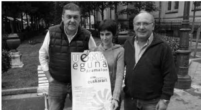
UEMA Eguna, Donostian aurkeztu zen egunean.