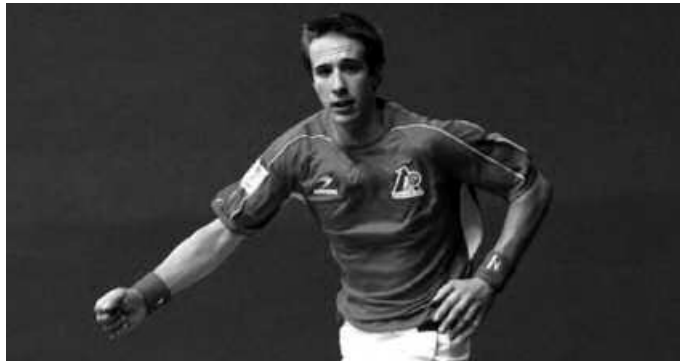
Afizionatuetan jarraitzeko aukera ez du baztertu oraindik.

Beno, azken urte hauetan jende gehienak nire adinarekin