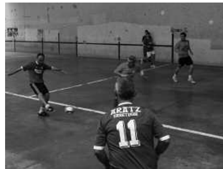
Usurbil FTko "gazteak", frontoian jokatzen.

Eguna berriz, afari baten bueltan amaitu zuten