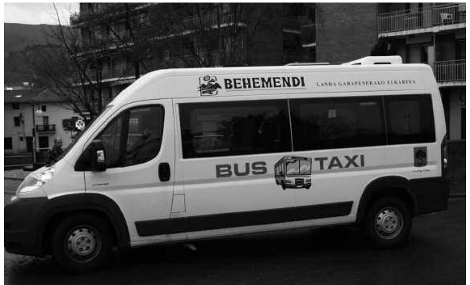
Uztailean soilik goizean ibiliko da bus taxia. Abuztuan ez da zerbitzurik izango.

■ Uztaila: bus-taxi zerbitzua goizez bakarrik (uztailaren 2an, 25ean eta 31n jai).