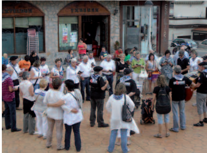
Larunbatean, kantu jiraren bisita jasoko du NOAUA! terrazak.

O stiral arratsalde honetan, 19:00etan irekiko da NOAUA!ko terraza. Igande gauerdia arte, Zubiaurreneko gunera etortzera gonbidatuak zaudete. Ekitaldi ibiltariak antolatu dituzuenok ere, animatu eta egin geldialdixoa hiru egunez, jaietarako kultur elkarteak aire librean egokitu duen gunean. Goizetan, indarrak hartzeko gosari ederrak izango dituzue aukeran. Eta 10 euroren truke, etxean mimo handiz eginiko menu berezi eta goxo askoak dastatu ahal izango dituzue eguerdi eta iluntzeetan. Horrekin guztiarekin batera, ez da mota guztietako edaririk faltako.