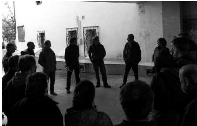
Ostegun honetarako deitu da bilera, arratsaldeko 18:15ean Potxoenean. Maiatzaren 15ean egin zen antzeko bilera, argazkian ikus daitekeen bezala.