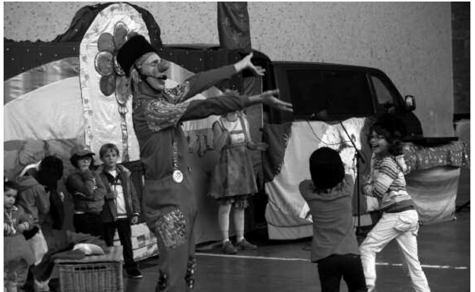
Ekainaren 20an aritu ziren frontoian.

Haur eta gazteen eguna Santixabel bezperakoa izango da, uztailearen lehenean. Ekitaldi bete egun izango da eta, tartean, pailazo ikuskizuna ere iragarria dago. Korri, Xalto eta Brinko pailazoen "Artista bat naiz ni" izeneko saioa eskainiko dute frontoian. Arratsaldeko 16:00etan hasiko da pailazoen emankizuna.