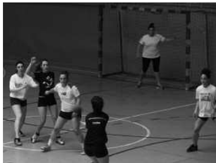
Eskubaloiko partidak Oiardon jokatu ziren.

Usurbil FT-koek Kaxkoan ospaturiko jokoe-