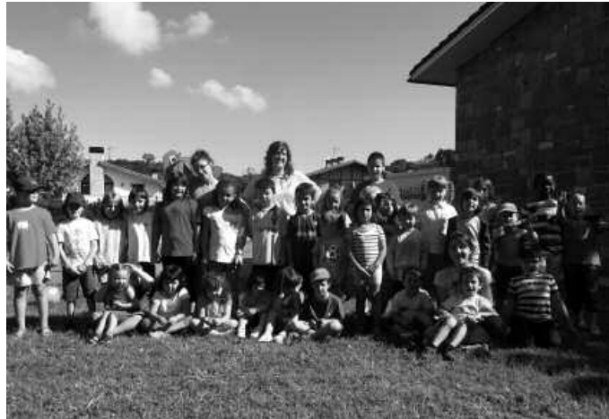
Zubietako Txokoak uztailean hasi eta abuztuan amaituko dira.

Aginagan jada martxan dira, Antxomolantxa Elkarteko prestaturikoak, ostiralera arte. Eta uztailaren 1etik 30era, San Praixku Guraso Elkarteko antolatutakoak burutuko dira. Ikasturte berria hasteko bezperatan, irailaren 2tik 6ra ere txokoak antolatu ditu berriz Antxomolantxa Elkartek Aginagan.