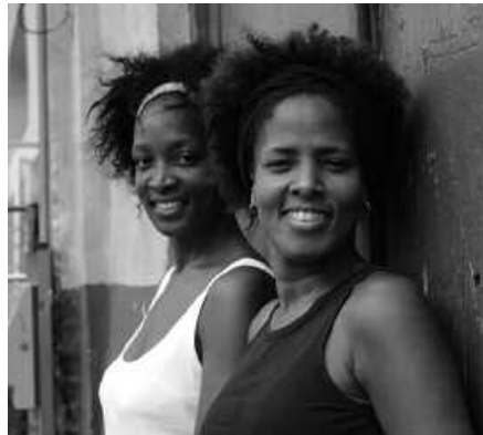
Azken trakaren ondoren joko dute, txosnetan.

Ibilbide luzea joratu dute bi ahizpek. "Konposizioan, pianoan eta ahots-armonian jasotako formazio klasiko batekin, hainbat urtez ibi-