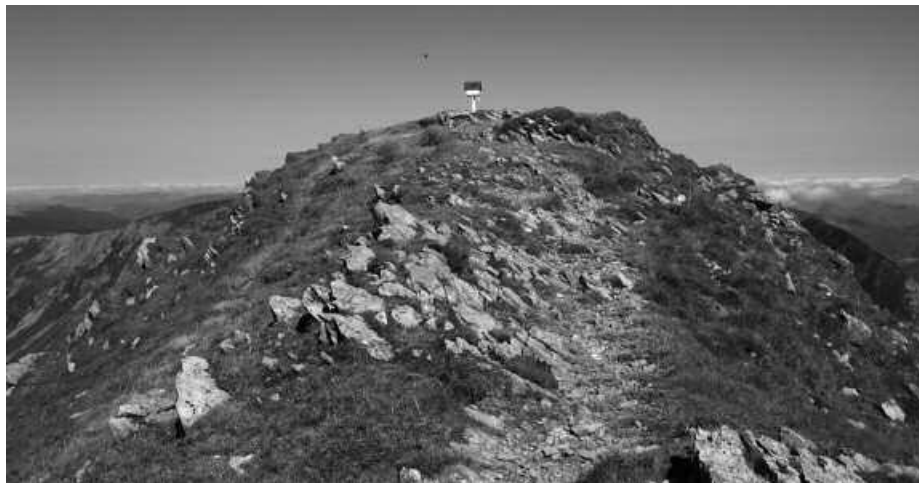
Argazkian, Lakartxelako tontorra.

Zuberoako Pirinioak ezagutzeko aukera eskaini nahi dute aurten, Andatza Mendizaleen Kirol Taldekoek. Asteburu pasa antolatu dute horregatik, uztailearen 13 eta 14rako. Bi ibilbide osatzeko gonbita luzatzen dute; batetik Logibar-Santa Grazi artekoa, 24 kilometrokoa, 7 ordutan egiteko modukoa. "Holtzarteko zubia, Txar-dekogaina (1881 m) eta Kakoetako arroiak ezagutuko ditugu. Ostatua Ligin izango dugu", berri eman dute. Bigarrenik, Santa Grazi-Isaba artekoa. "23 kilometro, 7 orduko ibilbidea. Ehujarreko arroi letatik, Lakora (1887 m), Binbalet eta Lakartxela, eta Mintxateko arroi letara bideratuko gara", iragarri dute Andatzakoek.