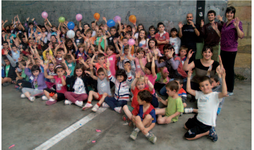
145 lagun elkartu dira aurten Udajolasen. Ez ziren denak argazkian kabitzen...

U meen algarak, gurasoen joan etorria, begiraleen zaintza lana... Herriko festak bukatu eta berehala hasi da aurten ere, udako errutina. Urtero asteotan errepikatzen den egunerokoa. Udajolasek inoizko parte hartzaile kopuru altuena izan du aurten. 4-12 urte arteko 145 haur eta gaztetxo murgildu baitira udako aisialdi eskaintza honetan. Uztailaren 30era arte, goizero astelehenetik ostiralera, zeregin eta erronka bakarria izango dute; lagun artean, begiraleek prestaturiko ekintzetan parte hartu eta ondo pasatzea.