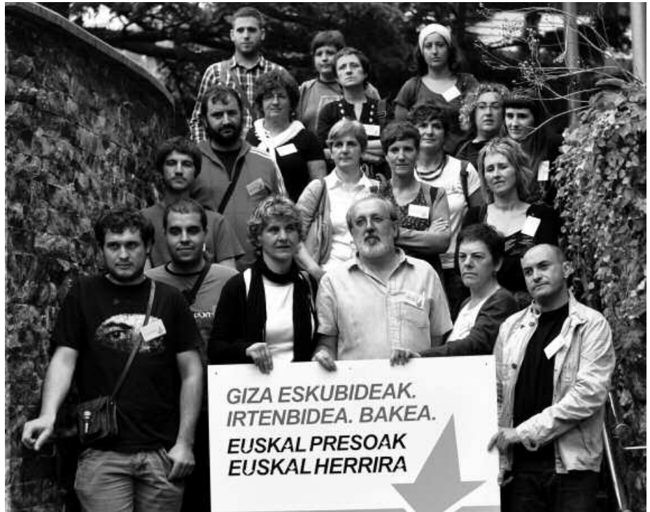
Buruntzaldeko udal ordezkariak agerraldia egin berri dute.

Euren esanetan, gatazka politikoaren ondorioei aurre egiteko ordua heldua da. Eta konponbide horretan, beste zenbait arloetan urratsak eman diren artean, aurrerapausorik eman ez den arlo bakarra, presoek eskubideena dela gogorarazten dute. "Jarrera inmobilistenak hortzen ari gara ikusten", salatu dute EH Bildutik.