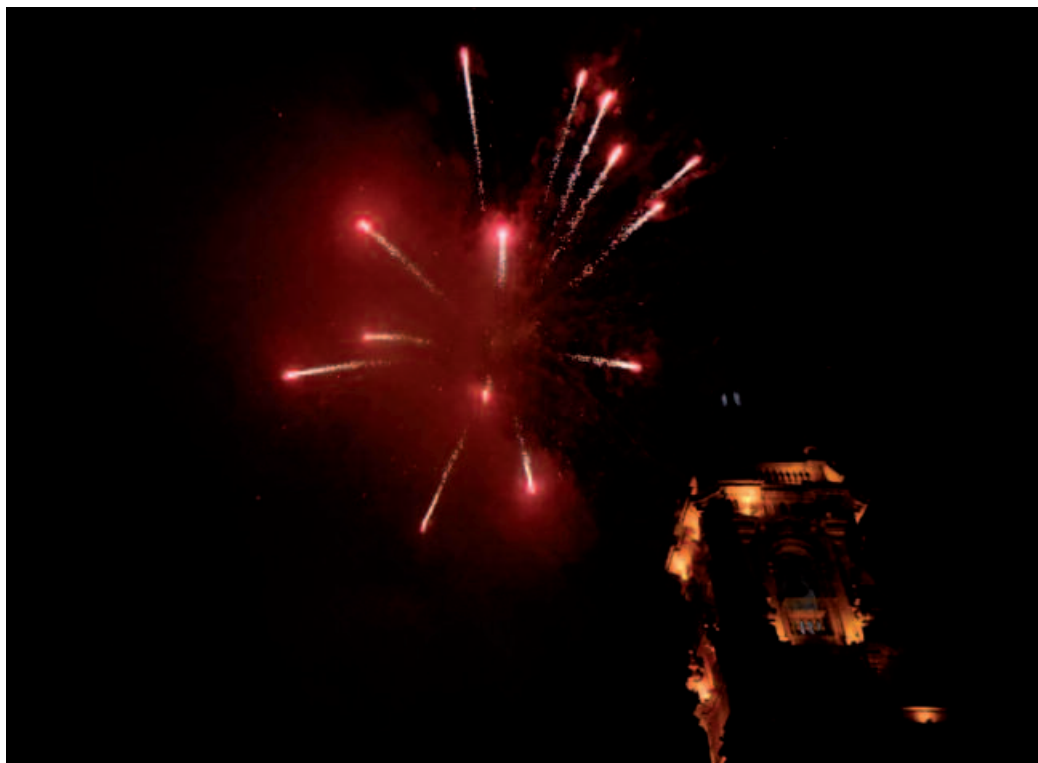
Argazki eta bideo gehiago topatuko dituzue noaua.com web orriko Argazkitegian eta NOAUA! TB atalean.