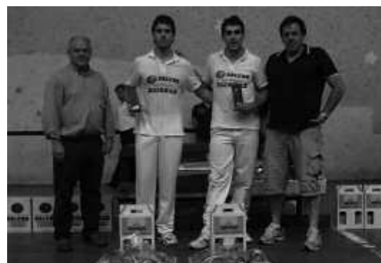
Santxo-Urruzola finalera iritsi ziren baina azken garaipena Bergara aldera joan zen.