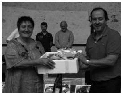
Mila Iribarrek irabazi zuen Bruñoren mariskada.