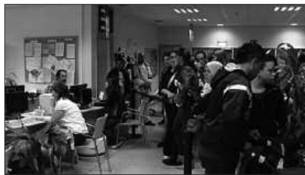
Behera egin du langabeziak maiatzetik ekainera.

Usurbilen bakarrik ez, langabeziaren beherakada Buruntzaldea osoan (ia 400 lagun gutxiago ekainean) eta Gipuzkoan ere nabarmendu da joan den hilabetean. Herrialde mailan, mila hirurehun lagunean murriztu da langabetuen kolektiboa. Hona hemen orain arte aipaturikoa, maiatzetik ekainera egon den aldaketa, zenbakietan.