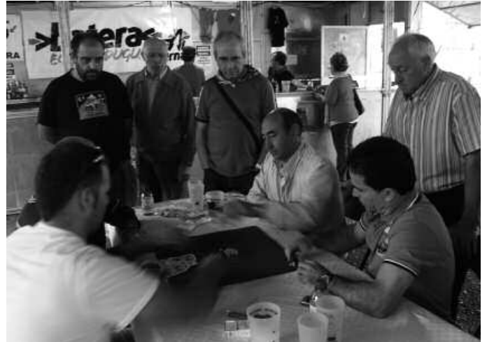
Ebaluazio orria uztailaren 12rako betetzea eskatu zaie jaietako eragileei. Bilera uztailaren 17an izango da, Potxoenean 18:00etan.

ko gonbita luzatzearekin batera, ebaluazio orri bat bidali zaie. Ebaluazio orri hau ostiral honetarako, uztailaren 12rako betetzea eskatzen zaie Santixabelen antolakuntzan parte hartu dutenei. “Garrantzitsua iruditzen zaigu jaien balorazioa egitea ondo egindakoak mantendu eta hobetu beharrekoak bideratzeko. Hori dela eta, esker-tuko genizuke gutun honekin batera bidali dugun ebaluazio-orria betetzea”, eskatu diete Jai Batzordetik aipatu eragileei.