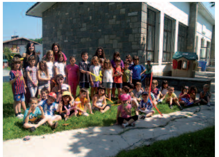
Zubietako txokoetan diren gazteak eta begiraleak, Eskola Txikiaren aurrean.