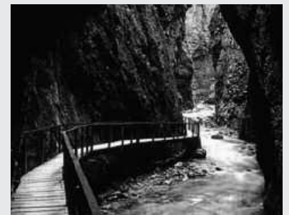
Kakuetako arroila. Andatzakoek ostegun honetarako bilera deitu dute Sutegin.

Andatzaren web orritik iragarri dutenez, aldaketak izango dira asteburu honetarako, uztailearen 13 eta 14rako Pirinioetara antolatu duten asteburu pasan. "Ibilbideak aldaketa batzuk izango ditu", ohararazi dute. Aldaketon berri, bi eguneko txangoari buruzko gainerako argibideekin batera, ostegun honetarako, uztailearen 11rako, 19:00etan Sutegin deituriko bileran eman goko dute.