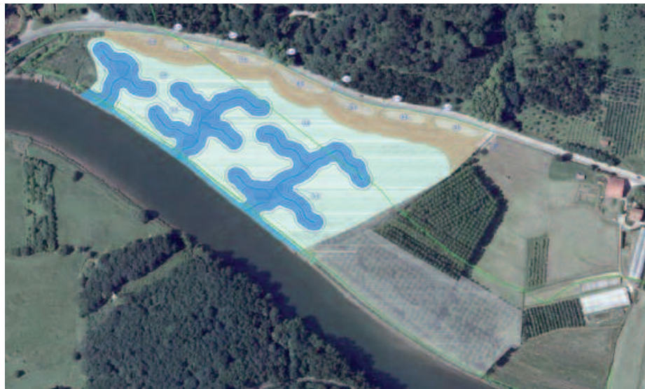
Foru Aldundiak eta Usurbilgo Udalak elkarlanean gauzatu asmo duten egitasmoaren berri emateko, bilera irekia deitu dute ostegun honetarako. 18:00etan Potxoenean.

Saria mendebaldeko inguru hau, Europa mailan Kontserbazio Bereziko Eremua izendatua dago, "Oriako itsasadarra Usurbil, Aia eta Oriok partekatzen dugun altxor ekologiko bat da. Berriki, duen balioa aitortu eta Natura 2000 sarearen barruan, Europa mailan Kontserbazio Bereziko Eremua izendatu da. Horretaz gain, Usurbilgo Udaleko araudiak ere babes berezia aitortzen dio eremu honi, eta Euskal Auto-