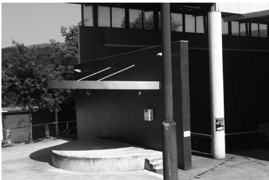
Eliza zaharrari begira dagoen eskenatoki txikia bota eta jolas parkea ipiniko da bertan.

Egitasmo honen berri emateko udal ordezkari bat aginagarrekin bildu zen iragan astean bigarren, ludotekan deitu zuten herri batzarrean. Momentuz, hauek dira Aginagako erdigunean egin asmo dituzten eraberritze lanak. Etorkizunari begira ordea, bada erronka potoloago bat Aginagako kaxkorako; orain berrituko duten eremu osoa, oinezkoena izatea hirigintza arauetan jasoa dagoen bezala. Araudi honen arabera, ibilgailuen joan etorria frontoi atzealdetik bideratuko litzateke. Eta honenbestez, Arrate zahar egoitza aurrealde osoa oinezkoena izango litzateke. Halere, aipatu moduan, aurreragoko kontuak dira hauek. Momentuz, egingo dituzten lan hauekin, ibilgailuen mugimendua mugatu eta oinezkoei lehenetasuna emango zaie.