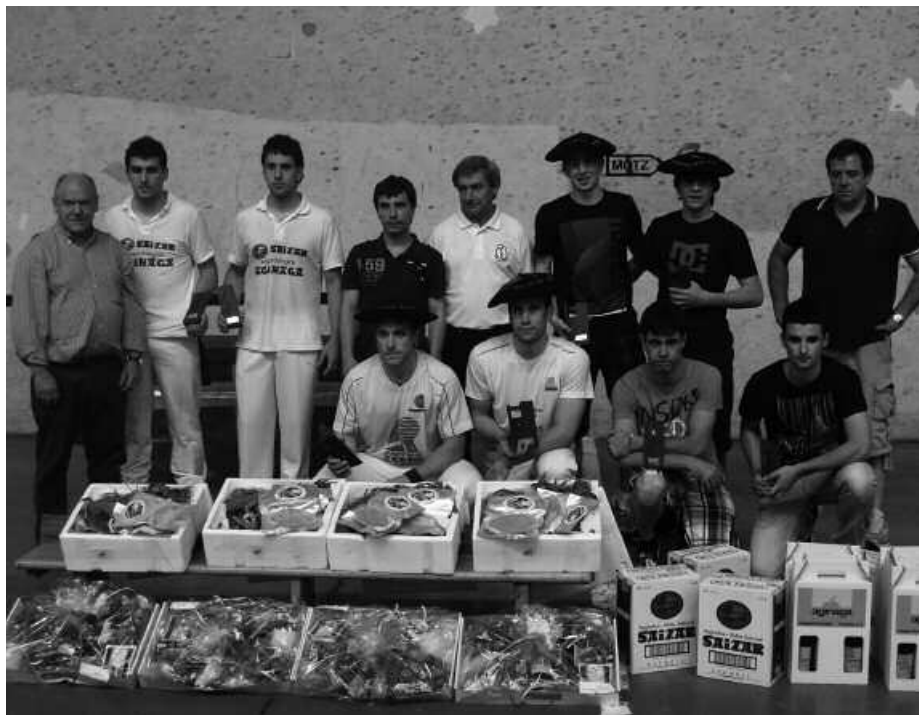
Argazkian, bi finaletan parte hartu zuten pilotariak, antolatzaileak eta udal ordezkariak.