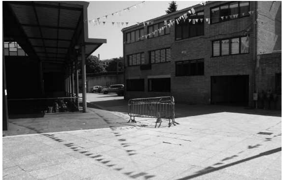
Lanek iraun artean, frontoi inguruko eremua itxita egongo da.

Lanegileak pasabidea hesiekin mozten, eta lanek iraun artean frontoi inguruko pasabidea itxita egongo zela iragartzen zuten oharrak jarrita, Arrate zahar egoitzako edota eliza zaharreko atarietan. Ezohiko itxura honekin esnatu zen Aginagako Kaxkoa, aste hasieran. Eguna ailegatua baitzen. Astelehenean, uztailearen 8an hasi zituzten Altuna y Uria enpresakoek, Aginagako erdigunea berritzeko lanak. Atzetik datorren proiektua da, egungo gobernu taldeak esku artean hartu eta gauzatzera doan eraberritze egitasmo hau. Bere garaian, Aristitxo pilotalekua eraiki eta gutxira sortu ziren kalteak konpontzea da helburua. Baina aldaketa eta berritze lanok, gehiagorako emango dute. Aginagako erdigunean, frontoi inguruko pasabidean oinezkoek izango dute lehenetasuna aurrerantzean. Autoek berriz, ibilbide mugatua izango dute bertan.