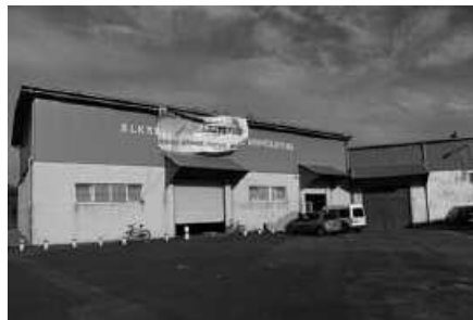
Gaztetxean afari beganoa antolatu dute ostegun honetarako.

Afaria iragartzeko eta, partehartzera animatzeko xedez, ohar hau helarazi digute gaztetxetik: "Datorren ostegunean, uztaileak 11, afari beganoa egingo da gaztetxean 20:30etatik aurrera borondatearen truke. Animalietatik eratorritako ezer gabe eginiko afari goxoxoa dastatzeko aukera paregabea gaztetxe-