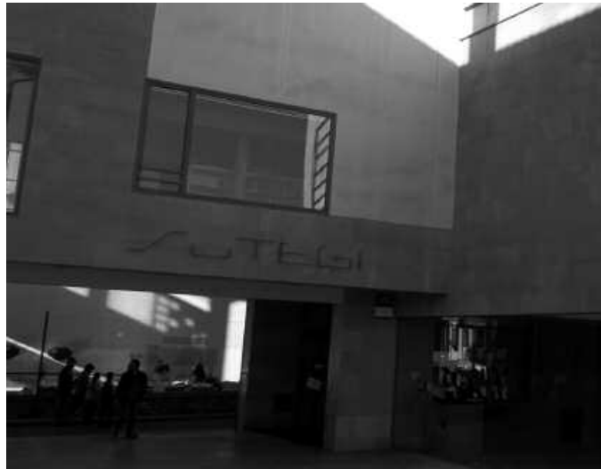
Sutegiko liburutegia goizez bakarrik izango da zabalik uztaila-abuztuan.

-Asteleheneretik ostiralera, 7:00-13:00 (igerilekua eta Kiroldegia) eta 17:00-20:30 (igerile-