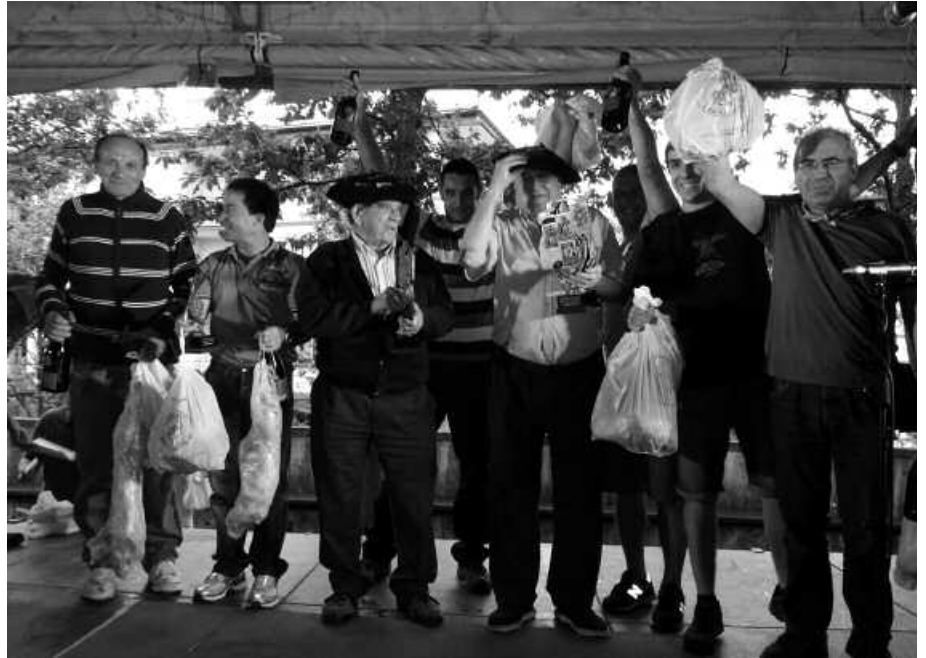
Lehia bizia eta luzea izan zen, Santixabeletako mus txapelketakoa.