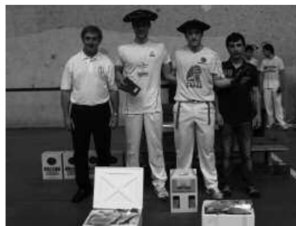
Muguruza-Bolinaga Bergarako bikotea gailendu zen nagusien finalean.