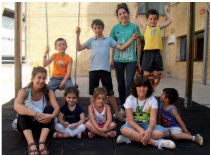
Aginagako txokoetan diren begiraleak eta gaztetxoak.

Peñaloscintos (Errioxa) aldean, Cameros mendizerra inguruetan dira Ziortzako kanpaldira joandako lehen txandakoak, DBH-ko ikasleak. Uztailaren 17ra arte egongo dira bertan. Haiek itzultzen diren egun berean, abiatuko dira Usurbildik Errioxa aldera LH 5 eta 6 mailetakoak. Hilaren 25era arte egongo dira Peñaloscintosen.