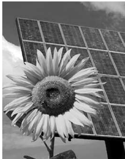
Plan honen bidez, udal sailean, bizitegieta eta zerbitzuetan eragin nahi da.