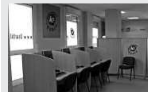
Goizez irekita izango da irailean.