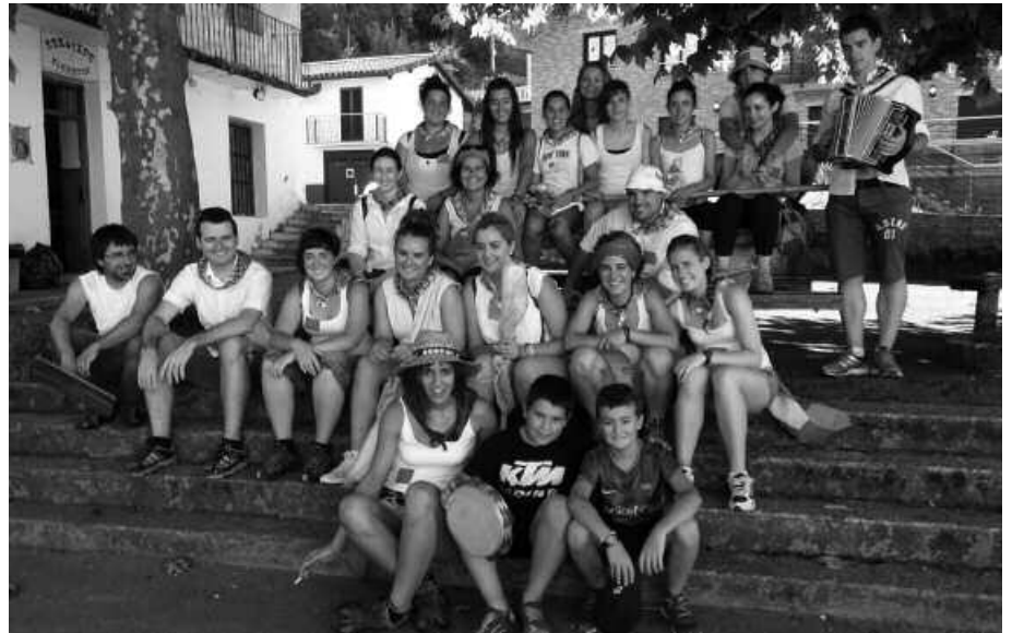
Urdaigako festetako oilasko biltzaileak, Txokoalden atsedean hartzen.

B izirik jarraitzen dute garai bateko ohiturek, irudiko koadrila ikusi besterik ez dago. Duela hilabete ospaturiko Urdaigako festetan, oilasko biltzera ateratako taldea duzue. Ohi bezala, abuztuaren 1ean egunak argitu aurretik ekin zioten, auzoa, Txokoalde eta Aginaga lotu zituen ibilbideari. Etkez etxeko errondan, hainbat geraleku egin zituzten. Auzotarren aurrean trikiritxa doinuek alaiturik dantza gogotik egin zuten. Ibilbidea, eguerdi partean amaitu zuten Santueneko Aialde Berri sagardotegikoek prestatu zuten bazkariaren bueltan.