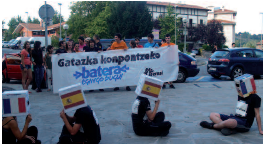
Aurreko astean parodia modukoa egin zuten Ernaiko gazteek. Ordukua da argazkia.

Hauek, uda partean Usurbilgo Ernaik antolatu dituen jendaurreko ekimenak. Hitzorduok deitzaiekin batera, harreman bira bat abiatu zuten abuztuan herriko gazte koadrila des-