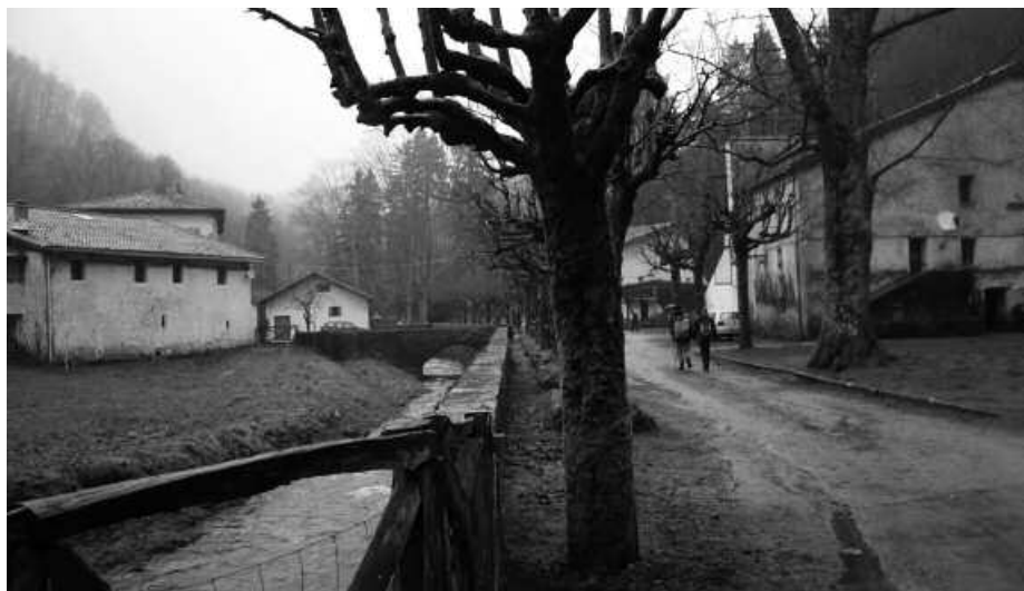
Irteera honetan, plazak mugatuak izango dira eta lehentasuna Andatzako bazkideek izango dute.

Irailaren 15ean Artikutzara goiz pasa joateko gonbita luzatzen diete herritarrei, Andatza Mendizaleen Kirol Taldetik. Txangoan izen emateko epea zabaldu dute jada. Irailaren 11 baino lehen egin behar da ordainketa, aipatu kirol bilguneak Kutxabanken duen kontu korronte zenbaki honetan: 2095 5069 07 1068489805. Andatzako bazkideek, langabetuek eta ikasleek 10 euro, gainetarakoek 12 euro ordaindu beharko dituzte.