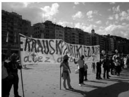
Giza katea 11:30ean egingo da.

Igande honetan, Kontxako estropadaren bigarren jardunaldian, olatu bat osatzera deitu du Herrira mugimenduak. "Eguerdiko 13:30etan, giza eskubideen urraketa eta sufrimenduaren enbata atzean utzi eta konponbideari eta bakeari ateak irekiko dizkion marea urdina osatzeko dugu Donostiako Bulebarrean. Guztiok batera, ilartan eserita, zapi urdinak eskuetan hartu eta arraun eginez, 197/2006 doktrina hondoratuko duen olatua osatzeko dugu", hala jaso dago usurbilginez.com web orrian.