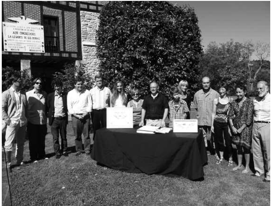
Donostiako agintariek, Zubietako Herri Batzarreko ordezkariak eta Aizpurua baserrikoek prentsaurrekoa eskaini zuten asteartean Zubietan. Bertan iragarri zituzten larunbateko ekitaldiak.

Garai hartan Donostia berreraikitzea erabaki zutenak omenduko dira, eurek erakutsitako sendotasuna eta ausardia eskertuko dituzte, irailaren 7ko ekitaldiko antolatzaileek asteartean eskaini zuten prentsaurrekoan adierazi zuten bezala. Haietako askoren senideak espero dira Aizpurua baserrian larunbat honetan; 300 lagunetik gora Donostiako alkatearen esanetan. 200. urtemugako akta berria ere sinatuko dute omenaldi ekitaldian. Mugarria izatea nahi dute larunbateko omenaldia, "hiria elkarlanean eraikitzen jarraitzeko". Herritarrei bertaratzeko gonbita luzatzen diete.