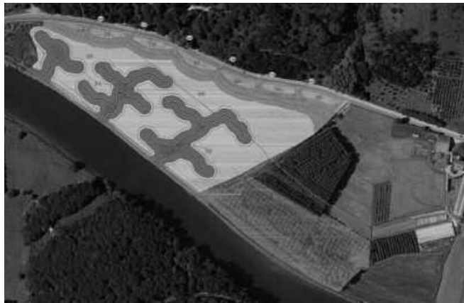
Sariako egitasmoa uztailean aurkeztu zen, Potxoenean.

Hauetz gain, NOAUko azken alean diote proiektu honek landa lurren egoera txarrari irtenbidea emango liokeela. Gazitasunaren erruz landa lurrek ez dutela emaitza onik eman,