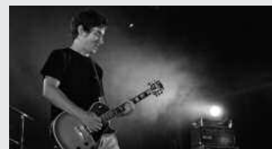
Irailaren 20an izango dira Santuenean.

Atxegaldeko festak pasata, jaien lekukoa Santueneak hartuko du irailaren 20ko asteburuan. Bertako Jai Batzordeak prest du egitaraua. Nabarmentzekoen artean, EH Sukarra taldekoen kontzertua iragarri dutela, jaietako lehen gauerako.