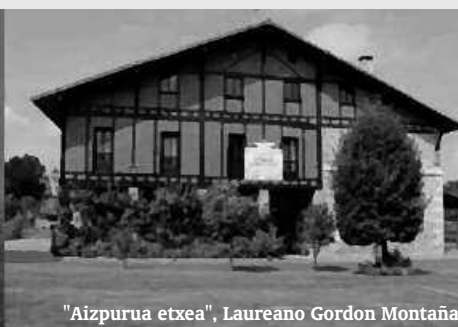
"Aizpurua etxea", Laureano Gordon Montaña