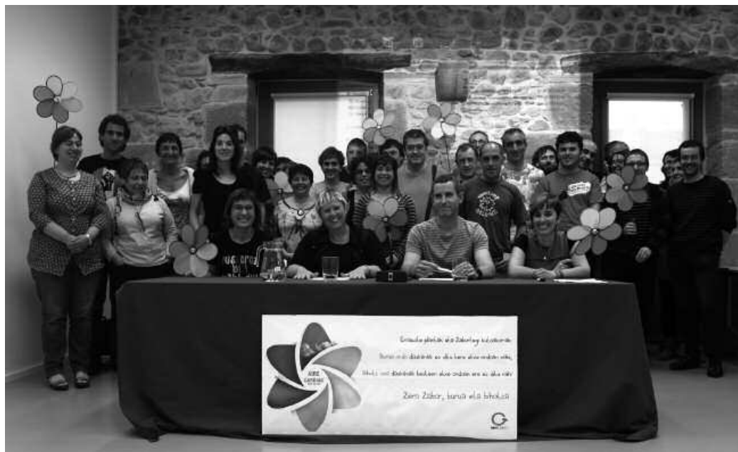
Konpromiso etikoa betetzeko, zenbait neurri hartzeko eskatu diote Udalari.

Udalerri honetako hiri hondakinak gaika bildu arren, "Zero Zabor norabidean badago zer hobetua" Usurbil Zero Zabor (UZZ) taldearen esanetan, "guk sortutako hondakinaren hainbat tona, beste herrietan dauden zabortegietara bidaltzen baititugu oraindik ere" eta honenbestez, "beste herritar batzuk pairatzen dituzte guk sortutako zabor zati baten ondorioak".