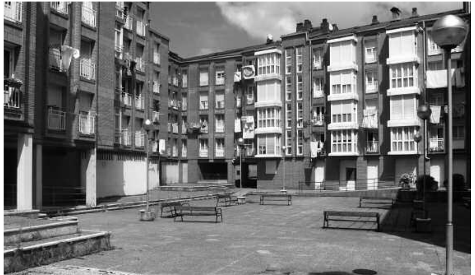
Uztaileko plenoan hartu zen plazaren zoladura berritzeko erabakia.

Gobernu taldeak udalbatzara eramandako proposamen honek, jada onartuak dauden 2013ko udal aurrekontuetan ere eragirik izan du. 11. kreditu aldaketa proposatzea ekarri baitu. Aldaketa hau behin betikoz onartu zen uztailaren 23ko osoko ohiko bilkuran. Puntu honi zegokion bozketan, emaitza bera errepikatu zen.