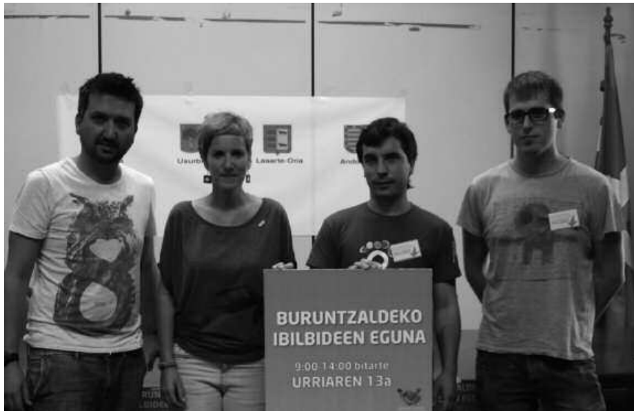
Eskualdeko udal ordezkariak, iganderako antolatatu duten kartela eskuarteetan dutela.

B uruntzaldeko Ibilbideak izeneko proiektuari esker, eskualdeko eta bere landa-ingurune naturala ezagutzeko aukera dugu. "Bidezidor eta bide ezberdinak ditugu (bost ibilbide ezberdin daude aukeran), landako paisaiatik barrena paseoz gozatzeko, belardiak eta basoak zeharkatuz eta baserri, baseliza, karobi eta, natura nahiz kultura aldetik, interesgarriak diren beste leku batzuetara hurbilduz", ekimen antolatzaileek aditzera eman dutenez.