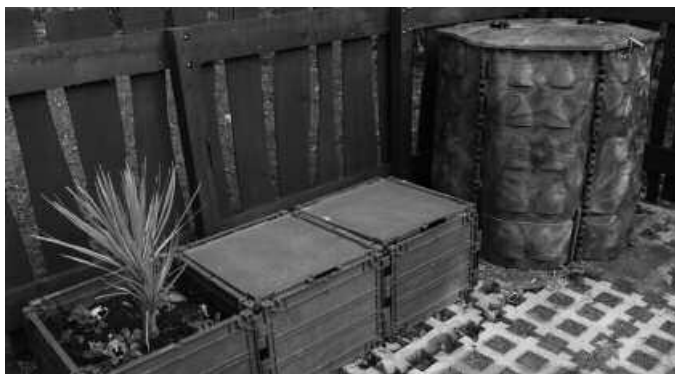
Udaletxean eta Olarriondoko udal baratzaren jarriko dira konpostaguneak.

Bat udaletxean kokatuko da, bestea Olarriondoko udal baratzaren alboan, eta biak hila-bete barru martxan egongo direla aurreikusten da. Udaletxe ondoko gunean organikoa konpostatzeko aukera izango dute, Irazu, Etxebes-te, Nagusia eta Irutasun kaleetako eta Gaztañaga azpiko etxebizitzetako bizilagunek. Eurei zuzenduta, formazio eta informazioa jasotzeko saioak antolatu dituzte datorren astean. Gogoan izan organikoa konpostatzen dutenei %40ko hobaria aplikatzen zaiela. Informazio gehi-ago jasotzeko: 650 374 936 / usurbilzerozabor@gmail.com Bilera hauek deitu dira: