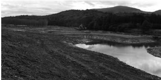
Udazkeneko euriteak hasi baino lehen bukatu nahi dute.

Saria lehengoratzeko lanak abian dira udaz gerotzik. Aldundiak bi hilabeteko epean amaitu asmo ditu, Udalak, usurbil.net ataritik adierazi duenez. Azken asteotan eman diren aurre-pausoen berri eman dute; "udako eguraldi lehorra ongi aprobetxatzen ari da Saria ingurua berreskuratzeko lanean ari den enpresa, eta Foru Aldundiaren gidaritzapean gauzatzen ari den obra martxa onean doa. Lehenengo lana, zeuden makalak kentzea izan da. Gero, makinak sartu dira lurraren maila jaisteko, ura sartu ahal izateko, eta padura ekosistema berreskuratzeko. Gunearen itxura goitiki behera aldatu egin da, lezkadia ere kendu baitute makinek. Hala ere, lanak amaitzen direnean, lezkadia itzuliko da. Kendutako lurra aprobetxatzen ari dira errepidetikeremua babestuko duen lur meta bat osat-