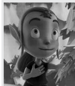
'Herensugeak' ikusten izan ziren.

Gu baino gazteagoak diren ikasleentzat egokiagoa zela iruditzen zaigu. Eta egia esateko, nahiago genuke Zipi eta Zape bezalako pelikula bat ikusi. Ea datorren urtean zorte handiagoa dugun!