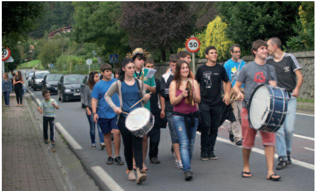
Larunbatean, estropadak amaitu berrieta hasi zen Zumartxan txarangako kalejira.

Urriaren 11 honetan izango da. Ostiralean, herri ikastetxe-ko haur eta gaztetxoek ez dute klaserik izango. Eguna jolasean pasako dute eta. Iluntzerako hiru hitzordu; Dj Kankar afalurretik, bertso-afaria gero Eliza zaharrean, eta Itzartu taldekoekin, erromeria goizaldera arte.