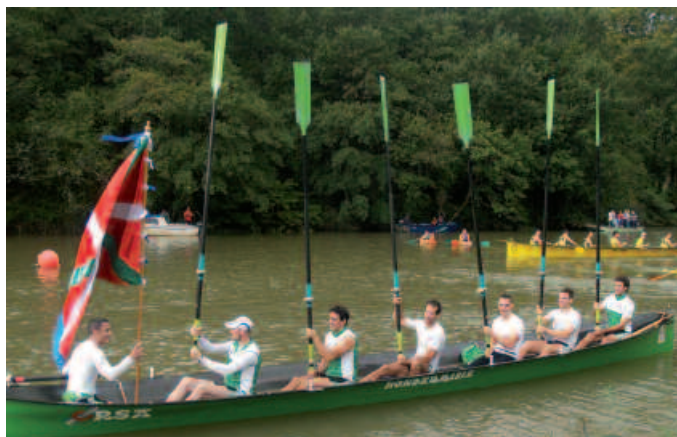
Lehen aldiz, Hondarribiak irabazi du Aginagako Bandera.

Eta bandera Hondarribia alde- ra bezala, Iparraldera itzuli dira asteburu pasa Aginagara