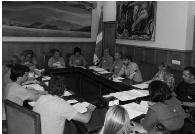
Talde guztietako ordezkariak izan ziren ez ohiko bi plenoetan.