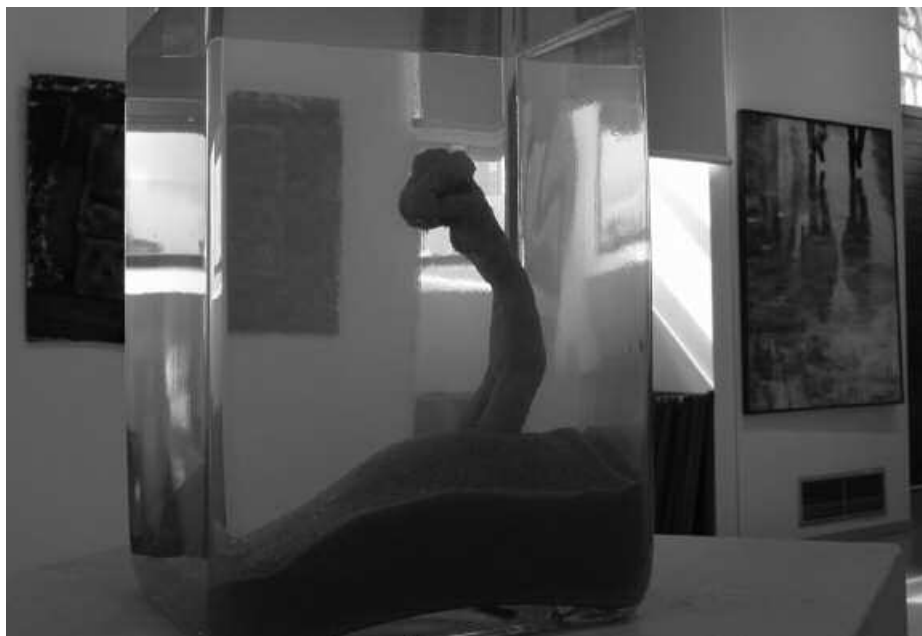
Txo! Kolektiboak hainbat erakusketa egin ditu. Irudi hau Zumaian eginiko batena da.