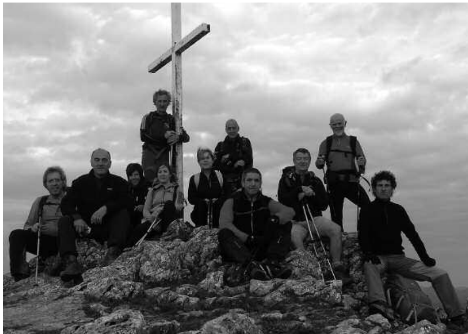
Erlo mendian ageri dira.

Usurbil-Xoxote-Deba ibilbidea osatu dute Andatza taldeko lagun batzuk. Argazkian, Erloko gailurrean ageri dira. 1.036 metroko garaiera du Erlok. Izarraitz mendigunean nabarmentzen den tontorra da, Xoxotere-