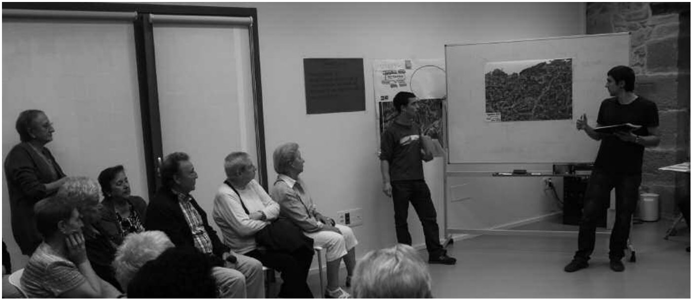
Jende asko batu zen Potxoenean egin zen bileran.

G eltoki aldaketak, autobus zerbitzu desberdinen arteko koordinazioa, zerbitzu bakoitzari buruzko informazioa modu argiagoan jartzea... Herritarrek hauek eta beste hainbat eskaera egin zituzten pasa den astean, Usurbilen dugun autobus zerbitzua hobetzeko Potxoenean antolatu zen saioan. Uste baino jendetsuagoa suertatu zen hitzordua. Foru Aldundia, Aztiker eta Usurbilgo Udalarekin batera, herriz herri halako saioak antolatzen ari da. Inguaruotan ditugun bus zerbitzuak hobetu nahi dituzte, eta horretarako, erabiltzaileen edota oro har, herritarren ekarpenak, proposamenak biltzen ari dira.