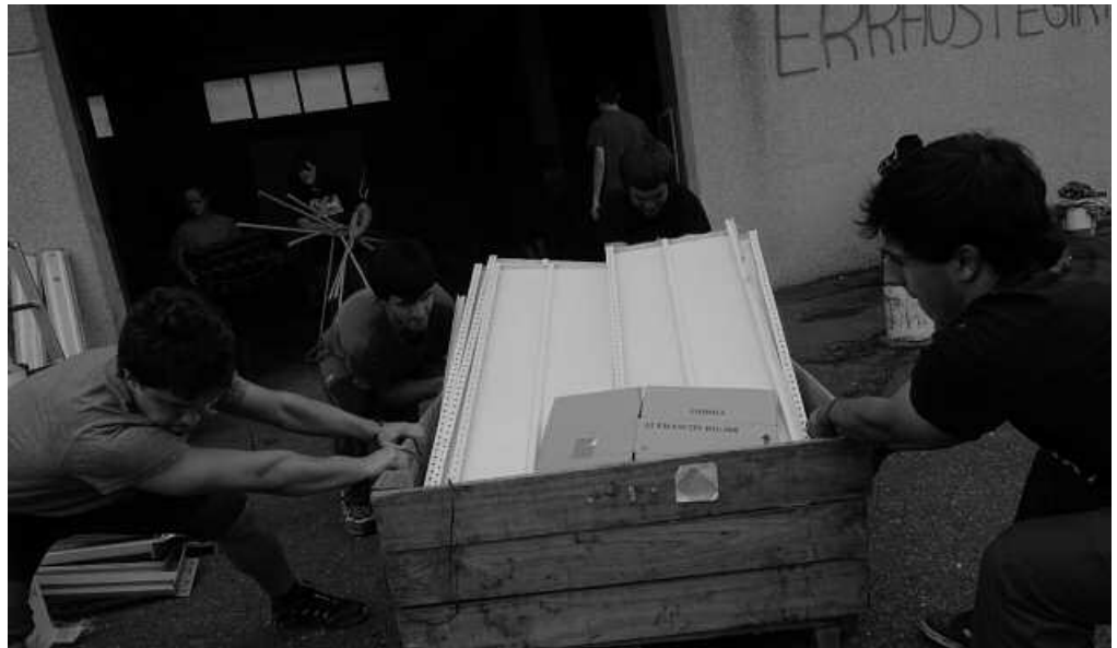
Iazko abuztuan hasi zen dena.

Urtea egin arren hainbat ekimen egin izan dira gaurdaino bertan. Alor desberdinak landu dira eta jende mota ezberdina hurbildu izan da (heldu, gazte, ume, guraso...) Urteurreneko ospakizunetan ere, gusto eta kolore guztientzako aukera egon da. Mural pintaketarekin hasi zen, guztion eskuek koloreztatu zuten horma