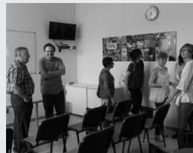
Irailaren 27an egin zen DYAren egoitza berriaren inaugurazioa.

DYA Gipuzkoak antolatu du ekimena, urriaren 20rako. Goizeko 11:00etan hasita, rokdromoan, haurrentzako tailerrak, tonbola, rcp tailerrak, boluntarioentzako karpa, errekurtsioen erakusketa, erreskateko simulazioak, kaleko antzerkia... iragarri dituzte, arratsaldeko 18:30ak arte. Simulazioarekin emango zaio amaiera.