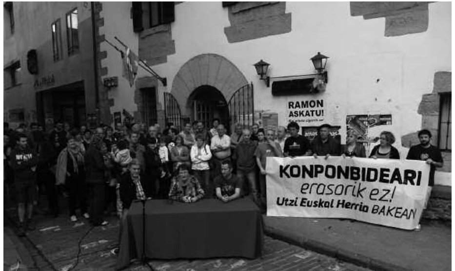
Libre Gunea ipiniko da azaroaren 1ean, Aitzagak antolatu duen Artisautza Azokan.