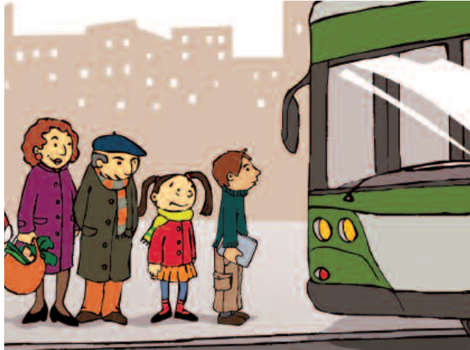
Hizkuntzarekiko eta erabilerarekiko jakinmina duenak eskualdeko udal euskara zerbitzuetara edota buruntzaldea.org webgunera jo dezake.

Gizarte bizitzan erdara belarrietara iristen da toki askotatik; beraz, haurra zenbat eta zaharragoa izan, orduan eta gehiago sozializatuko da, eta, ondorioz, orduan eta kontaktu handiagoa izango du erdararekin. Miraririk ezin eskatu eskolari, eta kalean hizkuntzarekiko sortzen diren desoreka horiek etxetik bertatik konpondu daitezke. Merezi du ahalegina egiteak. Etxean bertatik hasi behar da euskara ahoan erabiltzen. Nondik hasi bada? Familia asko izango dira Buruntzaldean ama hizkuntza euskara dutenak, eta beste hainbeste edo gehiago haurra euskaraz hezi nahi eta zailtasunak dituztenak. Zailtasun horiek izan daitezke, besteak beste, euska-