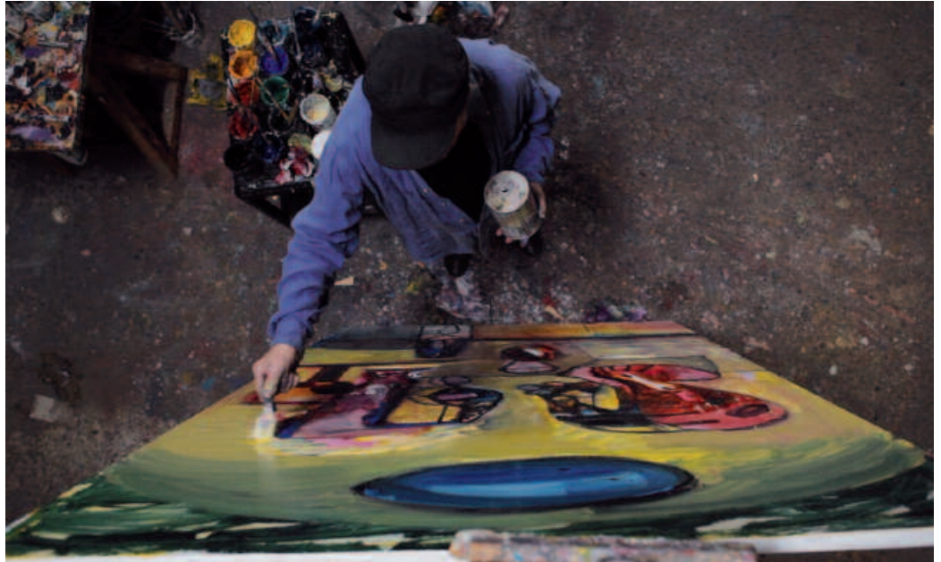
Azaroaren 15ean ostirala, Sutegin. Gonbidapen bidez eskura daiteke pelikula ikusteko sarrera.

J ose Luis Zumeta margolariak desorduetan lan egiten du bere tailerrean, Nafarroako Arribe herrian kokatuta dagoen antzinako autobus geltokian. Oraingo honetan, 200x133 tamaina izango duten bi margolanekin ari da lanean. Ondoren, Donostiako suhiltzaileen geltokia izandako eraikinean erakusgai egongo dira lanok. Bi margolan hauen sortze prozesua da dokumental honen bizkarrezurra. Donostiako Zinemaldian eman zuten lehen aldiz eta Kulturaldiari eta Usurbilgo Udalarari esker, Sutegin ikus ahal izango dugu pelikula hau. Azaroaren 15ean.