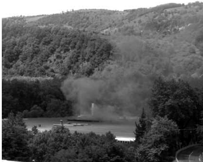
Urriaren 10ean bildu ziren Udala, Ucin eta Eusko Jaurlaritzaren.

Bestelako kontuak ordea, urte luzez herritarren hainbat kexu eragin dituen ke eta usain txarren inguruan. UCINek bere labetan hondakinak erretzeko eskatua zuen baimena eskuratzetik geroz eta gertuago egon liteke. "Bileran Jaurlaritzak berretsi zuen laister erantzungo duela UCIN-ek apirilean bere labean hondakinak erretzeko egindako eskaera, horretarako baimena emanaz, nahiz eta udalak kontrako eskaera egin. Egoera berri horren aurrean, Udalak