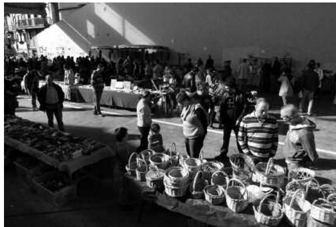
Azaroaren 1ean, goizeko 11:00etan irekiko dute azoka.

Beste behin, hildakoei gorazarre egiten zaien azaroaren lehen egunean, eskuz eginiko denetarik produktuak bilduko dira pilo-