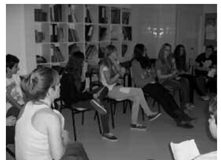
"3 astetan bi orduko saioak izan ditugu".

Gure denbora libreko gai ei buruzko ikastaro-