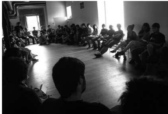
Gazte Asanblada sortu da eta Itaya ordezkatzeko du.

Uda partean buruturiko hausnarketa prozesuan hartutako erabakia izan da hau. Prozesu hartan, "mugimendu bakoitzaren lan ildoak zehaztu genituen eta ondorio eta erabaki garrantzitsu hauetara iritsi ginen: Usurbilgo gazte mugimenduak bi eragile izango ditu, batetik, Ernai gazte erakundeak (independentzia, sozialismoa eta feminismoa) eta bestetik, Gazte Asanblada". Euren