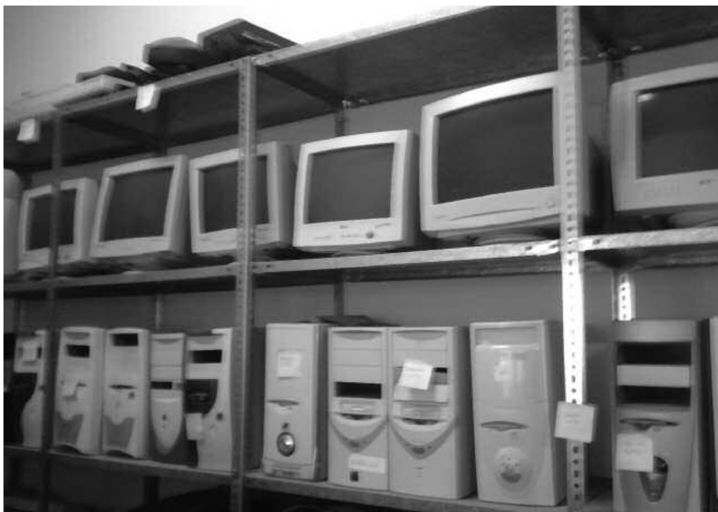
Linux sistema ipiniko diete ordenadore berrituei, "ekipo zaharretan oso ondo ibiltzen da".