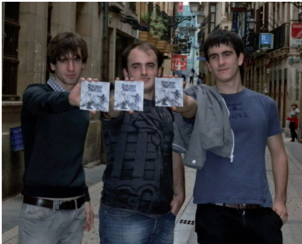
Aurreko astean aurkeztu zuten diskoa, Elkarrek Donostiako Alde Zaharrean duen dendan.

Musika estiloa bezain garrantzitsua da esaten dena. Eta nola esaten den. Hitz zainduekin osatu dituzte sei kantuak. Eta hiru dira hizpide hartu dituzten gaiak. Krisi giro honek bereziki gazte jendean du eragin handien, langabezia tasei begiratzea besterik ez dago. Eta