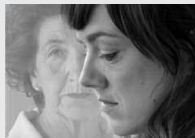
Azaroaren 10ean eskainiko dute "Amaren eskuak".