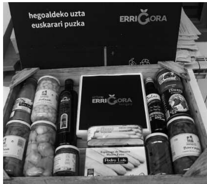
Azaroaren 14ra arte eskatu daitezke saskiak.

Horrela izena du abiatu berri duten kanpainaren leloak. Ondoko irudian duzuen produktu sorta jasotzen duten saskiak eskuragarri jarri dituzte. Horietako bat NOAUA!ko egoi-