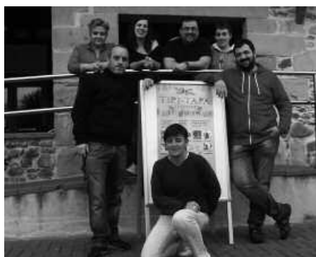
Zazpi edaritegik hartzen dute parte Tipi-Tapan.

Egin lekua sabelean igande eguerdiko pintxo festarako, hemen da berriz, IX. Tipi-Tapa. Azaroaren 3ko edizioan, gaztadun moka- du bereziek; lasaña, brotxetak, kroketak, pudina... Urteko ardo zuri, gorri edo beltz, txakolin, ur, sagardo, zurito edo muztioz lagundua 2 euro-tan. Edaririk gabe, pintxoa bakarrik, 1,5 euroren truke. Eta pintxo bereziok bost ez, joan den urriaz geroztik zazpi edaritegietan zerbitzatzen dituzte; urriaz geroztik Hurbilago Elkartean egitasmoarekin bat egin duten tabernak bi gehiago dira eta. Iazko bostak, Txapeldun, Artzabal, Txiriboga, Aitzaga eta Bordatxo. Eta bi berriak, Xarma eta Txirristra. Hurbilago Elkarteko establezimenduetan xahutzeko hurrengo erosketa balea hain