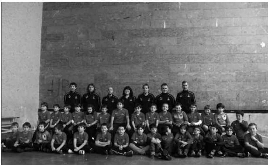
Futbol Eskolako kideak.