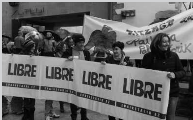
Aitzaga epaitzen ari dira "Herriko tabernak" delako auzian.

E paiketa politikorik ez, Aitzaga aurrera elkarretaratzea egin zuten igandean, Erle Egunaren baitan. Urriaren 17an "Herriko tabernak" izenez ezagutzera eman den 35/02 sumarioari loturiko epaiketa abiatu zen Espainiako Auzitegi Nazionalan. 110 herriko elkarte edo taberna epaituko dituzte, eta 40 lagun auziperatu dituzte. Tartean, Usurbilgo Aitzaga Elkarte. Libre mugimenduak deitu zuen igandeko elkarretaratzea.