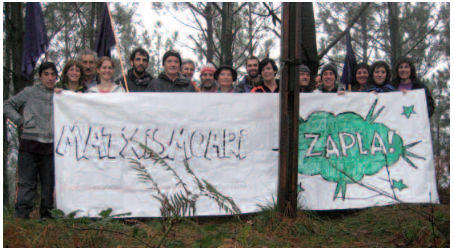
Parekidetasun Kontseiluak hainbat ekitaldi antolatu zituen asteburuan. Bordaxora igo ziren larunbatean eta bertan atera zuten ondoko argazkia.

Presaka bizi gara bai, baina egunerokotasuna hausnartzeko tartetxo bat hartu beharra daukagu, hainbat jarrera aldatu behar ditugu. Izan ere, hainbat eraso ez ditugu ikusten; naturalki eta isilpean jasaten ditugu. Bada garaia sistemari hortzak erakusteko eta esateko ez garela bere tranpan eroriko. Ez dugula emakumeon aurkako indarkeria gehiago onartuko! Emakume izateagatik ez ditugu gure gain hartuko zaintza eta etxeko lanak, ez gara bigarren mailako pertsonak, gure eskulanak beste edozeinena adina balio du, maitatzea ez da norbaiten objektu izatea, errespetatuak izan behar gara uneoro eta etxerako bidean ez dugu beldurrik izan behar ilun badago ere... Zuk ere hau guztia alda dezakezu, guztiok batera aldatuko dugu!”