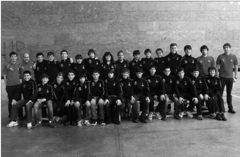
Kadete taldea ohorezko mailan ari da jokatzeko.