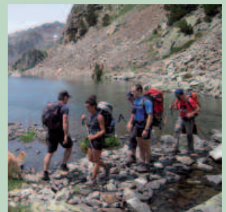
Aurten egin dituzten irteeretako irudiak eskainiko dituzte Sutegin ostiralean.

Antolatzailea: Andatza Mendizaleen Kirol Taldea.