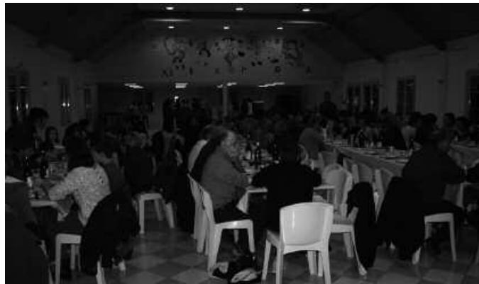
150 lagun batu ziren afari baten bueltan.

1997.urtean Zuberoako Sohütako Eperra ikastola eraikitze lanetan parte hartu zen egunetik, adiskidetasun bero bat mantentzen dute bi herrietako lagun talde batek. Hainbat urtez, bien arteko pilota partidak, kantu saioak, afari prestaketak, ikastolaren aldeko otar salmentak... hitz batean esanda elkartasuna adierazi. Honen trukean beraien mintzaira jaso, ohituraz jabetu, beste ikusmolde bat ikasi eta guztien gainetik, gugandik