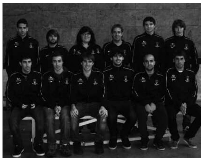
Preferente Erregional taldeko jokalar batzuk.