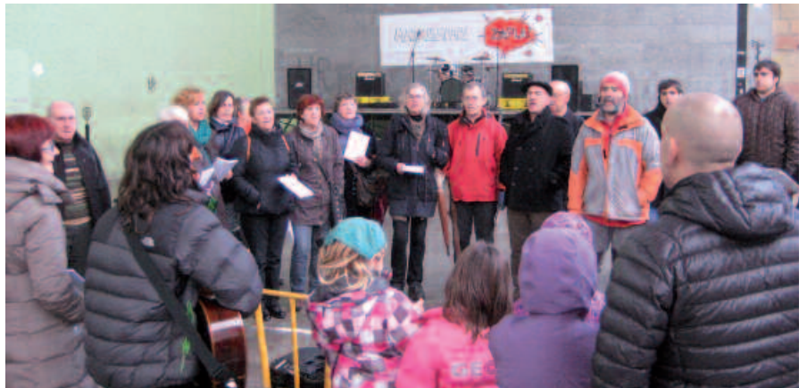
Larunbat eguerdian hainbat ekitaldi egin ziren frontoian. Argazkian, Kantu Taldekoak.