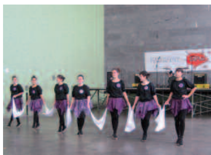
Dantza Taldekoek ere parte hartu zuten indarkeria sexistaren aurkako kanpainan.