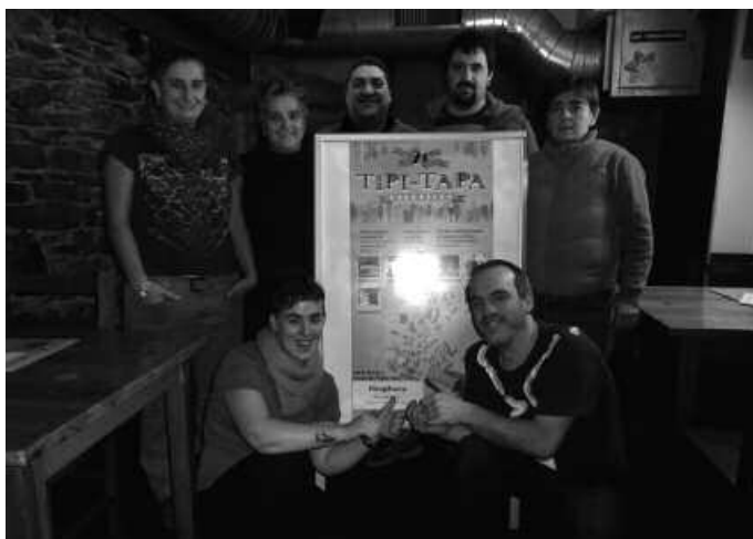
Edariarekin, 2 eurotan eskura daiteke Tipi-Tapako pintxo berezia.

Ohi bezala, pintxoak bereziak izango dira; oraingoan, hirugiharrarekin eginikoak. Edariarekin 2 eurotan, moka-