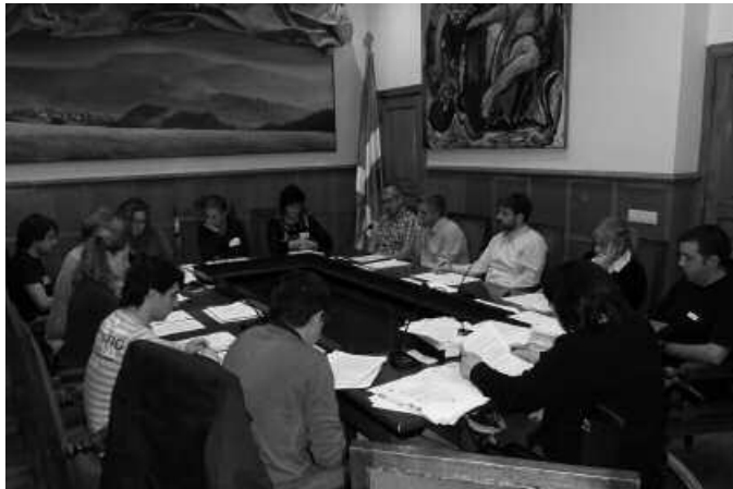
Aste honetako udalbatza plenoan eman dute aditzera Euskararen Egunari begira alderdi denek adostu duten adierazpena (argazkia artxibokoa da).

Lehenik eta behin, euskararen egunak ospatzeko egun bat izan behar duelakoan gaudete. Izan ere, euskara maite dugunok badugu zer ospatu 2013ko abenduaren 3an. Euskara bizirik da, baditu hiztunak, eta etorkizuneko atek zabalik ditu oraindik ere. Baldintzarik gogorrenetan ere, aurrera egin du euskarak, eta horrek etorkizunarekin baikor izateko arrazoiak ematen dizkigu.