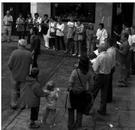
Euskararen Egunean ere kantuan aterako dira. Ondoren kantu-afaria egingo dute eta izena emateko epea irekita dago.

Abenduaren 3ko Euskararen Eguna, asteartez egokitu da aurten. Asteartetan entseatzeko bildu ohi dira Kantu Taldekoak Udarregi Ikastolako musika gelan. Datorren asteartean ordea kalera irten go dira, Euskaren Eguna ospatzera. Kantu-jira labur bat egitekoak dira herrian zehar, iluntzeko 19:00etan Mikel Laboa plazatik abiatuta. Eta