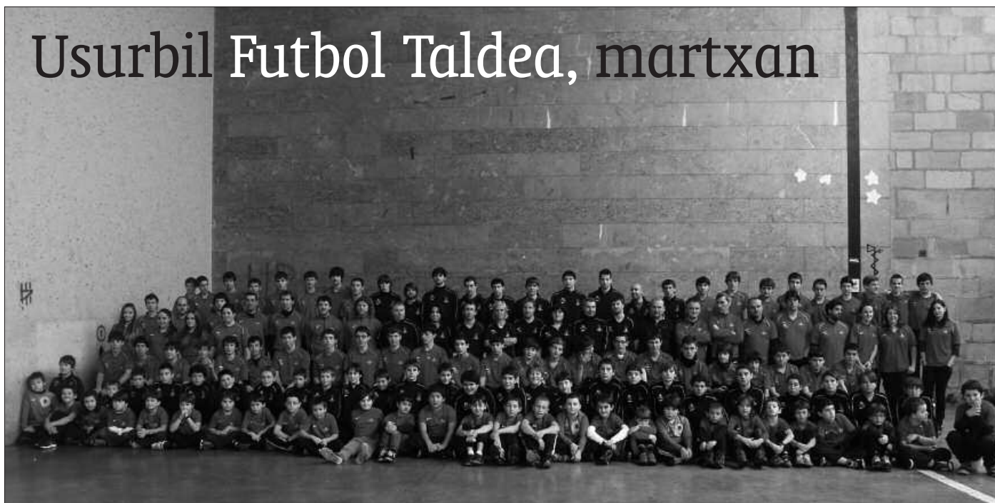
Usurbil FTko jokalar, entrenaizale eta zuzendaritzako kideak. Taldekako argazkietan nesken taldea falta da.