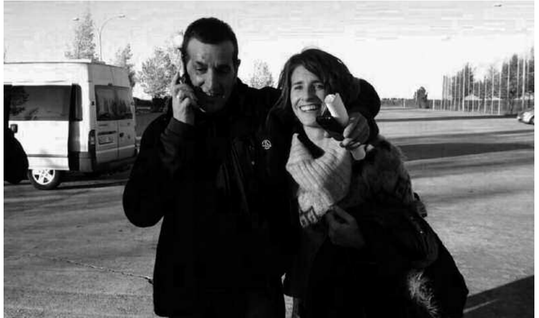
Libre utzi zutenean, zain zituen etxeokak eta lagunak.

Uribek 18 urte gehi bat egin ditu espetxean. Gogoan izan behar baita, berez, espetxe zigor osoa beteta iazko abenduaren 3an aske behar zuela kalezartarrak. Baina azken unean, 197/2006 doktrina aplikatu eta 2024. urtera arte luzatu zioten espetxealdia. Hamaika hilabete gehiago egin ditu espetxean, Estrasburgok bera eta bere egoera berean ziren 50etik gora euskal presok kalean behar zutela esan arte hain zuzen.