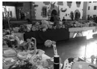
Jostailuak biltzeko eta, egunean bertan ere, jendea behar da.

Azken urteetan, teknologia berriek (mugikorrek, ordenagailueketa antzeko gailuek) aldaketa handiak eragin dituzte gizartean, batez ere, komuni-