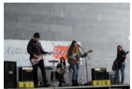
Proposamen artistiko ezberdinak egin ziren larunbatean, tartean, gazteen kontzertua.