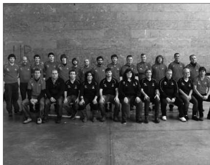
Zuzendaritza taldekoak eta entrenaizaleak.