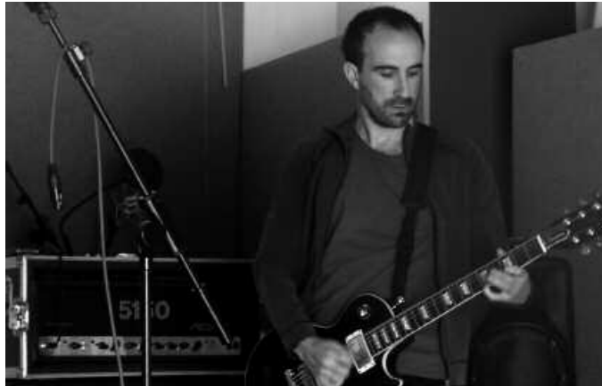
Abenduaren 14an, Odolaren Mintzoarekin batera arituko dira Sen taldekoak.

A ginagan inoiz baino giro biziagoa sumatuko da hasi berri dugun hilabete honetan. Eguberriengatik batez ere; txokoak eta zenbait emanaldi antolatu dituzte, urte garai honetan ohiokoa diren beste zenbait deialdiez gain. Aurretik ordea, badira beste zenbait ekitaldi ere; nabarmenena, eta gertuen duguna, Sen taldearen azken kontzertua abenduaren 14an.