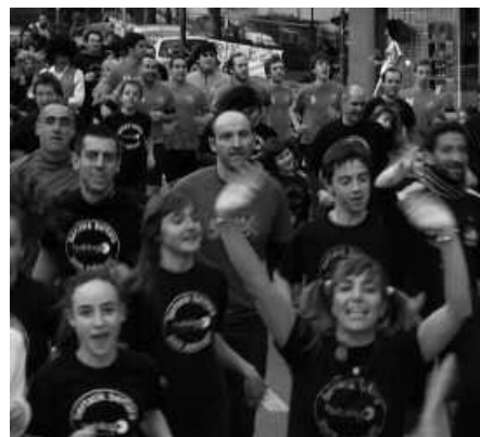
Abenduaren 31n, arratsaldeko 17:00etan hasiko da lasterketa.

Apuntatzeko bide berri bat zabalduko dute, 2010az geroztik harrera ezin hobea izan duen ekimen honen antolatzaileek. Aurreko edizioetan bezala, Hurbilagoko kide diren establezimenduen eman ahal izango da izena. Eta aurten estreinakoz, baita Hurbilagok laster martxan izango duen web gune berriaren bidez ere. Herri merkataritza eta ostalaritza suspertzearen aldeko lasterketan parte hartu nahi duzuenok, hasi prestatzen urteko azken egunerako. Hurbilago San Silvestre herri laster-