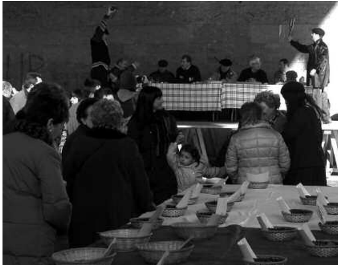
Abenduaren 9an hasi eta 19an amaituko da izena emateko epea.

Eta gehiago ere izango da, asteotan iragartzen joango garen moduan. Jatekoa eta edatekoa; sagardoa, txistorra, gaztainak edota taloa esaterako. Eta ezin aipatu gabe utzi noski, Santo Tomas azokari azken urteotan erreferentzialtasuna eman dioten sagardo eta babarrun txapelketak. Parte hartu asmo duzuenok, hasi prestatzen, abenduaren 9an ekingo baitiogu bilketari. Hau da, datorren astelehenean, NOAUA!ko egoitzara ekar ditzakezue babarrun eta sagar-