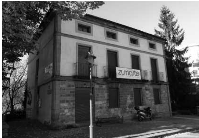
Musika Eskolen finantzaketan, diru laguntzen partidak jaitzi egin ditu Eusko Jaurlaritzak azken urteetan.

Zumarte Musika Eskolak aurkeztu zuen aurreko asteko osoko ohiko bilkuran aztertu eta aho batez onartu ziren hiru mozioetako bat; musika eskolen finantzaketari buruzkoa. Udalak Eusko Jaurlaritzari eskaera zuzen hau bidera dezan galdetzen dute Zumartetik; "Usurbilgo Udalak Eusko Jaurlaritzako Hezkuntza, Hizkuntza Politika eta Kultura Sailari, musika eskolentzat %33ko finantzaketa egonkorra lortzeko asmotan, Eusko Legebiltzarrak aho batez 2013ko otsailaren 28an onartutako transakzio-zuzenketa betetzea eta ekintza-plana ezartzea eskatzen dio".