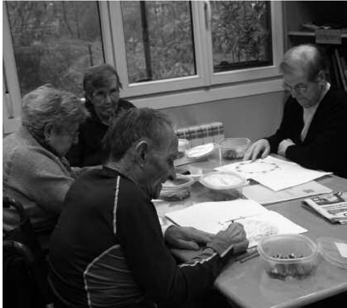
Azaroaren 17an hamar urte bete zituen Eguneko Zentroak

Gustura diren seinale, azaroaren 15ean guztiak batera burutu zuten urtemuga festa. Ilusio handiz ospatu zuten eguna, gunea 2003an inauguratu zutenean bezalaxe. Eguneko Zentroarekin lotura duten lagunak bildu zituen hitzordu bereziak. Udal ordezkariak eta gizarte zerbitzuetakoa, zentroko lan taldea, bertan dauden adinekoak eta euren senideak. Festa polita ospatu zuten. "Psikomotrizitate eta memoria landu genuen, hemen egin ohi