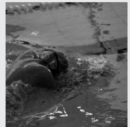
Igeriketa entrenamenduak, eskaintzen artean.