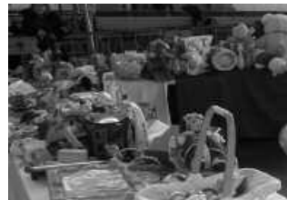
Datorren asteazkenean hasiko dira jostailuak biltzen Sutegin.

Jostailu Erabilien Azoka, abenduaren 14an frontoian, 11:00-13:00 artean. Gunea dinamizatzen Gaztelekuko gazteak arituko dira. Azoka bera eta bilketa lanak burutzeko laguntzaile-