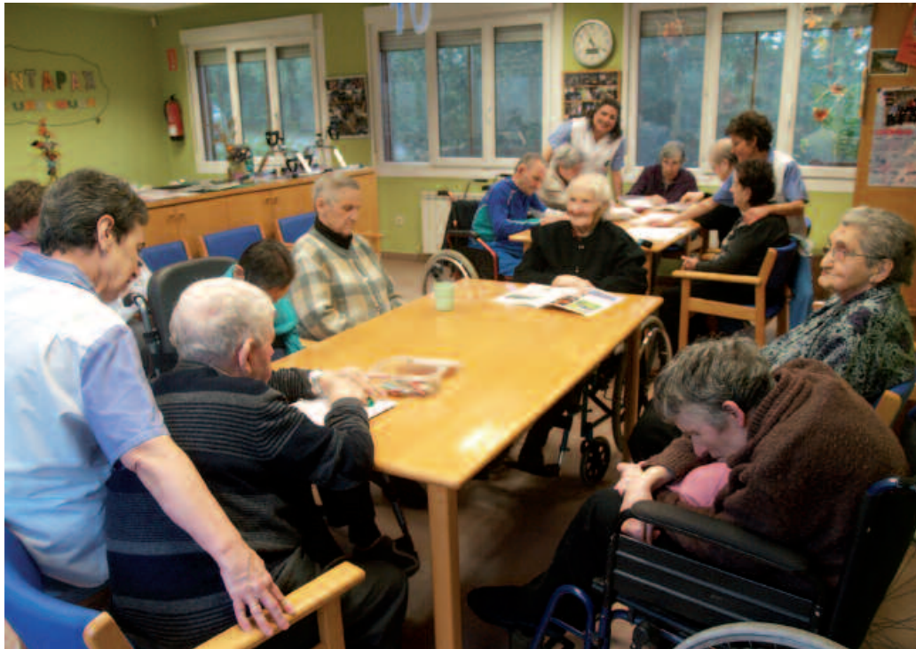
Eguneko Zentroak mesede egiten die adinekoei, eta baita euren senideei ere.