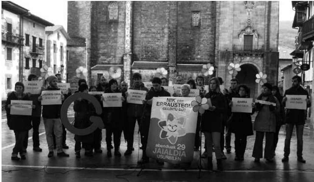
Abenduaren 29rako antolatu dute ospakizuna.

Gonbita luzatzearekin batera, errauste planta geldiarazten lagundu duten herritar, eragile eta erakunde guztiak, “zorionak eta eskerrik beroenak” eman nahi izan zizkieten agerraldi berean, lorturikoaz gozatzera animatzearekin batera, gogorarazi dutenez, “urte luzez gipuzkoarron