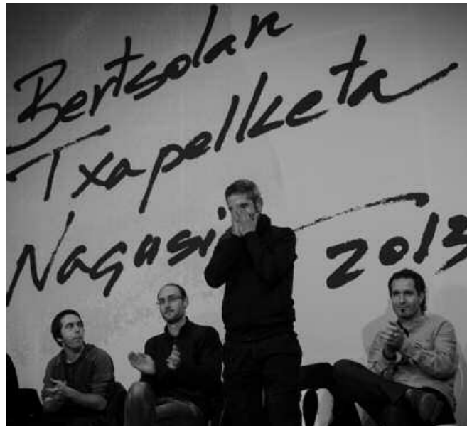
Igande honetan jokatu da finala.

Aipagarriena saio guzietan aretoak lepo beterik egon direla da. Egun bererako baino 5 egun lehenago sarrerak agorturik egon dira. Batetik internetez erosteko auke-