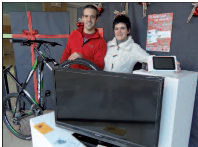
Opari hauen zozketa abenduaren 31n egingo da.

Zuen datu pertsonalekin bete eta jasotako saltoki bereko kaxan sartu. Eta gero, abenduaren 31ra arte itxaron. Urteko azken egunean ospatuko den IV. Hurbilago San Silvestre