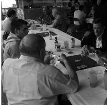
17 taberna eta jatetzek babesten dute mus txapelketa hau.