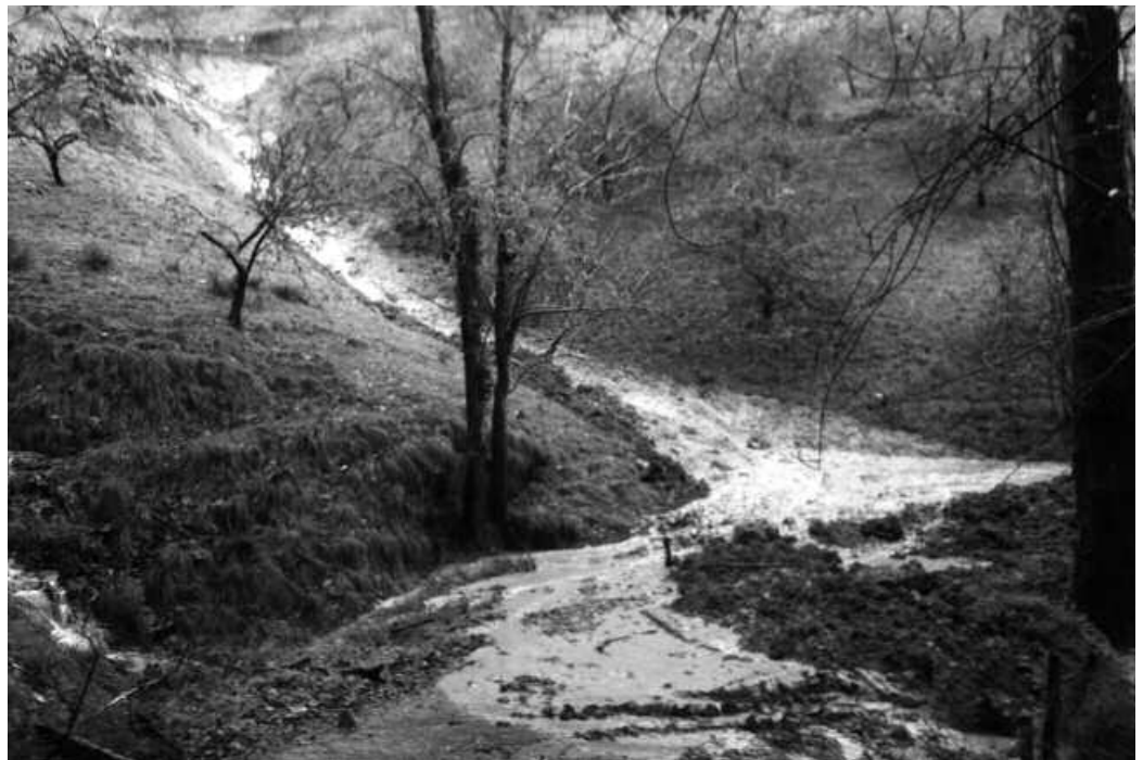
Foru Aldundiaren laguntzak baliatuko ditu Udalak, lubiziek eragindako arazoak konpontzeko.

H ala berri eman dute Usurbilgo Udaletik. Bide horretako lanen konponketa berehala hastekoak dira. Excavaciones Bergaretxe S.L. enpresari esleitu zaio obraren ardura. Baina ez hori bakarrik. Udarregirantz doan bideko beste bi eremutan ere konponketa lanak egitekoak dira. Batetik, Urkamendira iristeko bide zatian, eta bestetik, Udarregi parean 2011ko euriteek eragindako lubizia, aurrerago konpontzeko utzia zegoena Udalaren esanetan, horko lanak ere orain egingo dituzte. Baina azken konponketa lan hau, ez du Excavaciones Bergaretxe S.L. enpresak bideratuko. Oraindik esleitzeko baitu Udalak lan hauen ardura. Konponketa guztiok Gipuzkoako Foru Aldundiak Udalei inbertsioak bultzatzeko onarturiko ebazpenaren diru laguntzarekin finantzatu dira.