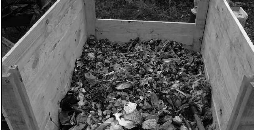
Besteak beste, hiri hondakinen bilketa eta tratamendua izango dira eskainiko diren ezagutzak.

H iri hondakinak edota udalerriko eta industrietako bilketa eta tratamendua, edota lanpostuan laneko arriskuak prebenitzeko neurrien hartzea, gaiok jorratuko dira, Lanbidek diruz-lagunduta Udalak antolatu duen ikastaro berriaren baitan.