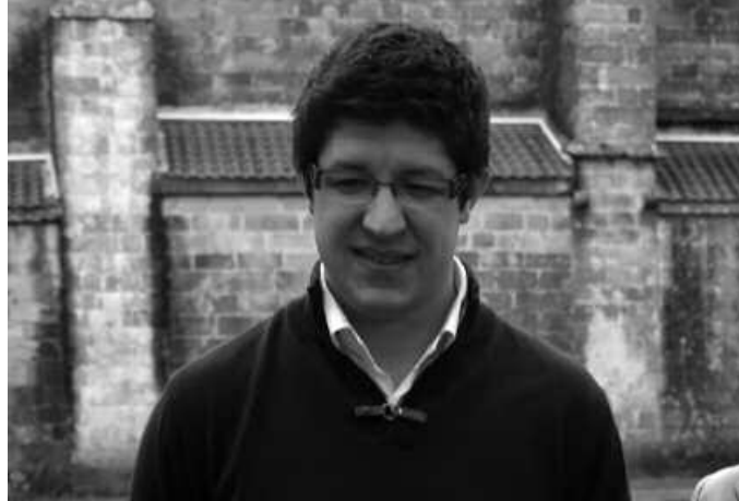
Aurrekontuen osotasunari emandakina aurkeztu die PSE-EEK.

Beste ardatz bat tasak eta zergak dira. Aurten %2,1 igoko dituzte, eta gure eskualdeko beste herri batzuk %1,5eko igoera izango dute, Donostiaren kasu; edo Hernaniren kasuan %0,6koa. Ur eta estolderia kontu-