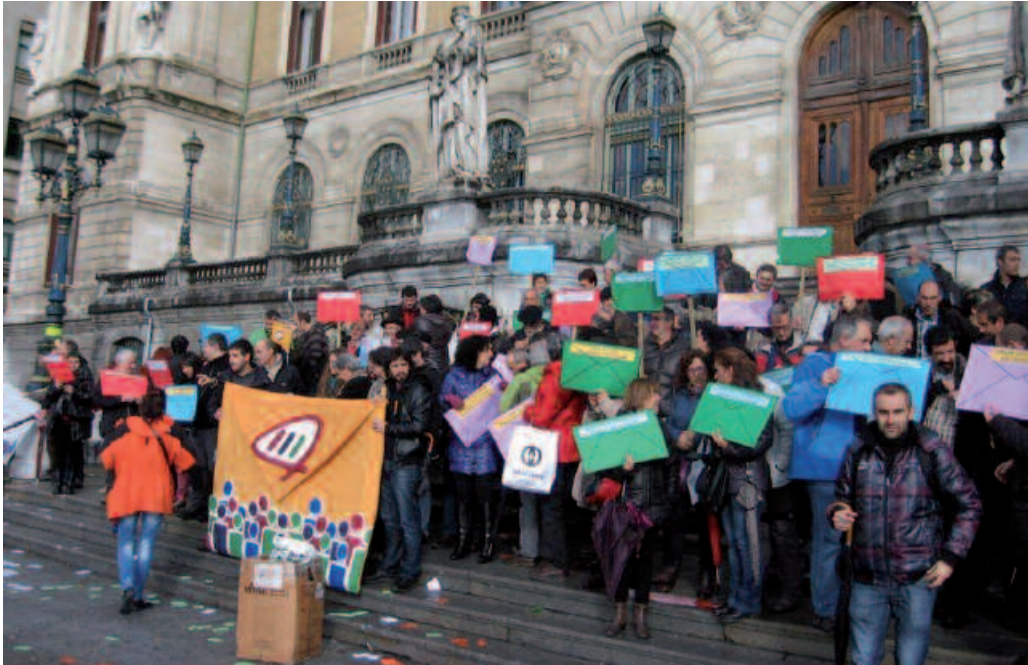
Duela hiru aste nazio mailako aurkezpen ekitaldia egin zen Bilbon.