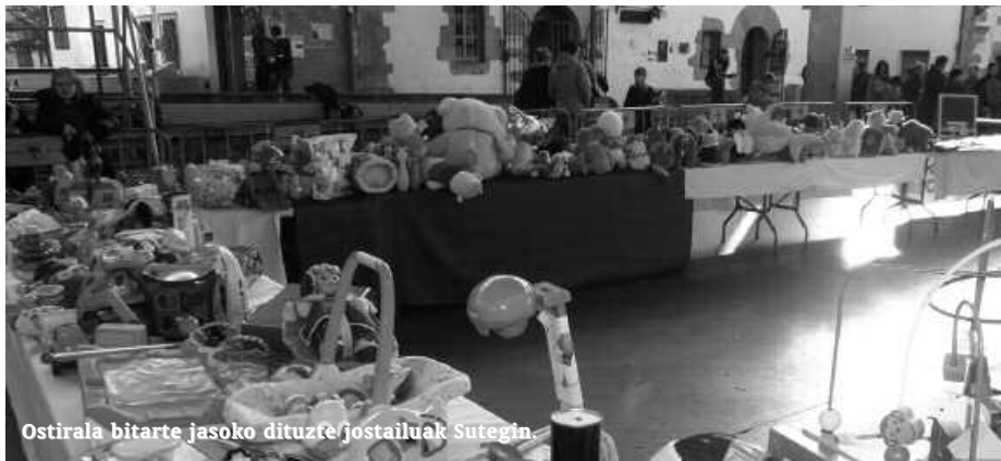
Ostirala bitarte jasoko dituzte jostailuak Sutegin.

A benduaren 13ra bitartean, jostailuak batu-ko dituzte arratsaldeko 17:00etatik 19:00etara Sutegiko erakusketa aretoan. Eta bildutako guztia larunbat honetako azokan jarriko dute ikusgai. Jostailuei erabilpen berriak eman eta haurren artean ohitura hori zabaltea da helburua.