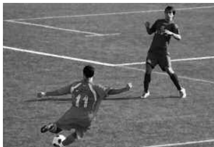
Ostiral iluntzetan entrenatzeko deia egin zaie animatzen diren beteranoei.

Futbolari ohia bazara, edo zaletua izanda kirol jarduera honetan aritu nahi baduzu, adi Usurbil FT-ko zuzendaritzak beteranoei begira egin berri duen deialdi honi. "Taldeko jokalaririk ohiak edo futboleko jolastu nahi duten zale-tuek zita berri bat dute Haranen", adierazi dute. Hala da. Beterano taldearen entrenamendu saioak antolatu ditu Usurbil FT-k. Ostiral iluntzero izango dira, 19:30etatik 21:30etara Haranen. Hitzorduotan parte hartzea animatzen dute futbol taldeen bilguneak.