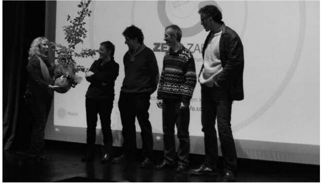
Usurbilgo Itunean ageri den zuhaitza jaso zuten oparitan.

Proiektu hau bertan behera geratu izanaren atzean egon den elkarlana nabarmendu zuen Intxaurrendietak. Urteetako ahalegina egun fruituak ematen ari dela zioen, herritarren, herri mugimenduen eta erakun-