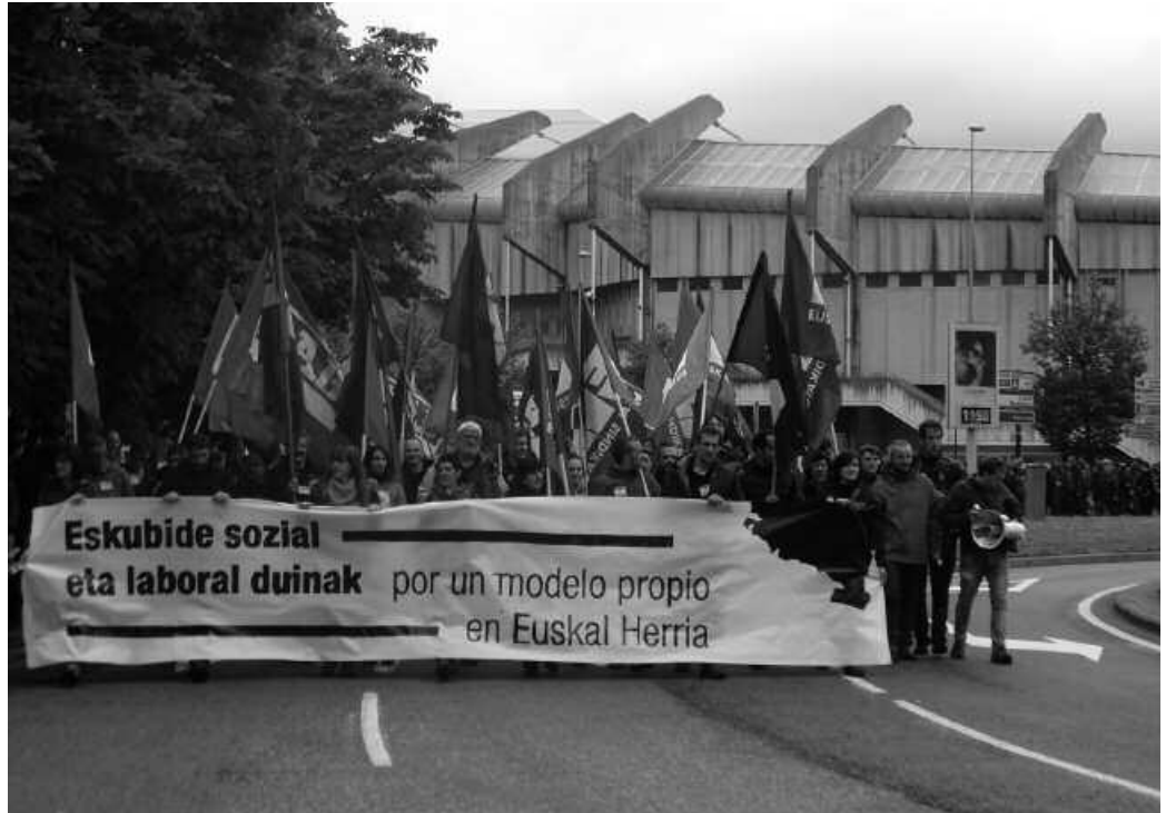
Karta Soziala eraikitze prozesua Euskal Herri mailan ari da garatzen.

Honez gain, talde honen beste funtzioa herrian jasotako ekarpen eta hausnarketak Karta idazteaz arduratzen ari den Talde Sustatzaileari bideratzea izango da, jarraian ekarpen hauek Euskal Herriko eragile sozial eta norbanako ezberdinei irekia den Asanblada Nazionean hautatuak izango direlarik. Eta azkenik, gure fun-