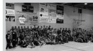
Txapelketa amaieran, talde guztiekin egindako argazkia.