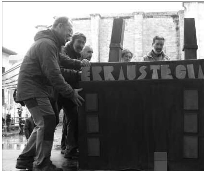
Erraustetaren aroa itxi dela ospatzeko, zero zabor taldeak jai giroan batu ziren frontoian, abenduko azken igandean.

Garaipen berrien bila abiatu aurretik ordea, antolatzaileak eta "Nik ere