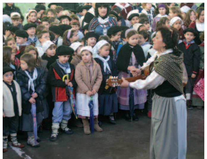
Udarregi ikastolako LHko ikasleek ere kantuz hasi zituzten gabon-oporrak.