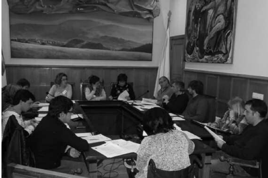
Gobernu taldeak otsailean onartu nahi ditu behin betiko 2014ko udal aurrekontuak.

A bendua amaieraz geroztik, erreklamazioak aurkezteko hamabost lan eguneko epea dago. 2014rako udal aurrekontuak, abenduaren 17an burutu zen ezohiko osoko bilkuran onartu ziren. Gehiengo osoz, EH Bilduko udal ordezkarien aldeko bozkekin. EAJ-PNVko ordezkaria abstentitu zen. PSE-EE eta Hamaikabat udal taldeek aurka bozkatu zuten. Udalbatzak azken ezohiko osoko bilkuran hartutako erabakia, abenduaren 24an eman zuen argitara Gipuzkoako Aldizkari Ofizialak.