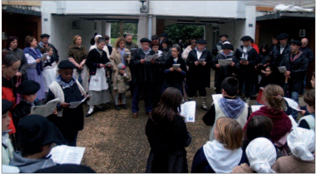
Herri bat aritu da kantuan. Irudian, Parrokia taldekoekin batu ziren herritarrak.

Agerian geratu da beste behin ere, herritarren kantu zaletasuna. Ikasleek ikastetxeetan, gabonetako oportetan murgildu aurreko azken klase egunean. Aginagan edota Usurbilen. Udarregi Ikastolako ziklo guztietako ikasleak kalera irten ziren irakasleekin abenduaren 20an, hitzordurako egokijantzita, gabon kantak abestera. Eguberriei ongi etorria ematen lehenak izan ziren. Gabon gaua eta Olentzero heldu aurretik berriz, Aginagan Parrokiakoak, Santuenean auzo elkar-tekoak, Zubieta Lantzenekoak, Usurbilen Parrokiakoak eta Usurbilen Nahi Ditugu elkar-tekoak... Denek abesteko tarte hartu dute eguberriotan.