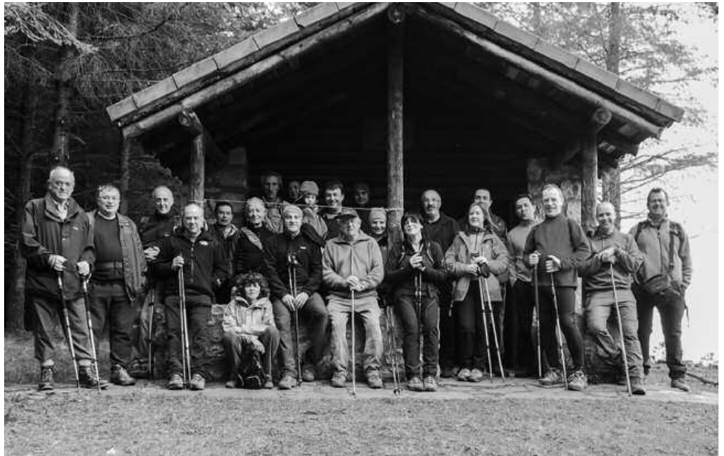
Urte berri egunean, Andatzako babeslekuan.

2014ko lehen mendi irteera izan dute. Baina ez azkena. Andatzakoak aurtengo txangoen egutegia lantzen hasiak dira jada.