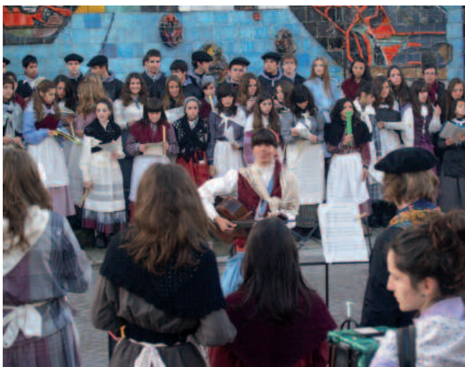
Udarregi ikastolako DBH mailako ikasleak, Mikel Laboa plazan kantari.