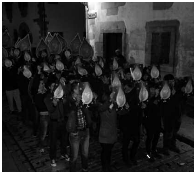
Bilbora joateko bi aukera daude. Goizez, 10:00etan edo arratsaldez, 15:00etan irtenda.

Aurtengo mobilizazioak ez du manifestazio itxurarik izango. Bai ordea aldarri bat: "Giza eskubideak, irtenbidea, bakea. Euskal presoak Euskal Herrira". Herritar bakoitza presoen eskubideen aldeko tanta bihurtuko da urtarrilaren 11 honetan. Eta Bilbon espero diren milaka tantekin elkartasun olatu erraldoia osatu nahi da. Horretarako, adi Tantaz Tanta bilgunetik egin duten deialdiari. Larunbat arratsaldeko 17:30etan, bi olatu handi osatzera deitzen dituzte herritarrak. Olatuetako bat Casillatik abiatuko da, bigarrena Bilboko udaletxe paretik. Ordubetara, itsasoa osatuko dute Bizkaiko hiriburuan.