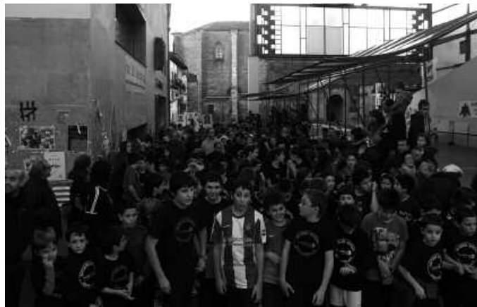
Lasterkariak San Silvestren, korrika noiz hasiko zain.

Gainerakoan aipaturikoa, lagun koadrilek eta familiek parte hartu zuten, urtea agurtzeko kirol ekimen honetan. Haietako batzuk mozorrotuta, baina guztiek irri bat ahoan zutela. Bidean berri, herritarrek zebiltzan hara eta hona, batzuk argazkiak ateratzeko leku onenen bila, baina denak paretik pasatzen ari ziren senide, lagun, edota ezagunak gogotik animatzen aritu ziren. Herri merkataritza eta ostala-