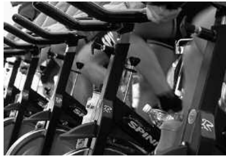
Prezioak, zerbitzuak eta egutegiak zehaztu dituzte kiroldegietan, baita Oiardon ere.

Gogoan izan, Usurbilgo Kiroldegiko txartela, Andoain, Lasarte-Oria eta Urnieta kirol instalakuntzetarako ere erabil dezakezuela. Ohar interesgarria, bereziki, Oiardo itxi ohi duten egunetarako. Eta itxialdien berri ere eman dute Buruntzaldeko lau udalerrietako kiroldegiek. Alegia, 2014ko jai egu-