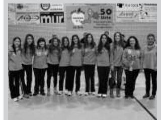
Alkateak eman zien txapelaldun kopak.

Gainerakoan giro oso ona eta jendetsua izan zen, 2013ko azken igandean goizetik iluntzera ospatu zen jaialdia.