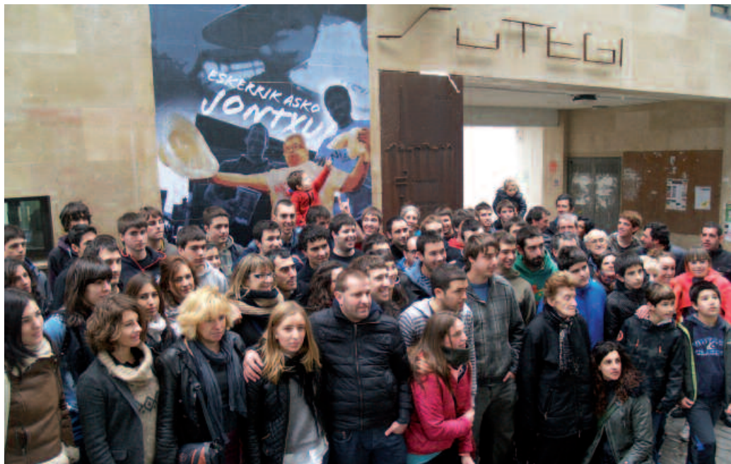
Ernaiko gazteek ipini zuten murala. Ondoren, lagun eta senideekin batera atera zuten erretratu hau.