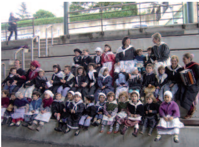
Aginagako Eskola Txikikoak.