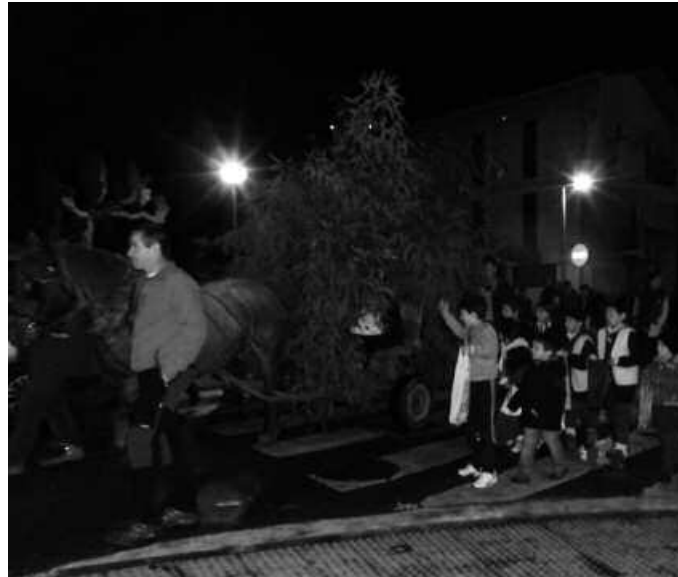
Santueneko kaleetan barrena ere ibili zen Olentzero.