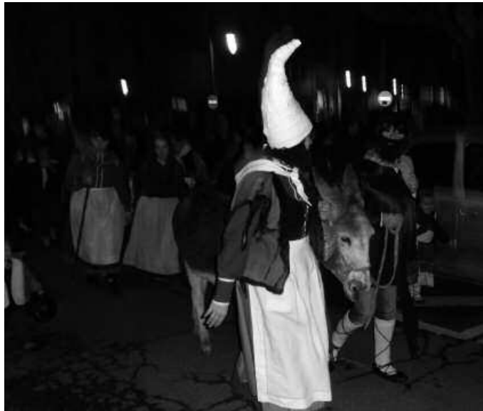
Haur Eskolakoekin astoa, Maridomingi eta Olentzero atera ziren kantuan.