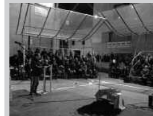
Abenduaren 30ean egin zen ekitaldia.

Jendea batu zen abenduaren 30ean, 'Egia bide, askatasuna amets' ekimenean. Usurbilgo frontoian, irudi, doinu eta dantza saioek girotu zuten ekitaldia. 1936tik hona "herri honen askatasunaren alde borrokatu zutenak" ekarri zituzten gogora.