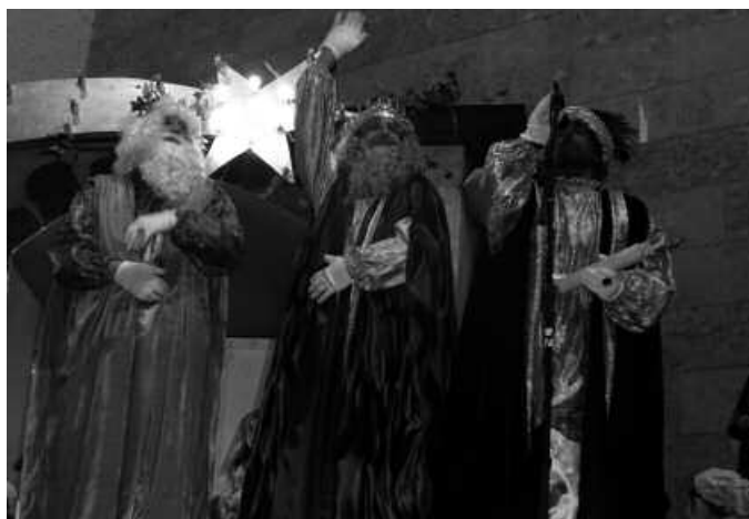
Esandako orduan iritsi ziren frontoira hiru errege magoak. Goiz partean, bere laguntzaileak egon ziren erregeentzako gutunak biltzen.

H orietan dituzue Meltxor, Gaspar eta Baltasar frontoira iritsi eta egin zituzten lehen adierazpenak. Askok garai zailak bizi dituzten honetan, baikortasuna zerion, hiru erregeek harrera egitera hurbildutako herri-tarrei irakurri zieten mezuak: "Egunok eta urteok nahiko gogorrak izan dira familia askorentzat. Familia askok langabezian, pobrezian, beste era batera bizi izan behar dituzte gabonak. Baina gu hemen gaude, zoriontasuna banatzeko, maitasuna, adiskidetasuna, beste opari batzuen tartean".