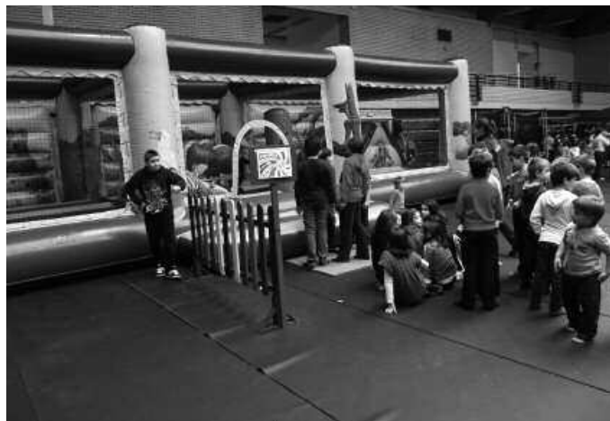
Eguberrietan, jolas parke izan zen hiru egunez Oiardo kiroldegia.