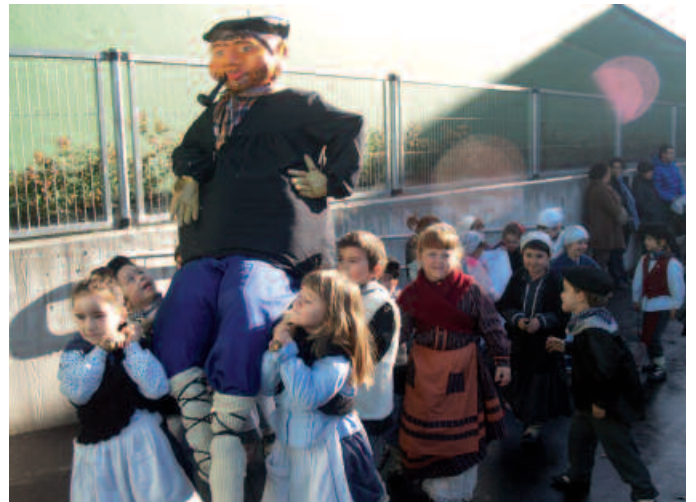
Udarregi ikastolako HH mailako ikasleek Olentzero atera zuten patiora.