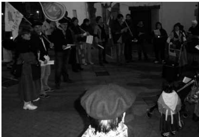
Preso eta iheslarien omenezko kalejira Mikel Laboa plazatik abiatu zen.