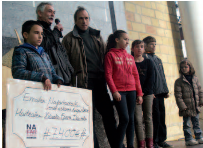
Santo Tomas azokan jaso zuten dirua.