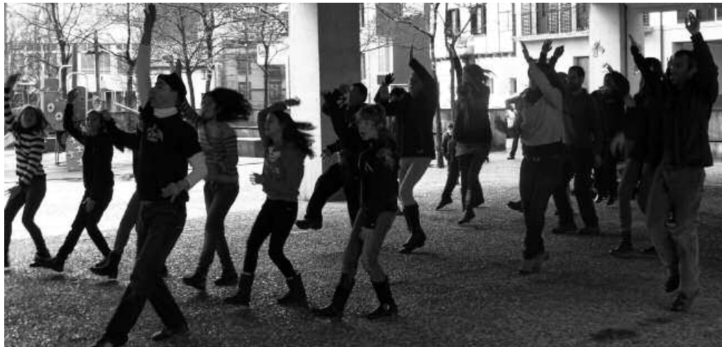
Modu ludikoan zabaldu da gaikako bilketaren mezua herriz herri. 5etik 27ra hazi da 2013an gaikako sistema.