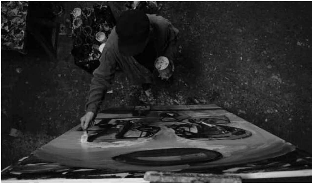
DBHko ikasleek Zumetaren inguruko dokumentala ikusi zuten Euskararen Egunean.

Urtero bezala, abenduaren 3an, Euskararen Eguna ospatu genuen ikastolan. Egun horretan ez genuen klaserik eman eta ekintza ezberdinak burutu genituen. Hasteko, goizean ikastolara sartu ginenean, girotzeko euskal kantuak jarri zituzten bozgorailuetan. Giro alai zegoen ikastolan, ohikoa ez den bezala.