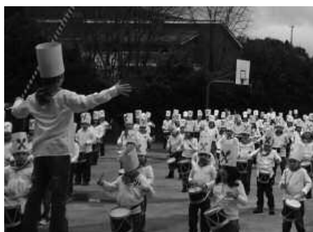
San Sebastian eguneko danborrada ostiral honetan egingo dute Udarregin.