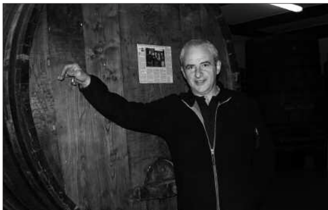
Irekiera, urtarrileko bigarren astetik apirila bukaera edo maiatza aldera.

Gure kezka da, ia behin edo behin errekueratuko ote den aste egunetako bezeroa. Gurean 100 bat lagun sartzen dira, eta iaz asteburuetan nahiko itxuraz ibili ginen, ondo. Aurten ere esperantza hori dugu. Nahiago dugu betiko bezeroa, herri ingurukoa, Lasarte edo Oriu, Zarautz aldeko dezente etortzen zaizkigu. Horiekin ondo mol-