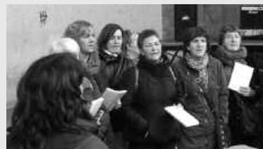
Urtarrilaren 25ean aterako dira kantuan.