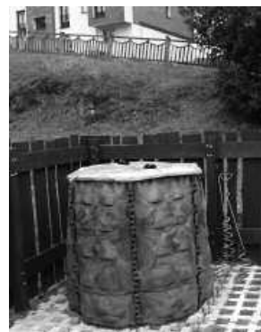
Auzokonpostatzea 8 herritik 39ra zabaldu da 2013an.