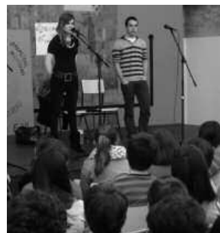
Bertso saioaren irudia.

Azkenik, bertsolariak ikasleengan jaitsi ziren eta bertso jarraituak kantatu zizkien ikasle batzuei. Giro ederra egon zen.