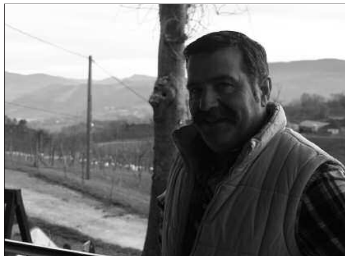
Urtarrilaren 7tik maiatzaren 4ra irekia izango da txotx garaia.

Krisi egoera honekin, ez dakigu ze bezero mugimendu izango dugun. Aurreko urteetan gazteri jendea galdu egin da. Denboraldi hau ere ildo beretik joango delakoan nago. Bezero gehienak ingurutik datozkigu; Zarautz, Donostia, Lasarte, Usurbil aldetik. Koadrila txikiak gehienbat.