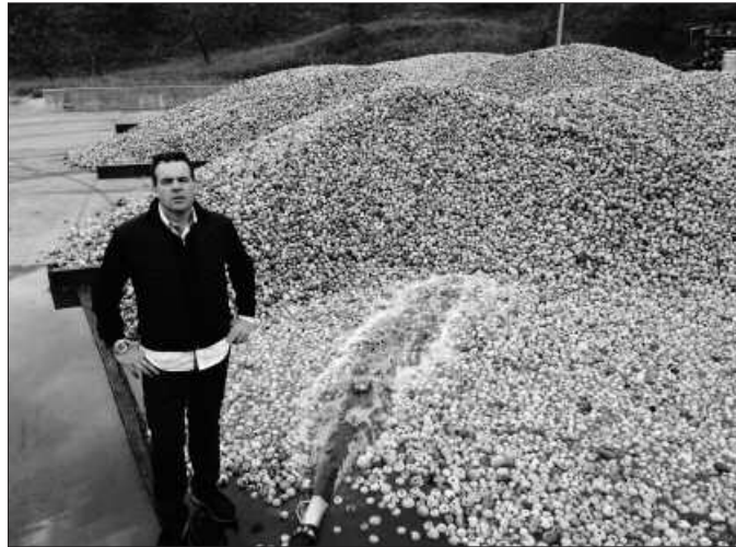
Urtarrilaren 16tik aurrera hasiko da txotx garaia.

Astelehenetik ostiralera, denboraldi berriko sagardoaz gozatu eta dastatzera datorren publikoa espero dugu eta asteburuetan, larunbatean eta igande eguerdian bereziki, sagardotegiko planarekin datozen familiak, edota dezente lehena-gotik sagardotegia eta nekazaltu-