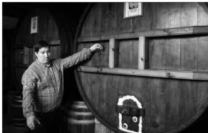
Urte osoan zabalik. Ostiral iluntzetan, larunbat egun osoz eta igande eguerditan.

Aurreikuspena egitea oso zaila da. Langabezia dela eta, iazkoaren antzekoa izango delakoan gaude. Mantenduko balitz gu oso gustura. Ekoiz-