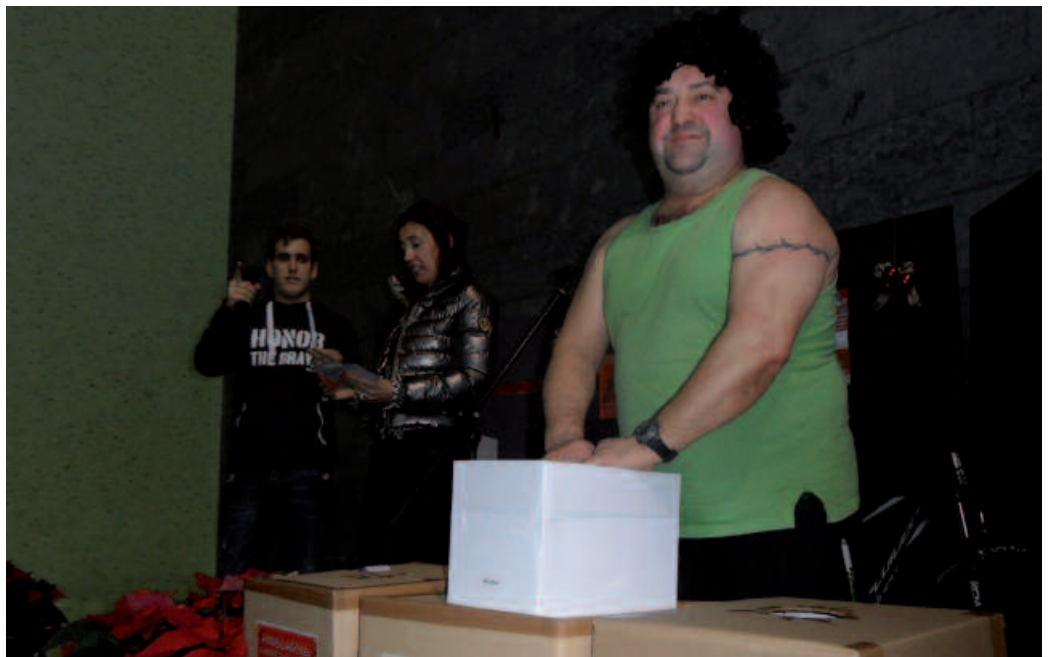
“Bizitza honetan badakigu zer dagoen: bizi, barre egin eta aprobetxatu egin behar dugula momentua”.

P. I. Familiarekin ikusten dut, edo bestela lana egokitzen zaidanean tabernan, barre handia egiten dut. Txiskolan ateratzen ginen garaian, neure burua ikusteak lotsa ematen zidan. Eta orain, neure triparekin, barre handia egiten dut. Oso seguru noalako izango da, berdin zait. Azkenean bizitza honetan badakigu zer dagoen; bizi, barre egin eta aprobetxatu behar dugula. Aprobetxatzeko une hau egokitu zait telebistan, bukatzen denean hor geldituko da. Gozaten ari naizen bitartean jarraituko dut, gozatzeari uzten diodan unean utzi egingo dut.