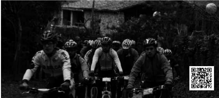
Izena emateko inskripzio orrira, QR kode horren bitartez iritsiko zara.

Aurre inskripzioa egiteko bi bide dituzue; Kirolprobak atarian sartuta edota Irisasi BTT bilguneak Facebooken duen orrialde- ra joanda. Web orri baterako zein besterako lotu- rak hemen: www.kirolprobak.com web orrian edo Facebook helbidean facebook.com/IrisasiBtt2013 . Izen emateko orriak ere Andatzako web gunean eskura daitezke.