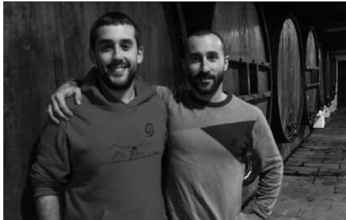
Irekiera: urtarriletik maiatzaren 18 ingurura arte.

Espero dugu pixka bat berriz ere 25-40 urte arteko bezero gehiago erakartzea, hori da gure erronka. Talde handiak hartzen ditugu, baina guk lan gehiago egiten dugu, 4-15 laguneko taldeekin. 12-14 lagunentzako