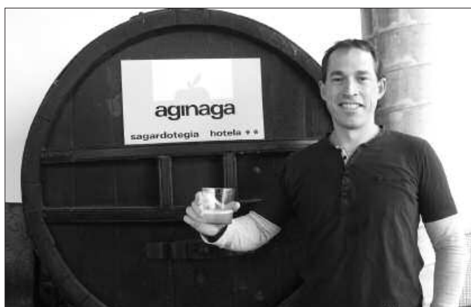
Urte osoan irekita, astelehenak itxita. Eguerdian, 13:30ean, iluntzean 20:00etan.

Gurean, bezero mota ezberdin asko ditugu. Bertako jendea, sagardotegiko garaian sagardoa probatzera etortzeko ohitura duena, inguruko probintzietatik taldean egun pasa datorena, urte osoan etortzen diren bezeroak... Pasa den urtetik, Hotela ireki genuenetik, asteburu pasa etortzen direnak ere badira, Txotx garaia aprobetxatuz. Abantaila bat ere badugu, Donostia Zumaia lineako autobusak, guretik 50 metrotara du gurekua eta jendeak ez du arduratu behar