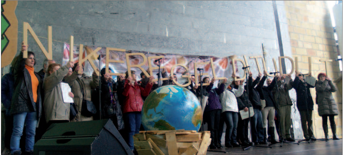
Argazkia abenduaren azken igandekoa da, "Nik ere gelditu dut" ospakizunekoa.

A gurtu berri dugun azken urteko balantzea egin du Gipuzkoa Zero Zabor herri mugimenduak. Balantze positiboa, ez bairik gabe. GZZ-tik diotenez, "2013 urtea, Gipuzkoan, Zero Zabor bidean urrats handiak egin diren urtea izan dela ikus dezakegu".