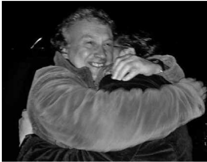
Eguberriak amaitu berritan utzi dute baldintzapeko askatasunean.