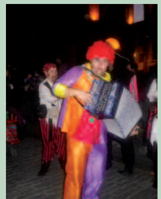
Mozorroan pentsatzeko garaia da.

katu. Hauexek azken hamarkadan, mozorrotzeko proposatu izan diren gaiak: 2013 Musika, 2012 Mitologia, 2011 Itsasoa, 2010 Zirkoa, 2009 Olinpiar Jokoak, 2008 Xomorroak, 2007 Brasil, 2006 Marrazki bizidunak, 2005 Oesteko herri, 2004 Hollywood, 2003 Munduko kulturak, 2002 Extralurtarrak.