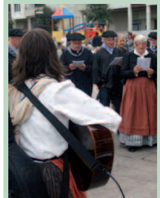
Musika instrumentuak jotzen dituen jendea ere batu nahiko luke.

Bigarren Hezkuntzan saiatzen naiz betiko euskal kantu tradizionalenak sartzen. Beti agertzen da, hiru kurtsuetatik lauzpabost ikasle, kantatzea gustatzen zaiena. Horiekin saiatzen naiz Ikastola Egunean mikro baten aurrean jartzen, Inauterietako jaialdian ekitalditxo bat egiten eta orduz kanpo motibatzen. Baina ez da adin erraza motibazioa bultzatzea.