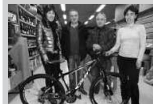
Alkartasunan jaso zuten saria.

Coluer Rave 270 markako mendiko bizikleta Loyola XXI enpresari egokitu zaio. Ekitaldietarako material edo azpiegitura muntatzen aritzen den lantegi hau Zumartegi industriagunean aurkitzen da. Alkartasuna Kooperatiban ateratako argazkia da ondokoa, bertan eginiko erosketengatik egokitu baitzaie mendiko bizikleta, 069.187 zenbakidun txartelaren jabe. Langileen artean, bizikleta norentzat izango den erabaki beharko dute orain.