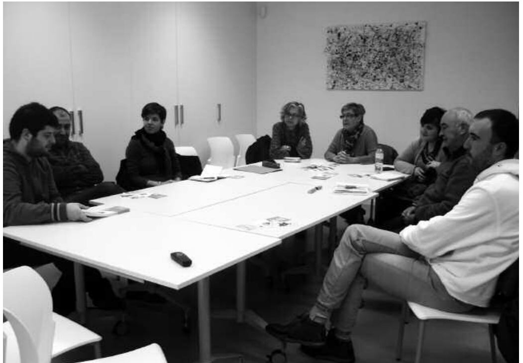
Aurreko larunbatean elkartu ziren Potxoenean. Hurrengo bilera, ostiral honetan 18:00etan Potxoenean.

Giza kate erraldoia, ekainaren 8an Gogoan izan, nazio mailako hitzordua ere finkatua duela Gure Esku Dago ekimenak; datorren ekainaren 8an, Durango eta Iruñea erabakitze eskubidearen aldeko giza-kate erraldoi batekin lotu nahi dute, eskuz esku, euskal herritarren laguntzaz. Informazio gehiago: www.gureeskudago.net