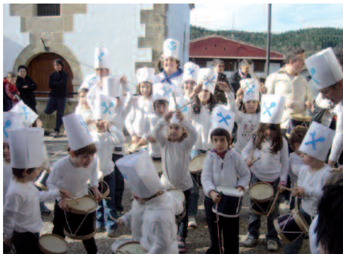
Danbor festarekin bat egin zuten Aginagako ikasleek.