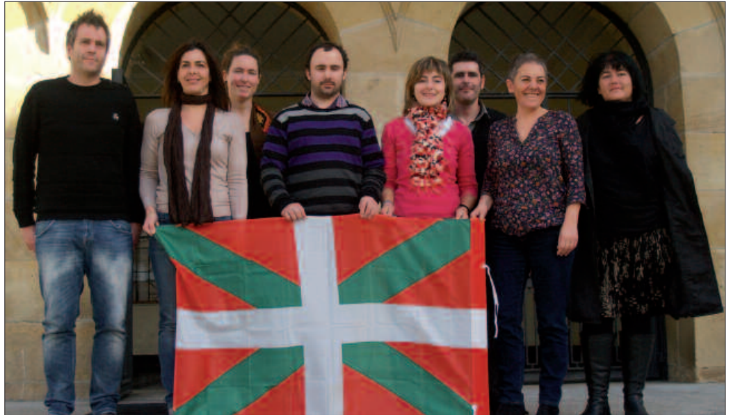
Udalbiltzak prentsaurrekoa eskaini zuen aurreko astean Usurbilgo udaletxean.

Herri gisa erantzunez, Udalbiltzako esanetan urtarrilaren 11n Bilboko manifestazioan egin zen bezala. Eta herri gisa arituz, Etxarri-Aranatzen apirilaren 13rako independentziaren aldeko herri galdeketa antolatu duten moduan. Bi ekimenok txalotu zituzten Udalbiltzako kideek iragan ostiraleko agerraldian.