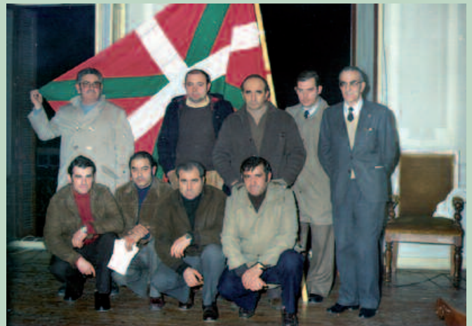
1977an, San Sebastian bezperan ipini zen ikurrina udaletxean.

Usurbilen 1977ko San Sebastian bezperan orduko udalbatzak burutu zuen osoko bilkuran jarri zuen ikurrina udaletxean. Jendez bete zen udal aurreko plaza. Orduetik ia 40 urte pasa diren honetan, ikurrinaren erabilerak guztiz baimendu gabe eta Espainiako bandera inposatzen segitzen dutela gogorarazi zuen Udalbiltzak, aurreko ostiraleko agerraldian.