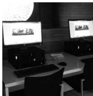
Bi ordenagailu berri ipini dituzte goiko solairuan.