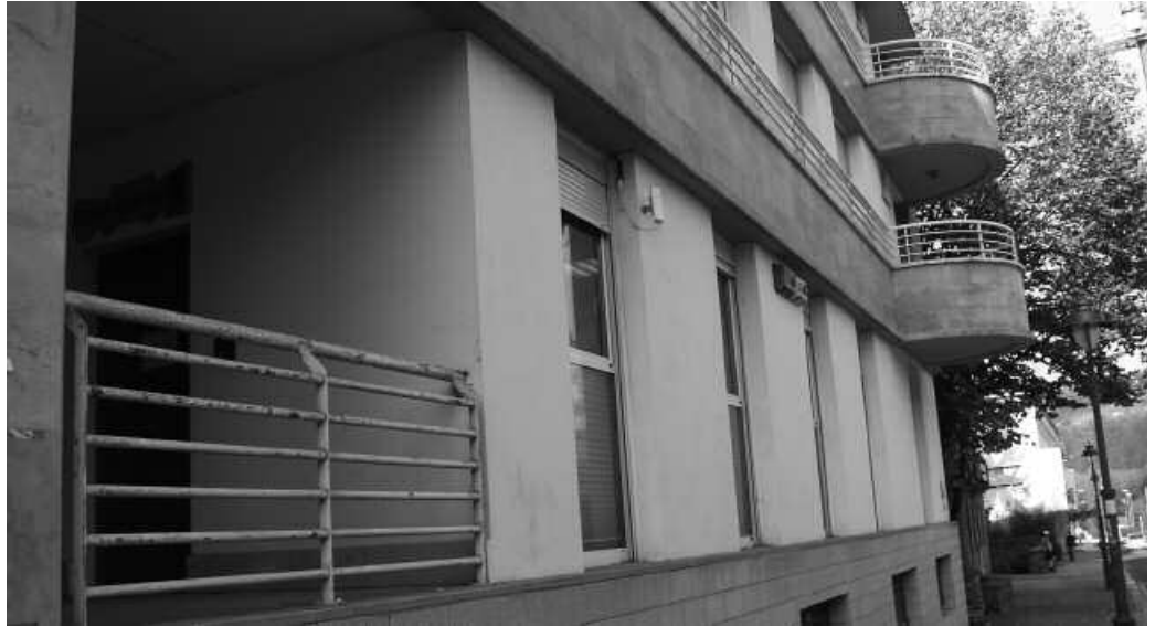
Gizarte Zerbitzuen egoitzan dago Sexu Aholkularitza Gunea.

Modu batean edo bestean, 340 lagunek baliatu dituzte azken bi urteotan Sexu Aholkularitza Gunek eskaintzen dituen zerbitzuak. Aurreko ikasurtean adibidez, 46 lagunek (36 emakume, 10 gizona) jaso zuten banakako aholkularitza aurrez aurre gunean bertan, telefonoz edo sare sozia- len bidez. “Usurbilgo biztan- len kopurua kontuan hartuta, aholkularitzak oso harrera ona