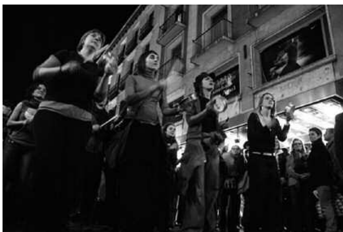
Bost saio izango dira hasieran eta taldea gustura badabil, jarraipena emango litzaioke.

Proba moduko ikastaroa izango da hauxe, emakumeei zuzendurikoa, Usurbilgo Udaleko Parekidetasun Sailak an-