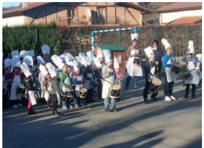
Zubietako Eskola Txikikoak ere ostiralean eskaini zuten danborrada.