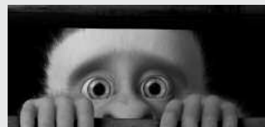
'Malutatxo' filmeko protagonistia.

Otsailaren 2an proiektatuko dute etxeko txikienei zuzenduriko hurrengo ikus-entzuzkoak; 'Malutatxo'. 17:00etatik aurrera, Sutegin. Sarrerak egunean bertan jarriko dituzte salgai, 3 eurotan.