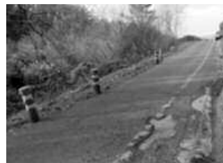
22.529 euro inbertsioa egingo da.

kituak izan dira eta bide izkinen erreimatearekin amaituko dira bertako lanak. Proiektuan jasotzen denean oinarrituz, bertako lurrago egokitu eta bide bazterra konpontzea C. Alvarez, S.L. enpresa hobetsia izan zen. Lan honen aurrekontua 22.529,76 eurokoa da, BEZa barne. (Iturria: Udala).