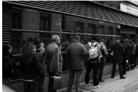
382 langabetu zeuden 2013 hasieran. Baina urte amaieran, 366 ziren langabeak.

Usurbil: 366. Buruntzaldea: 4.800. Gipuzkoa: 46.612.