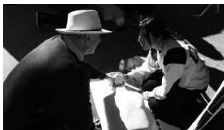
Astelehenean hasiko da ikastaroa eta bi eguneko iraupena izango du.

"Ikastaro teoriko-praktiko honekin bihotz-arnasketako geldialdia identifikatzen, oinarriko bihotz-biriken suspertze (BBS) mugimenduak burutzen eta DEA (Kanpoko desfibriladore automatikoak) erabiltzen ikasten da. Ezaguera erra-