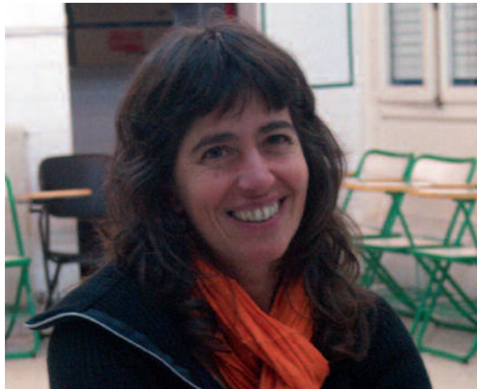
“Taldea honekin asko ikasi dut. Ez naiz irakasle sentitzen”, adierazi digu.

Kantuan oso talde giro polita sortu dugu. Hasiera batean lotsa genuen, beldurra. Pixka bat horri guztiari aurre egin diogu bost urteotan eta orain, lasaitasunez, plazerrez abesteko konfiantza handia dugu. Elkar ulertze bat dago gure artean. Kitarrarekin gaur egun golpe bat ematen badut, denek dakite zer esan nahi dudana. Eta gero herriari ere saiatu gara eskaintzen hainbat ekitaldietan, kantua presentzia. Eta ekimenak antolatu izan ditugu.