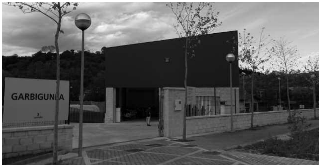
Doan hartu daitezke. Haietako asko, egoera onean gainera.

Orporaldia, etxea txukuntzeko urte garai egokia izaten da askorentzat. Badirudi eguberrietan halako zerbait gertatu dela. Behar ez ziren gai asko, Garbigunera eraman ditu hainbat herritarrek. Eta pasa den ostiralean behintzat, instalakuntzak berrerabiliak izateko zain dauden gaiez bete zegoen. Batzuk eramateko erreserbatuak daude jada.