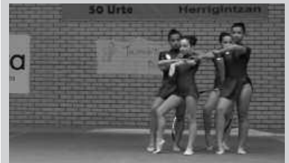
Goizeko 11:00etan hasiko da erakustaldia.

Tximeleta taldeak aurrelehiaketa antolatu du, Elorsoero kiroldegian, Oiartzunen. Goizeko 11:00etan hasi eta eguerdiko 12:00etan bukatuko da. Ikastetxe ezberdinek hartuko dute parte, tartean Udarregi ikastolak. Eta hauekin batera, Tximeletako jubenilak eta seniorrak.