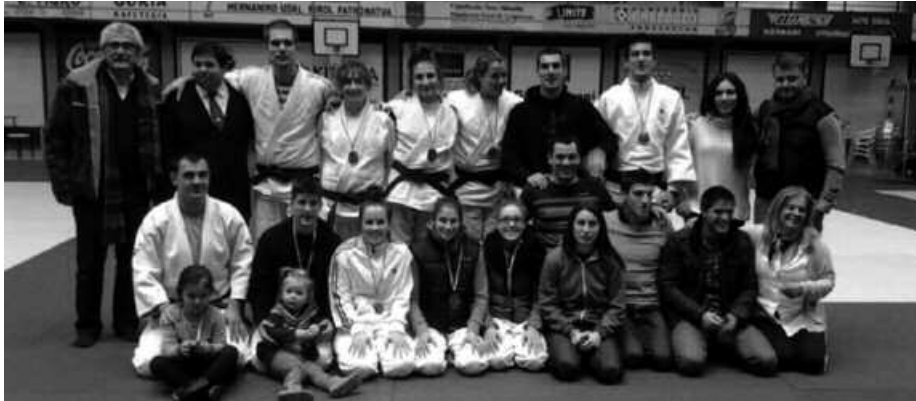
Domina sorta ederra pilatu dute azken hilabeteotako txapelketetan.

E uskadiko eta Espainiako Txapelketetan murgilduak eman ditu azken hilabeteok, Usurbil Judo Klubak. Hego Euskal Herrian Hernanin, Amurrión edota Iruñean izan dira. Espainiar estatuan, Burgosen edo Valladoliden. Hitzordu guztiotan, lehen postuak eskuratu dituzte, eta domina sorta ederra, klubak duen blogetik berri eman dutenez: