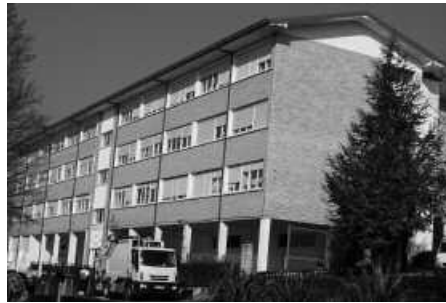
Agerialdeko berritze-lanak egingo dira 2014ko udal aurrekontuekin.