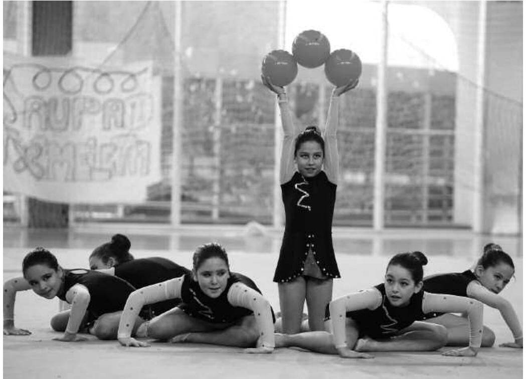
Erakustaldia eskaini zuen Tximeleta taldeak pasa den asteburuan, Oiartzungo kiroldegian.

"Lan gogorra egin ondoren, ilusio handiarekin aritu ziren epaileen aurrean, haien lana gogotsu defendatuz eta erakustaldi bikaina eginez. Gimnasta guztiei zorte ona opa diegu eta, garrantzitsuena, disfrutatzea eta ilusio handi horrekin jarraitzea".