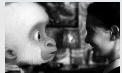
Igande honetan, 'Malutatxo' Sutegin.