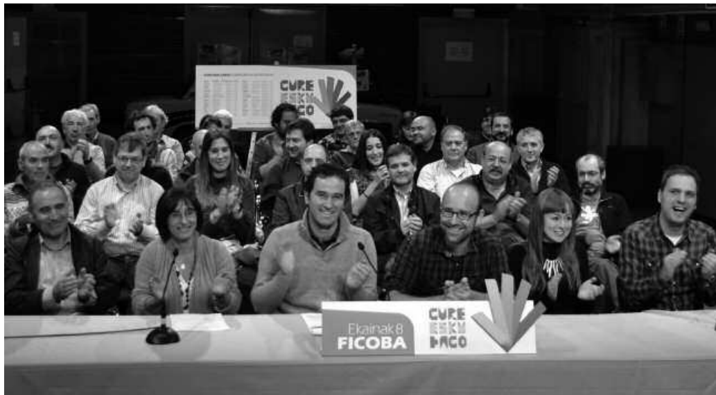
Gure Esku Dago ekimenak atxikimendu ugari eta askotarikoak jaso ditu orain arte.

N. Gure Esku Dago taldea abiatu berria da Usurbilen.