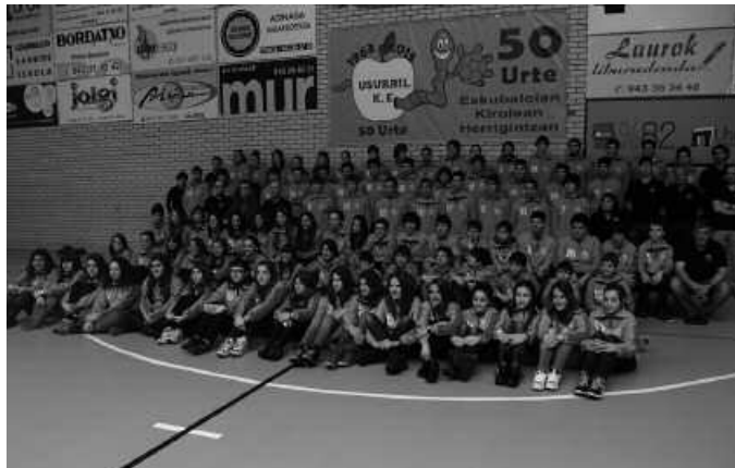
Senior taldeak ere goi postuetan dira. Eta horrela, “jende gehiago dator eta jende gehiagok ematen du izena”.