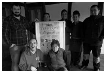
'Tipi-Tapa' ibiltzeko: Artzabal, Txapeldun, Xarma, Txirristra, Txiriboga, Aitzaga eta Bordatxo.

Ohi bezala, edatekoarekin batera zerbitzatuko dituzte muskuiludun zizka-mizka bereziak, 2 euroren truke. Ez ahaztu Tipi-Tapa txartela hartzeaz. Zazpi tabernetako zigiluak eskuratu eta igandean arratsaldeko 15:00etan, oraingoan Artzabalen ospatuko den 150 euroko erosketa balearen zozketan parte hartu ahalko duzue eta. Diru kopuru hau egokitzen zaionak, saria Hurbilago Elkarte estabiezimenduetan xahutu ahal izango du. Artzabal, Txapeldun, Xarma, Txirristra, Txiriboga, Aitzaga eta Bordatxo, Tipi-Taparen edizio berrirako prest dira.