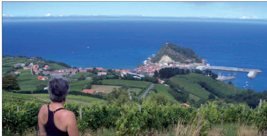
2014ko lehen irteera otsailaren 9an egingo dute: Zumaia-Orio, itsasoari begira.

Otsailaren 9an, Zumaia-Orio 12 kilometroko bidea.