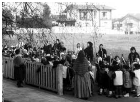
Udarregiko ikasleak eguerdi partean ibiliko dira kalejiran.