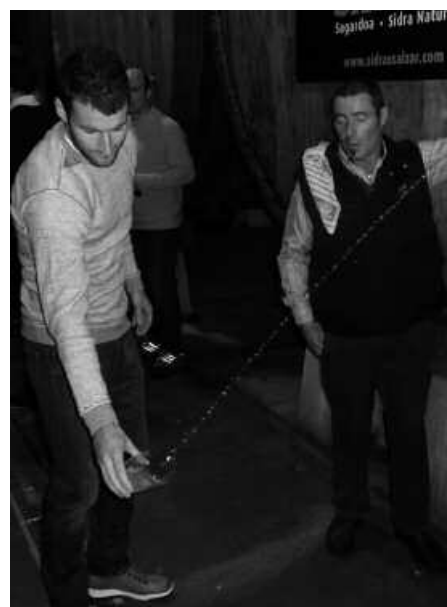
Kalitatezko sagardotegi asko ditugula uste du Realeko jokalaria.