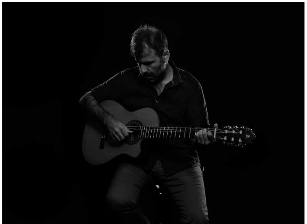
Sarrerak aldeztu aurretik erosi ahal izango dira Txiribogan eta NOAUA!ko egoitzan.

NOAUA!ko bazkideek 5eurotan erosi ahal izango dute sarrera. Baina kasu honetan, soilik aldeztu aurretik eta soilik NOAUA!ko egoitzan.