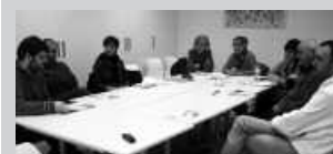
Potxoenean elkartuko dira ostiral honetan, 18:00etan.

Gure Esku Dago taldea. Herritarrak gure dinamikan parte hartzeaz gain, familiak, lagun koadrilak ... Giza katearen parte izatera gonbidatu nahi ditugu, oso festa polita izango da. Bukatzeko, berri gehiago ditugun heinean jakinaraziko ditugu sare sozial, kultur agenda eta NOAUA! bidez, guztiok parte hartzeko aukera izan dezagun.