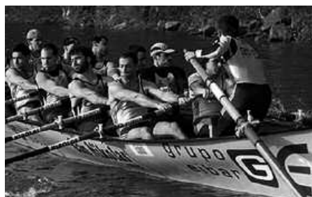
16:00etan hasiko da traineru ikuskizuna.

Aurreko astean 73 ziren izena emanda zeuden taldeak. Dagoeneko beste bost animatu dira. Beraz, partaidetzari dagokionez inoizko handiena izango da aurtengoa. Larunbatean arratsaldeko 16:00etan abiatuko dira lehen traineruak, itsasoa arazo ez bada behintzat. Bi ibilbide izango ditu aurtengo Jaitsierak: laburrena, Sariakolatik abiatu eta Oriara iritsiko da. 4.000 metrokoa, emakume, jubenil eta beteranoentzat.