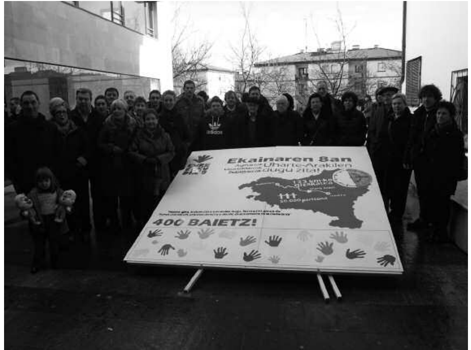
Giza-katean izena emateko aukera izango da igande honetan, Mikel Laboa plazan.

Gogoan izan, giza-katean parte hartzeko aurrez izena eman beharra dagoela. Herritar bakoitzak metro bat erosi behar du 5 eurotan. Trukean, 123 kilometro luze izango dituen ekimenerako motxila eta zapi bana jasoko du. Euskal Herri osoan gutxienez 50.000 lagun biltzeko erronka jarri dute antolatzaileek. Usurbilen 400 bildu nahi dituzte. Herritarrek jada apuntatzen hasiak dira. Ekainaren 8ko erabakitze eskubidearen aldeko ekimenean parte hartzeko eremua zehaztua dute usurbildarrek; Uharte-Arakilera gerturatu beharko dute.