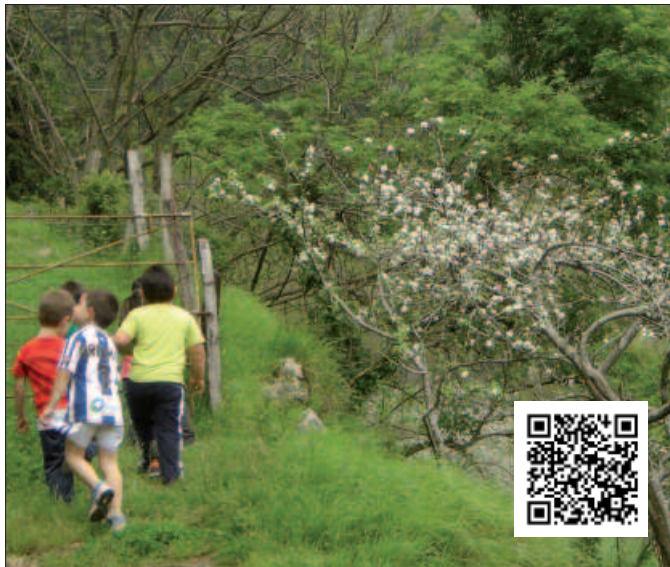
Otsailaren 28an amaituko da eskaerak aurkezteko epea.

Sagarrondoan landaketen prestaketa lanak urte naturalarekin bat ez datozenez, 2013ko azaroaren 1etik aurrera hasitako inbertsioak ere lagungarriak izan daitezke. Eskabideak egiteko epea otsailaren 28an amaituko da.