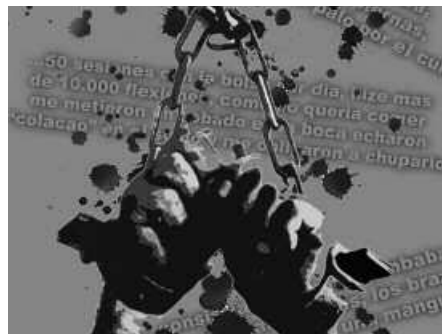
Igande honetan, 18:00etan emango dute bideoa.

Torturaren Aurkako Egunean harira, idatzi bat ere plazaratu dute antolatzaileek. Otsailaren 13an eta 16an kalera ateratzera deitzen dute, "torturak izan duen erabilpen politikoa agerian utzi eta herri honek bizi izan duen eta egun ere gure artean dagoen errealitate belduzko jendartearen zabal dezaz"