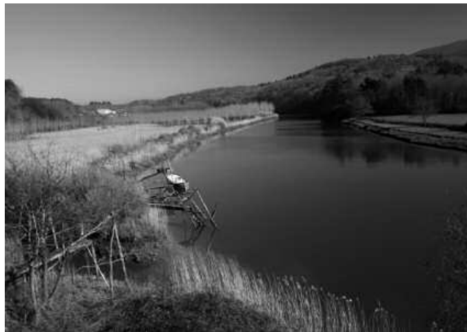
Irudian, Sariakolako aluneak.