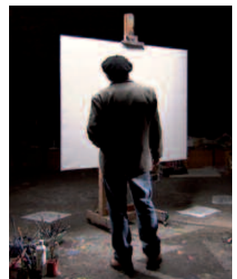
Otsailaren 17an emango dute filma.

Horregatik, dirua biltzeko elkartasun kanpaina bat antolatu dute. Eta Zinemaldiko film guztiak ikusteko 30 euroko bonoak ere salgai jarri dituzte.