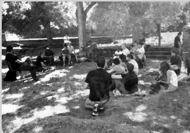
Uztailearen 7tik 11ra egingo dira udako eskolak.

Adin mugarik ez dute finkatu, "denak ongi etorriak izango zarete gure jakin mina asetzeko". Eus-