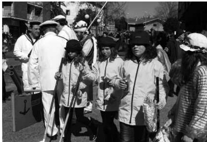
Martxoaren 1ean egingo da Inauteri Festa.

M artxoaren 1ean Usurbilen ospatuko dugun moztaroko festako otordua, Alkartasuna Kooperatibaren egoitza ohian egingo da. Usurbilgo Gazte Asanbladaren eskutik, herritar ororentzat merkea eta goxo askoa izango den menua dastatzeko aukera egongo da; paella, solomoa eta postrea. Guztia, 13 eurotan. Egunean zehar, kalean gora eta behera ibili ostean, indarrak hartzeko aparteko eskaintza.