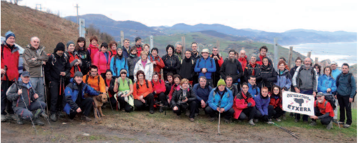
Zumaiatik Oriora ibilbidean 53 mendizale batu ziren.

M endizale koadrila galanta bildu zen igandean, Zumaia-Orio arteko ibilbidea osatzeko Andatzako kideek antolatu zuten txangoan. Bilguneak zintzilikatu