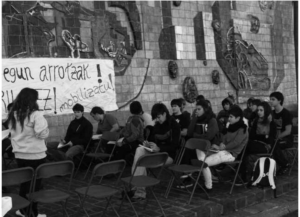
Duela hiru urte, Itayako komunikazio lan taldean proposatu zuten egitasmo hau. Atzeratzen joan da eta "egoskorkeriaz aurten antolatzea proposatu dugu", egitasmoaren sustatzaileek aditzera eman digutenez.

D enok dugu zerbait esateko. Hala diote antolatzaileek. Dakiguna besteei irakatsi diezaiokegu. Besteengandik ere beti izaten dugu zer ikasia; ikasketak, bizi esperimentziak, zaletasunak, abileziak... Zer partekatua badenez, herritarren jakinduria horri guztiari irteera eman nahi dio herriko gazte talde batek, datorren uztaileko, adin guztietako herritar ororentzat antolatzen ari den udako eskolatan. Ekimen honetako irakasle izan daiteke zuetako edonor. Eskolaren bat emateko interesa duzuenontzako izen ematea ireki dute jada. Librean izango da parte hartzea, gaia edo eskola formatua. Zehaztasun gehiago, lerrootan.