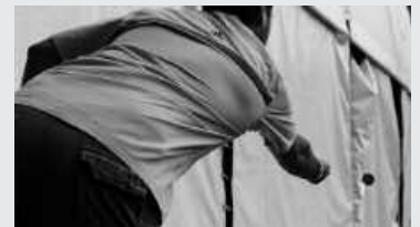
Mus, igel eta toka txapelketak iragarri dituzte datozen egunetarako.

Bazkideen arteko joko gehiago antolatu dituzte datorren asteko. Musa, otsailaren 18rako, igel eta toka jokoak otsailaren 20rako. Saio guztiak, arratsaldeko 16:00etatik aurrera, Artzabalen. Otsailaren 20ko jokoaren amaieran, sariak banatuko dira eta askaria dastatzeko aukera izango dute, txapelketa hauetan parte hartu duten lehiakide guztiak.