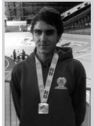
Jubenil eta junior mailetako marka ezarri du 400 metrotan.