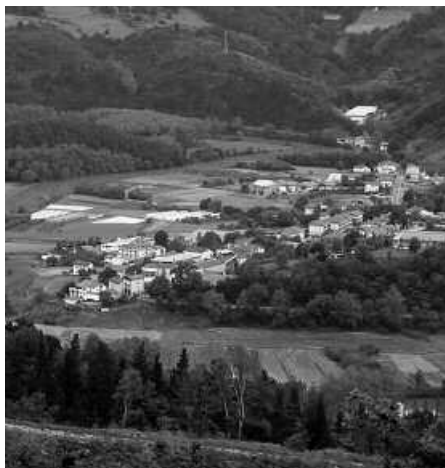
Sariolatik abiatuko da ibilbidea eta Aginagako kaxkoan amaituko da.

Irteeran parte hartu nahi duzuenentzat: otsailaren 23an, goizeko 9:30etan Sariakolan.