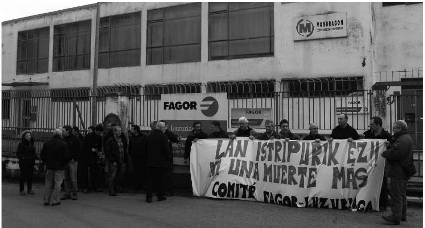
Lan istripuak salatzeako elkarretaratzeak egin ziren Luzuriagan.

U rtea hasi zenetik lan istripuek eragin duten seigarren heriotza salatu zuten usurbildarrek otsailaren 12an, Mikel Laboa plazan egin zen elkarretaratzean. Oraingoan ezbeharrak herriko enpresa batean gertatu baitzen; Luzuriaga lantegian, urtarrilaren 30ean. Biktima, 38 urteko errumaniarra. Alduntzar azpikontratarako lan egiten zuen. Urtarrilaren 30ean, makinen prebentzio lanetan ari zela lubaki batera erori zen. Geroztik, zainketa intentsiboetako unitatean egon da egoera larrian. Joan den aste hasieran hil zen.