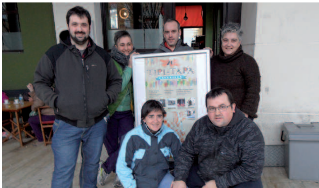
Tabernariak ere mozorrotu egingo dira Inauterietan. Eta Erdi Aroz apainduko dute taberna Txapeldun, Artzabal, Xarma, Bordatxo, Txirristra, Aitzaga eta Txiribogan.

Zaku eta kukurutxo koloret-suekin HH-koak, LH-koak itsasoari loturiko jantziekin, eta DBH-koak komikiko pertsonaiez mozorrotuko dira, otsailaren 28an. Ohi bezala, Udarregi Ikastolako ikasleek emango baitiote ongi etorria Usurbilgo inauteriei. Kalejiran lehenbizi, eta Kiroldegiko ikus-