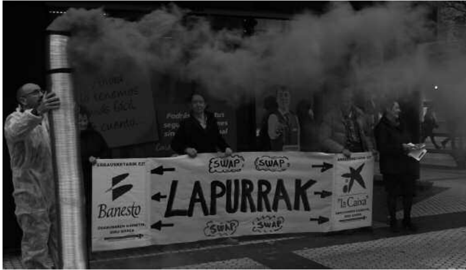
Protesta egin zuten aurreko astean, Donostiako hainbat bankuetxeren atarietan.

Aurreko legegintzaldian Foru Aldundiak eta Gipuzkoako Hondakinen Kontsurtzioak, Europako Banka Publikoa, La Caixa eta Banesto bankuekin sinatu zituzten maileguok etetea eskatu zuen otsailaren 14an, Erraustetaren Aurkako Herri Plataformen Koordinakundeak, Donostiako Askatasunaren Hiribidean burutu zuen protesta ekintza baten bidez.