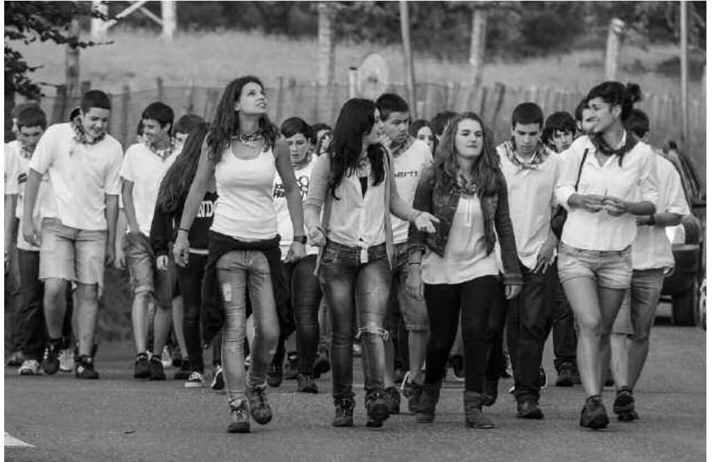
Irudian, oilasko biltzaileak.

Eta bileraren helburuak ere aurreratu dituzte: "Bi lan egin nahi dira bilerara honetan. Santixabeletako egutegia finkatu eta jaietarako proposamenak bildu".