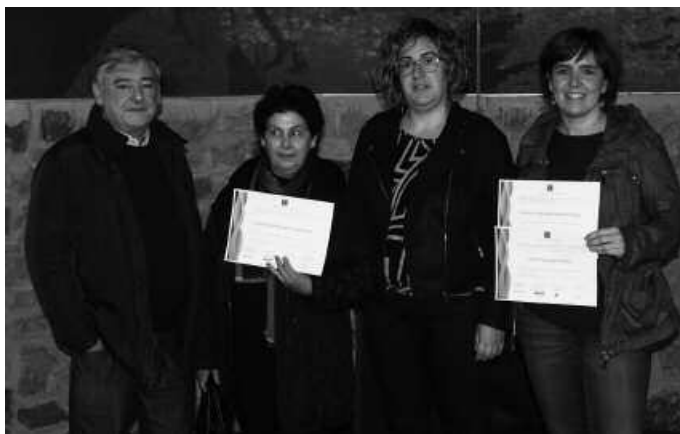
Saizar sagardotegia, Barazar landetxea, Aginaga sagardotegia eta Aginaga hotela diploma banarekin saritu dituzte.

J atetxeak, sagardotegiak, pintxo-tabernak, hotelak, pentsioak, nekazalturismoak, landa etxeak, museo eta interpretazio zentroak... Guztira 28. Donostialdeko 28 establezimenduk Kalitate Turistikoarekiko Konpromisoaren bereizgarria lortu dute. Bereizgarria bera, agiri moduan jaso zuten astelehenean, Urnietako Oianume jatetxean ospatu den ekitaldian; besteak beste, Usurbilgo Saizar Sagardotegiak, Zubitako Barazar Landetxeak, Aginaga Sagardotegiak eta Aginaga Hotelak. Baita, ekitaldia ospatzeko hautatu den kokaguneak ere; Oianume Jatetxeak