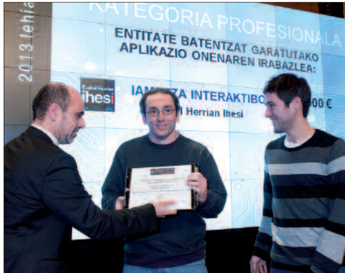
2013ko aplikazio onenen artean saritu du Gipuzkoako Foru Aldundiak.

Hasieran sinistu ezinik, oso gustura. Gauzak egiten segitzeko beste ilusio bat ematen du.