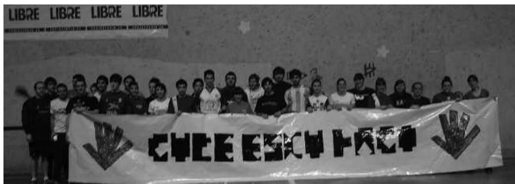
Aurreko ostiralean, kirol ekitaldi ugari egin ziren frontoian. Atxikimendua ere agertu zioten Gure Esku Dago ekimenari.

Gure Esku Dago Usurbilek antolatuta, ekainaren 8an Durango Iruñearekin lotuko duen giza-katea girotzeko kirol ekimenak antolatu zituzten frontoian, joan den otsailaren 14an. Parte hartzaileak, herriko kirol taldeetan dabilzan lagunak izan zi-