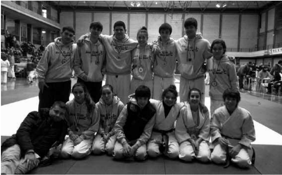
Azken asteotan, emaitza ederrak erdietsi ditu Judo Taldeak.

Ohi bezala, garaipen kopurua zenba ezina da Usurbil Judo Klubean. Jarraian datoz, azken asteotan jokatu dituzten txapelketen emaitzak: