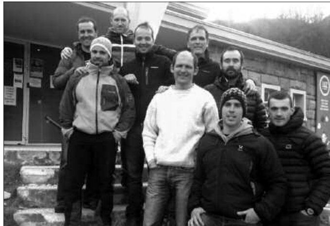
Argazkian usurbildarrak, eta eurekin partehartu zuten lagunak.

Hasiera batean Pic du Midi Bigorrera igotzeko asmoa zuten baina haizea eta elurraren baldintzak ez zirenez egokienak ibilbidea aldatu egin zuten. Parte hartu zuten usurbildar