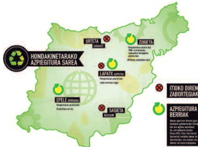
Azpiegiturok Europako Zuzentaruak zehazturiko Hondakinak Kudeatzeko Hierarkia zorrozki beteko dutela dio Gipuzkoako Hondakinen Kontsordioak.

Zabortegeiak itxi eta tratamendu planta berriak eraiki ostean, itxuraldaketa nabarmena izango du Gipuzkoako hondakinen kudeaketaren mapak. Aurrerantzean, 20 Garbigune, paper eta ontzi arinentzak bi planta, 4 transferentzi estazio edota hiru konpostatze gune izango ditu herrialdeak; Lapatx, Epele eta Zubietakoa. Zubietan hain zuzen, Gipuzkoako Hondakinen Kudeaketarako Zentroan bihurtuko da. Konpostatze planta nagusia kokatuko da bertan, eta jada erraustuko ez den erreusarentzat tratamendu mekaniko-biologikorako planta bat eraikiko dute. "Tratamendu mekaniko-biologikoaren bidez materiaren zati bat berreskuratuko da,