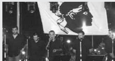
L'Arcusgi taldea arituko da martxoaren 14an Iruinen egingo den kantu afarian.

21:30 Kantu-afaria Iruin sagardotegian, L'Arcusgi taldekoekin eta Kuxkuxtu txarangarekin. Txartelak salgai: martxoaren 9ra arte, Lizardin eta Artzabalen. Prezioa: 25 euro.