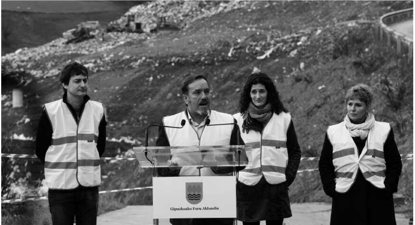
Zarauzko Urteta zabortegian aurkeztu zituzten eraiki asmo dituzten tratamendu plantak.

G ipuzkoako hondakinen kudeaketa aldatuko duen data bat finkatua dute jada; 2015. urte amaiera. Ordurako, egun irekita jarraitzen duten Gipuzkoako hiru zabortegiak itxiko dituzte, Zarauzko Urteta, Azpeitiko Lapatx eta Beasaingo Sasietako zabortegiak. Eta ordurako, martxan egongo da hondakinak kudeatzeko azpiegitura sare berria.