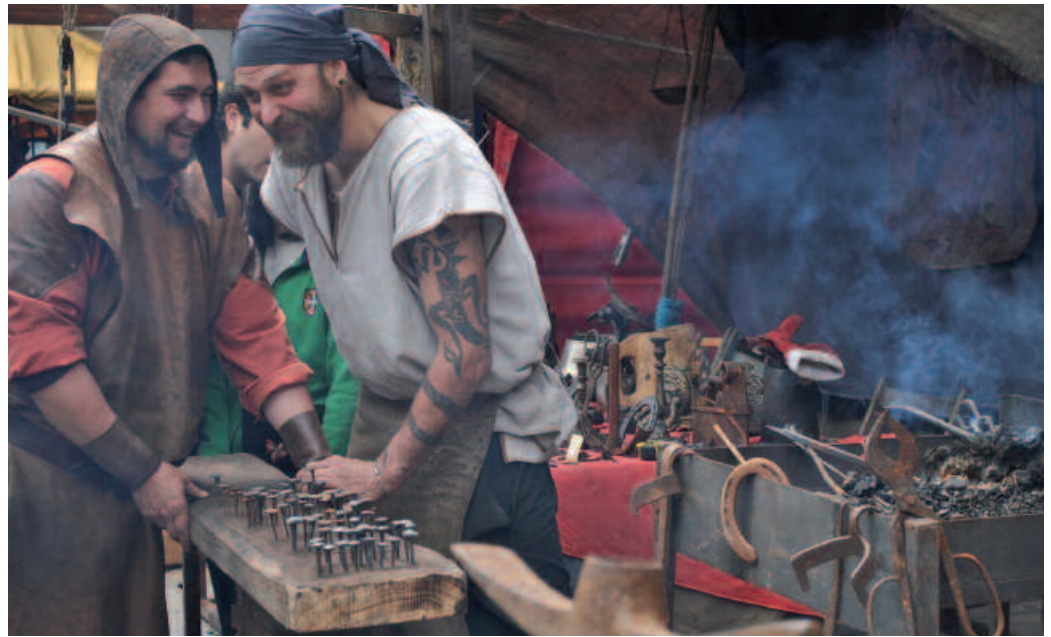
Mozorro gisa, Erdi Aroko jolas hau txarra ez. Hori bai, ordu txikietan peligro handia izan dezake.

Eta bakoitzak bere ekarpena egin du. Inauteri Festa egunez girotuko duten kalejiretako bat, lehena, larunbat eguer-