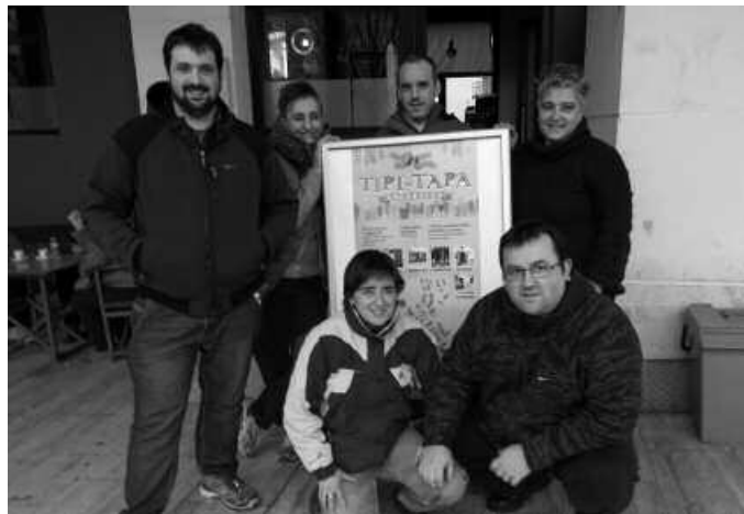
Burrunbazale txarangaren kalejira Tipi-Tapako zazpi tabernetatik igaroko da.

Ohi bezala, goizaldeko ordu txikiak arte luzatuko da martxoaren 1eko Inauteri Festa. Zazpi tabernok, ordu gutxira prest beharko dute guztia, biharamunari ekiteko; biharamunean, martxoaren 2an, Tipi-Tapa ekimenaren hamahirugarren edizioa ospatuko baita.