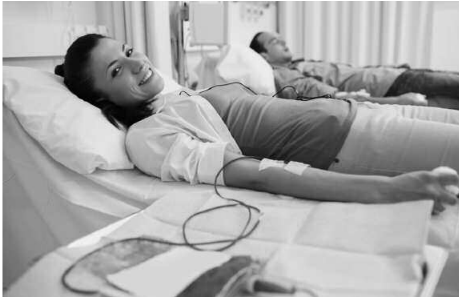
Astlehenean odola emateko aukera berri bat izango da, anbulategian.

H elburua, urte amaierarako bete nahi luke Gipuzkoako Odol Emaileen Elkarteak. Alegia, 18-65 adin tarteko herrialdeko biztanleriaren %3 odol-emaile izatea lortu nahi dute, urtean gutxienez behin edo bitan odola ematera animatzea. Boluntarioak erakartzeko Gotatanta izeneko kanpaina berria jarri dute martxan. Egitasmoari buruzko informazio gehiago: gotatanta.com atarian, Gotanta izenez Facebook edo Twitter sare sozialetan edo 943 317 091 telefono zenbakian.