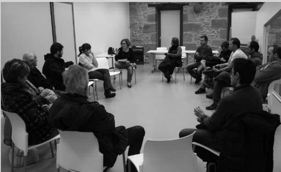
Astelehenean burutu zen Santixabelak prestatzen hasteko Jai Batzordearen urteko lehen bilera. Herriko jai egunak finkatu eta jaietarako proposamenak jasotzen hasi zen, Potxoenean bildu zen taldeak.