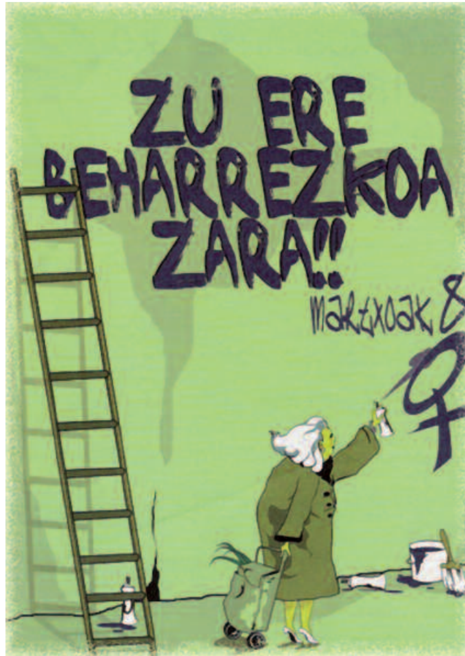
“Uste baino gehiago egin dezakegu guztiok”, Gazte Mugimendukoek esana.

Gizarte honetan emakumeok prekaritatean bizitzera kondenatuta gaude eta esan bezala, langabeziak emakume aurpegia izaten jarraitzen du. Hor goian aipaturiko “lan” edo en-