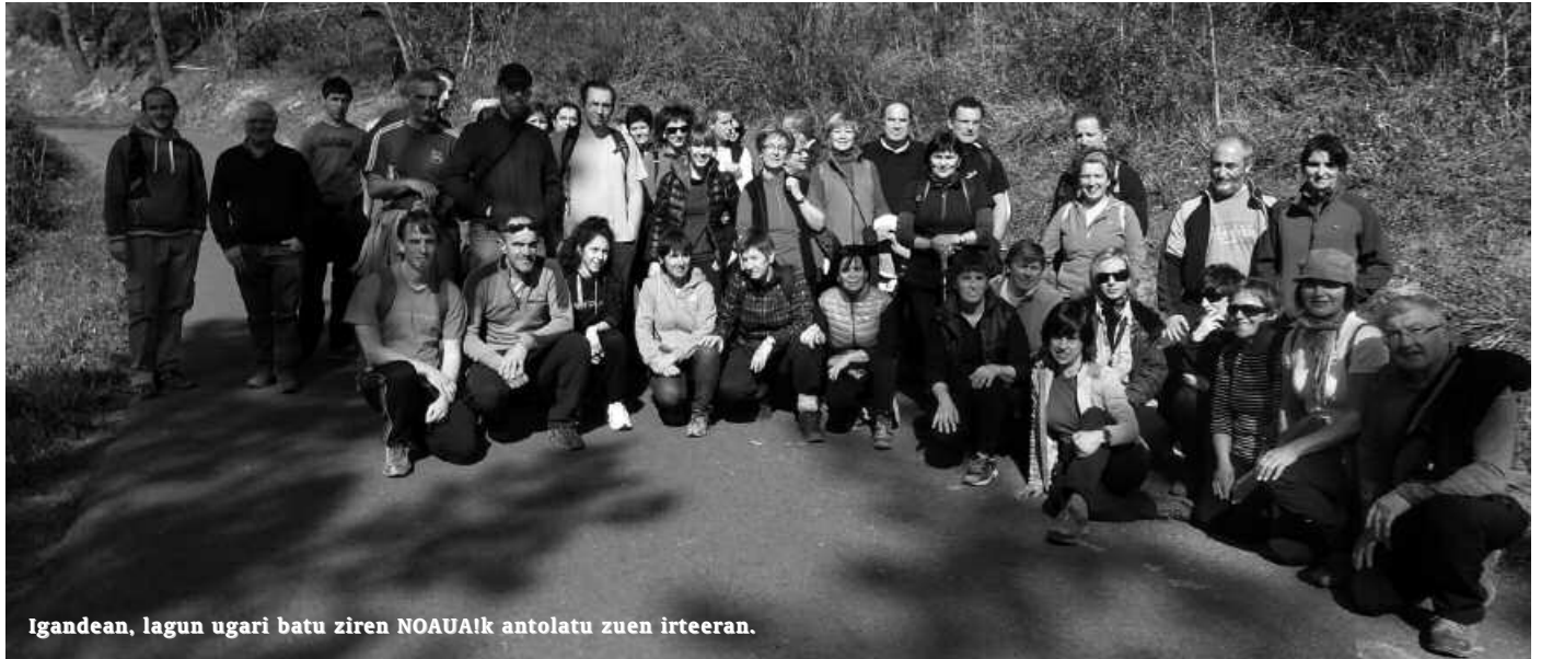
Igandean, lagun ugari batu ziren NOAUAk antolatu zuen irteeran.

B errogeitik gora lagun bildu zituen NOAUA! Kultur Elkartek joan den igandean antolatu zuen txangoan. Aginagako ondarea ezagutzera, bertako errio bazter, baserri, landa inguruetaz zerbait gehiago ikastea zen helburua. Eta azaroan Kulturaldiaren baitan antolatu genuen paseoan gertatu moduan, interesa piztu zuen ibilaldi honek ere.