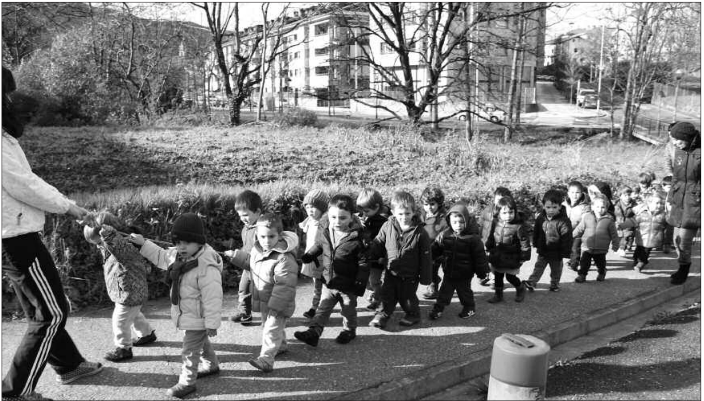
“Negua izan arren, kalera irteteko aukera izaten ari gara, a ze zorrea!”.

K aixo lagunak, hemen gatoz berriz ere zuekin lerro batzuk tartekatuzera.