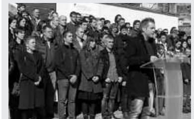
Ordizian egin zuten iragarpena.

Ordiziako bilkuran, bideratu asmo dituzten dinamika posible hauek erezeintzukizan daitezkeen iragarri zuten. Interneten, udalek .eus domeinua hartzea euren webgunerako eta domeinu hori gizarteratu nahi dute. Bestalde, euskal ikuraren erabilera sustatu nahi dute. Eta honez gain, Udalbiltzatik berri eman dutenez, "Euskal Herritartasuna publikoki adierazteko agiria ofizial baten sorrera sustatu nahi dugu, bere izapidetzea prestatu, erabilera bermatu, bidegarritasuna... Halaber, Euskal Herrian bizi garen pertsona guztien hizkuntza, kultura eta jatorri aniztasuna bermatu nahi dugu, eta teknologia aldetik agiria interaktiboa izatea bilatu".