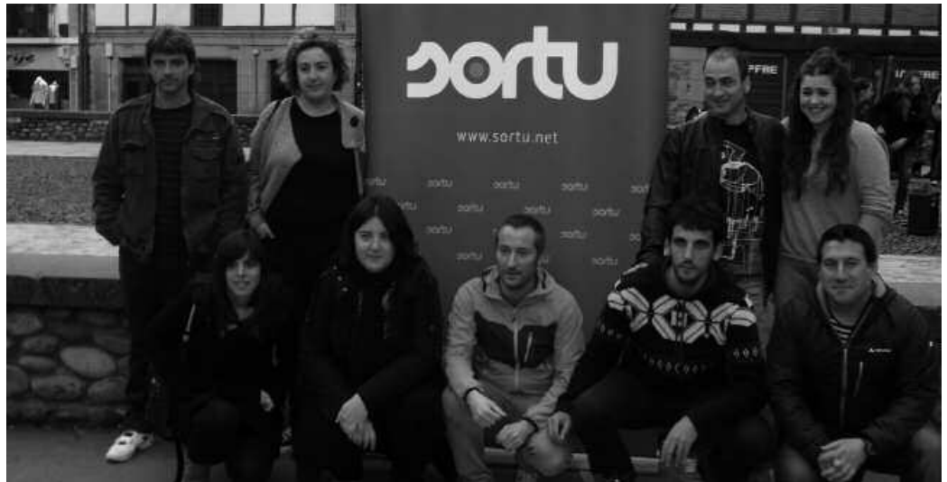
Larunbat honetan batzarra egingo dute. 10:00etatik aurrera Artzabalgo ekitaldi aretoan.

Ondo baloratzen da koalizioa. Sorturen ildoetako bat elkarlana eta indar metaketarena da. Eta Euskal Herrian ezker eta abertzalea zabal da, anitza. Eta hori aberastasun bat bada Euskal Herriko ikuspegi politikotik. Une honetan gainera, oso garbi dago biltzen gaituena askoz gehiago dela bereizten gaituena baino. Eta bai gure aldetik eta bai beste indarren gaitik, sintonia handia dago, bai analisiak egiterakoan baita aurrera begirako pausoak markatzerakoan. Gainera komeni zaigu, ez bakarrik Euskal Herri mailan, herri mailan ere elkarlan hori positiboa da zentzu guztietan. Guretzat apustu bat da, horrek ere behartzen gaitu beste taldeekin sintonia bat bilatzera eta aberastasun bat ekartzen digu.