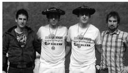
22-16 nagusitu ziren finalan.