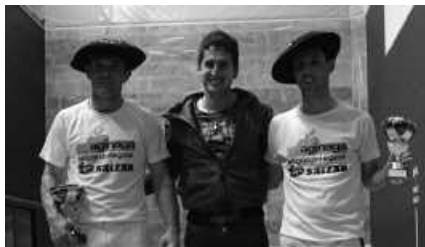
Iruran jokatu zen finala.

Usurbilgo Huizi-Landa bikoteak Gipuzkoako Trinkete Txapelketako finala irabazi du. Villabonako Arruti-Esnaola bikotearen aurka nagusitu ziren. 40-29 azken emaitza.