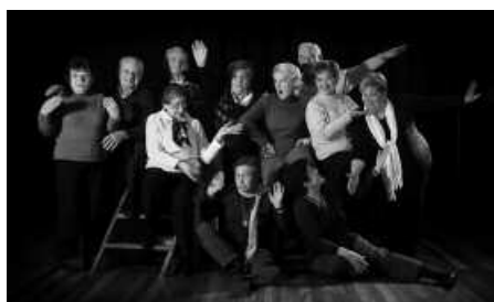
Martxoaren 20an Oñatiko antzerki talde hau arituko da Gure Pakean.

9:00 Irteera (Usurbilgo tren geltokitik): Zarautz-