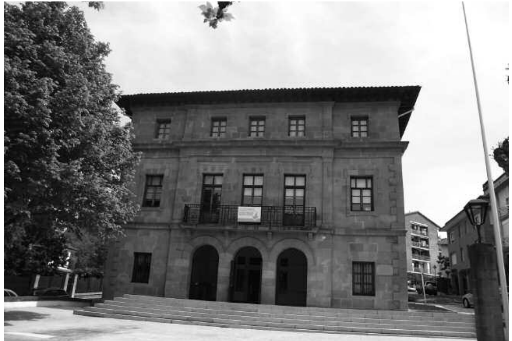
Plana herri eragile eta udal zerbitzu ezberdinetako ordezkarien ekarpenekin osatu da.

Gaiarekiko ikuspegi zabalagoa Mendekotasuna eragin ohi duten substantzia legal zein ilegalean aurrean prebentzioa bultzatuzetik haratago doa egitasmo berri hau. Ikuspegi orokorragoa du; alkoholak, tabakoa, kanabisak, kokainak, anfetaminak