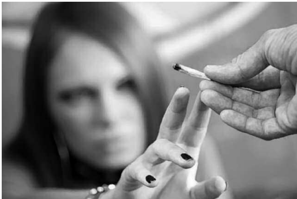
DBH2n, adibidez, euren adinean ez dutela ia kontsumitzen aipatzen dute.

Ezagutzari loturiko erantzunetan aipatu dituzten substantzien zerrenda nabarmen luzeagoa da, kontsumoari loturiko erantzunetan adierazi dutena baino. DBH2koen kasuan adibidez, euren adinean ez dutela askorik kontsumitzen aipatzen dute.