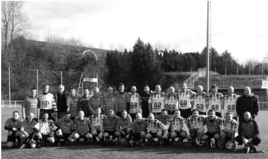
Markinako Artibai taldearen aurka bi partida jokatu dituzte Usurbil FTko beterranoek.

Gustuko zaletasunaz ez dira ahaztu, joan den irailan Haranera itzuli eta Usurbil FT-ko beterranoen taldea osatu zuten ondoko argazkiko kideek. Ostiralero biltzen dira futboleko jokatzeko eta lagun arteko bi partida ere antolatu dituzte Markinako Artibai Taldekoren aurka. Lehenengo neurketa abenduaren 22an jokatu zuten etxean, Haranaren. Ordukoa da ondoko irudia. Bigarren partida,