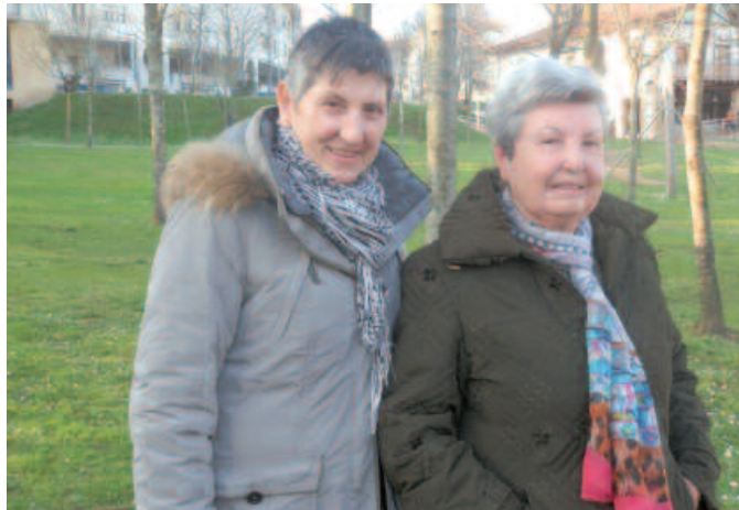
“Usurbildarrek oso ondo erantzuten dute Gabonetako kanpainan”.