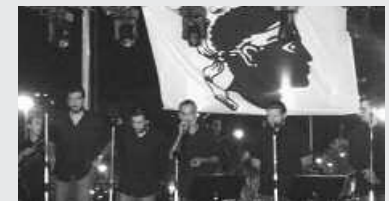
L'Ascurgi taldea arituko da ostiral honetan, Sutegin.

21:30 Kantu-afaria Irui sagardotegian, L'Arcusgi taldekoekin eta Kuxkuxtu txarangarekin. Txartelak salgai: martxoaren 9ra arte, Lizardin eta Artzabalen. Prezioa: 25 euro.