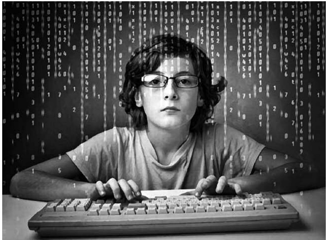
Teknologia berriek mendekotasuna eragiten dutela uste dute, baina era berean konektatuta egotea beharrezkoa zaie.

I a denek dute mugikorra edo Interneta etxean. Bost minuturo mugikorrari begira daude, egunero ordu bate edo bi ordu Internetera konektatuta igarotzen dute. Teknologia berriok mendekotasuna eragiten dutela uste dute, baina era berean mugikorraren bidez sarera konektatuta egotea beharrezkoa zaie. Mendekotasun arazoan gainean informatuta daude eta arazorik izanez gero, badakite norengana jo laguntza eske. Hala diote behintzat, Usurbilgo Udalak aho batez onartu berri duen "Mendekotasunen Prebentzio-rako Usurbilgo I. Udal Plana" osatzeko Udarregi Ikastolako DBH 2,3 eta 4.mailako 140 ikasleei egin zaien inkesta bateko emaitzek.