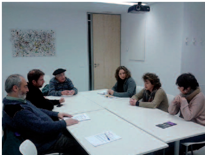
Potxoenean egin zen Batzar Nagusia, iragan astelehenean.

Argitalpenen arloan, astekaria sendotu eta noaia.com berritza izango dira erronka nagusiak. Dagoeneko sarean da noaia.com berriua eta laster emango ditugu aditzera web orriaren inguruko xehetasun gehiago.