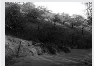
Otsaila hasieran lurjausia izan zen Urkamendi eta Imindos lotzen dituen bide ondoan.

Urkamendi eta Txantxon arteko bidean, "berriki egin diren lanak amaituta zeuden baina, azken euriteek sortu dute urak bide azpitik bideratzea, eta bidea oraindik arriskuan egon litekeela ikusirik, beste obra osagarria egin behar da bidea erabat sendotzeko. Lan hauek ere hasi dira eta Bergaretxe enpresari adjudikatu zaizkio eta gutxira 15.019,17 euro da aurrekontua", berri eman du usurbil.net web orriak.