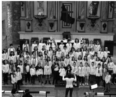
Zumarte Abesbatza Hondarrribian izan zen aurreko asteburuan. Ikasitakoa Amute auzoko elizan erakutsi zuten, kontzertu batean.

22:00 Pop-rock taldeen kontzertua frontoian. Ixak-