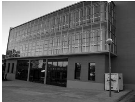
Igoera fasea Oiardo kiroldegian jokatzeko eskaera egin dute Espainiako Federazioan.