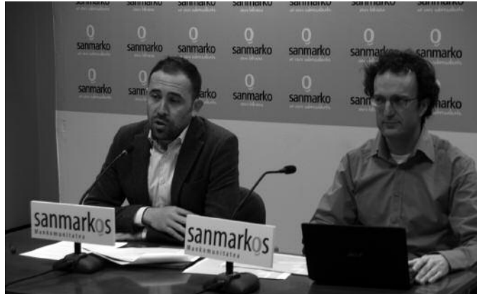
Aurreko astean eskaini zituzten datuak San Marko Mankomunitateko egoitzan.

Hondakin zatika, nabarmen geratzen da baita, atez ateko bilketa sistemak mankomunitate mailako datuetan duen eragina. Iaz, 4.911 tona organiko bildu ziren San Markon. Hortik, hiru laurdenak, 3.699 tona (%75,4) atez ateko bilketa sistema martxan den bost udale-