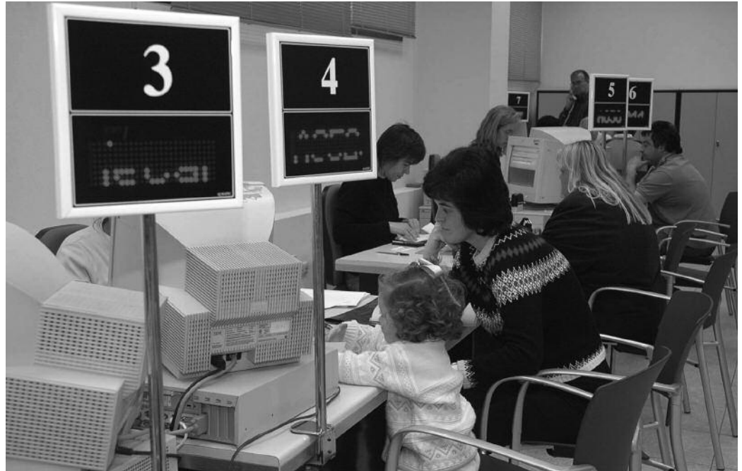
Informazio gehiago zabaldu asmoz, esku orriak banatuko ditu udalak etxex etxe.

O gasunarekin iazko diru kontuak argitzeko unea ate joka dugu. Apirilaren 7an abiatuko da 2013ko Errenta Aitorpenari loturiko kanpaina. Usurbilgo Udalak diru kontuak euskaraz argitzeko gonbita luzatzen die herritarrei. UEMA eta Buruntzaldeko beste udalekin batera, beste urtez batez, alor honetan euskararen erabilera sustatzeko kanpaina abiatu du. Egitasmo honek, bere baitan hartzen ditu herritarrak, erakundeak eta banke txex zein artezkaritza zerbitzuak eskaintzen dituzten guneak. Tokiotara egitasmo honetan parte hartzera gonbidatzeko gutunak bidaliko ditu Udalak.