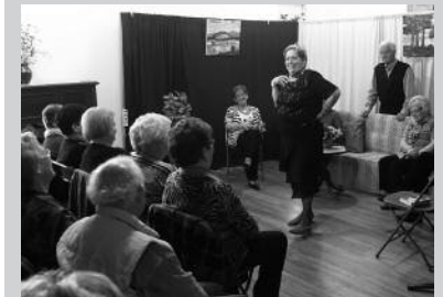
Oñatiko Jubilatut Taldea izan zen Artzabalen.

Oñatiko jubilatut taldea gonbidatu zuen Gure Pakea Elkarteak joan den Jubilatut Astea. Aretoa bete zuen antzezlan eskaini zuten. Emanaldi honez gain, Zumaia txangoa edota osasunari loturiko hitzaldiak antolatu zituzten. Urtero moduan, Aialde-Berri sagardotegian, bazkari eder baten bueltan amaitu zuten Jubilatut Astea.