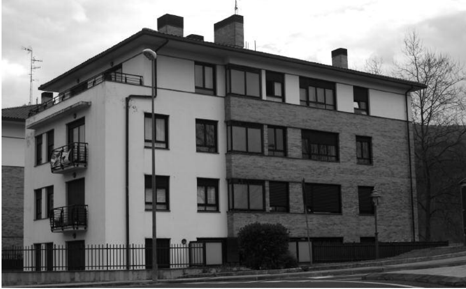
Guztiak bi logelako pisuak dira, bere aparkalekuarekin.

Jada martxan den esleipen prozesu honetako oinarriak, martxoaren 21eko Gipuzkoako Aldizkari Ofizialean kontsultatu ditzakezue. Iragan larunbatz geroztik, martxoaren 22tik zenbatzen hasita, apirilaren 10era arteko tarteak dute interesdunek, Usurbilgo Udaleko erregistrora joan eta eskabideak eta dokumentazioa aurkezteko. Eskabide orriak eta oinarrien inguruko informazioa udal erregistroan jaso daitezke.