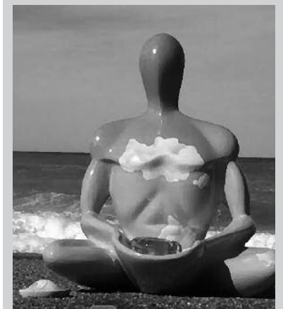
Apirilaren 5ean egingo da hitzaldia, 19:00etan Sutegin.

Informazio gehiago: budacuantico1@gmail.com Facebook-en, "Buda Cuantico".