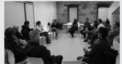
Datorren astelehenean egingo da bilera, 18:00etan Potxoenean.

Jai Batzordearen bilera astelehenean, martxoak 31, arratsaldeko 18:00etan Potxoenean. Jaietako prestaketa lanak lotzen jarraituko dute Jai Batzordeko kideek. Santixabelak aurren, uztailearen 1etik 6ra. Laster gainera, festetako egitarau diseinu lehiaketan parte hartu eta txupinazorako proposamenak biltzeko deialdi bana egitekoak dira herritarrei.