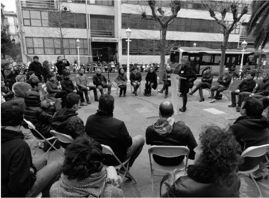
Estatuko abokatuak 26 udal eta erakunderi errekerimenduak bidali dizkie.

az, Gipuzkoako 11 udal salatu zituen Estatu-ko abokatuak eta aurren, 26 udal eta erakunderi errekerimenduak bidali dizkie, kontratazio publikoetan euskara normaltzearen aldeko hizkuntz irizpideak ezartzeagatik. Errekerimenduren bat jaso duten erakundeei, euskararen normaltzea sustatu asmo duten hizkuntza irizpideak bertan behera uztea eskatzen zaie.