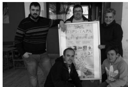
Arrautzekin eginiko zizka-mizkak. Apirilaren 6ko Tipi Tapan, hori emango dute dastatzera.