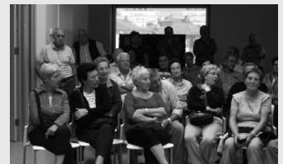
Aurreproiektua prest du Diputazioak eta apirilaren 7an aurkeztuko du Usurbilen.

Gipuzkoako Foru Aldundiak urrian abiatutako parte hartze prozesuaren baitan kokatzen den bigarren faseari loturiko saioa, apirilaren 7an, 18:30ean Potxoenean. 3.000 gipuzkoarrek baino gehiagok, usurbildarrek tartean, lehen fasean eginitako ekarpenen %75arekin osaturiko aurreproiektua aurkeztuko du Diputazioak, hemen eta beste 55 udalerrietan. Prest dute aurreproiektu honen inguruko herritarren iritzia biltzea da datorren bilkuren helburu nagusia.