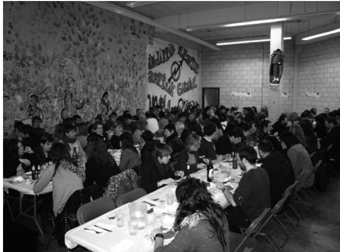
Giro ederra sortu zen gaztetxean, bertso-afarian.

B atukada saioarekin hasi zen joan den larunbateko Gure Esku Dago Eguna. Gauean, afaria eta bertso musikatuaren emanaldia ospatu zen Usurbilgo Gaztetxean. Antolatzaileak gustura dira, ekimenak izan zuen harrerarekin. "Horrelako beste bat egin beharko dugu ba ezta? Ederra giroa larunbatekoa! Eskerrik asko sukaldari, bertsolari, gai jartzaile, musikari... eta hurbildu zineten guztioi! Aupa Usurbil, gure esku dago! Zure esku ere badago!", diote Gure Esku Dago Usurbil lan taldeko kideek, sare sozialen bidez.