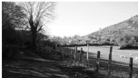
Apirilaren 13an izango da irteera.

Apirilaren 13an, igandez. Martxoan eginiko Belate-Arraras ibilbidearen jarraipena egitea proposatzen diete mendizaleei. 21 kilometrotako txangoa. Joan etorria autobusez egingoenez, aurrez eman beharko da izena, apirilaren 9a baino lehen, Andatza Mendizaleen Kirol Taldeak Kutxabanken duen kontu zenbaki honetan: 2095 5069 07 1068489805. Andatzako bazkideek eta langabetuek 12 euroko ordainketa egin beharko dute, 15 euro gainerakoek. Plazak mugatuak izango dira. Lehenetsuna, Andatzako kideek izango dute.