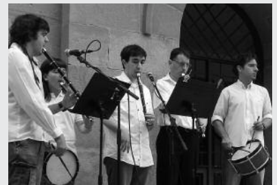
Maiatzaren 15ean amaituko da lehiaketara aurkezteko epea.

Datorren astelehenean, apirilak 14 astelehena, 18:30ean Potxoenean. Bilerara gerturatzeko deialdi irekia egin dute Txosna Batzordetik.