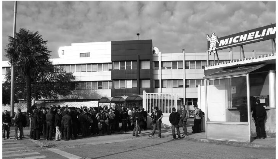
CCOOk eta UGTk Michelinekin adostu zuten akordioak "pertsona bajaran dagoen momentuak ez ditu errespetatzen", LABek salatu duenez.

Zentruarteko Komiteak sinatutako akordioak aipatu moduan, Michelinek estatu espainiarrean dituen lantegi guztiei eragiten die. Baita hemengo Michelineko 550 langileei ere. Sindikatu aberzalearen esanetan, auzitegietara eraman duen akordioak, "Sistema Plusean %40rainoko soldata jaitziera ekarri du, urteko lanaldia luzeago izanik". Honez gain, 79 lan egutegi dituzte aukeran, "haue-tariko bakoitzak bere urteko lanaldi eta Sistema Plus ezberdina dituelarik". Akordio berak, urtean zehar 20 egun gehiagoz lan egin edo 30 lan egu-