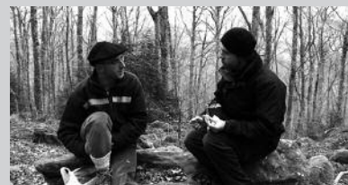
"Asier ETA Biok", maiatzaren 9an Sutegin.

Eta maiatzaren 10ean larunbata, Txalo konpainiaren "Hiru" antzezlanaz ikus ahal izango dugu Sutegiko auditorioan, 22:00etan hasita. Xehetasun gehiago, datorren NOAUA!n.