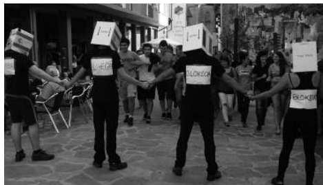
Apirilaren 24 eta 25erako Topaketak antolatu dituzte Usurbilgo Ernaiko gazteek.

Udaberriaren kaleak eta buruak bor-borka jarri nahi ditugu, gazte ezberdinok ditugun burutazioak burutakzio bihurtuz, egunez egun, urratsez urrats. Testuinguru honetan, ezinbestekoa da gazteok elkartu, elkarrekin hausnartu eta gure burutazioak elkartrukatzeko denbora hartzea. Horregatik, apirilaren 24