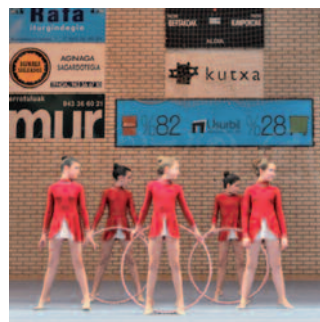
Tximeletakoak ere batu dira Dantza Eguneko ospakizunetara.

16:20-17:30 Benjaminak: pelota eta uztai.