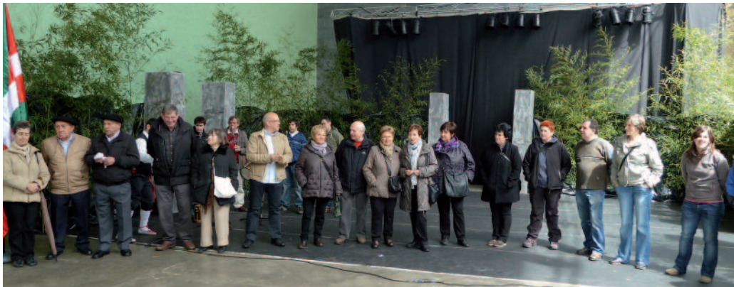
Iaz omenaldia egin zuten frontoian. Aurten ere, ekitaldi ikusgarri ugari antolatu dituzte.

Estilo ezberdinak lantzen diharduten herriko taldeak bilduko ditu, larunbatean ospatuko den II. Dantza Egunak. Jaialdi anitza izango da beraz. Antolatzaileek emandako bi datu; arratsalde partean frontoian izango den emanaldian, guztira 130 bat lagunek parte hartuko dute. Gauerako prestatzen ari diren ikuskizunean, beste 80 usurbildarrek.