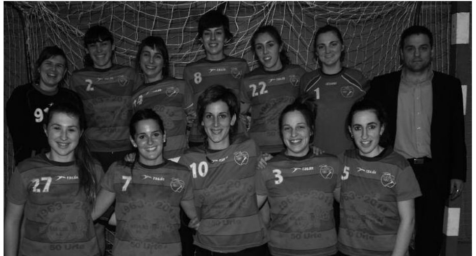
Elkarrizketa osoa web orrian irakur daiteke, noaua.com helbidean.

Usurbil Kirol Elkarteak, 50. urtemugako denboraldia ezin hobeto borobiltzeko bidean da. Senior mutilak 1. nazional mailara igora prestatzen dabilta. Eta senior neskek, Euskadiko Txapelketako azken fasea jokatu dute asteburu honetan. Jokalari kopuru aldetik justu samar ibili den taldeak, egin duen ahalegina ez da nolanaikoa. 21 neurketetatik 19 irabazi ditu, 7-8 jokalarirekin. Orain, azken saiakera egitea baino ez zaie geratzen, Euskadiko onenak izateko. Senior neskei babes eta animu guztia emateko, kiroldegira joateko gonbita luzatzen dute Usurbil Kirol Elkartetik. Beranduenez, igande eguerdian jakingo da, garaipena usurbildarrena izango den.