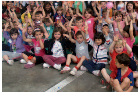
Ostiral honetan, apirilak 11, amaituko da Udajolasen izena emateko epea.

9:00-13:00 Txokoak Aginagan. Antolatzailea: Aginagako Eskola Txikiko Guraso Elkarteak.