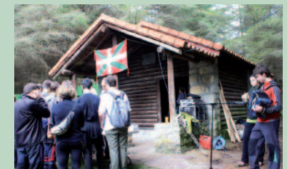
Maiatzaren 4an izango da Andatza eguna.

Apirileko irteera honen ostean, maiatzeko hitzordua dator. Tradizio luzeko ospakizuna; Andatza Eguna, maiatzaren 4an.