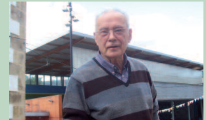
Apirilaren 15ean zabalduko du erakusketa.

-Larunbat, igande eta jai egunetan: 11:00-13:00.