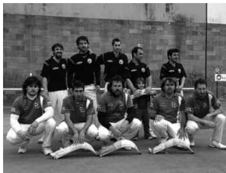
Uztaritzeko Kapito Harrik, eta aurtengo txapeldunak, Donibane Lohitzuneko Luzaz Gazte.