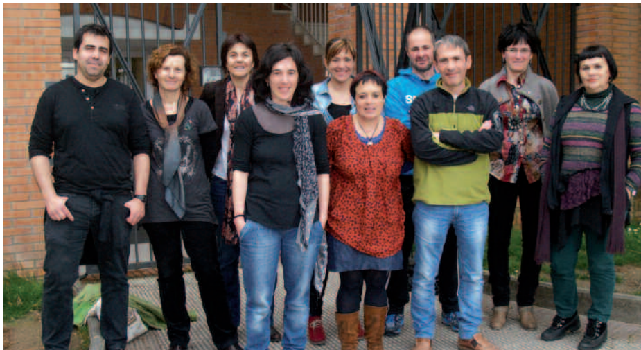
Aurten Orion da baina 2015ekoa Usurbilen izango da eta prestaketa lanak hasi behar dira.

2015ean Usurbilen ospatuko den Kilometroak jaialdirako eta egun horren aurretik, urtean zehar bideratu beharko diren prestaketa lan eta ekimenetarako herritarren laguntza behar du Udarregi Ikastolak. Hainbat lan batzorde osatu asmo dituzte, ardura hauei guztiei heltzeko. Jarraian zerrendatuak ageri diren taldeotan parte hartzerantz animatzen dituzte herritarrak. Lanean hasteko izen ematea ireki dute jada. Udarregi Ikastolako web orriari sartzen bazarete (udarregi.com), bertan dagoen apuntatzeko inprimakia beteta eman dezakezue izena. Edota Udarregi Ikastolako idazkaritzara deituta, 943 36 12 16 telefono zenbakira.