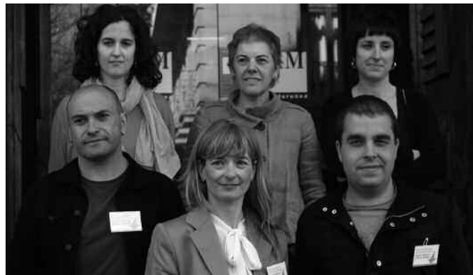
Helegitea aurkeztu dutenen artean da Usurbilgo Udala.

Kalkuluaren arabera, dagokiena baino gehiago ordaindu beharko lukete atez ateko bilketa sistema indarrean duten sei udalerririk; atez ateko bilketak berak eragindako gastuak, eta gainerako udalerrietan martxan