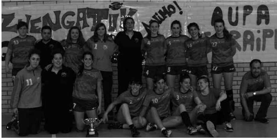
Euskadiko txapeldunorde izan dira eta orain Espainiako sektoreko azken fasea jokatu dute.

Euskadiko txapeldunorde berriak ditugu Usurbilgo senior nesken eskubaloia taldekoak. Eta Espainiako sektorea jokatzeko aukera irabazi dute, apirilaren 11tik 13ra Oiarde Kiroldegian ospatu zen Euskadiko txapelketako azken fasean, IES Construcción talde arabarraren atzetik sailkatu ostean. Jokalari kopuru aldetik zuten muga, denboraldi gogorraren eraginez zuten nekea, ez dira inolaz ere oztopo izan, emaitza ezin hobeak lortzeko. Eta hala ospatu zuten apirilaren 13an, jai giroa lehertu zen txapelketa amaieran. Pozik asko ziren jokalariek, entrenatzaile eta Usurbil Kirol Elkarteko taldeak. Baita neurketetara animatzera joandako lagun, senide eta herritarrak ere.