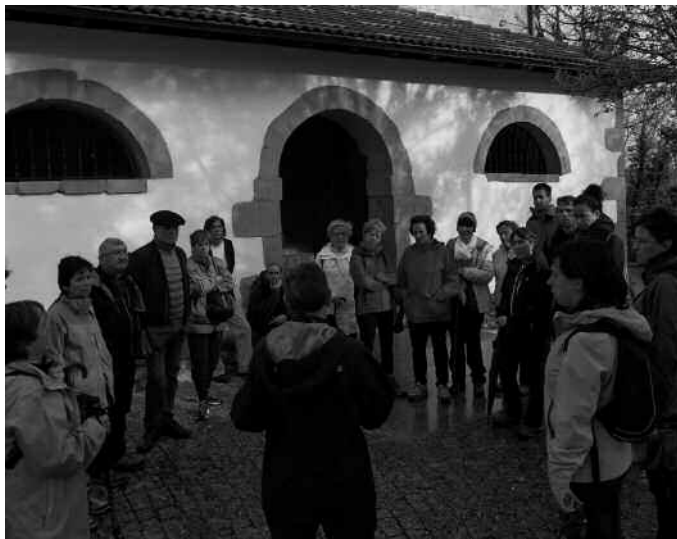
Larunbat honetan, sagasti loretuetan barrena ibilaldia egiteko aukera dago.

17:30 Berreskuratutako XVI. mendeko Aginagako Sariaaundi Dolare-baserria ezagutzeko bisita gidatua. Tartean, XVI.