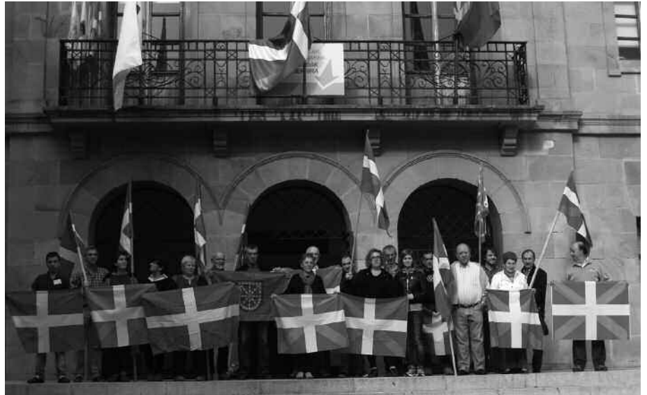
Oroimen historikoa berreskuratzea eta Herritartasun Agiri Ofiziala sustatzea ere onartu zen Aberrri Egunari begira onartu zen mozioan.

Mozioaren bidez, herritarrei euskal ikurrak jartzeko gonbita luzatzen zaie. Gainerakoan, zenbait konpromiso hartzen ditu Udalak; oroimen historikoa berreskuratzea eta Herritartasun Agiri Ofiziala sustatzea. Bide batez, apirilaren 13an Etxarri Aranatzan ospatu zen independentziaren inguruko herri galdeketa eta ekainaren 8an euskaldunon erabakitze eskubidearen alde Durangotik Iruñeara antolatu den giza-katearekin bat egiten du mozioak.