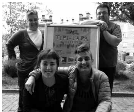
Igande honetako saioaren ondoren, ekainaren 1ean egingo da denboraldiko azken Tipi-Tapa.

B igarren ikasturte amaierara heltzen ari da, Hurbilago Elkartetik herritarrei hileroko lehen igandean osatzea proposatzen zaien ibilbide gastronomikoa. Ekainekoa izango da momentuz, denboraldiko azken hitzordua. Aurretik, Txapeldun, Artzabal, Xarma, Bordatxo, Txirristra, Aitzaga eta Txiriboga tabernetako sukaldeetan igande honetarako, maiatzaren 4rako prestatuko dituzten mokadu bereziak dastatzea falta zaigu. Oraingoan, garaiko arraina zerbitzatuko dute pintxo berezietan. Edariarekin batera, 2 euroren truke. Hileroko bezala, 150 euroko erosketa balea zozketatuko dute, Tipi-Tapa amaieran.