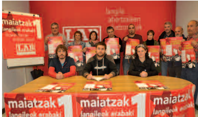
Buruntzaldeko LAB sindikatuak manifestaziorako deia egin du. Eguerdiko 12:00etan Hernanin.

Bizi dugun egoera gaintzeko irtenbide propio bat proposatzen du LAB sindikatuak; burujabetza politiko, ekonomiko eta soziala. "Guri dagokigu erabakitzea nola sortu, banatu eta antolatu nahi dugun aberastasuna Euskal Herrian. Hor dago irtenbidea", dio sindikatuak Buruntzaldean duen ordezkariak. Burujabetza prozesuko giltza da erabakitze eskubidea LAB-entzat, eta "langilearen protagonismoa eta parte hartzea prozesuaren berma". Mezuon bueltan antolatu dituzte