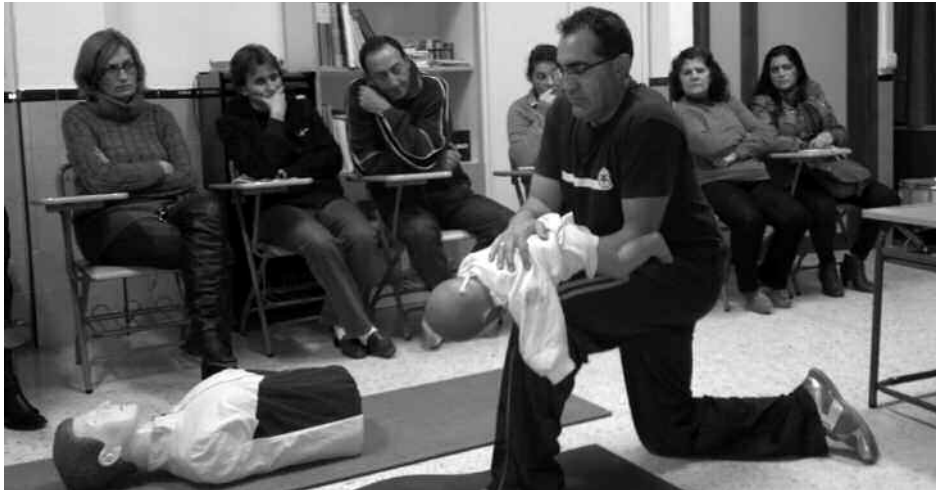
Maiatzaren 12tik 16ra egingo da ikastaroa DYaren egoitzan.

M aiatzaren 12tik 16ra izango dira saioak, 10:00etatik 12:00etara DYak Munalurra 26an duen egoitza berrian. Haurtzaroari loturiko istripuen ekiditea eta lehen sorospenen inguruko ikastaroa izango da.