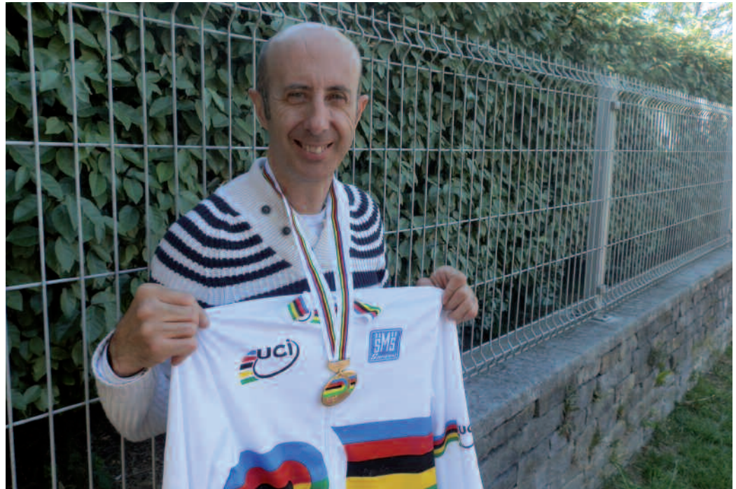
Eskuetan eta besoetan zuen gaixotasuna hobetzeko hasi zen txirrindularitzan. Abiadura olinpikoan onenetakoa da. Baina 46 urterekin, ia erretiroa hartzean den honetan erdietsi du bere markarik onena.