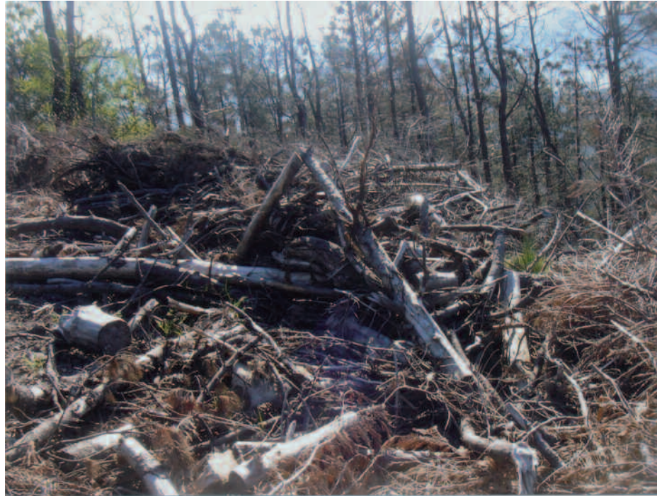
“Andatzako bazterrak pinu hondarrez josiak daude”, Mendi Elkartekoek adierazi digutenez.

Lehenik eta behin, informazioa. Usurbilgo herri-