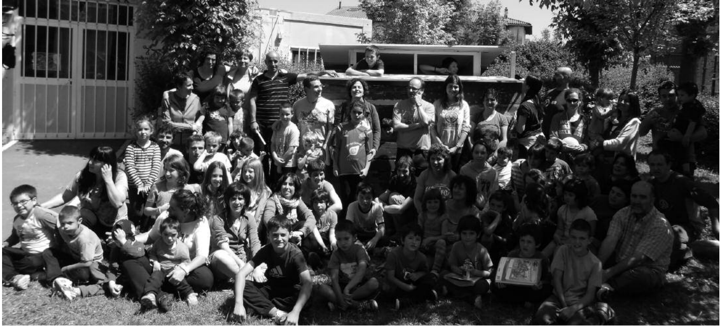
Aurreko larunbatean aritu ziren ikasleak, gurasoak eta irakasleak elkarlanean.

J oan den larunbatean, maiatzak 17, Zubietako Eskola Txikian guraso, ikasle eta irakasleak elkartu ziren elkarlanean argazkiko txabola eraikitzeko.