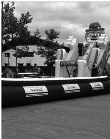
Puzgarriak ipiniko dituzte lehen egunean.

(Kultur asteari amaiera emateko, aurrekaldean dagoen bertsoa, denon artean abestuko degu).