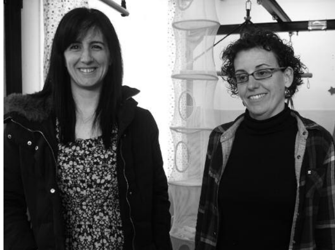
Orain dela bi urte hasi ziren Pausoka elkarte osatzen. Gaur egun 40 familiei zerbitzua ematen die.