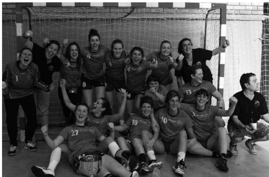
Neskek pozarren, kopa eskuratu berri.

Igandean jokatu ziren azken partidak. Berdinketarekin bi taldeak igotzen ziren. Eta halaxe amaitu zen partida. Azken segunduen inguruko bideoa bolo-bolo ibili da Interneten, berdinketa eman zeneko ueña jasotzen duena. Usurbilgo atezainak baloia atera, aurkariak baloia hartu eta berdinketa lortzen duen ueña. Hitzartua ote zegoen susmoa zabaldu dute hainbat hedabidek. Hori horrela izan zela frogatu beharko dute, ordea. Eta hori bideo-irudietan behintzat ez da agertzen.