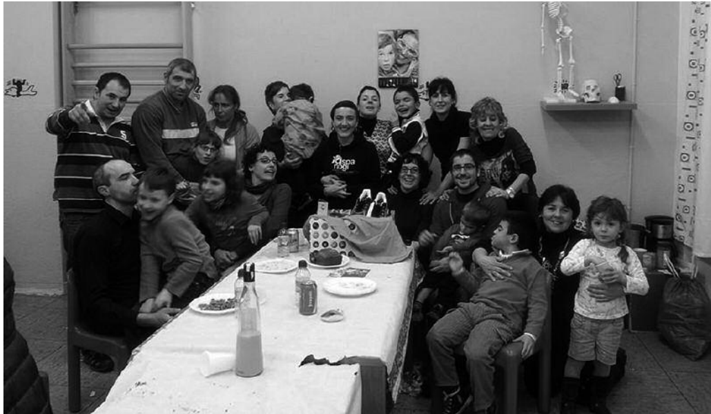
“Administratziotik ez dituzte beharrok asetzen, orain aitzakia handiena da ez dagoela dirurik”.