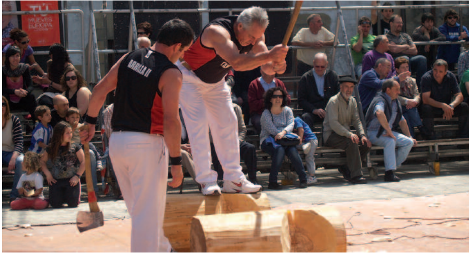
Arrilla aita-semeak erakustaldia eskaintzen Dema-plazan.

Eguzkia eta jendea, aurtengo San Ixidro Eguneko protagonistak. Belaunaldi ezberdinetako herritarrikusi genituen maiatzaren 15eko goiz partean, Dema plazan ospatu ziren herri kirolletako probei adi-adi jarraitzen. Haur Hezkuntzako ikasle eta irakasleek ere, ikastolatik kanpo, baserri-tarren eguneko ospakizunetan murgilduta igaro zuten goiz partea.