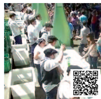
Askatasuna plazan ere banatzen denetik, frontoia lasaia dago.

A spaldiko partez, eguzkitan ospatu zen Sagardo Eguna. Eskubaloi partidak tartekoziurrenenik, kosta egin zitzaion jendeari frontoira eta Dema plazara hurbiltzea. Eguerdiko 13:30ak aldera hasi zen jendea erruz batzen. Askatasuna plazan ere sagardoa banatzen denetik, erronda askoz erosoagoa da. Eta hiru sagardo gunen nagusietan, Askatasuna plazan, Dema plazan eta frontoian, sagardoak aise gozatzeko aukera egon zen.