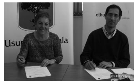
Udalak 10.000 euroko dirulaguntza emango dio

Elhuyar Fundazioak, zientzia eta teknologiaren esparruan dibulgazio eta berrikuntza-jarduerak sustatzen ditu eta euskararen garapen osoaren bidean, aholkularitza, dibulgazio eta ikerketak egiten ditu.