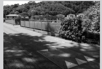
Maiatzaren 14an ipini ziren zubian.

lbigailuentzat itxita egon zen Santueneko zubia maiatzaren 14an. Abiadura mugatzeko koxkak jarri behar zituzten udal langileek. Aurreko asteazkenean bideratu zituzten lanak.