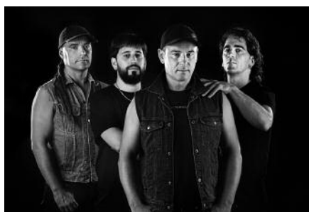
Gaueko 23:00etan hasiko da kontzertua.

Aginagan ospatuko den kontzertu gauerako sarrerak, aurrez eskura daitezke 8 eurotan, Aitzagan, Aginagako Arrate Egoitzan, Lasarteko Ilargin eta Orioko Kalakarin.