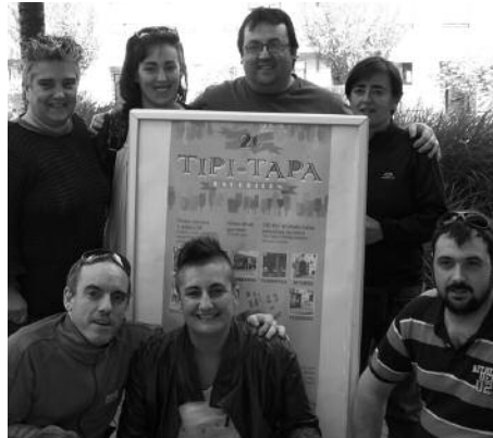
Ekainaren 1eko Tipi-Tapan, munduko herrialde ezberdinetako zizka-mizkak dastagai izango dira.

E kimen arrakastatsuko bigarren denboraldia errematatzeke ohiko formatua berriitu nahi izan dute tabernariak. Orain arte, garaiko produktuekin prestatzen zituzten hilabeteko lehen igandeetako pintxoak. Ikasturteko azken edizioan, ekainaren 1ekoan, munduko herrialde desberdinei gorazarre egingo dieten zizka-mizka bereziak dastatu ahal izango ditugu, Txapeldun, Artzabal, Xarma, Bordatxo, Txirristra, Aitzaga eta Txiriboga tabernetan. Argentina edota Sahara aldekoak adibidez. Edariarekin batera, 2 euroren truke. Denboraldiko 150 euroko erosketa-balearen azken zozketa egingo da ekainaren 1ean bertan, 15:00etan Txiribogan.