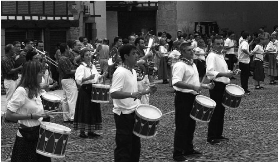
Maiatzaren 27an asteartea, 20:00etan hasiko da izen-ematea Agerialden.

Entseguak maiatzaren 27tik aurrera hasiko dira, astearte eta ostegunetan, 20:00-21:00 artean Agerialden. Helduen danborradan parte hartzeko izena eman behar da eta maiatzaren 27an hasiko da inskripzioa. Helduen danborrada, Santixabel bezperan ospatuko da aurten, uztailaren 1ean. Afalurretik eta afalondoren.