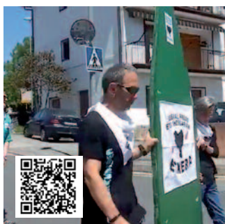
Askatasuna plazan egin zuten presoan aldeko topa.

O rain arte, elkarretaratzeko egin izan ditu Etxeratek. Mikel Laboa plazan bateratu ohi ziren. Aurten, ordea, kalejira txiki baten ondoren, presoan aldeko topa egin dute. Mikel Laboa plazan zegoen txosna gunetik abiatu eta kalejira txiki bat egin zuten. "Sagardo Egunean ere gurekin nahi ditugu" zioen pankarta batek. Askatasuna plazara jo zuten eta bertan egin zuten euskal presoan aldeko topa.