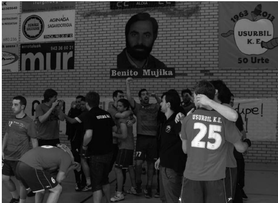
Usurbil Kirol Elkarteko mutilak mailaz igo dira.

A metza bete da. Usurbil Kirol Elkarteko bi senior taldeek asteburuko faseetan nagusitu eta mailaz igotzea lortu dute; mutilak 1. nazional mailara eta neskek, Zilarrezko Ohorezko Mailara. Eskubaloi jaialdi handia izan da asteburukoa. Emozioz beterikoa, jendez beteriko harmailak Kiroldegian etxekoei indarra ematen. Sagardo Egun handia izan zen maiatzaren 18koa, Usurbilgo eskubaloientzat. Ederki ospatu zuten.