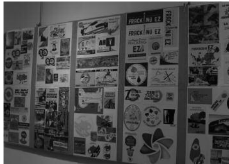
Erakusketa zabaldu dute Sutegin.