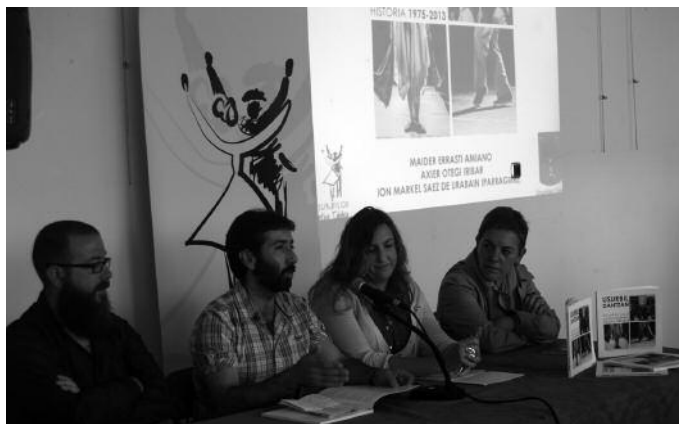
Aurreko astean aurkeztu zen liburuia Sutegin.

Abiapuntutik labetik atera arte, liburuaren elaborazio prozesuaren inguruko zehaztasunak eman zituzten egileek. Baita noski, irakurleek liburuan aurkituko dituzten zenbait zertzelada aurreratu ere. Dantza Taldearekin lotura izan duten herritarrekin lekukotza liburu bat da "Usurbil Dantzan", irakurterraza eta oso bisuala, bizipen eta une gogoangarri asko biltzen dituzten testu eta irudiez hornitua dagoena. Gertukoa egingo zaizue, herritarrek ageri baiti-