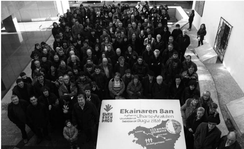
Tantaka tantaka, atxikimenduak batzen joan dira. Usurbilen, ia 700 lagun biltzera heldu dira.