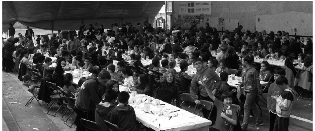
Jende asko batu zen frontoian, Ikastolaren Eguneko berri bazkarian.

Ekainaren 1ekoa goiz euritsua izan arren, Ikastola Eguna abiatu zuten LH-ko ikasleen arteko jokoak bere horretan ospatu ziren. Kolore urdin, gorri eta berdeko taldeen arte-