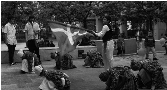
Dantza saiorik ere egin zen liburuaren aurkezpen ekitaldian.