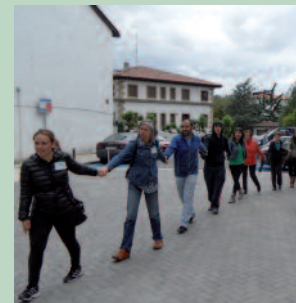
Maiatzaren 23an entsegu modukoa egin zen herrian.

Pertsonengana jo dugu eta horretan asmatu dugu. Ibilbide bat izan duen ekimena da; Nazioen Mundutik datorren ekimena da hau. Argi dago eboluzio handia izan duela. Idiazabaletik hasi ziren mugitzen, gero “Gazta zati bat” filmarekin gehiago eta Gure Esku Dago mugimenduak ekarri du, eremu handira heltzea.