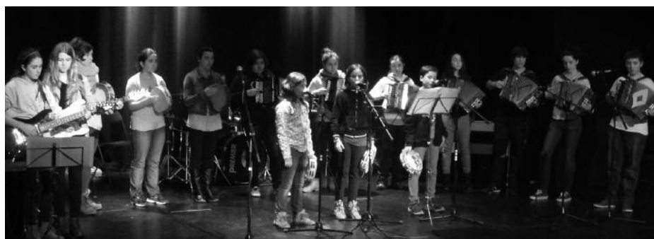
Oporraldi aurreko kontzertu zikloa ekainaren 11tik 18ra izango da.

Z umarte Musika Eskolakoek amaitzear dute ikasturtea. Oporretara joan aurretik ordea, hilabete hauetan ikasgeletan landutakoa jendaurreko azken emanaldietan plazaratuko dute: