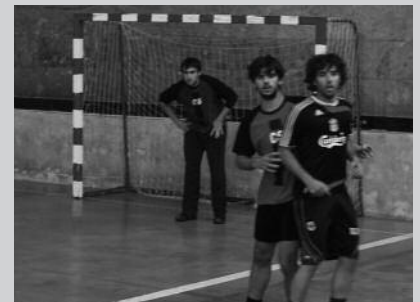
Asteburu honetan amaituko da lehen fasea.

Udaberriko ostiral gauetan ikusmina nagusi berriz ere, Usurbilgo Gaztetxeak antolatuta duen futbito txapelketari esker. 4. jardunaldi eguna ospatu zen aurreko ostiralean. Gogoan izan, txapelketako lehen fase honetan bost jardunaldi ospatuko dira. Ondoren, lehen lau taldeak hurrengo faserako sailkatuko dira. Beste ligaxka bat jokatuko dute eta lehen bi sailkatuek, beranduenez, Santixabelen atarian ospatuko den final handia.