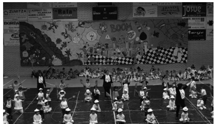
Ohi bezala, jendetza batu zen kiroldegian, ikasleen eta irakasleen ikuskizunetzat gozatzeko asmoz.