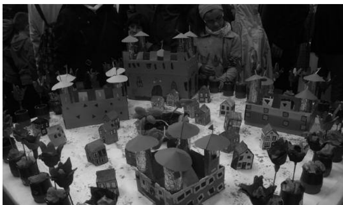
Ikasleek urtean zehar egindako lanen erakusketak ere arreta berezia jaso zuten.

Gogoan izan, Udarregi Ikastolako idazkaritzan edota udarregi.com atarian sartu eta bertan dagoen izen emate orria beteta apuntatu litekeela baita. Udarregikoek goizean goiz hasitako ospakizunak, musika eta dantza giroan amaitu zituzten arratsalde partean.