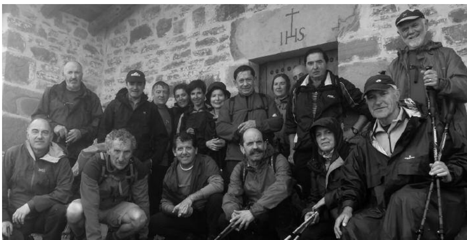
Lanbro artean osatu zuten Arlabandik Araotzerako ibilbidea. Argazki gehiago: www.andatza.com