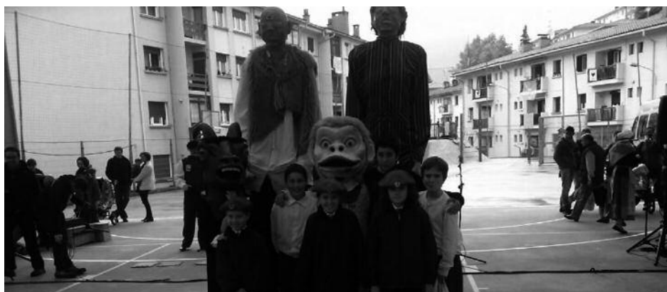
Usurbilgo erraldoi txikiak Andoain ibili dira, herritik kanpo egin duten lehen irtenaldia eginez.

Lizarrako gaitero txikiak jarri zituzten Usurbilgo erraldoi eta buruhandiak dantzan.