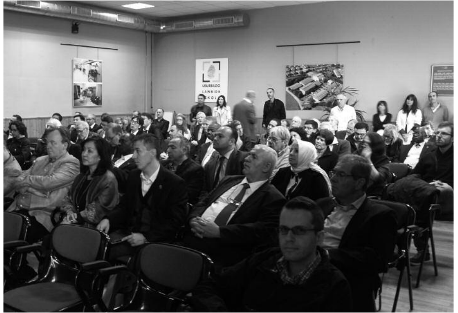
Nazioarteko topaketa egin berri da Lanbide Heziketan.

2014-15 ikasturterako aurrematrikulatzeko azken eguna, ostiral honetan, ekainaren 6an. Orduetgia: astelehenetik ostegunera, 9:00etatik 14:00etara eta 16:00etatik 18:00etara. Ostiraletan, 9:00-14:00 artean. Aurkeztu beharreko dokumentazioa: NAN fotokopia bat, egindako ikasketen ziurtagiri akademikoa (originala eta kopia); bi argazki, izen abizenekin atzealdean; eta kontu korrante zenbakia. Informazio gehiago: 943 36 46 00 edo lhu-surbil.com