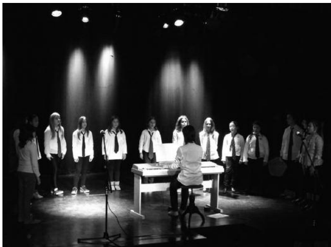
Udarregi ikastolan, Sutegin eta San Estebanen eskainiko dituzte saioak.

19:00 Sutegin. The Hastelehen's, Ganbarakada, Gitarrako Taldeak, Tronpetta-Mix Taldea.