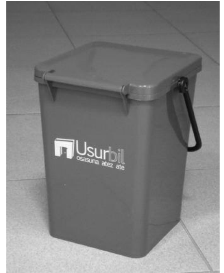
Nork bere etxeko helbidea eman eta ontzi gris bat jasoko du doan.

Ekainak 28, larunbata 10:00-13:00 Oiardo Kiroldegian. Oharra: nork bere etxeko helbidea eman eta ontzi gris bat jasoko du doan.