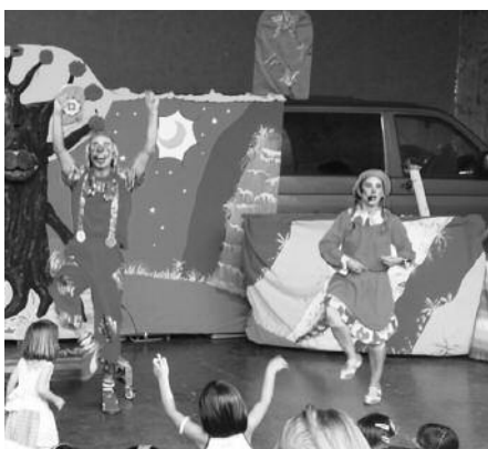
Saioa arratsaldeko 17:00etan hasiko da. Sarrera doan izango da.

Arratsaldeko 17:00etatik aurrera frontoian. "Hainbat dantza bikoteka, borobilean, trenak kalejira... Abesti ugari: Kiki, Koko eta Moko pailazoez sortuak denak. Emankizun parte-hartzaileak, umeak moztortuta: interpretatzen, dantzan eta publikoaren aurrean jolasean. Joko ikusgarri eta dibertituak, inplikaraziko zaituztenak. Eta hainbat parte-hartze mota, publiko osoa barne. Hori guztia Kiki, Koko eta Moko pailazoez gidatuta; lortzen duen emankizuna: ikustekoa!, dibertitua, erakargarria eta distiratsua", NOAUA! Kultur Elkartek, Plis, Plas, Txalo eta Jolas ekimenaren baitan antolatutako saioa. Ekainaren 19ko saiorako sarreara, doan.