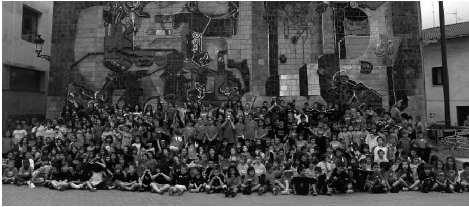
Irailen ospatuko da Usurbil Cup Txapelketa.

Ostiral honetatik, ekainaren 13tik 20rako tartea dute 6-14 urte arteko haur eta gazte txoek aurten iraileko lehen asteburutik azken asteburura jokatu den txapelketan apuntatzeko. Kuota 75 eurokoa izango da. Jokalarien hiru laurdenak Usurbilgo ikastetxeetako ikasleak izan beharko dute. Argibide gehiago, Usurbil FT-k ekainaren 25erako osatuko diren taldeetako arduradunekin deituko duen gurasobileran. Bilkura ordua eta lekua, aurrerago zehaztuko dute antolatzaileek. 2013-14 ikasturte honetan, maila hauetan dauden ikasleek parte hartu ahaliko dute: LH 1-2 (derri gorrez mixtoak eta sailkapenik ez da egongo): 8-12 jokalaria. LH 3-4: 8-12 jokalaria. LH 5-6: 8-10 jokalaria. DBH 1-2: 8-10 jokalaria.