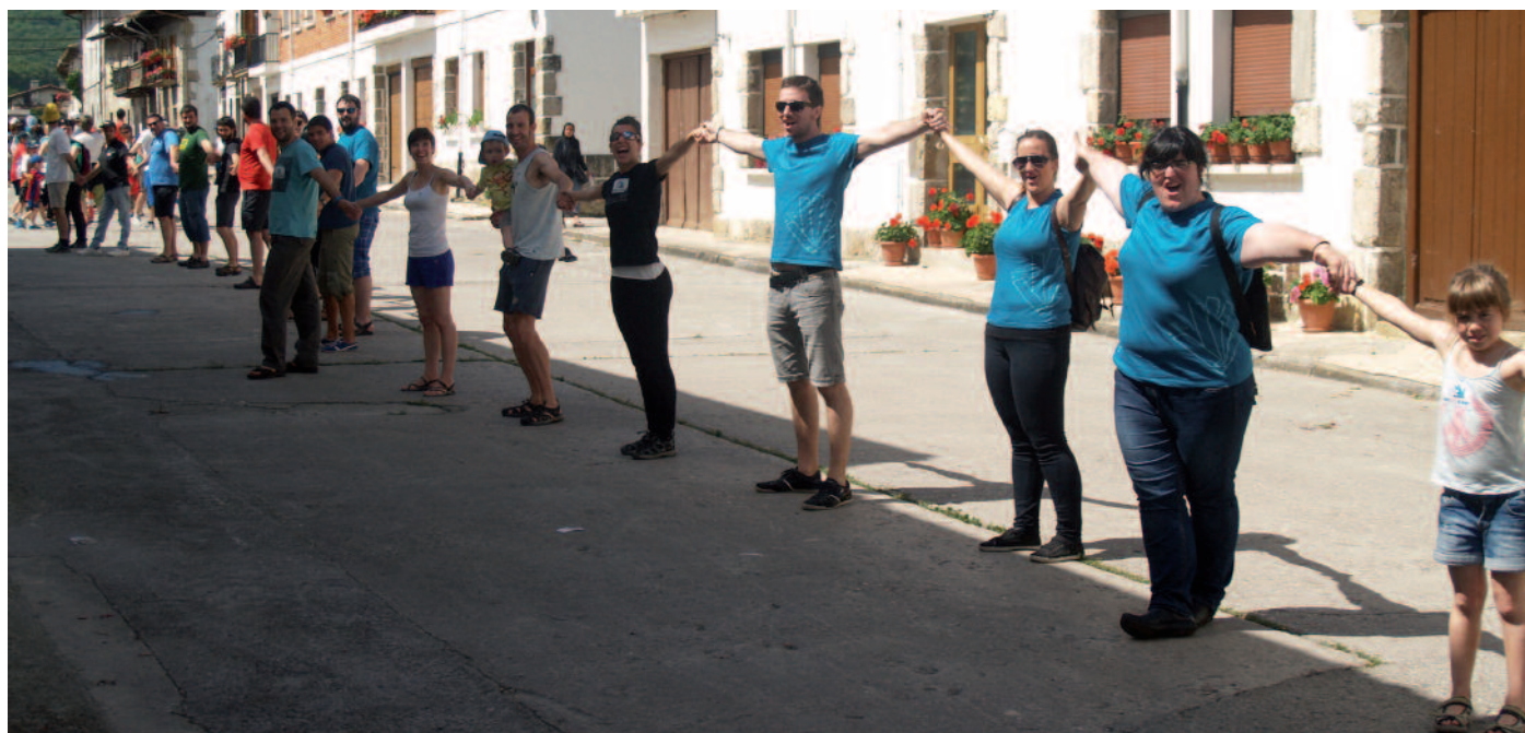
Usurbildarrez bete zen Uharte-Arakil. 663 atxikimendurekin, 90. kilometroa Usurbilgo jendearekin osatua izan zen.

H aur, gazte, ez hain gazte eta heldu... mila irrifar ikusi genituen igandean gure kilometroan. Ehun milaka irrifar 123 km-etan... izan ere, halakoa behar zuen Ekainaren 8ak. Ez besterik. Erabakitze eskubidearen aldeko festa egitea zen erronka, oraindik ere hotz xamar sentitzen