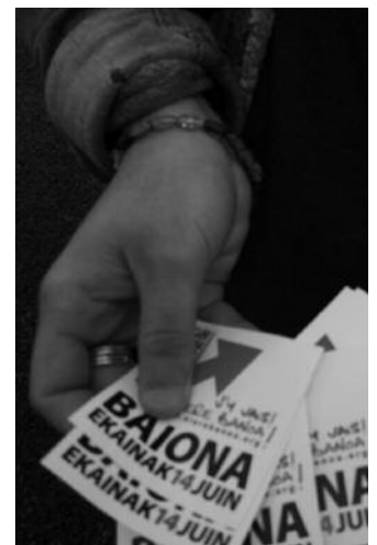
Autobusa 14:30ean abiatuko da Mikel Laboa plazatik.

16:00 Manifestazioa Baionan, Laugatik abiatuta, "Giza eskubideak, bakea, konponbidea" lemapean. Informazio gehiago: nierebanoa.org edo herriadugarnas.org