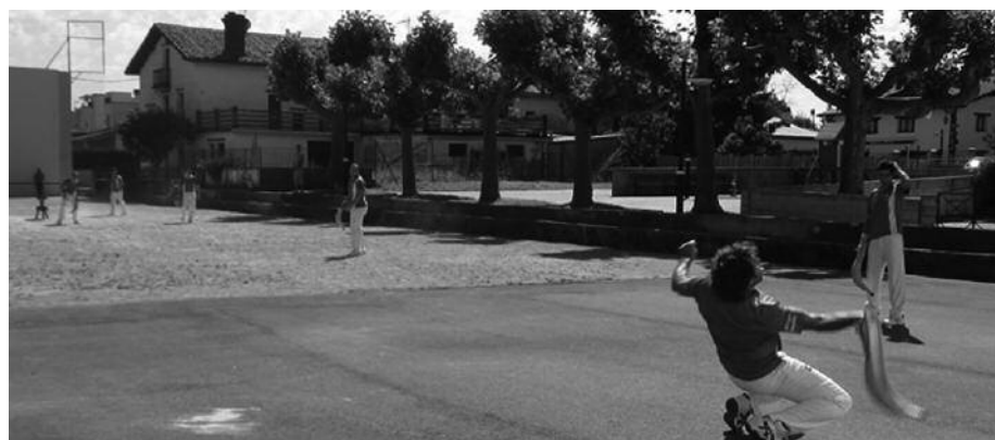
Sasoi onean dira Zubietako errebote jokalaria. 13-5 irabazi zieten igandean, Baigorriko Zaharrer Segi taldekoei. Argazkia, neurketa horretan bertan eginikoa da. Partida, etxean jokatu zuten zubietarrek.