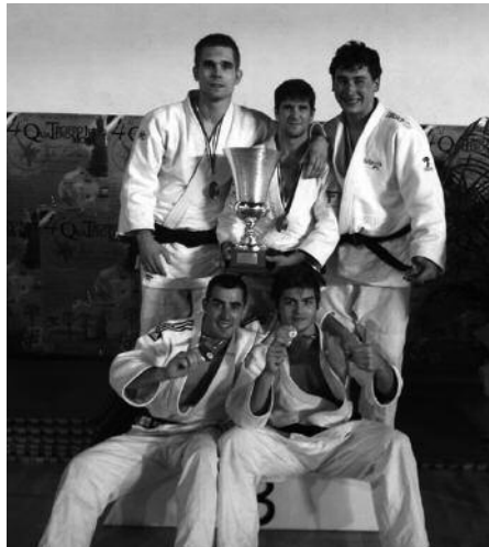
Sardinian, sariak eskuratu berri.