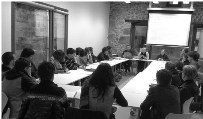
Indarrak batzeko apostua egin dute. Ekainaren 19an agerraldia iragarri dute.

“EUSKAL HERRI OSORA IREKITZEA ERABAKI DUGU” Hurrengo urtebeterako ibilbide orri bat diseinatuta dute Zero Zabor mugimenduko kideek. Horretan aritu dira azken hilabete hauetan. Aurrera begirako