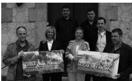
Ekainaren 27an amaituko da izena emateko epea.