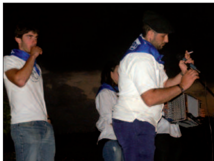
Pikaolan piztuko da San Joan sua. 22:00etan hasiko da ekitaldia.

Kalezarren bakarrik ez, Kaxkora ere jaisten dira San Joan eskean. Aurten, ohi baino goizago, berrikuntza bat txertatu baitute ibilbidean. Arratsaldean ibiliko dira Kaxkoko tabernetan eta ez orain arte bezala, afalostean. Gero bapo eta goiz jatera doaz Saizar sagardotegira. 22:00etan Pikaolan egon beharko dute eta puntual, San Joan jaietako sua pizteko prest.