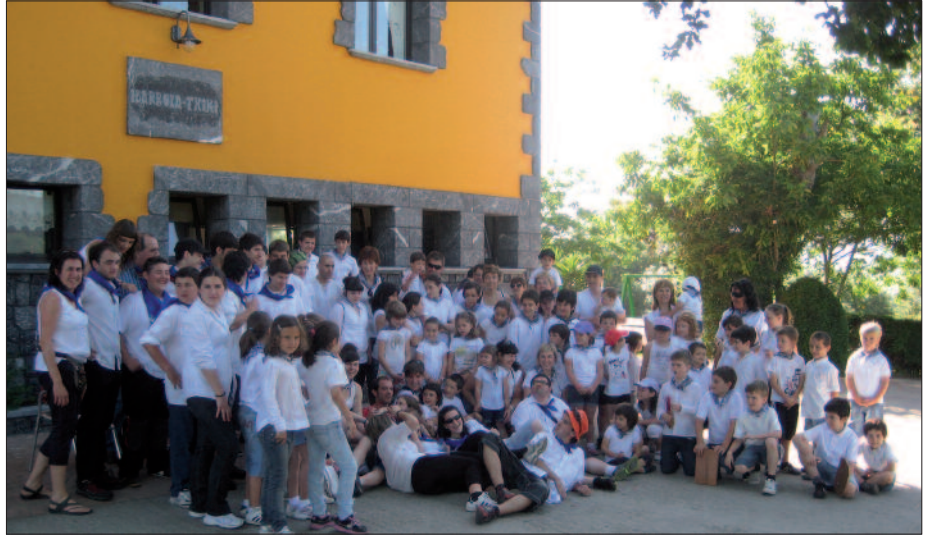
Goizean goizetik martxan izango dira Oilasko Biltzaileak. 9:00etan abiatuko dira.

Oilasko Biltzaileen Eguna ekainaren 21ean ospatuko da. Baina guraso batzuk lehenago hasi dira prestaketa lanekin. Ekainaren 18an amaitzen zen oilasko biltzaile bazkarirako txartelak eskuratzeko epea (aurreko asteko NOAUA!n iragarri genuen bezala, Kaffa kafetegian izan dira salgai txartel horiek, ekainaren 18ra arte).