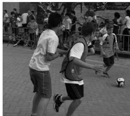
Ekainaren 20an amaituko da Usurbil Cup Txapelketan izena emateko epea.

Ostiral hau, ekainaren 20a azken eguna dute 6-14 urte arteko haur eta gaztetxoek aurtien iraileko lehen astebururik azken asteburura jokatuko den txapelketan apuntatzeko. Kuota 75 eurokoa izango da. Jokalariek hiru laurdenak Usurbilgo ikastetxetako ikasleak izan beharko dute. Argibide gehiago, Usurbil FT-k ekainaren 25erako osatuko diren taldeetako arduradunekin deituko duen guraso bileran. 2013-14 ikasturte honetan, maila hauetan dau-