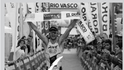
Errepide mozketak goizeko 10:00etatik 11:30era egingo da.

Datorren asteko igandean, ekainaren 29an, N-634 errepidea itxi egingo dute Errekalde eta Oriorarte. Arrazoia: Atletiko San Sebastianek antolatu duen Nazioarteko Triatloia. "N-634ren beste zentzua irekita egongo da eta Orio edo Zarautzera joateko Belartzatik A-8 hartu beharko da. Orion, Txankako aldapa itxita egongo da gorako zentzuan, baita Igeldorako igoera ere. Barkatu sortuko diren trafikoko eragozpenengatik", antolatzaileek aditzera eman dutenez. Mundu mailako triatletek hartuko dute parte. Bertan bolondres gisa laguntzeko gogoz dagoenak, hauxe du eurekin komunikatzeko modua: comunicación@atletico-ss.org