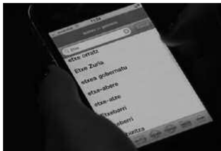
Uztailaren 9ra arteko epea dago.

Euskaltegiko hurrengo ikasturteko matrikulazio kostua aurreratzea helburu izango du udal diru-laguntza honek. Datorren 2014-15 ikasturtean euskara ikasi nahi izan eta behar ekonomiko bereziak dituzten ikasleei zuzendua egongo da. Deialdia uztailaren 1ean jarriko du martxan Usurbilgo Udalak. Eskabideak aurkezteko bi asteko tarte izango dute interesdunek, uztailaren 15era arte. Euskara ikasleentzako diru-laguntza deialdi orokorreko oinarri berak aplikatuko dira kasu honetan.