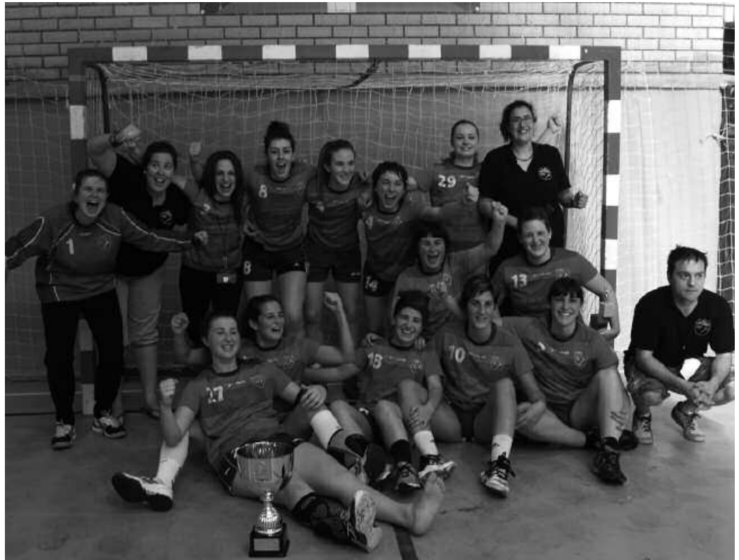
Garaipena ospatzen, taldeko jokalariek eta entrenatzaileak. Orain, jaietako hasiera emateko ardura izango dute.

Usurbili poztasun une bat baino gehiago ekarri dizkion senior nesken eskubaloi taldekoak izango dira beraz, udaletxe-