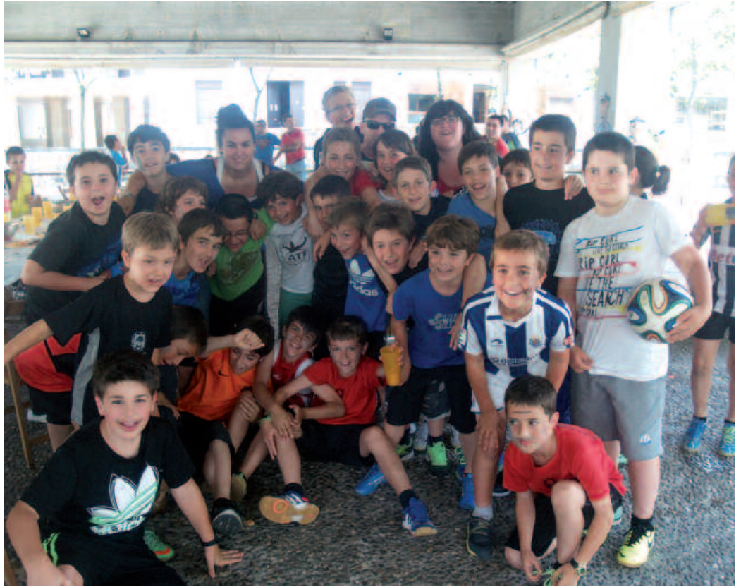
Giro ederrean ospatu zuten bere eguna Usurbil Futbol Taldeak.

Beteranoen txanda arratsaldean. Euren arteko futbol partidak jokatu ziren frontoian. Eguna amaitzeko, herri afari baten bueltan bildu ziren Askatasuna plazan, Usurbil FT-ko jokalariek, entrenatzaile eta zuzendaritzako kideak.