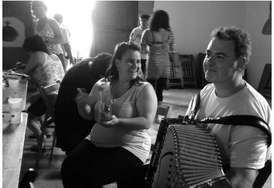
Ekainaren 20an agurreko festa egin zuten Eskola Txikikoek. Bazkaria Eliza Zahar berrituan egin zen.

Datorren 2014-15 ikasturterako goizeko zaintza egiteko pertsona euskaldun baten bila ari dira. Haurrekin zerikusia duten ikasketak kontuan hartuko dituzte. Interesdunek, bidali kurrikuluma aginaga@eskolatxikiak.org helbidera.