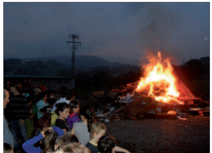
Ateri eutsi zion eta arazorik gabe piztu ahal izan zen, San Joan bezperako Pikaolako sutzarra.