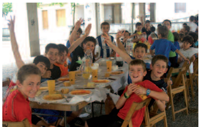
Gazte zein heldu aritu ziren jolasean, eta ospakizun giroan. Askatasuna plazan herri bazkaria egin zuten.