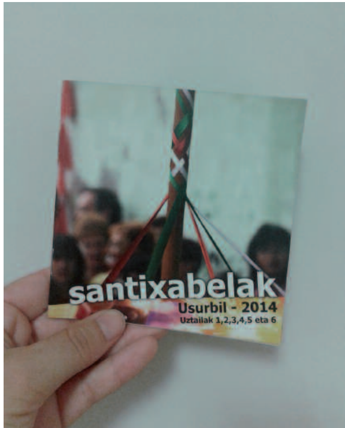
“Argazki asko eta kolore biziak”, horiek egitarauaren ezaugarriak.

Irudiak eta testuak bateratu behar direnean maiz zailtasunak izaten dira. Irudiak garrantzia du beti baina testua lagungarri denean, hau modu garbian, irakurtzeko modu egokian landu behar da. Askotan emaitza polita lortzea baino funtzionala izatea lehenetsi behar izaten da.