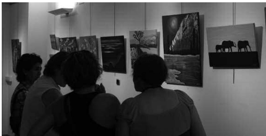
Sutegin egon dira margolanak ikusgai.

Ikasturtea amaitu dutenen artean daude baita, Artzabalgo pintura ikastaroko ikasleak. Urtean zehar landutako margolan eta eskulan bilduma,