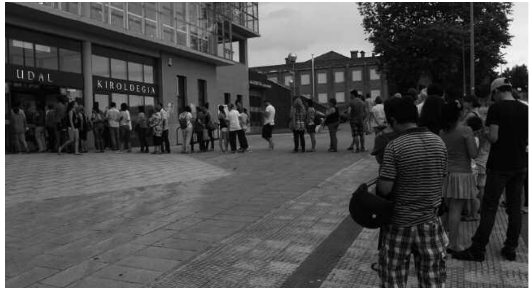
Aurreko astean, jende asko pasa zen kiroldegitik kubo bila.

Abiatzear den hondakinaren sortzez besteko ordainketa sistema berriaren gako nagusietako