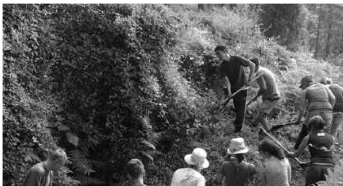
Ostiral honetan amaituko da izen-ematea.

Egitekoa: Oroimen berreskurapen lana, Gerra Zibilean lehengo erresistentziaren gune