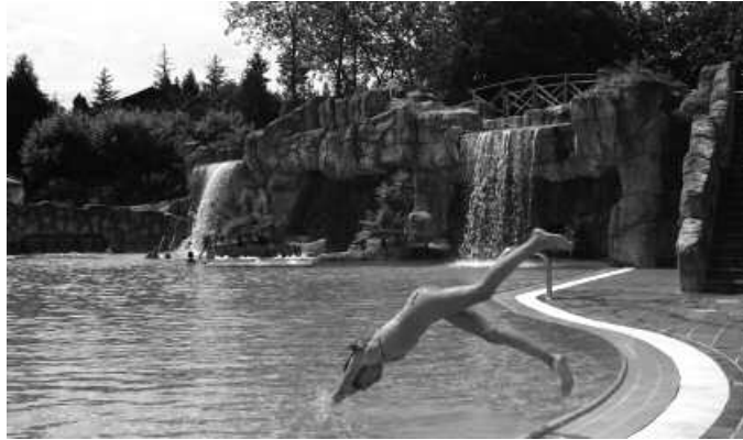
16 urtera bitarteko ikasleek zeregin ugari dute aukeran, Gaztelekuan.

Ekintza guztion harira, zenbait ohar plazaratu dituzte Gaztelekutik. Batetik, irteeretan parte hartzeko guraso baimeanak Gaztelekuan jaso beharko direla. Bestetik, hitzordu guztietarako Gaztelekua izango dela elkartzeko gunea. Eta udako egitarauari buruzko informazio gehiago, egoitzan bertan eskuratu daitekeela. Uda parterako ekintzen zerrenda osoa hemen: