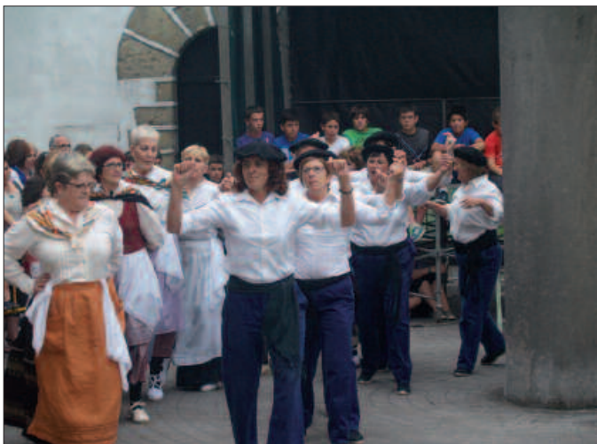
Dantzari belaunaldi ezberdinen topagune izan zen Kalezar, pasa den asteburuan.