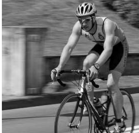
Usurbil eta Aginagako lurretatik pasako dira lasterkariak.

Igeriketa atalean, 1.500m-ko ibilbidea osatu beharko dute, Kontxako badian. Uretatik irten ondoren, Hotel Londres parean, bizikleta saioa hasiko dute. 40km-ko ibilbidea egin beharko dute. Kontxako pasealekutik irten, Antigua eta Berio zeharkatu Zuaztura iristeko. Handik, atzeko errepidetik, Añorga Txikirantz abiatuko dira gero Oriora joateko, Añorga, Usurbil eta Aginaga herriak igaro ondoren, Mendizorrotz Orioko Bentatik igo eta Donostia zen-