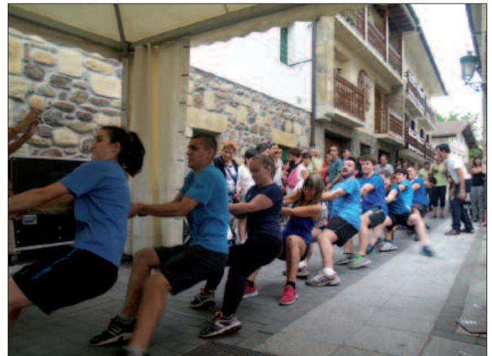
Urdinak eta zuriak, zuriak eta urdinak lehia bizian, jaien hasierako jokoetan. Indarra bada Kalezarren, soka-tiran erakutsi zuten moduan.