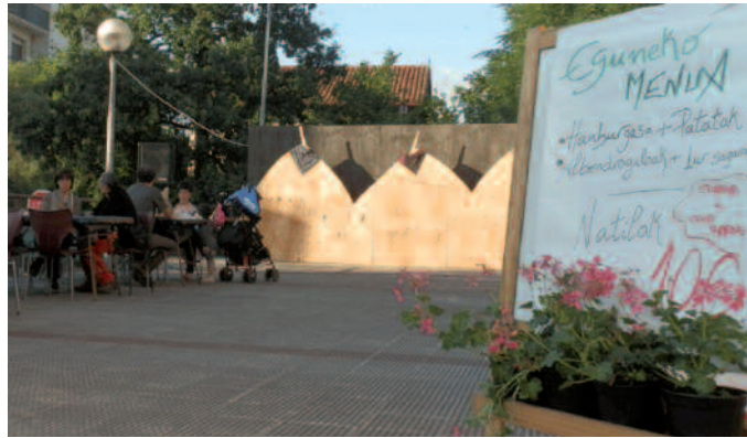
Iazko terraza. Aurten errepikatuko ez den irudia.

Iaz, terraza moduko bat zabaldu genuen Santixabeletan. 2013a urte zaila izan zen NOAA! Kultur Elkartearantz, bereziki arlo ekonomikoan. Ekimen ezberdin bat martxan jartzeko beharra ikusi genuen eta jaietan terraza bat zabaltzea erabaki genuen. Aurtengo festetan ere, hala egingo genuela aurreratu genuen, ekaina hasieran plaza-ratu genuen NOAA! aldizkariaren bitartez. Baina hainbat arrazoitarteko, terrazaren egitasmoa bertan behera uztea erabaki du NOAA!ko Zuzendaritza Batzordeak.