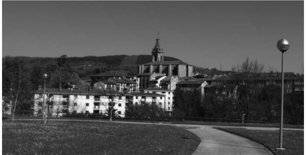
Usurbilgo enpresa batek 3 hilabeteko kontratua egiten badio langabetu bati, 3.000 euroko laguntza jaso dezake. Eta 6.000 euroko laguntza, 6 hilabeteko lan kontratuarengatik.

Eskabideak ere aipatu data baino lehen bideratu beharko dituzte interesdunek, Andoingo Udalaren Sustapen ekonomiko, enplegu eta Gazteria Saileko erregistrora (La Salle etorbidea 6. Urigain etxea). Diru-laguntzak 2014ko ekitaldiko