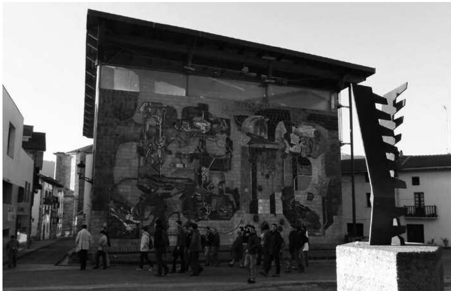
Bakarleri gazteak arituko dira uztaileko ostegunetan, Mikel Laboa plazan.

M ikel Laboa handiari gorazarre egin nahi dio Usurbilgo Gaztetxeak uda honetan. Laboak utzitako uztari heldu nahi diote horretarako. Bakarleri gazteak gonbidatu dituzte Usurbila, nora eta, Laboaren omeneko plazan emaldia eskaintzera. Uztailearen 10etik 31ra, ostegunero 21:00etatik aurrera, bakarlarien saioen ziklo berri bat Usurbilen: