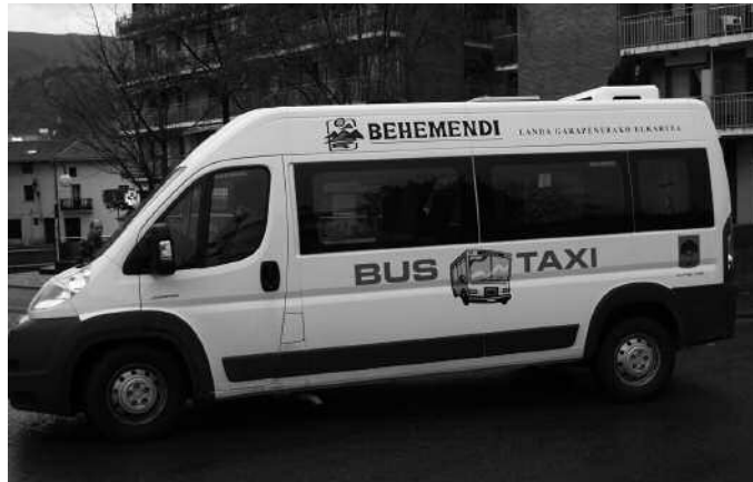
Usurbilgo Udala eta Behemendi dira Bus Taxi zerbitzuaren sustatzaileak.

Adinagatik edo mugikortasun arazoak tartean, geltokira gerturatu ezin dutenentzat furgoneta hau etxeraino hurbiltzen da, indarrean dauden zerbitzuen ordutegien barruan. Horretarako, zerbitzua telefonoz eskatu behar da: 630643596.