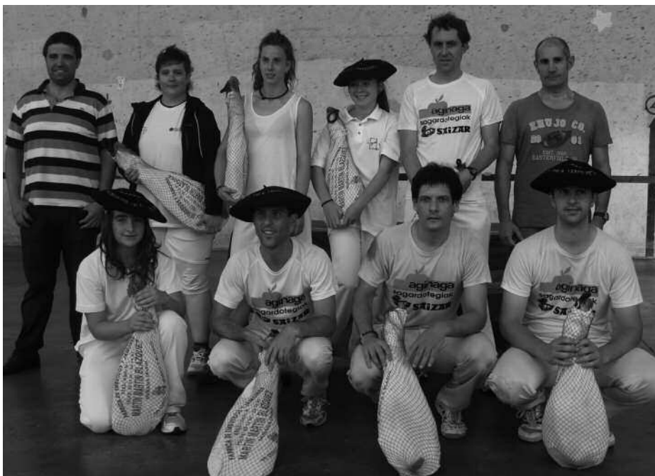
Astelehenean jokatu ziren pala txapelketako finalak. Irudian txapeldunak eta txapeldunordeak.

S aritu talde handi batekin amaitu zen jaien atarian, azken asteotan jokatu den Santixabeletako Pala Txapelketa. Zorionak denei!