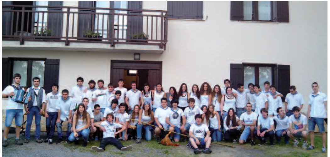
Goiko argazkian: oilasko biltzaileak Buena Vistan. Goizean goiz hantxe ziren. Azpiko argazkia Aginagan egina da. Eguneko eta jaietako irudi gehiago, datorren astekarian.