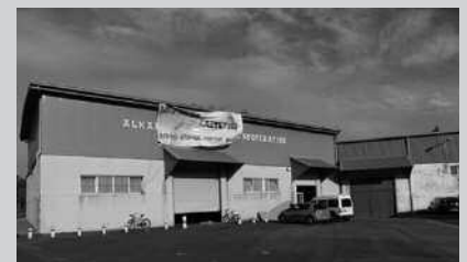
Gaztetxean izango dira eskolak.

Antolatzaileak: Usurbilgo gazte talde bat.