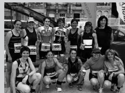
Emailer jaso genuen argazkian ageri dira hainbat usurbildar.

Larunbatean, Emakumearen VI. Triatloia jokatu zen Donostian. Hainbat usurbildar atera ziren.