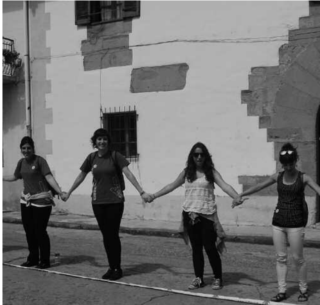
Herritarren iritzia jaso nahi dute. Galdetegi bat banatuko dute postontzietan. Bete, eta Laurok edota Lizardiko Gure Esku Dago kutzetan sartu.

beharreko pausuez jardun genuen, bestetik.