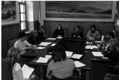
Usurbilgo udalbatza, artxiboko irudi batean.

Gehiengo osoz onartu zen ekainaren 24ko osoko