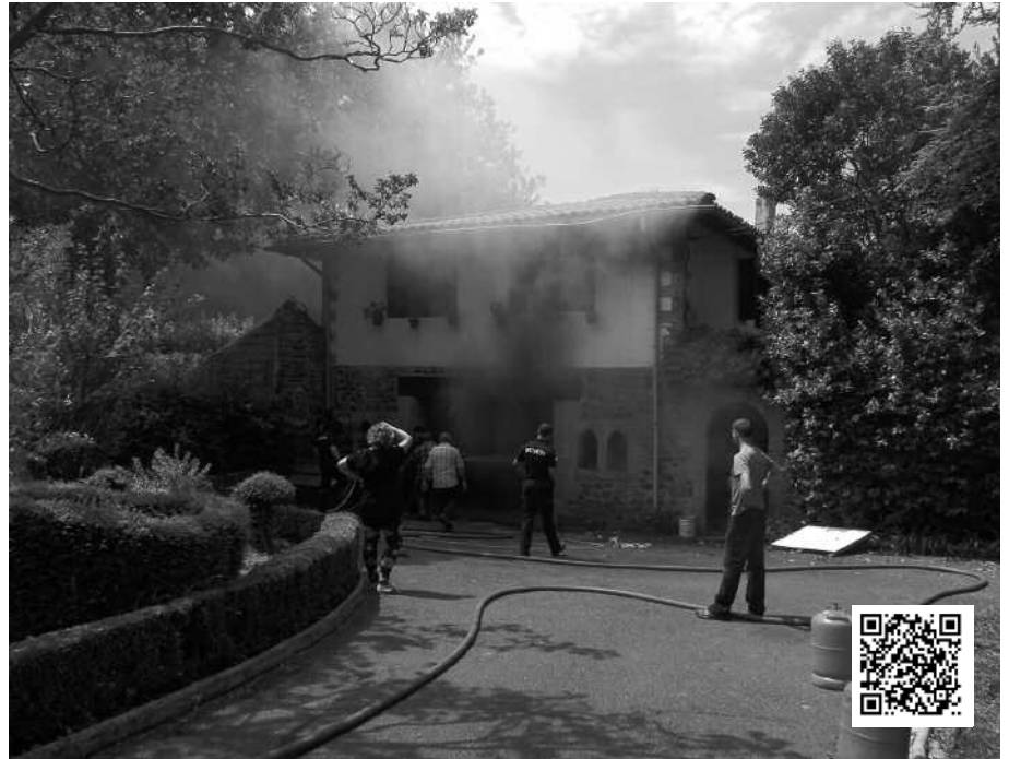
Sutearen bideo labur bat igo genuen NOAUA! TB kanalera eta bisita ugari jaso ditu egunotan.