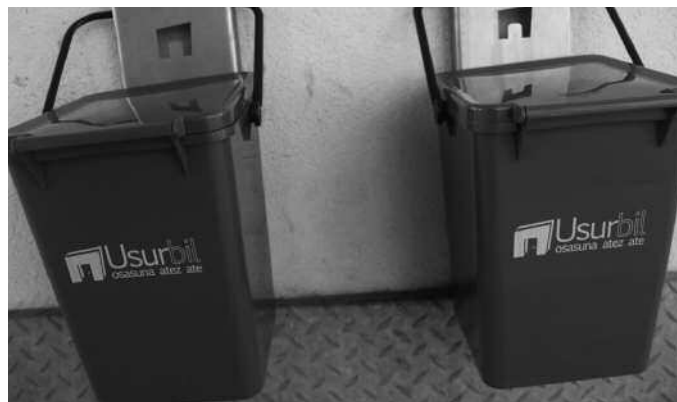
Igandetan atera behar da ontzi grisa, erreusarena.

Jaietan murgilduak egongo garen arren, ez ahaztu. Igande honetan bertan jarriko da martxan, hondakinen sortzez besteko ordainketa sistema berria. Alegia, aurrerantzean, igandero, erreusa Udalak asteotan banatu duen ontzian atera beharko duzuela, goizeko 6:30etatik 9:00etarako tarte horretan. Ontzia etxe atarira zenbatero ateratzen duzuen, horren arabera kalkulatu du Udalak aurrerantzean, hondakinengatik ordaindu beharko den tasaren