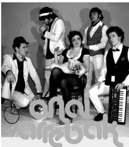
23:30ean hasiko da kontzertua.

23:30 Anai Arrebak taldekoren kontzertua Askatasuna plazan.