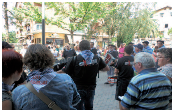
Kantu jirakoak Kuxkuxtu txarangarekin batera aritu ziren kantuan.