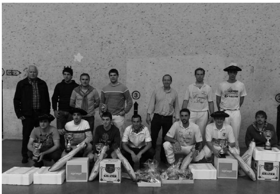
Pilota txapelketa apirilean hasi zen. Santixabel egunean jokatu ziren finalak, frontoia jendez lepo zela.

Onsalo (Areso) eta Arruti (Usurbil) nagusitu dira Usurbilgo Pilota Txapelketan. 22-16 gailendu ziren, Iruñeko Yoldi eta Landiribarren aurka. Apirilean hasi ziren kanporaketak eta Santixabel egunean jokatu ziren finalak. Frontoia jendez lepo egon zen.