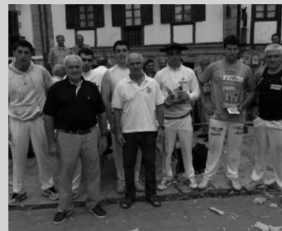
Partehartzailak eta epaileak, sari banaketa ekitaldiaren ondoren.