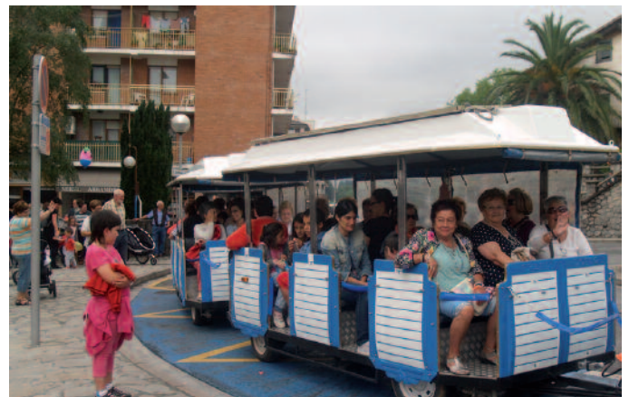
Txu-txu trenak arrakasta handia izan ohi du.