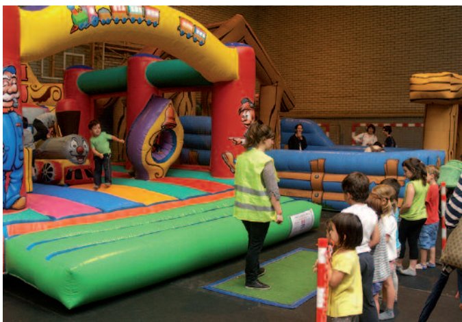
Hainbat puzgarri ipini ziren kiroldegian.