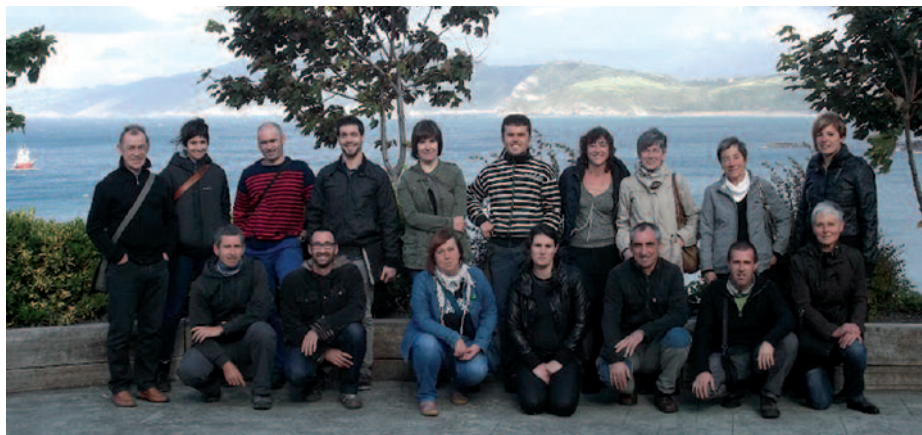
Zero Zabor Ingurumen Babeserako Elkartearen sortze batzarra Getarian egin zen.