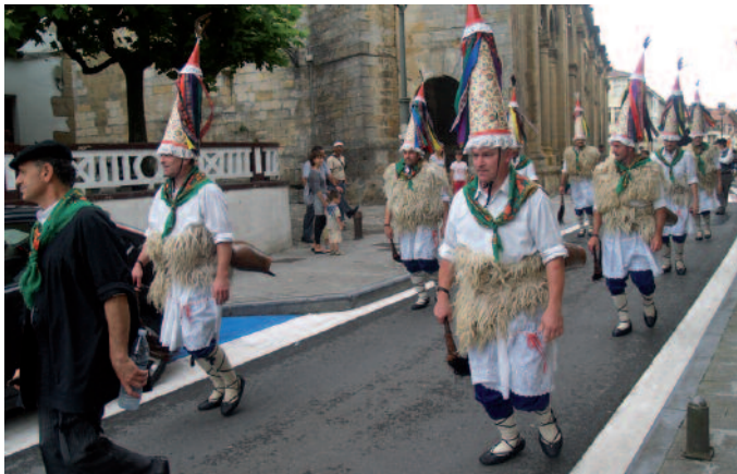
Igande eguerdian, zanpantzarren dilin dolon hotsak jabetu ziren herriaz.