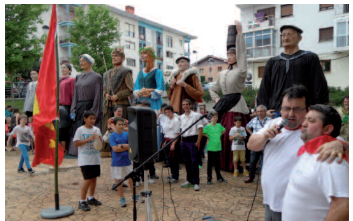
Iruñekoarekin bat egin zuen Txapeldun aurreko txupinazoak.