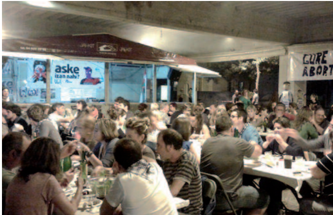
Txosnak jaietako gune garrantzitsu izan dira.