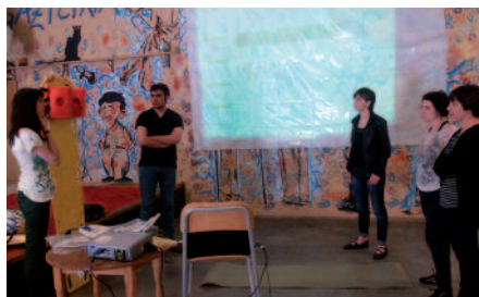
Astelehenean eman zuen eskola Saioak.

Asko. Jendeak konturatu behar du, egiten ditugun gauza guztiek, batzuetan txorakeriak iruditu edo ondorioz ez dutela uste izan arren, badute eraginik. Honekin ezin da esan gauzak ezin direnik egin. Nahi dugun guztia egin dezakegu, baina beti ere segurtasun neurriak hartuta. Obra batean adibidez, krisiagatik baliabide gutxiago egonda, ez dira segurtasun neurri egokiak hartzen. Pertsona bat obran