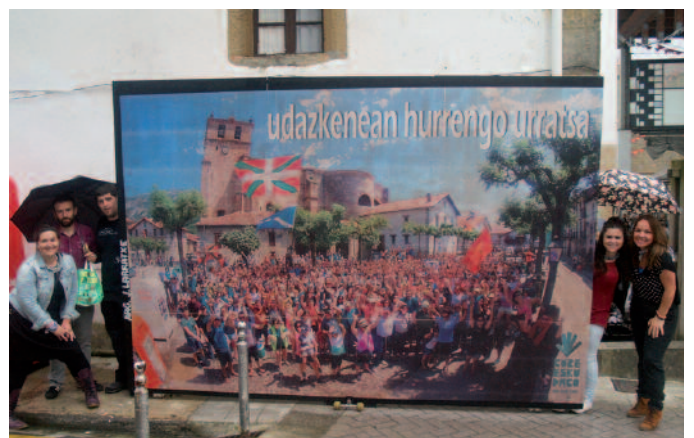
Gure Esku Dago taldekoek mural batekin apaindu zuten herria.