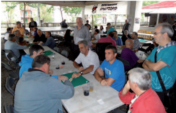
Gazte eta heldu ibili ziren mus txapelketan.