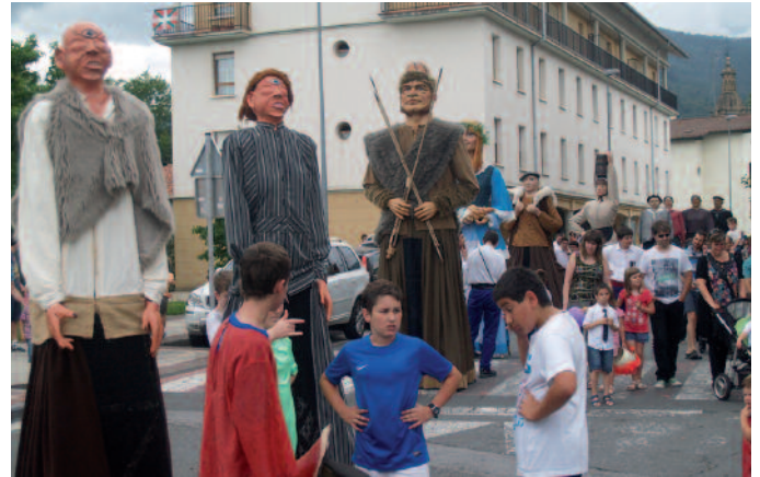
Gaztetzok dira erraldoiak gobernatzen dituztenak. Eta nola gainera.