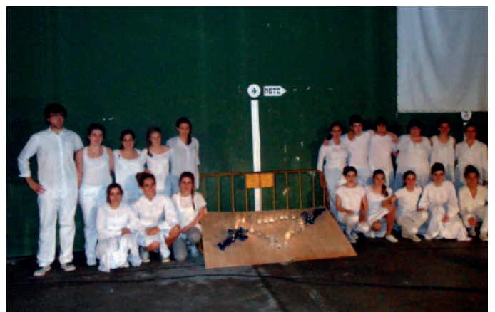
Euskal presoak Euskal Herriratzeko eskaera egin zen azken trakan.