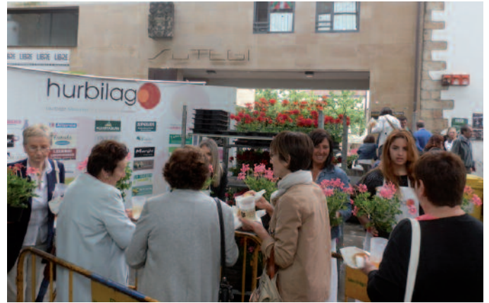
Lore eta salda banaketan, lan handia egin zuten Hurbilagoko kideek.