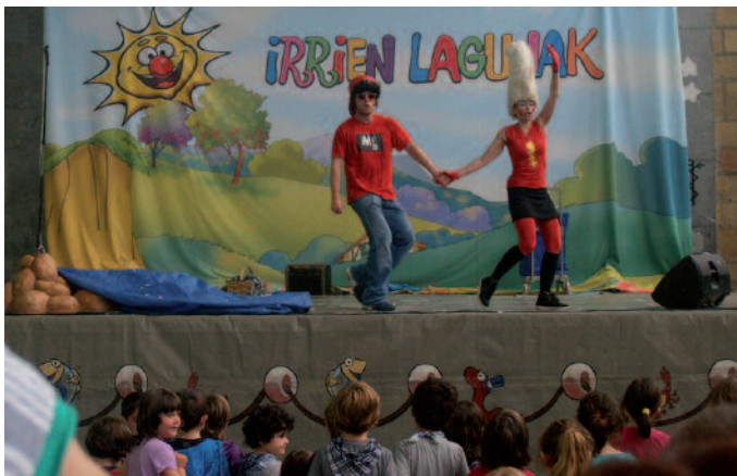
Pailazoak ere bertaratu ziren jaietan.