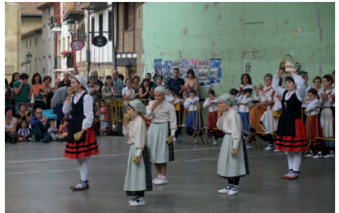
Herriko dantzarien emanaldiak arrakasta handia izan zuen.