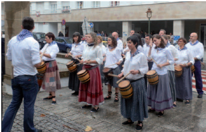
Jaietako suziria piztu eta berehala hasi zen helduen danborrada jotzen. Euripean aritu behar izan zuten.