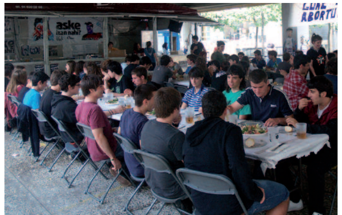
Gazte Eguna ospatu zen ostiralean. Argazkia bazkarikoa da.