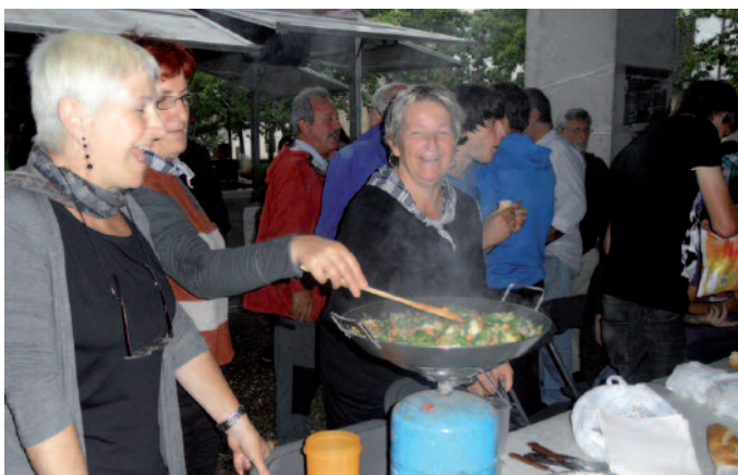
Paellak itxura ona du, eta sukaldariak primeran ari dira!