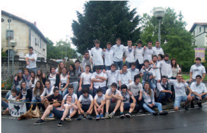
Goizean goizetik abiatu ziren oilasko biltzaileak. Eguerdirako kaxkoan ziren.