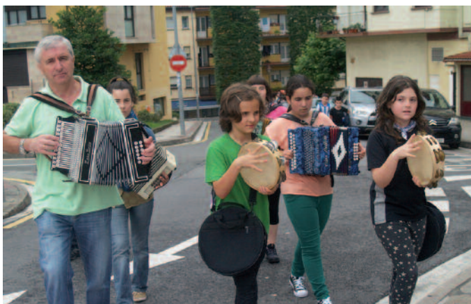
Zumarte Musika Eskolako trikitilari eta panderojoleak, egur batean.