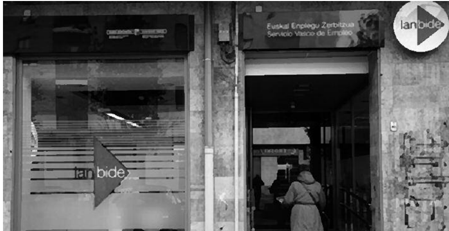
Lasarte-Oriako Lanbiden aurkeztu behar dituzte lan-eskaintzak enpresariak.

E skualde mailako udalek eginiko deialdia, balarako enpresa eta profesionali zuzendua dago. Diru-laguntzak jaso ditzakete, langabetuak kontratatzen dituztenek: