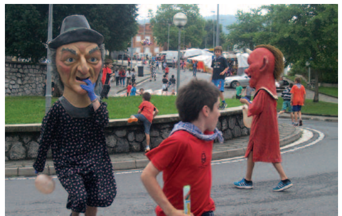
Egur batean aritu ziren ere erraldoiak eta buruhandiak.