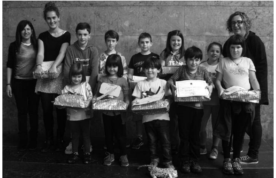
Beste behin ere, partehartzea handia izan zen Pintura Lehiaketan.