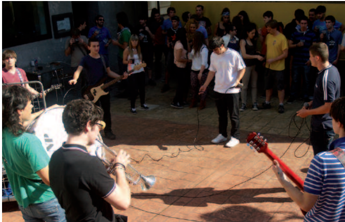
Zuek ez bazatozte, gu goaz zuengana. Horrela ugaltu dira elektrotzarangak.