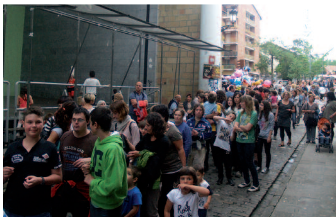
Txokolate-janean, izugarrizko ilara sortu zen.