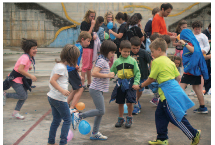
Euriak ez zuen Umeen Eguna zapuztu. Umeen umorea ez behintzat.