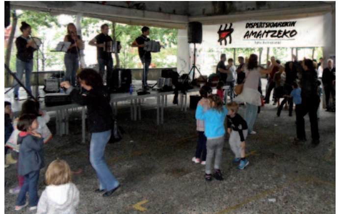
Askatasuna plaza dantzan jarri zuten trikitilariak.