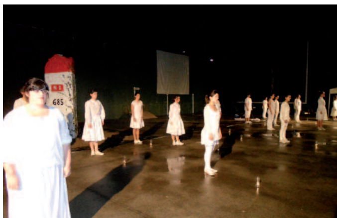
Maskotaren erretzea hunkigarria izan zen.