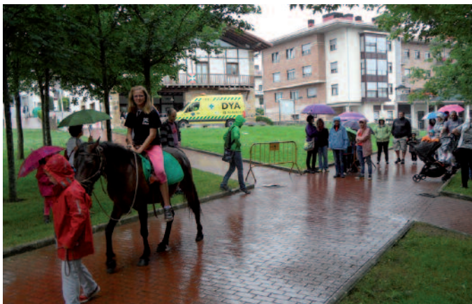
Artzabalena, pottoka gainean ibiltzeko aukera izan zen ostegunean.