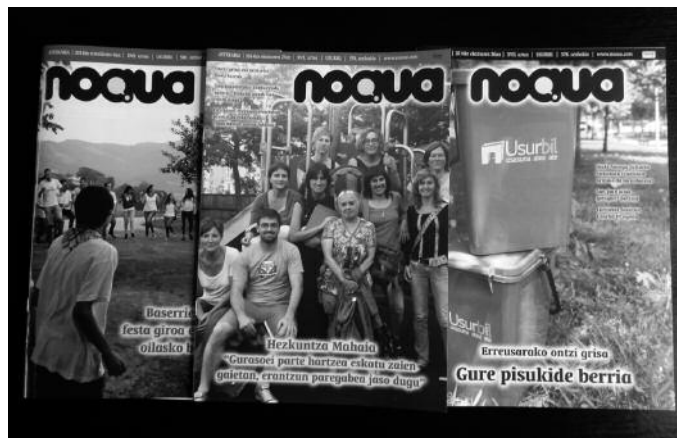
Zorion-agurrak, oharrak... ekartzeko azken eguna: uztailak 14 astelehena.

Urtero moduan, uztailaren 15etik aurrera hasiko ditugu bazkidetza kobraketak. Kuota, iaz bezala, 36 eurokoa izango da. Kutxa bidez kobraketa egiteko baimena eman badiguzu, bide hori erabiliko dugu aurten ere.