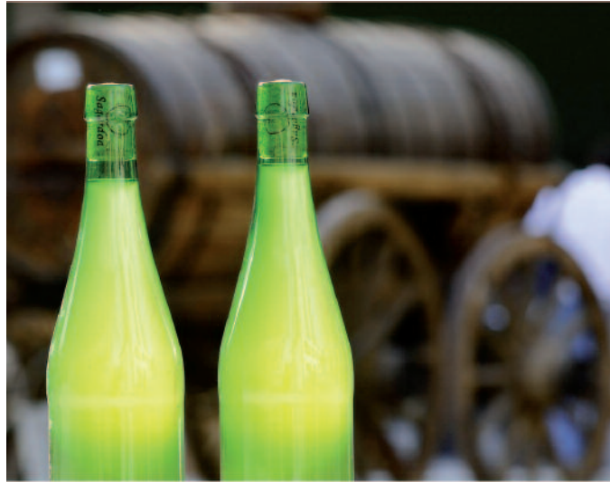
“Aitortuko ditugu / publiko egiyak / gure kolejiyuak / sagardotegiyak”.

“Ez dut nahi hemen nire burua juzkatu baina ez kezkatu nire graziya nahi dut zuekin ospatu; aspaldi hartu nuen hementxe ostate bi mendek dezakete hau egiaztatu pentsa zenbatak nauen Urdairan dastatu”.