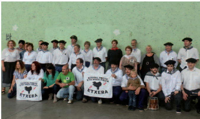
Preso politikoak eta iheslariak gogoan izan zituzten soka dantzan. Iaz baino hobeto aritu ziren Bildukoak. PSE zein Aralarreko zinegotziak ez dira aurtengoan aritu.