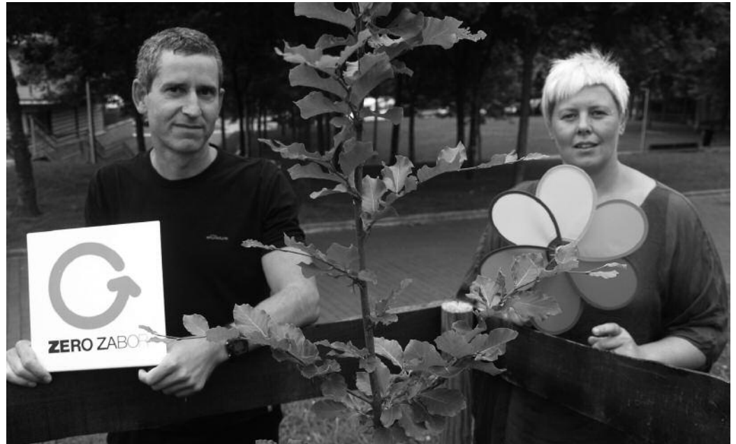
Zero Zabor Ingurumen Babeserako Elkartearen integratu dira Usurbil Zero Zabor taldeko kideak.

Sortu ginenetik gauzak abiada handian gertatu dira. Eguneroko lanak, burua altxa eta aurrera perspektibarekin begiratzeari zaildu du. Errauste planta bertan behera gelditzearekin aro berri batean sartu gara eta hori egiteko une aproposa zen. Horren beharra zegoen, helburuak eta bidea argi edukitzea garrantzitsua da, gainerakoan bitarteko helburuak sakralizatu egiten ditugu eta norabidea gal dezakegu. Errealitatea aberasten joan da praktika zehatzekin, eta guk, errealitate hori barneratu eta egokitu behar dugu. Bestetik, errauste plantak eragiten zituen hainbat baldintza desagertu dira. Atzean zegoen lobbyaren interes ekonomikoek tartean egoteari utzi diote, modu zuzenean egoteari behintzat, hautes lehiak eragiten dituen interesak dira orain Zero Zabor eredia zapuzteko geratzen den arrazoi nagusia. Errauste plantak hamarkadetakokudeaketa eredia baldintzatuko luke. Hori gelditzeko borrokak denbora eta ahalegin asko kentzen zizkion zero za-