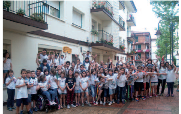
Udajolasekoak ere oilaskoak biltzen aritu ziren.