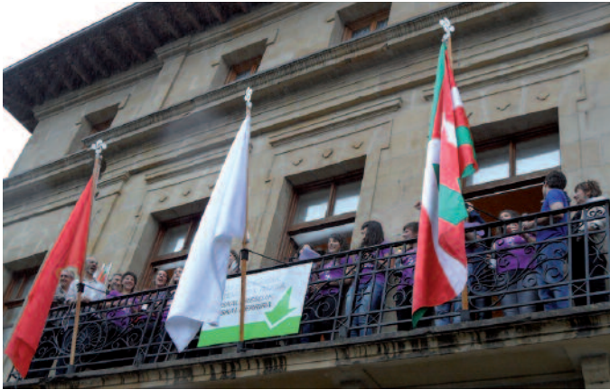
Eskubaloi taldeko neskek piztu zuten jaietako suziria.