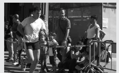
5,2 kilometrotakoa da ibilbide laburrena, 10,75 km luzeenarena.

laz bezala, bi ibilbide dituzue aukeran; bat motza, 5,2 kilometrotakoa. Bestea honen bikoitza, 10,75 kilometrotakoa. Lasterkari guztiak, Mikel Laboa plazatik abiatuko dira, irailaren 21ean, goizeko 11:00etan.