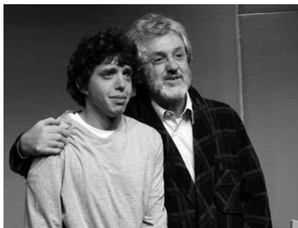
Eskaintza hau soilik bazkideentzat da. Topa Eszenikako xehetasun gehiago 8. orrialdean.

Antzezlantarako sarrerak, obra bakoitza programatu den egunean bertan jarriko dituzte salgai. NOAUA!ko bazkideok, ordea, adi. Zuen artean lau gonbidapen bikoitz ditugu "Satisfaktion" eta "Amets zirkoa salgai" ikusteko. Beste bina bikoitz, "Hitzak" eta "Etzi" (argazkian) antzezlantza ikustera joateko. Nola lor daiteke gonbidapen horietako bat? Oso erraza da. Email bat idatzi erre-dakzioa@noaua.com helbidera. Zehaztu