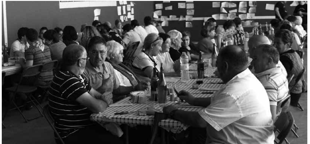
Herri bazkaria igandean egingo da, irailak 21. Txartelak Ibai-Ondon eta Zaharren Egoitzan daude salgai.

Iragana, oraina eta datorrenari begira jartzea proposatu diegu Jai Batzordeko hiru kideei.