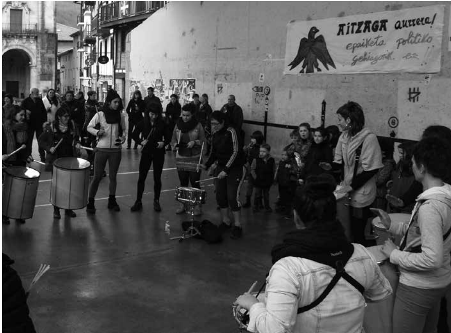
Irailaren 30ean amaituko da izena emateko epea.

Iazko esperientzia ona errepikatu asmoz, berriz antolatu da batukada ikastaroa. Saiok urritik abendura egingo dira, egunotan; urriaren 4an eta 18an, azaroaren 15 eta 29an eta abenduaren 13an. Izen emateko dei-