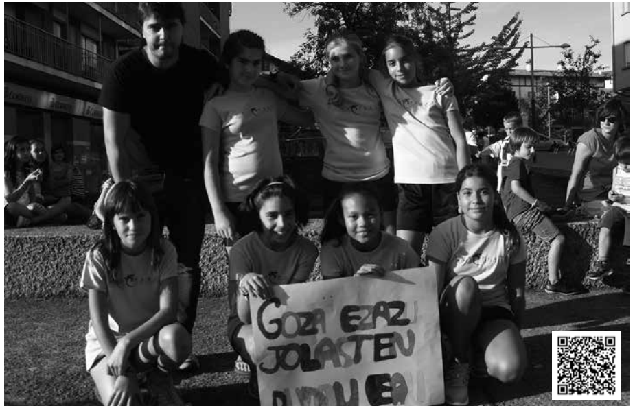
"Goza ezazu jolasten dudanean", hala dio talde honen lema. Irudi gehiago, noaua.com atarian.

Usurbil FT-k antolatutako kirol ekimen herrikoa aurkezteko hitzordua baliatu nahi izan zuten horretarako. Askatasuna plaza, Mikel Laboa plazarekin lotu zuten kartelak eskutan, desfile batekin. Abiatzen zen Usurbil Cup giroaren hasteko gainera, frontoi atzealdean, taldeko argazkiak atera zituzten gero. Antolatzaileek, jokalariek, taldeetako arduradun eta gurasoak inplikatu nahi dituzte, neurketetan