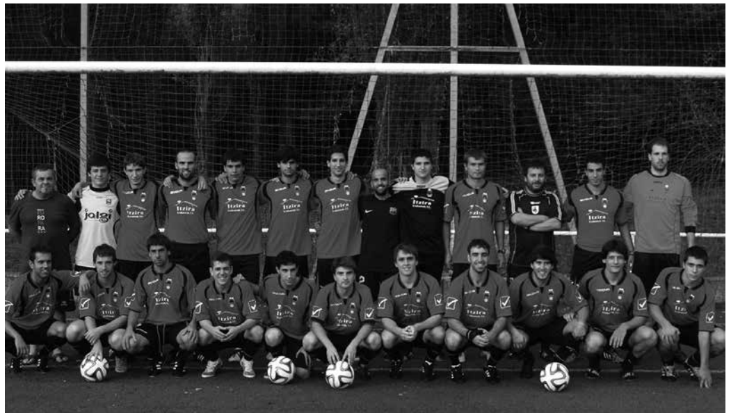
Astelehen honetan, entrenamenduan atera genuen taldeko argazkia.

Hernanik fitxatu ninduen, iaz Usurbil zegoen mailara jaitsia zen. Fitxatu ninduten urtean igo ginen eta hurrengo urtea oso zaila egin zitzaigun, nahiz jokalaririk veteranoak eta maila ezagutzen zuen jendea izan. Aurreko urtean beste erritmo batean jokatzen zuten eta jautzia zen. Gogoan dut 9. jardunaldian azkenak ginela bost punturekin, gero egoera hari buelta eman ge-