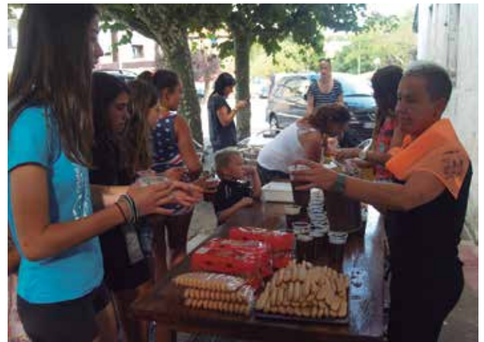
Jan-edanik ez zen falta izan.