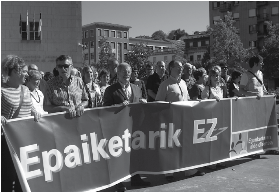
Aurreko astean elkarretaratzea egin zuten Donostian.

1 1 urte iraun dituen amets gaiztoa amaitu ote den edo ez jakin gabe jarraitzen zuten Egunkariako auzi ekonomikoko auziperatuek, astearte goizean, aldizkari hau inprentara bidean zela. Berez, aurreko ostiralean ezagutzera ematekoak ziren epaileak, auziperatuok epaituko ote dituzten edo ez. Baina erabakiaren berri eman gabe jarraitzen zuten astearte goizean.