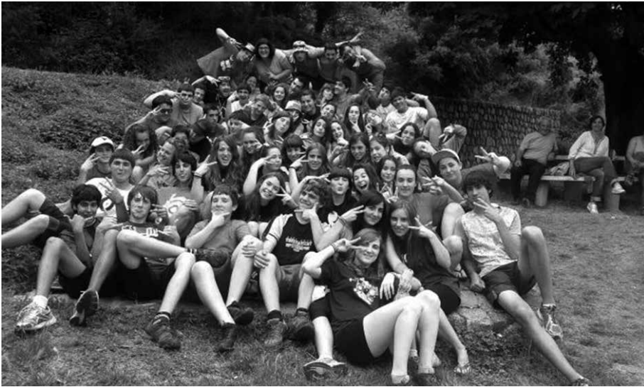
Asteburu honetan egingo dute gau pasa Urdaiagan. Dena den, alde zurretik eman behar da izena, ziortzage@gmail.com e-posta helbidera idatziz.

Asteburu honi begira antolaturiko irteera honekin abiatuko dute ikasturte berria Ziortzakoek. Irailaren 26 eta 27rako antolaturiko hitzordurako aurrez eman behar da izena, ziortzage@gmail.com helbidera idatzita. Ekimena, DBH 1, 2, 3 eta 4. mailako ikasleei dago zuzendua. Ostiral arratsaldeko 18:00etan