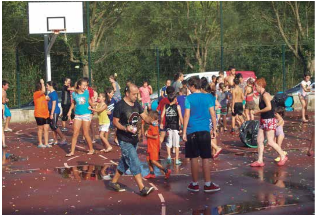
Giro ederrarekin igaro dituzte jai egunak Santuenean.

T radizioa hautsi da. Oraingoan, eguraldiak as-teburuan ospatu diren Santuenerako jaiak errespetatu ditu. Halere, giro txarrenerako ere prest ziren. Estalpe berria baitute; frontoia. Pilotalekua eta aurreko plazatxoak izan dira, herri bazkari, kontzertu, haur jolas eta zenbait txapelketen lekuko zuzenak. Auzo giroko festak dira Santuenerakoak, urtean behin, auzotarren topagune izan eta auzo giroa berpizten dutenak. Amaitu dira aurtengoak. Orain, Aginagako San Praixkuak begi bistan. Urriaren 2tik 11ra. Aurtengo azken festak etorri zain, hemen joan berri zaizkigun Santuenerako jaien hainbat irudi. Nooia.com atarian dituzue argazki eta bideo gehiago.