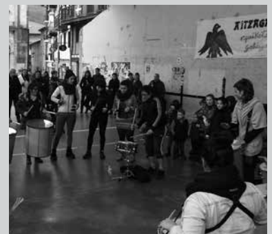
Datorren astelehenean amaituko da izena emateko epea.

Saioak urritik abendura, egunotan; urriaren 4an eta 18an, azaroaren 15 eta 29an eta abenduaren 13an. Izen ematea zabalik, irailaren 30era arte. Apuntatzeko, deitu 943 377 110 telefono zenbakira edo idatziz parekidetasuna@usurbil.net helbidera. Mezuan, izen abizenak, helbidea eta harremanetarako telefono zenbaki bat zehaztu.