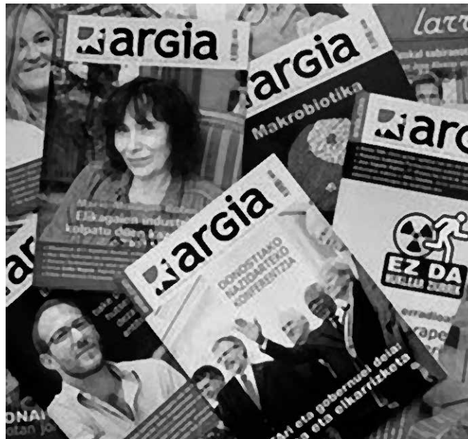
“Irakurleak gure bazkideztat eduki nahi eta behar ditugu Argian”.

Ezezagutza handi hori urratu nahian sortu genuen Argia Eguna 1982an. Aurretik hainbat ahalegin eginak ziren Zeruko Argiako kideak: “Prentsa Euskaraz” kanpaina, “1.000 bazkari Argiaren alde” (geroztik hain famatuak egin diren sukaldari onenekin) Anoetan, eta abar. 1982an kide gazteok Argia Eguna proposatu genuenean, beterranoenak konbentzitu behar izan genituen: “Hainbeste lan zertarako?”. Berdintsu sentitu nintzen ni, gaurko taldeko zaharrena, esan zidatenean