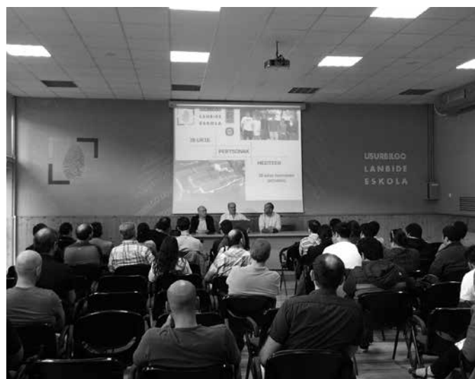
Sei hilabetez egongo dira gure artean, energia mota ezberdinei loturiko eskolak jasotzen.

30 txiletar sei hilabetez Lanbide Eskolan izango dira, energia berriztagarrien inguruko ikasketetan trebatzen. Txileko gobernua lagunduta eta Eusko Jaurlaritzarekin duten hitzarmenaren baitan etorri da txiletar ikasle taldea gure artera. Irailaren 15ean egin zitzaizen harrera. "6 hilabetez egongo dira gure artean, energia mota ezberdinei loturiko eskolak jasotzen. Eskolak teorikoak zein praktikoak izango dira eta 3.mailako profesionaltasun agiriaren eskakizunei erantzuten diete. Eskolak esperientzia aberasgarria izan dadila espero du", berri eman dute Lanbide Eskolatik.