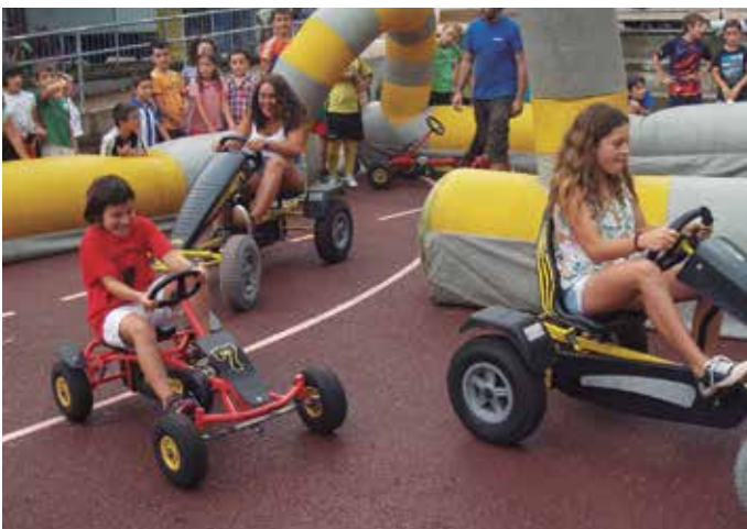
Txikiak zein helduek, ederki asko pasatzeko aitzakia ugari izan dituzte egunotan Santueneko jaietan.