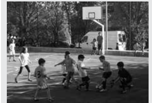
Sari banaketa 18:15ean hasiko da.