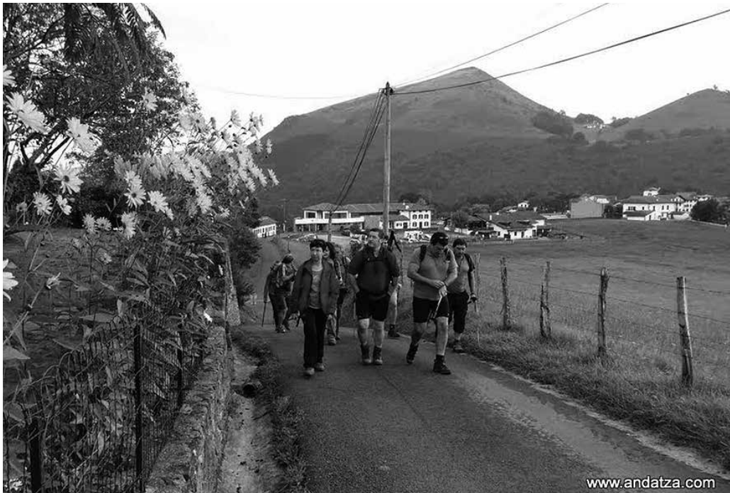
19 kilometro ditu ibilbideak eta 5 ordutan egitea aurreikusitakoak.

Urriaren 12an, goizeko 7:00etan Oiardo Kiroldegitik autobusez abiatuta, "Lalastratik Herranera mendi ibilbidea egiteko asmoz. Igoko dugun mendia; Recuenco (1.240 mt.). Ibilbideak 19 km ditu eta 5 ordutan egitea aurreikusten da", antolatzaileek aurreratu dutenez.