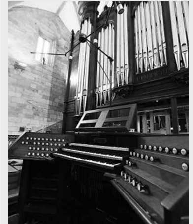
Kontzertua Salvatore parrokian izango da, 20:00etatik aurrera.