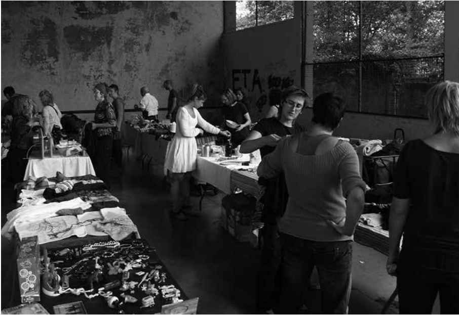
Frontoian ipini ziren trukea egiteko postuak.

Zortzi edizioen ostean, truke-rako plaza propioa du Usurbilek; Txokoaldekoa. Truke Eguna ospatu zuten berriz, aurreko igandean. Eguraldi ezegonkorragatik, badaezpada, lehenago Erroizpe elkarte aurrean ospatu izan den hitzordua, auzoko