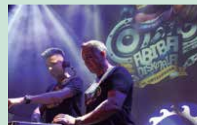
Abiba Dj urriaren 11n arituko da.

Herriko taldeak, erromeria, dj-ak aukeraturiko dantzarako denetarikoa abestiak... Musika eskaintza zabala hastear ditugun San Praixkuetan. Arto2xar, Desegin, Can't Explain eta Karaokea Eliza Zaharrean ostiral gau honetan. Larunbateko herri afariaren ostean, Ingo al deu. Beste erromeria talde batek, Itzartukoak datoz urriaren 10ean. Musikaz blai datozkigu Aginagako San Praixkuetako parranda gauak. Parranda gau nagusia halere, jaietako azken egunerako erreserbatu du Jai Batzordeak. Dj gaua urriaren 11n; Abiba lehenik frontoian, Aros goizaldean Eliza Zaharrean.