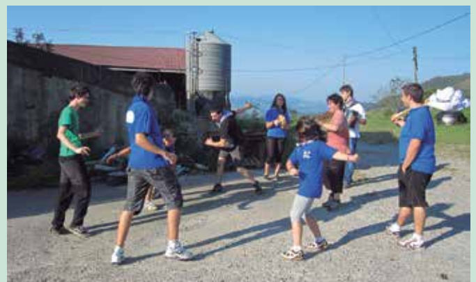
Urriaren 11n irtengo dira oilasko biltzaileak.

Ez dute goizeko 6:00etan hasiko den itzuli osoa egingo. Baina herri gune inguruak zeharkatzeko asmoa dute. Eguerdiko 12:00ak inguruan Mapiletik abiatuko dira oilasko biltzaile eta zantantzarrak, denak batera. Eguerdiko 14:00ak aldera, frontoi ingurura helduko