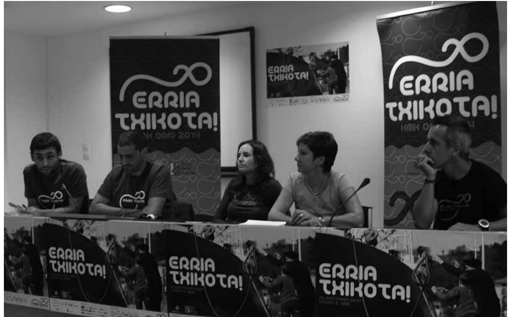
Orioko Kilometroak jaialdia aurkezteko, antolatzaileek prentsurrekoa eskaini zuten iragan ostiralean.

G onbita egin digute jada; “Urriaren 5ean egun eder bat pasatzera etorri”. Oriotarrak igande honetan, urriaren 5ean milaka euskaltzale eta ikastola zaleei harrera egiteko prest eta irrikitan dira jada, antolatzaileek aurreko ostiralean Ikastolen Elkarteko egoitzan burutu zuten agerraldian adierazi zuten bezala. “Erria Txikota!” lemapean ospatuko den jaialdiko zehaztasunen informazioa eskaini zuten. Urte osoko herri-lanaren ostean, oriotarrei fruituak jasotzeko unea heldu zaiela adierazi eta urriaren 5eko jai, “etorkizuneko erronkak betetzeko hazi berria” izango dela ere gaineratu zuten.