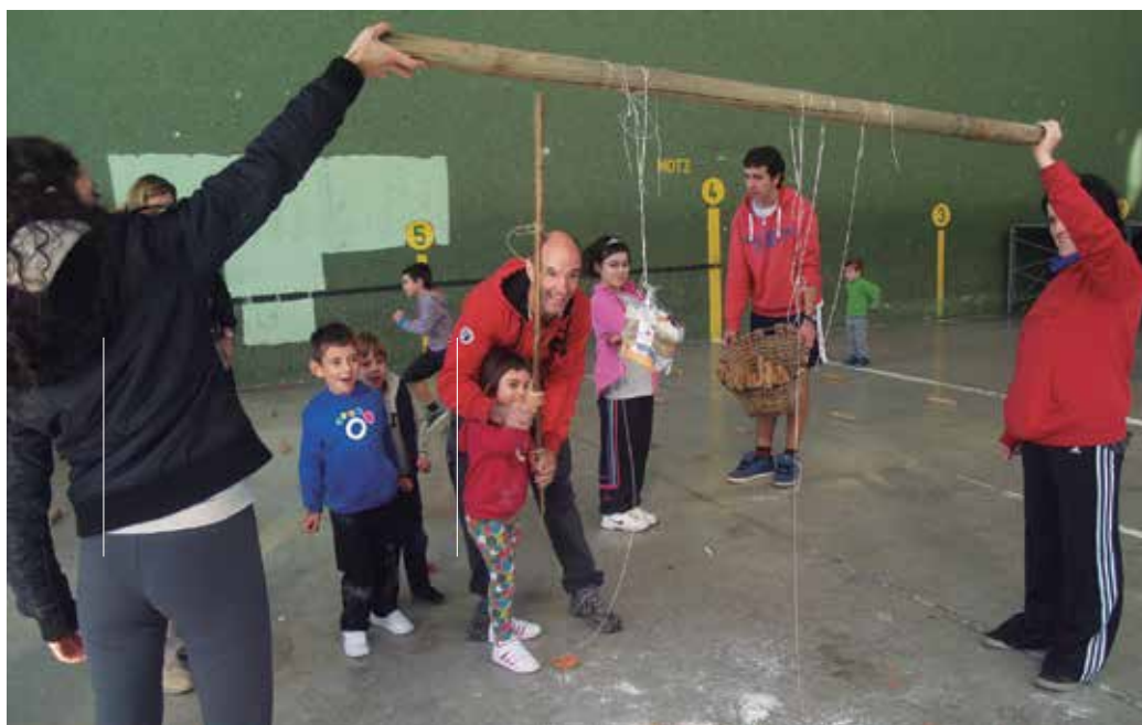
Aginagako Eskola Txikian jai egingo dute urriaren 10ean, Umeen Eguna ospatuko dute-eta.

Ondoren, primerako txokolata-da eta buruhandi bizi-biziak. Hasi korrika!