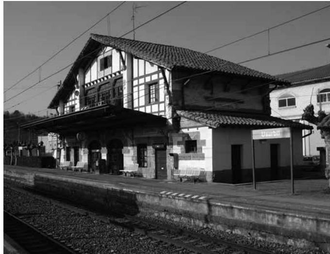
Kilometroak-era garraio publikoan gerturatzea aholkatu dute antolatzaileek.

Adi, N-634 itxita egongo baita Usurbil eta Zarautz artean. Honenbestez, urriaren 5ean autoa hartu behar baduzue, larrialdi egoerak salbu, ezin duzue baliatu Usurbil eta