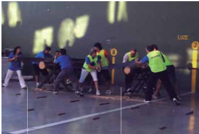
Elkarren artean lehiatu arren, elkarlanean prestatuko dute desafioa.