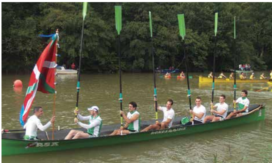
Hondarriak irabazi zuen iaz. Ea aurten nor gailentzen den!

A rraun denboraldia amaitu dela uste bazenuten, oker zineten. Aurten ere Aginagan jokatuko baita, urteko azken estropada. San Praixkuen azken egunean, urriaren 11n izango da, arratsaldeko 16:00etan hasita. Gipuzkoako kosta parteko arraun taldeak Orian lehiatuko dira, aginagarren bandera preziatua etxeratzeko asmotan; gizonetzkoen 6 talde eta emakumezkoen lau talde guztira.