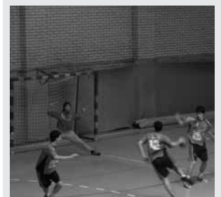
Larunbat honetan, 18:00etan.

Senior mutilek estreinatu berri duten mailari dagokion datorren jardunaldia Eibarren jokatu dute. Larunbat honetan, 18:00etatik aurrera, Usurbil K.E.-tik adierazi dutenez, "iaz Zilarrezko Ohorezko Mailara igoera jokatu zuen Eibar Eskubaloia taldearen aurka, J.D. Arrate desagertuaren oinordekoaren aurka".