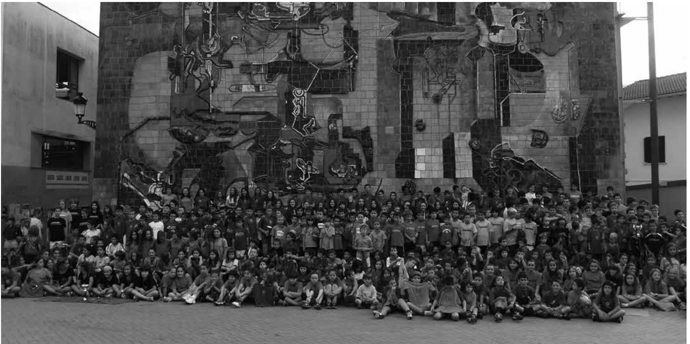
Sari banaketaren amaieran, familia argazkia atera zuten Mikel Laboa plazan.

Azer nolako haur eta guraso festa zegoen, aurreko igande arratsaldean frontoiaren bueltan. Ez zen gutxiagorako. 34 talde eta 350 jokalarik baitziren guztira. Usurbil Cup txapelketari buruz ari gara. Irailaren 28an ospatu zen amaiera festa, goizean eta bazkalostean jokaturiko azken partida eta sari banaketa ekitaldiarekin.