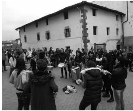
Larunbat honetan hasiko da batukada taldea entsetzen.

J.A.: Positiboa izan da. Talde polita osatu dugu, adin ezberdinetako jendea zegoen. Batukadaren aitzakia egongo ez balitz, gure artean ez genuen harremanik izango. Hori izan da polita, adin ezberdinetako jende ezberdina elkartzea.