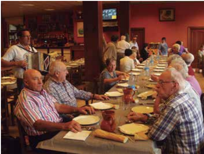
Larunbat eguerdian, giro ederrean ospatu zuten San Praixku eguna.