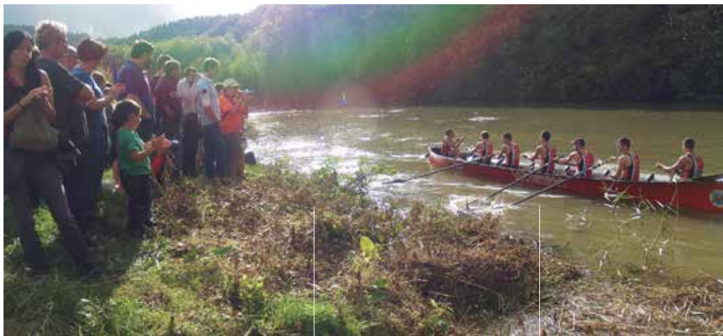
Trainerila Txapelketaren zortzigarren edizioa ospatuko da aurten.