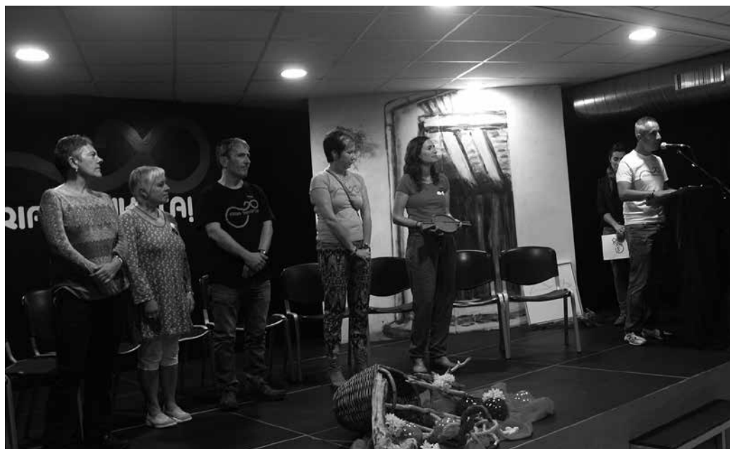
Iragan igandean, Orion bertan jaso zuten Kilometroak lekukoa Usurbilgo alkateak eta Udarregi ikastolako ordezkariak.