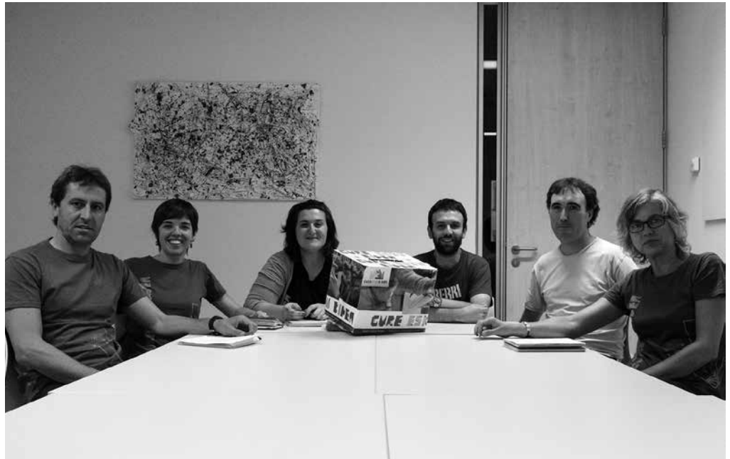
Urriaren amaieran batzar bat deitzeko asmoa du Gure Esku Dago lan taldeak.

Joan den irailaren 27an 73 herritako 175 lagun bildu ginen Gasteizen, aurrera begira dinamikak zein bide hartu behar duen adosteko. Hemeretzi ebazpen onartu ziren bertan, esaterako: GEDk erabakitze eskubideaz mintzo denean, estatus politikoaren inguruko erabakitze eskubidea izango duela ardatz; norberak izan dezakeen nazio edo identitate sentimendutik harago, erabakitze eskubidearen oinarria demokratikoa dela soil soilik, eta abar (ebazpen guztiak, bozka kopuruekin lagunduta, GED-ren webgunean dago oso osorik). Dinamikak, hemendik aurrera, hiru fasetan banatutako norabideari ekingo diola ere adostu genuen Gasteizen: lehenengo, aldarrikapena ehundu, hautestontzia osatuko genuke; bigarren fasean, edukiak adosteko garaia izango da, zer galdetu nahi dugun eta noiz galdetuko dugun; gauzatzea, erabakitzea