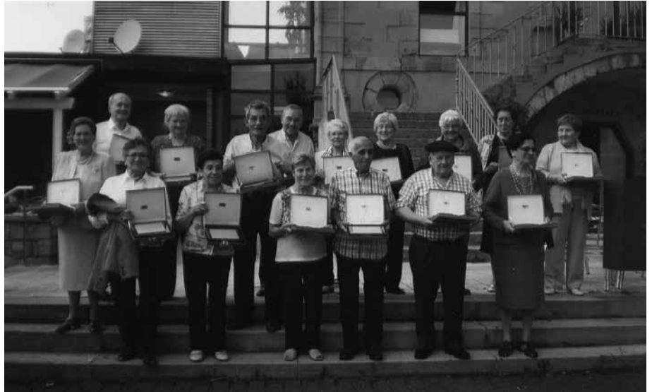
Atxega jauregian jaso zuten oroigarri bana.

Gurea Pakea Elkartetik jakinarazia duten oharra; datozen eguberrietako loteria salgai dute, elkarteak Artzabalen duen bulegoan.