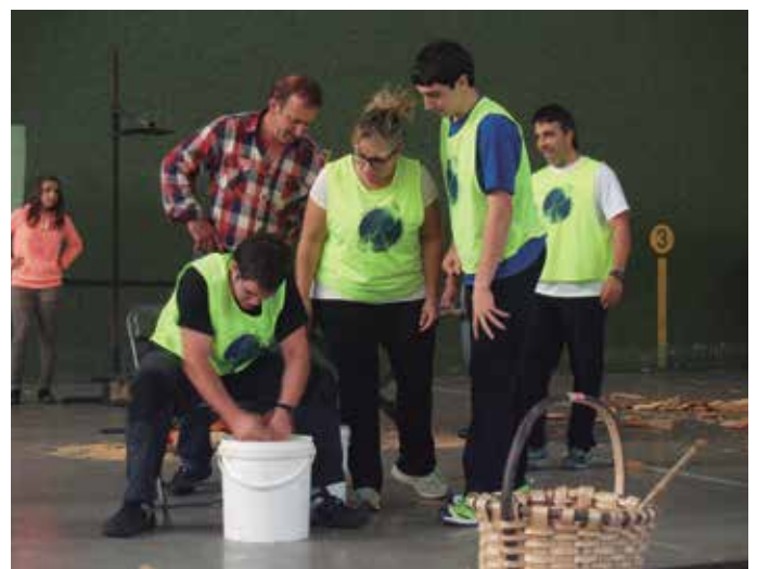
Lehian broma gutxi izaten da, gutxiago Aginagan.