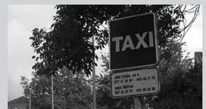
Buruntzaldetik dator tarifa ez garestitzeko erabakia.

Tarifa 2 (egunero, 22:00-07:00 artean; larunbat, igande, jai egun eta abenduaren 24 eta 31n, 7:00-22:00 artean ere bai) Egindako kilometroak: 1,7436. Itxaro ordua: 32,8274. Gutxienez, 6,1028.