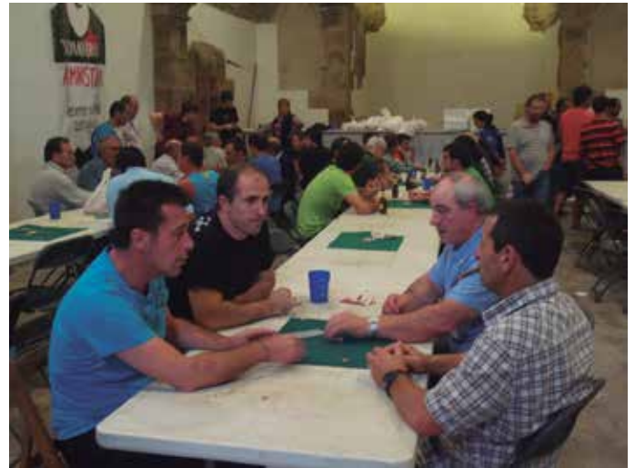
Mus txapelketa Eliza Zaharrean jokatu zen.