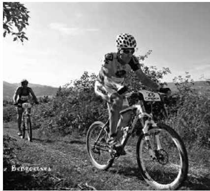
Mendi duatloia 16:00etan hasiko da. 15-18 urtekoen arteko lasterketa, lehenago, 15:00etan.

Zubietako Herri Batzarrak antolaturiko kirol probarako izen ematea, aurrez 15 eurotan. Egunean bertan, 20 euroren