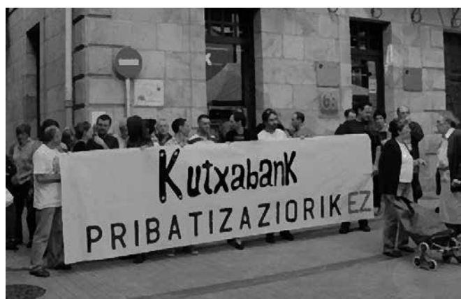
EH Bilduren mozioak ez zuen oposizioaren babesa jaso (argazkia, artxibokoa).

1-Usurbilgo Udalak herritarren, familien eta bertako ekonomiarren mesedetan arituko den Kutxabanken finantza-il-