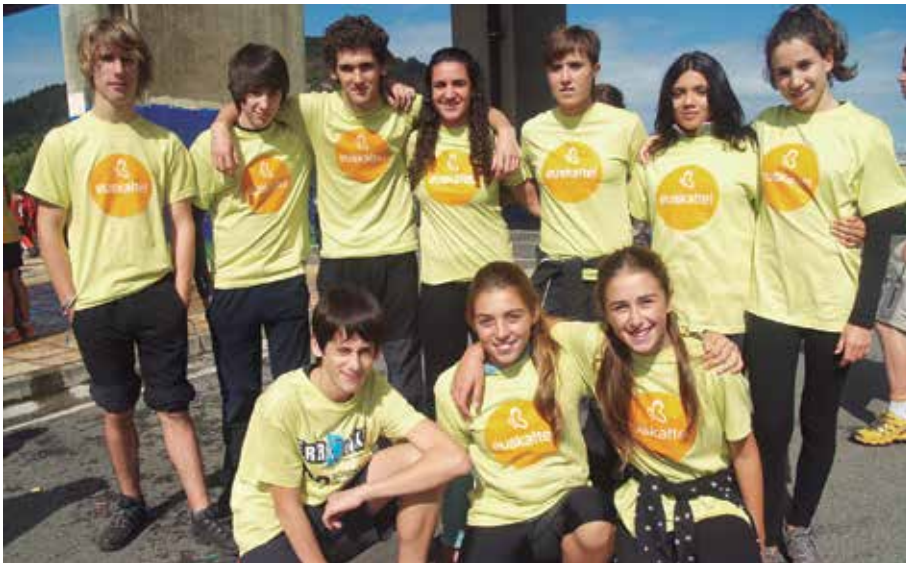
Orioko Kirol Erronkan DBHko usurbildar gazte hauek hartu zuten parte.

K ilometroak 15 ekimenari buruzko informazio gehiago nahi baduzue, ekimena bera kezagutu, helburuak, funtzionamendua, urteko ekimenak, sortu diren batzordeen zeregina... Adi, lehen bilera irekiak deitu baitituzte aste honetarako. Ostiral iluntzean Potxoenean, eta larunbat goizean, hau ere Potxoenean.