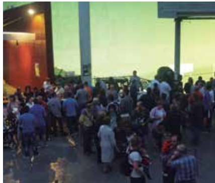
Larunbat arratsaldean, sardina eta sagardo banaketa herriko plazan.

Eguerdian, joaldunekin batera Mapildik plazara abiatuko dira oilasko biltzaileak.