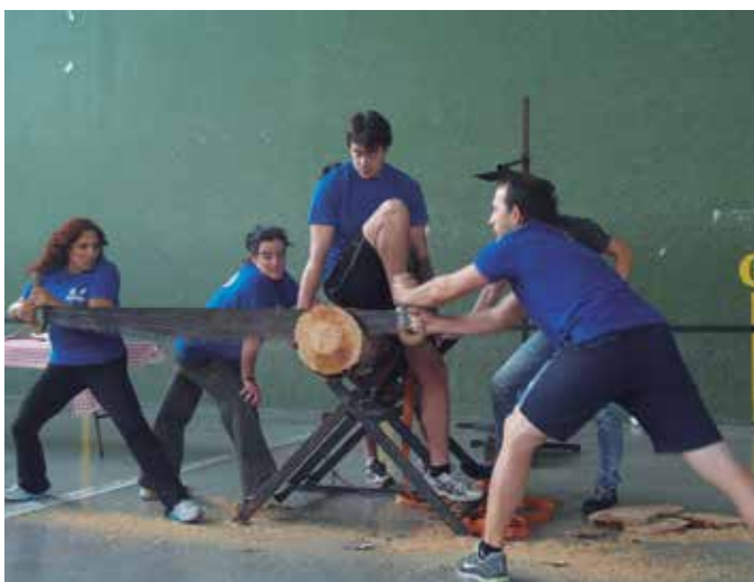
Herriko kiroletan jo eta su aritu ziren aginagarrak.