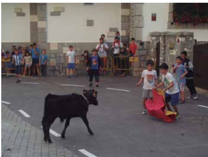
Gorritren animaliekin arratsalde ederra pasa zuten gaztetxoek.