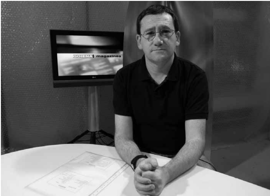
LH 5, 6 eta DBHko ikasleen gurasoei zuzendutako tailerra da, Hitz Ahok antolatutakoa.

G aur egungo familien ezaugarri bat aniztasuna da (nuklearra, banandua, dibortziatua, gurasobakarrakoa, beregituratuak ...). Eta gainera, ezbehar batek familia baten egoera alda dezake (banaketa, amonaren gaixotasuna, heriotza...). Egoera eta aldaketa hauen aurrean, maiz zalantzak sortu ohi dira seme-alabak hezteko garaian. Ikastaro honen bitartez, hainbat argibide praktikiko jasoko dituzte izena ematen duten gurasoek.