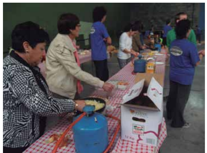
Patata tortilla eta ondorengo pintxo potea frontoian egin zen.