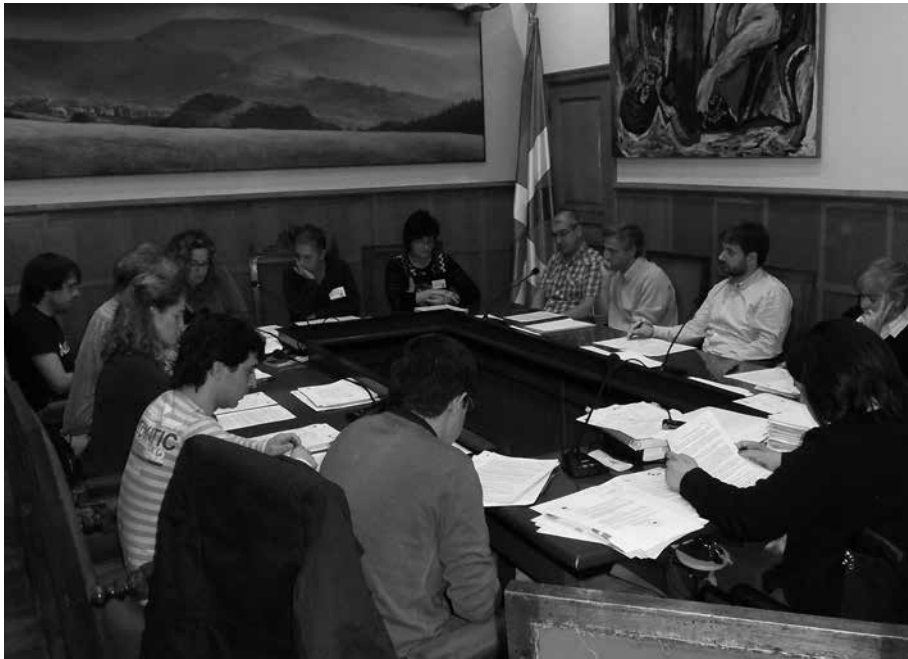
EH Bildu, Hamaikabat eta EAJ-PNV alderdiek bat egin zuten bozketan.