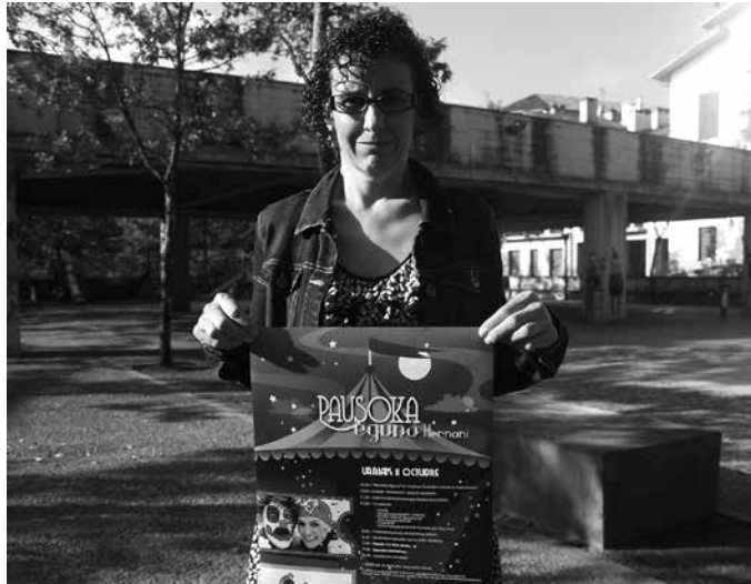
Gaixotasun arraro bat du bere alabak. Antzeko egoeran direnen aldeko festa izango da larunbat honetarako Hernanin antolatu dutena.

Zeintzuk dira une honetan dituzuen behar nagusiak?