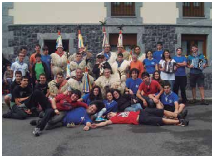
Argazki eta bideo gehiago: noaua.com web orrian.