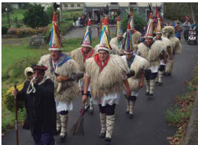
Oilasko biltzaileek zantantzarrak izan zituzten bidelagun.