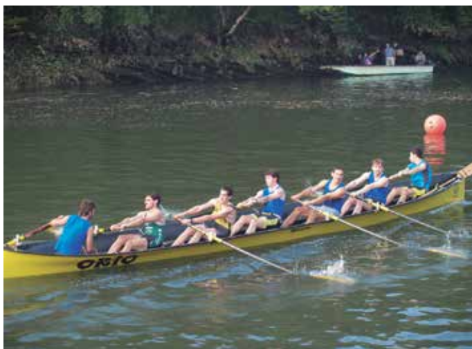
Mutiletan, laugarren izan ziren Aginagakoak Trainerila Txapelketan.

zuen San Pedrori minutu erdiko aldea atera. Sari nagusia ez zuten eskuratu, bai ordea publikoarena. Etxekoan txalo zaparrada eta babes handia jaso baitzuten aginagarrek.