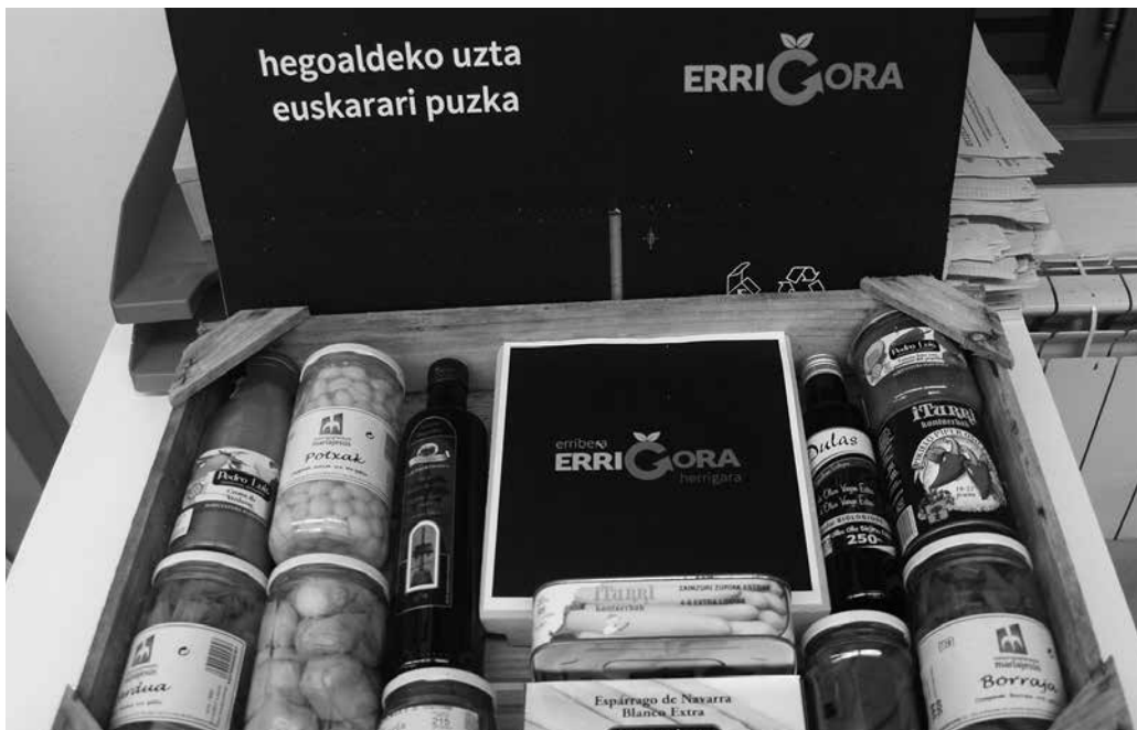
Iaz 112.000 euro batu ziren Nafarroa hegoaldeko euskalgintzarako.

Nafarroa hegoaldeko bertako produktuen ekoizpena eta zonaldeko euskara sustatu edo suspertzeko, elkartasun kanpaina antolatu du aurten ere Errigorak, Zazpiak Bat, Sortzen Ikastolen Elkarte eta AEKrekin elkarlanean. Nafarroako erriberako produktuez hornituriko saskiak salgai jarriko dituzte iaz bezala, erosi nahi dituen herritar oren esku.