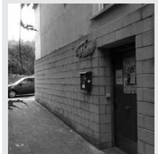
Kale Nagusian aurkitzen da euskaltegia.