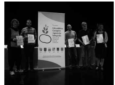
Astearte honetan egin da egitasmoaren inguruko agerraldia Lasarte-Orian.

Lan karga handitzen joan da gainera, egun, “Eusko Jaurlaritzaren eta Foru Aldundiaren diru-laguntzak kudeatzera eta horrekin batera udalek eskualdeko enplegura zuzendutako milioi bat eurotik gorako ekarpenak” egitera heldu dira. Horregatik defendatu zuten garapen agentzia