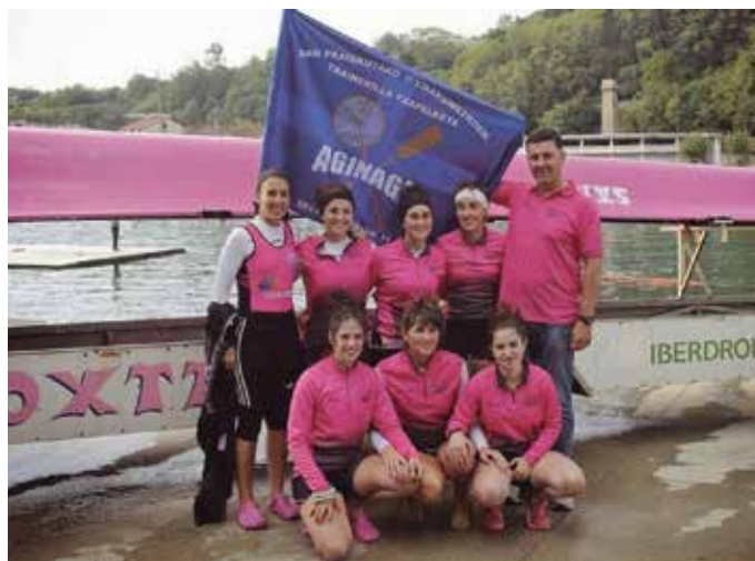
Nesketan, Sarai Lizasok eta San Juanek eraman zuten Aginagako Bandera.