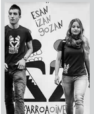
Esan, izan, gozan lemapean ospatuko da Zangotzako herrian.

Igandean Zangotzan ospatuko den Nafarroa Oinezen laguntza behar dute. 40 bat lagun behar dituzte. Inork lagundu nahiko balu, Udarregi Ikastolako idazkari-tzarekin hartu emanetan jar dadila. Bertako telefono zenbakia: 943 36 12 16. Nafarroa Oinezeko berri, atari honetan: nafarroaoinez.net