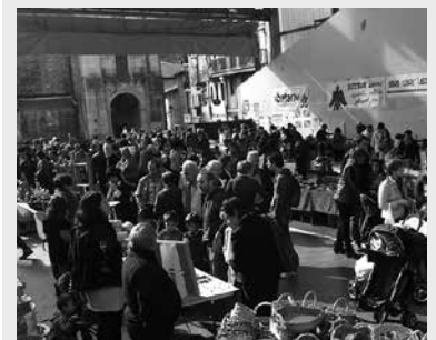
30 postu batuko dira frontoian.

Denetarik produktuak lantzen dituzten artisauek bilduko dira beste behin Usurbilen. 30 bat postu guztira. Azoka, Aitzaga Elkarte beste ehun bat elkarte bezala, Espainiako Auzitegi Nazionalaren erabakiaren zain dagoen honetan ospatuko da. Egoera zaila izan arren, urtero moduan azoka antolatzea erabaki dute Aitzaga elkarteko kideek. Bertaratzeko gonbita luzatzen zaie herritarrei.