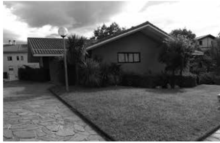
Kanpaina iraila amaieran abiatu zen. Informazio gehiago anbulatorioan jasoko duzue.

Halako kanpainak dituzten onurak nabarmentzen ditu Osakidetzak. “Ulertuko duzunez, Gripearen Aurkako