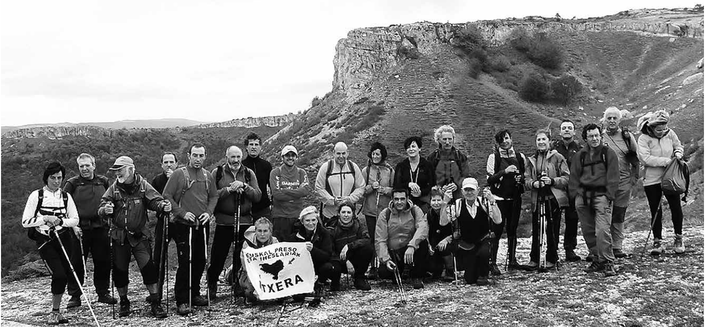
Araba eta Burgos artean kokatzen da Valderejo parke naturala. Hara joan ziren aurreko igandean hainbat herritar. Andatza Mendizaleen Kirol Taldeak antolatutako ibilaldia.