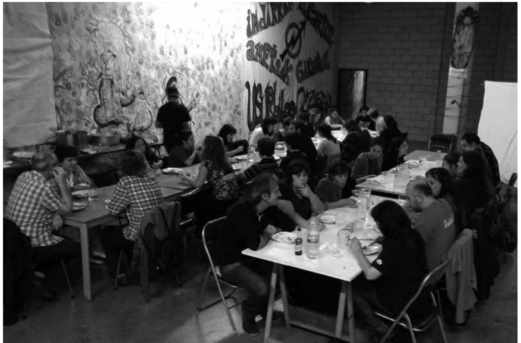
Afari beganoa egin zen aurreko ostegunean Usurbilgo Gaztetxean.

Argi eta garbi gelditu da Usurbilek gaztetxe baten beharra duela, bertan ospatu diren dozenaka ekintzek hala adierazten dute. Baita parte hartu duten herritarrek ere, 3 urteko umetatik hasi eta 80 urteko-ra, denak pasa baitira beraien hazitxoak uztera noizbait. Eta