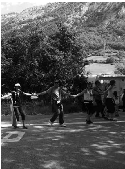
“Kataluniako prozesuaren eta demokraziaren defentsan”, mosaikoa egingo da Zurriolan.

Esan bezala, mosaikoa Zurriolan egingo da azaroaren 8an, 11:00-13:00ak bitartean. Ekitaldi ikusgarria eta berezia egin nahi da eta guztia ondo atera dadin, “alde aurretik izena eman beharko du bertan parte hartu nahi duenak (bakoitzak bere herrian). Partaide bakoitzak 5 euro ordaindu beharko ditu eta trukean mosaiko erraldoia egiteko erabiliko dituen aterkia eta zira jasoko ditu”. Izen ematea bideratzeko, Usurbilgo Gure Esku