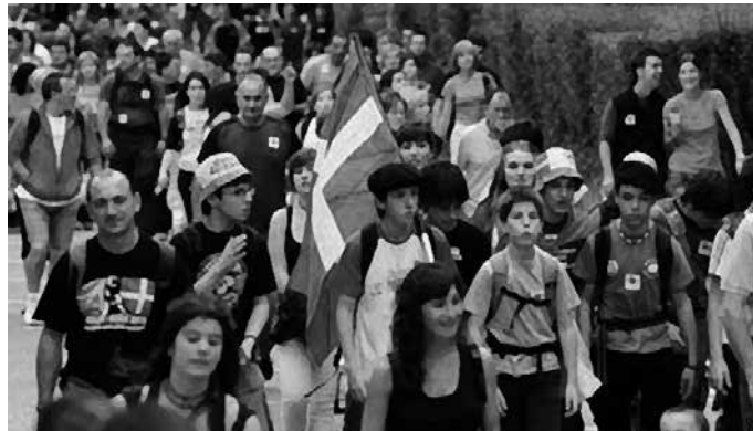
Ekonomia zein arropa batzordeak dira premia handiena dutenak.

Sortu litezkeen ezbeharrei aurre egiteko larrialdi zerbitzuak, sorospen postuak kudeatzeaz