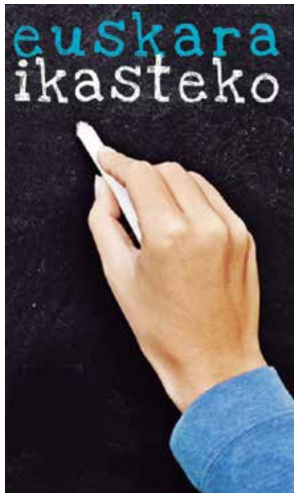
Iaz 41 usurbildar izan ziren laguntza honetaz baliatu zirenak.

Diru-laguntza kopuruak berriz %60tik hasi eta %100 bitartekoak dira. Diru-laguntza kopurua bi gauzek baldintzatzen dute: langabetua izateak eta egindako ikasketa mailak. Informazio gehiago eskuratzeko Potxoenean edo bestela 943 371999 telefono zenbakira deitu.