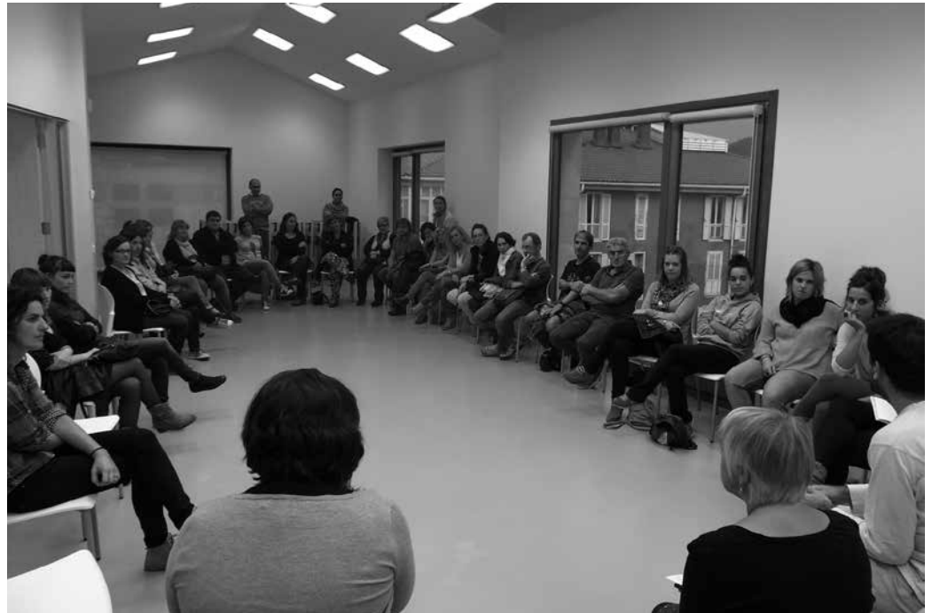
Aurreko astean egin zen Kilometroak-en inguruko lehen bilera.

haratago ordea, badira Kilometroak egitasmoarekin bete nahi diren beste zenbait erronka ere, Potxoeneako aurkezpen bileran azaldu zuten; hala nola, euskararen erabilera sustatzea, ikastolako proiektua indartzea, edota gure artera etorriko direnei, Ursurbil eza-gutuzera ematea.