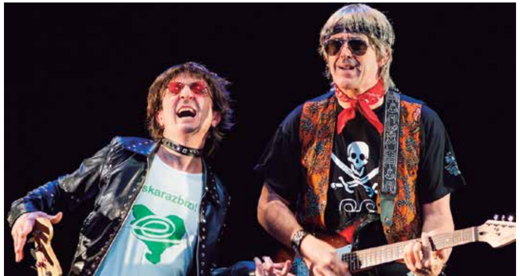
Azken urteotako obren zati onenak batu dituzte antzezlan berri honetan.