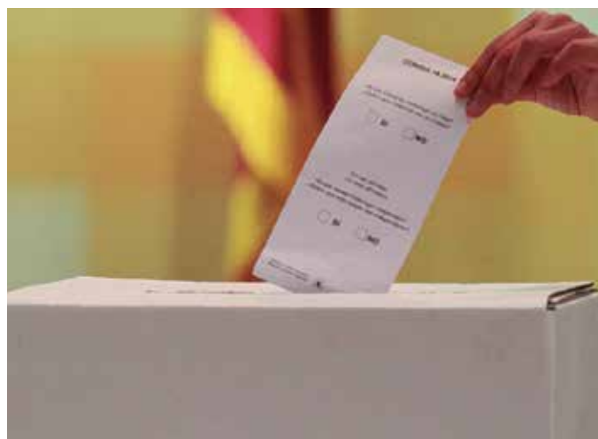
Igande honetan bozka ematera deituak izan dira Katalunian.