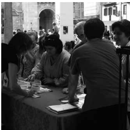
Donostian egingo den mosaikorako 130 lagunek eman dute izena Usurbilen.

Gogoan izan hitzordua; larunbatean 11:00-13:00 artean Donostiako Zurriola hondartzan. Izen eman duzuenok jaso duzuen txartela ondo gorde eta ekitaldira eraman. Trukean, mosaiko erraldoian parte hartzeko petoa eta aterkia jasoko duzue.