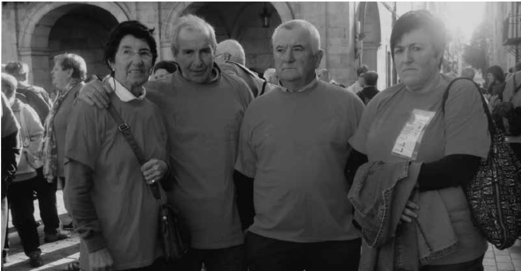
Gipuzkoako beste 72 jubilatuekin batera batu ziren Arrateko lau kide hauek.

9 kilometroko ibilbidea osatu zuten urriaren 25ean, giro eder askoan. Kamiseta laranjekin ondoko irudia duzue, kirol ekimen