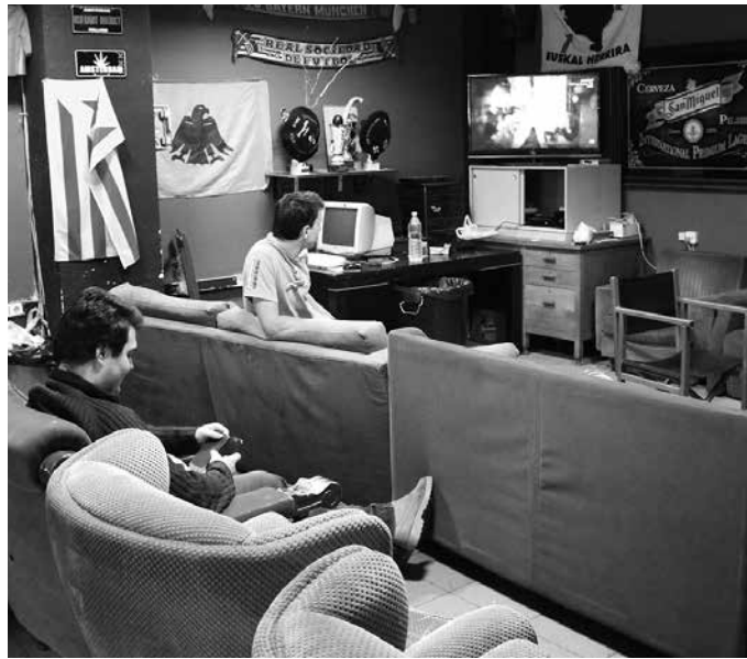
Parte hartze prozesu honen bitartez, araudia osatzeko ekarpenak batu nahi dira

Parte hartze prozesua abiatu aurreko lanketa bat egin du Udalak. Gai honen inguruko datu bilketa; lanketa horretatik jakin ahal izan dutenez, 10 dira egun Kaxkoaren bueltan ditugun gazte lokalak. Horietatik bederatzirekin hartu emanetan jarri da Gazteria Saileko zinegotzia, egitasmoa aurkeztu eta informazioa biltzeko. Galdetegi bat pasa zaie lokaletako erabiltzaileei; zenbat jende ibiltzen den lokalean, adina, neska edo mutil koadrilak diren... Oro har, lokaletatik kezka nagusi bat jaso dute; ia gazteen topaguneekin arazorik ba ote den eta hala ez bada, parte hartze prozesua zertarako egin galdetzen zuten. Udaletik argitu nahi dute ez dela arazo kontua, ez dutela horregatik abiatuko parte hartze prozesua eta gaineratu dutenez, "helburua ez da