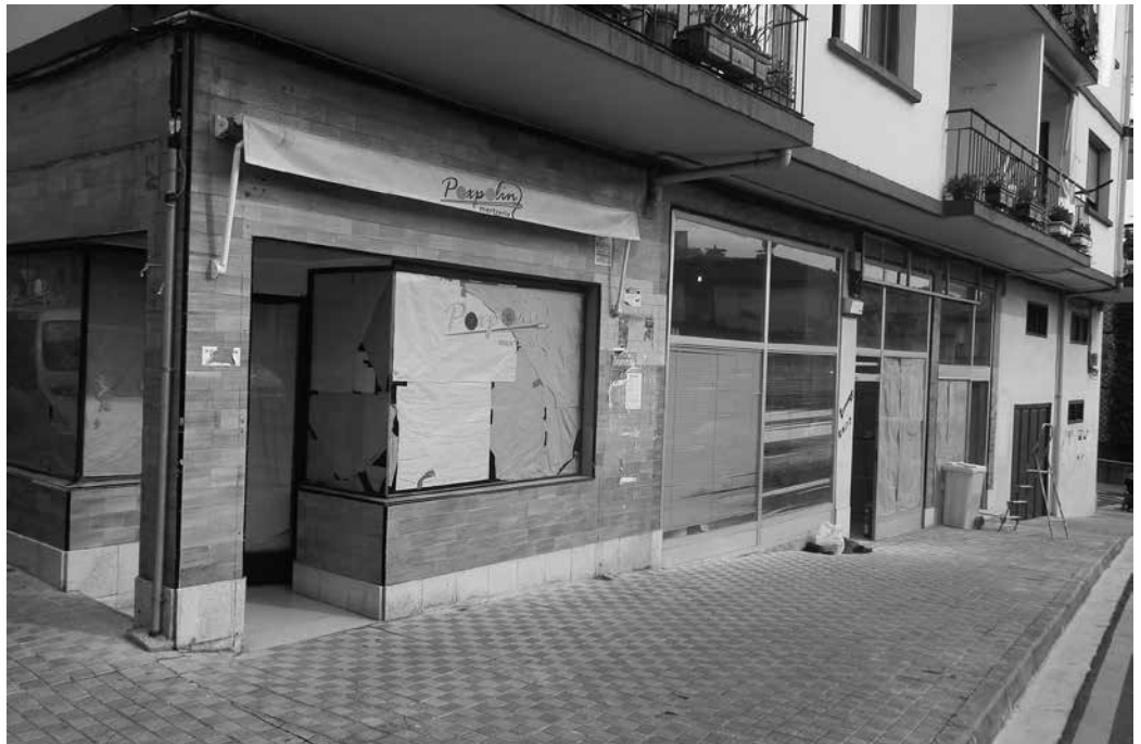
Hutsik diren saltokietako fatxadak txukuntzeko laguntzak eskura daitezke orain.

H erri gune gisa, "herri merkataritzaren dinamikan zuzenean eragiten duten zenbait hutsune baditu oraindik Usurbilgo herriak eta horietako bat hutsik dauden lokal komertzialek duten eragina da; hutsik, erdi abandonatuak dauden komertzioetako erakuslehoi eta inguruetako fatxadek, kaltea eragiten dute herri gunearen hiri estetikarentzat, eta bertan kokatua dagoen herri merkataritzarentzat ere". Horri aurre egin asmoz, merkataritza-jarduerarik gabe dauden lokaletako erakuslehoiak eta fatxadak atondu nahi dira. Eta horren onuradun egin nahi dutenek eskaera aurkezteko epea dute, azaroaren 20ra arte.