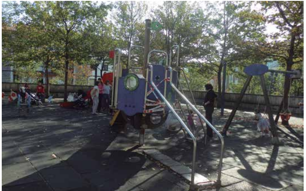
Irudian agertzen diren jolastoki gehienekin kezkatuta agertu dira hainbat guraso. Eta parkeko lurrarekin ere bai.

Baina txirristra ez da izorrotuta dagoen jolas bakarra. Kolunpioa eserleku bakarrekin egon da uda osoan.