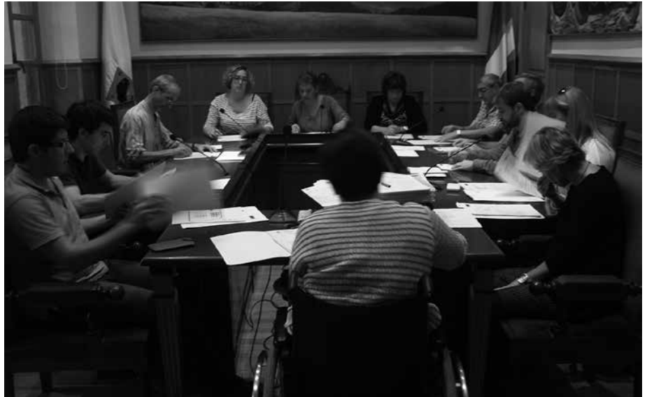
EH Bildu, EAJ-PNV eta Hamaikabaten aldeko bozka izan zuen mozioak.

■ Usurbilgo Udalak defendatzen du herriek eta pertsonak beren etorkizuna demokratikoki erabakitzeko askatasuna dutela, berriki Eskozian ikusi den moduan. Izan ere, Usurbilgo Udalaren ustez, etorkizuna ezin da inposizioekin eraiki, oinarri demokratikoen eta herriek eta