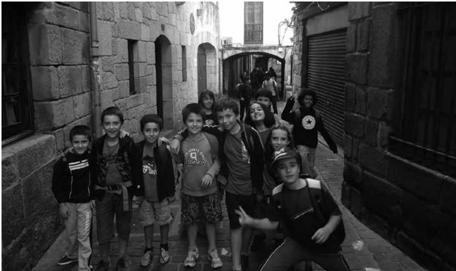
Udarregi ikastolako LH4ko ikasleak, Pasaian.

L augarren mailako ikasleok gure eskualdea ezagutzen aritu gara. Hori dela eta, Pasaia portuan izan gara hau bertatik hobeto ezagutzen. Egundua ederra pasatzeaz gain, portuari buruzko zenbait gauza interesgarri eza-gutu ahal izan ditugu eta, zuei ere interesatuko zaizuelakoan, hemen duzue han ikusi eta jasotako guztia: