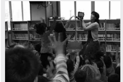
Ostegunean 0-4 urteko haurrentzako saioa eman-go du, eta ostiralean 4-6 urte arteko haurrentzat.

Oharra: ekitaldiotarako sarrera doan. Antolatzailea: Bihurri haur ludoteka.