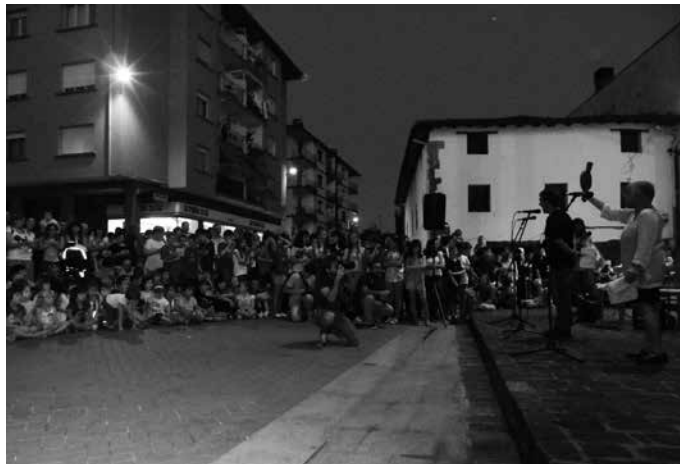
Lekukoa herrian da urritik. Azaroaren 29koak ospakizun kutsua izango du.

Beraz, KILOMETROAK 2015, hasi dugun proiektua lantzen jarraitzeko baliabideak lortzeko (ekonomikoak, giza-kapitala...) burutu nahi ditugu; izan ere, eskaintza hau bideragarria egingo duen azpiegitura