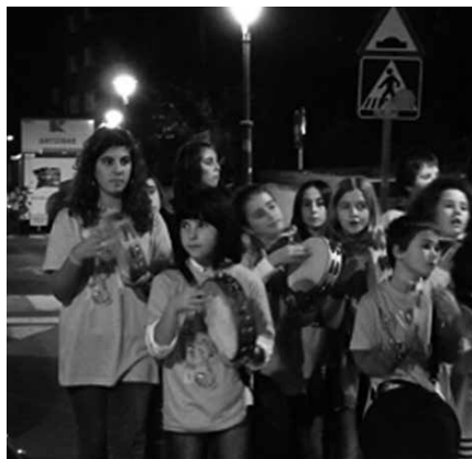
18:00etan kalejira egingo dute eta 19:00etan talde instrumentalen emanaldia Sutegin.

11:00-13:00 Garbiketa eta dragoi dantza. 13:00-14:00 Bazkaria (norberak etxetik ekarri konpartitzeko ideiarekin). 14:00 Altxorraren bila, Usurbilen zehar. 15:30 Tipia Egin. 16:30 Agurra.