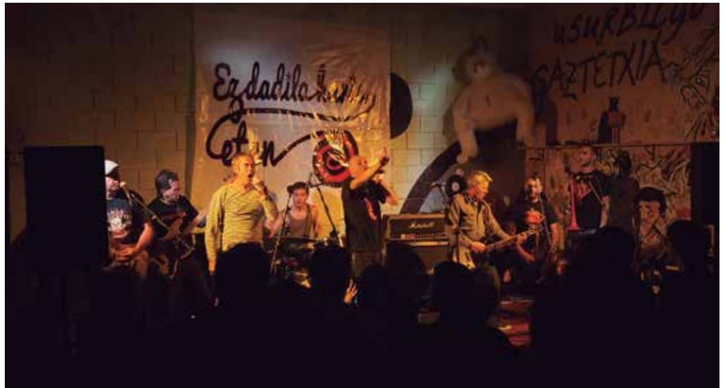
Aurreko astean Banda Bassotti taldekoak aritu ziren gaztetxean.