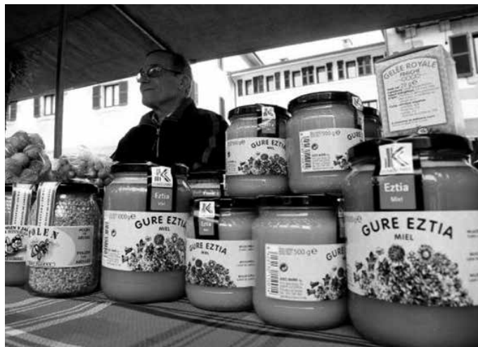
Eztigintzari loturiko erakusketa eta salmenta postuak 11:00etan irekiko dira.

13:30 Erleak beraiek ekarritako sari banaketa (aurten sorpresa