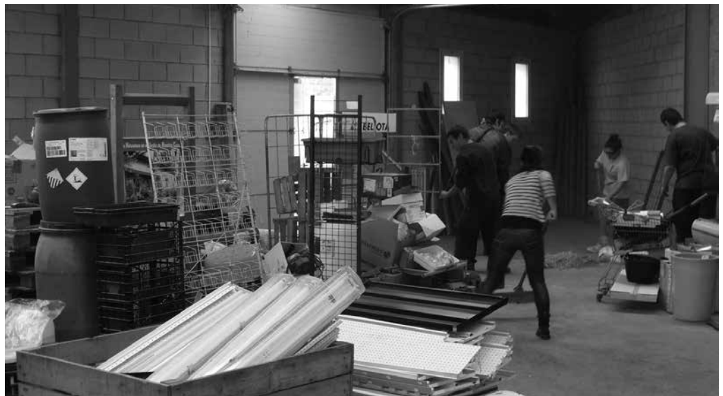
2012ko abuztuan okupatu zuten 'sindikatu', Alkartasuna kooperatibaren egoitza izandakoa.

Usurbilgo Gazte Asanblada: Duela bizpahiru aste alkatearekin bildu ginen, informazio zehatza jasotzeko. Bere esanetan, otsailean lur jabeak bertan makinaria sartu eta gaztetxea botatzen hasteko asmoa du. Otsailean beraz hortik joan behar dugula buruan dugu. Duela bi urte Gaztetxean sartu ginean, hiru hilabeteko epean etxebizitzak eraikiko zirela esan zituzten. Okupazioa burutu zenean Udalak bere aldetik, lur jabeen salaketaren aurrean, ertzainek NAN zenbaki bat eskatu eta alkateak berea eman zuela. Alde horretatik gure eskerrak alkateari, berak hartu baitzuen erantzukizun osoa. Garai hartan, ueña heldutakoan, inongo erresistentziarik gabe bertatik joango ginela zioen paper bat sinatu genuen. Epe hura bi urtez luzatu da azkenean. Udalari ia gunerik ba ote duten galdetu diogu, ez dutela esan digute. Guk proiektuarekin aurrera jarraitu nahi dugula esan diegu. Ez dute inolako oztoporik jartzen. Alde horretatik udalaren jarrera ona eta baikorra da, zoriontzekoa. Beste udal batekin, aspaldi ginen kanpoan eta lehen egunean ez zituzten erantzukin euren gain hartuko.