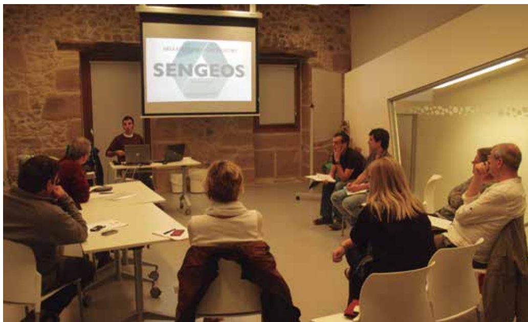
Gaur egun debekatuta dago baina urte luzez eraikinetako hormen barnealdean ipini izan zen amiantoak.

Udalerri honetako eraikin publiko zein pribatuetan eta ur horniduran amiantorik ba