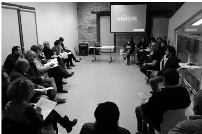
Azaroaren 12an lagun asko batu ziren parte-hartze prozesuko bileran.

Bizikidetzeta eta gazte lokalen inguruan abian den parte hartze prozesuak helduen arreta piztu du. Gazte lokaletako jabeak, lokalon inguruan bizi diren herritarrek, eta gurasoak zeuden deituak azaroaren 12an iluntzean Potxoenean burutu zen bilera. Deialdiak erantzun zabala izan zuen, ondoko irudian ikus daitekeen moduan. Usurbilgo Udalak Elhuyar Aholkularitzarekin elkarlanean, gazte lokale-tako erabiltzaileei eginiko galdeketeekin osaturiko diagnosis aurkeztu zuten. Hortik aurrera, bertaratu zirenen proposamen