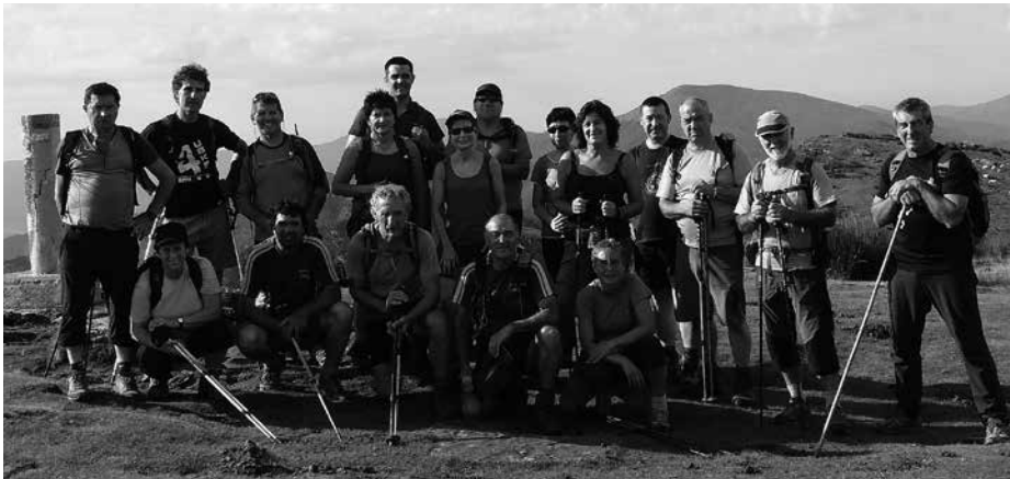
2014ko mendi irteeren inguruko ikus-entzunezkoa eskainiko dute azaroaren 28an ostirala, Sutegin. Arratsaldeko 19:30ean hasita.

Urtero moduan, Sutegin ospatuko diren ekitaldiak hasi aurretik, 2015eko federatu txartelak berri- tu eta ibilaldirako izena emateko aukera eskainiko du antolakuntzak, kultur etxean bertan. Mendi Asteako egitaraua zehatz mehatz, segidan: