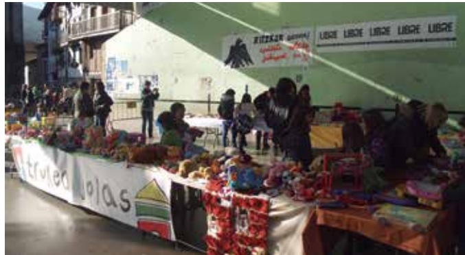
Materiala batuko dute abenduaren 11n eta 12an, eta jostailu azoka abenduaren 13an egingo da.

Jostailu erabilien azokak zor-zigarren edizioa beteko du aurten. Abenduaren 13an ospatuko da, eta aurreko edizioetan bezala, herritarren laguntza premian dira. "Zuen etxeetan erabiltzen edo behar ez dituzuen jostailu, ipuin, liburu, DVD eta antzekoak badituzue, orain duzue guzti hauei erabiltzen berri bat emateko aukera".