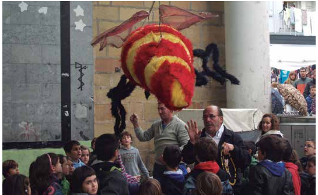
Sari banaketa ikusgarria izan ohi da. Eguerdiko 13:30ean hasiko da.

13:30 Erleak beraiek ekarritako sari banaketa (aurten sorpresa eta guzti):