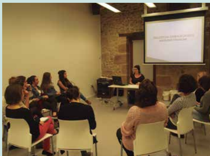
“Indarkeria sinbolikoa eta mikromatxismoak” hitzaldian egina dago argazkia.

Pasa den astearte honetan bezala. Hitzaldi, tailer eta film emanaldi batez osaturiko ekimen sorta burutu da azken egunotan, asteartean, azaroaren 25ean, gogoan izan genuen Emakumeenganako Indarkeriaren Kontrako Egunaren harira. Egun horretan bertan egitekoa zen hain zuzen elkarretaratzea,