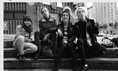
Octopussys taldekoak arituko dira jaialdian.

18:00 Kontzertuak. Venganza (Zaragoza), Piñen (Bartzelona), Total Arse (Zarautz), Ernia (Zarautz), Infekzioa (Bartzelona-Usurbil), Hondartzako Hondakinak (Iparralde), Endemaño (Bizkaia), Octopussys (Bizkaia), Segurrata (Zaragoza). Sarrera, 5 euro.