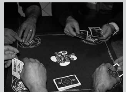
Bikote bakoitzak egunean bertan eman beharko du izena, 4 euroren truke.