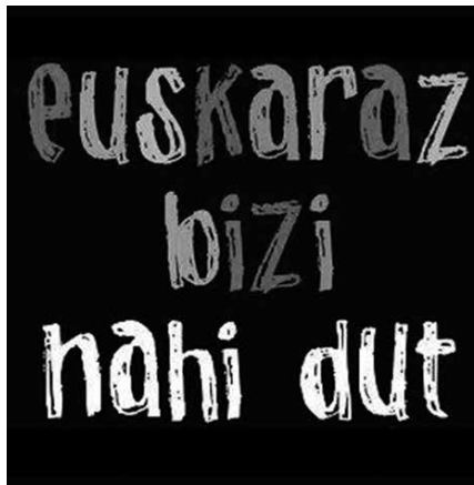
Abenduaren 3an ospatuko da Euskararen Eguna. (Irudia: NOAUA!)

udalak ere euskararen aldeko hautua egin du. Lan handia egin dugu udala euskalduntzeko, eta UEMAko udalekin batera, erreferentziazko udala bilakatu gara euskararen erabilerari dagokionean.