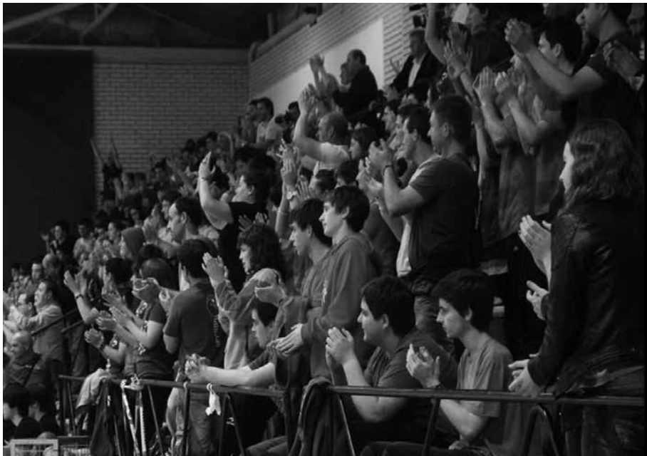
Udarregi nahiz Usurbil KE taldekoen partidak jokatu dira kiroldegian.

A di, kilometroak 15 ekimenaren aurkezpen ikuskizuna dela eta, asteburuan Kiroldegian jokatzekoak ziren eskubaloi taldeen neurketa batzuk, beste udalerritako instalakuntza hauetara lekuz aldatuko dira eta: