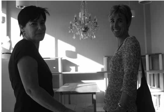
Igande honetan zabalduko dituzte Kilometroak dendako ateak.