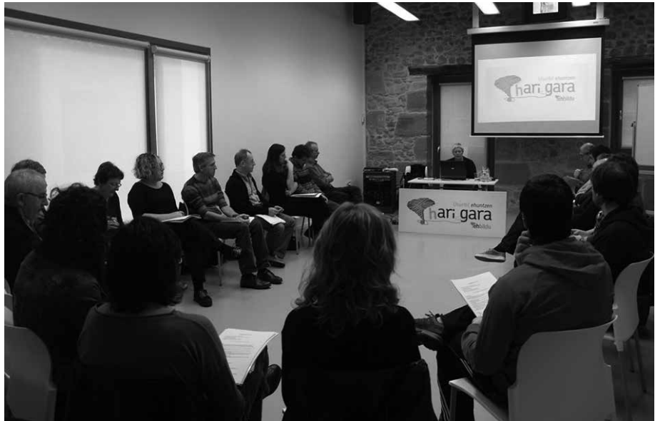
"Hari gara" ekimenaren bitartez, legealdiaren balantzea egiteari ekin dio EHBilduk.

"Ondo egin duguna izango da hurrengo legealdiko abiapuntua. Baita erdizka egindakoak zuzendu eta gaizki edo egin gabe utzi duguna zuzentzeko konpromiso sendoak harilkatu behar ditugu. 2015-2019 legealdian egin nahi duguna zehaztu aurretik amaitugabe dagoen legegintzaldi honetan egindakoaren balantzea aztertzea garrantzitsua deritzogu", zioen Usurbilgo EHBilduk azaroaren 22rako antolatua zuen batzarrean deialdian.