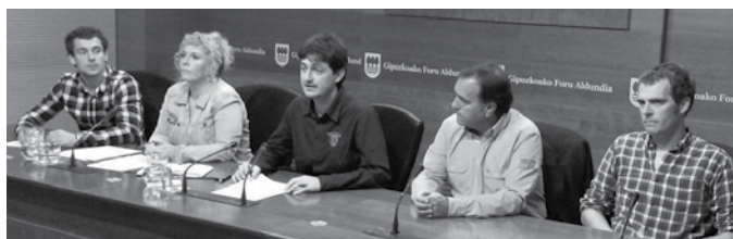
Gipuzkoako Hondakinen Kontsortzioaren esanetan, "birziklapenaren aurkako erabaki argi eta garbia da" Eusko Jaurlaritzak hartu berri duena.

Proiektua prest zegoen, esleipen publikora atera zain. Ingurumen baimena falta zuen eta ez diote eman. Eusko Jaurlaritzak baimena berri tramitatzea eskatu dio Gipuzkoako Foru Aldundiari, eta honenbestez, Zubietan eraikitze-koak diren hondakinen tratamendu planta martxan jartzeko lanak atzeratu egingo dira. Aldunditik esan dutenez halere, "Jaurlaritzak ez gaitu mugiaraziko birziklapenaren aldeko gure konpromisotik". Konpromiso honengatik, gipuzkoarrak zigortu nahi dituztela adierazi zuten, ingurumen baimena berri tramitatu beharko zutela jakin eta gutxira, Aldundiak eta