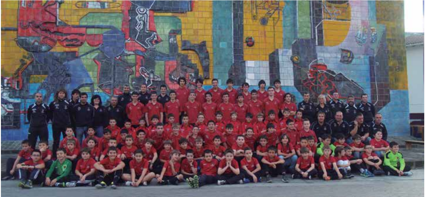
Usurbil FT taldekoak "galaz" jantzi ziren aurreko larunbatean. Irudian, klubeko partaide batzuk ageri dira, "familia argazkian".

Aurreko asteburuan jokoan zuten jardunaldian tarte bat hartu zuten Usurbil FT.-ko jokalari, entrenatzaile eta zuzendaritzako kideek, 2014-15 denboraldiko argazki ofiziala ateratzeko. Mikel Laboa plazan ospatu zen ekitaldiaren bidez, futbol klubak kirol urte honetarako osatu dituen taldeak ezagutarazi zituen.