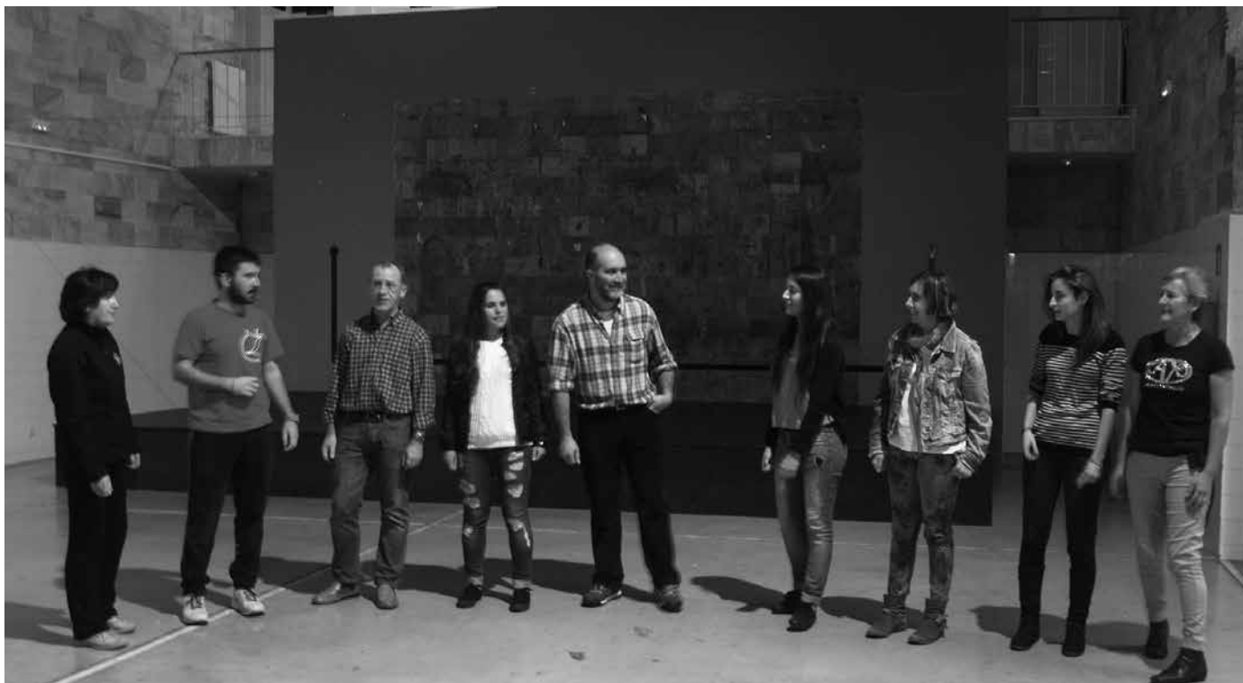
Ikuskizunean parte hartuko dute argazkian ageri direnek. Astelehenean, Udarregiko patioan harrapatu genituen entsetzen.

KILOMETROAK-EN ALDEKO JAIALDIA KIROLDEGIAN IZANGO DA, ARRATSALDEKO 19:00ETAN