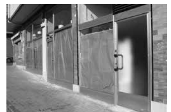
Zubiaurrenea 3 kalean dago denda.

Koadrilan giro ona sortzeko eta baita jende berria ezagutzeko ere. Halako ekintzekin jende berria ezagutzeko aukera dago eta lagun arte polita sortzen da gero.