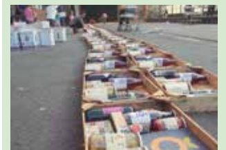
79 otar eskatu dira Usurbildik.

Aurten 79 izan dira kanpai- narekin bat egin dutenak gure herrian. Astelehenetik NOAUA!ko bulegoan dira otarrak. Izena eman ba- zenuen aurretik, bila pasa zaitezke. 50 euro, saski bakoitzeko. Ekimen honen bitartez, Nafarroa erriberako ikastolak, Erriberako AEK eta “Euskaraz bizi eta ikasi” herri ekimenaren Hamarraz proiektua finantzatuko dira.