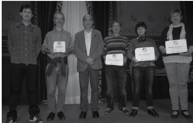
Errekaxikiko famili batzuk auzokonpostatze egiten aitzindari izan dira.

Herritar guztion eredugarritasuna saritu nahi izan du aurten, Gipuzkoako Foru Aldundiak, "ingurumenarekiko arduraz jokatzeko eta baliabideak aurrezteko ahaleztuz" eta. Aurtengo Zero Zabor saria, Gipuzkoa mailan auzokonpostatze egitasmoan parte hartzen hasi ziren lehen herritarrentzako izango da; Zero Zabor ingurua iza-