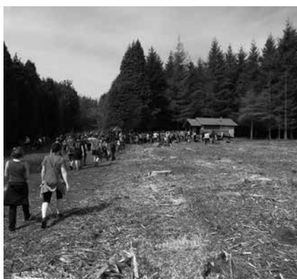
Aldundiarekin negoziatzeko eta adosteko hitzarmenaz hitz egingo dute.

2014. urtean Andatza Mendi Elkarrekin antolatutako irteeren ikus-entzunezkoa.