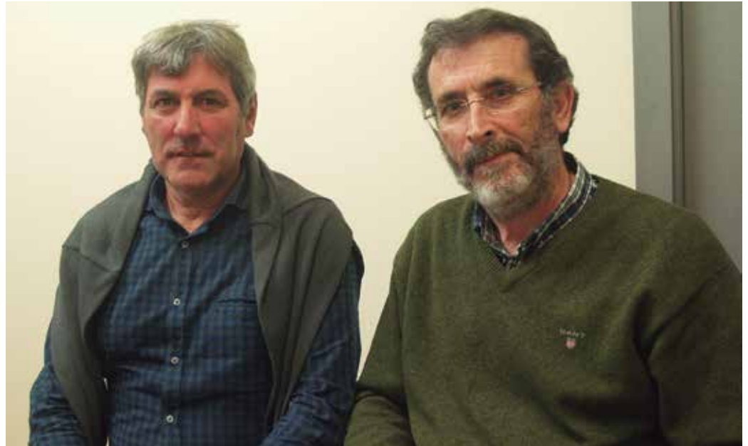
Sagardo Egunaren Lagunak elkartekoen babesarekin jarri dute ekimena martxan Goldean elkarteko kideek.

E rronka berri bat du Usurbilek. Kizkia eskutan duten 440 lagun biltzea, argazki erraldoi bat ateratzeko. Gerturatu igande eguerdian 12:30ean Sutegi atarira, eta bertan emango zaizkizue behar beste argibide. 2009az geroztik eskualdean herriz herri ospatzen ari den ekimen parte hartzaile honen bidez, sagardo ekoizteko prozesua eman nahi da ezagutzera. Herritarrek prozesu honetako partaide sentiaraztea. Egitasmo hau sortu eta koordinatzen dabil-tzan Goldean Elkarteko kideekin bildu gara, zehaztasun gehiagoren berri jasotzeko.