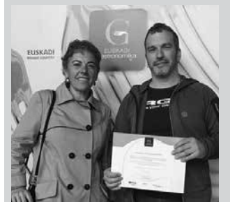
Aginaga sagardotegia zein hotela izan ziren sarituak.

"Programa honen helburu nagusia, Euskadi zein potentzial enogastronomikoa duten eskualdeak, nazioarteko erreferentzia bilakatzea da. Donostialdearen kasuan, eskualdean turismo enogastronomikoa lantzea eta bertako gastronomia aberatsa sustatzea dira helburuak, bertako produktuan oinarritua, elkarlan publiko-privatuaren bitartez", egitasmo honen sustatzaileen esanetan.