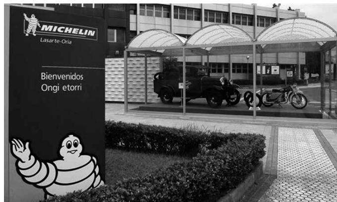
Aurreko astean egin ziren hauteskudean Michelinen.

LAB sindikatuak aditzera eman duenez, emaitza hauei esker bi hauteskunde barrutietan "nabarmendu nahi dugu bereziki tailerrean jaso dugun babesa, bigarren indarra (CCOO) 100 bozkako aldea atera baitiogu bozen %43,5 lortuz. Era berean, bi hauteskunde barrutietan (bulegoetan eta tailerrean) lortu dugu or-