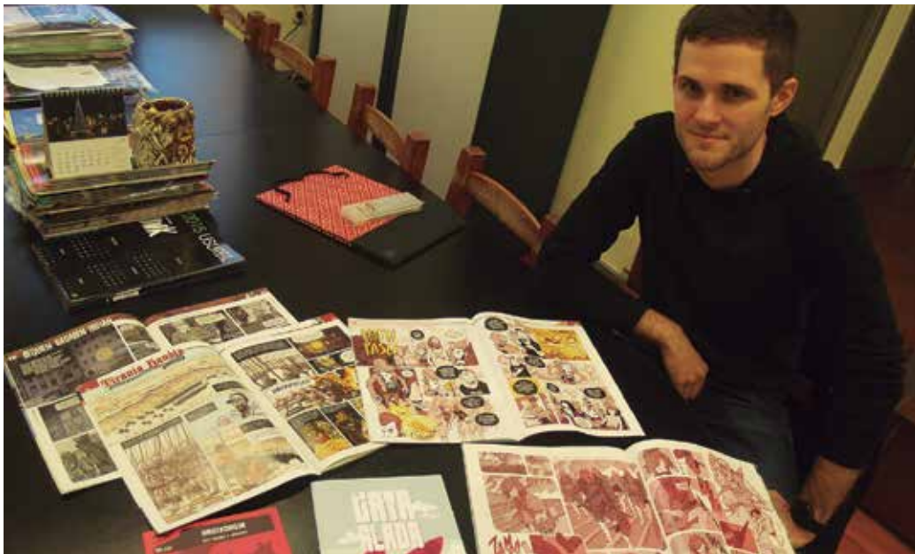
Bere lana hobeto ezagutzeko: josebalarratxe.tumblr.com/

Zure sormen lanak eskutan, ze ezaugarri komun dituzte?