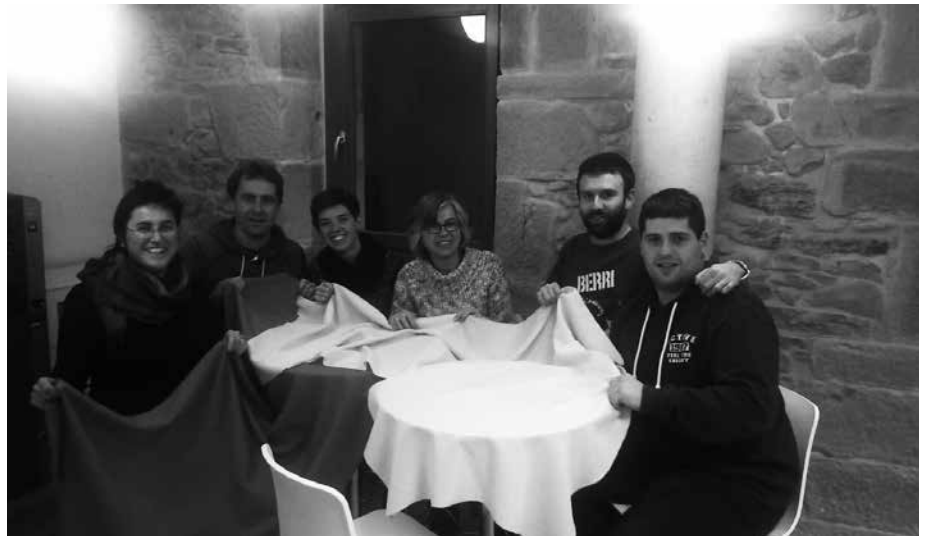
"Jostunak" dokumentala eskainiko dute ostiral honetan Sutegin, 19:00etan. Aitzakia horrekin, Usurbilgo Gure Esku Dago lantaldekoekin izan gara solasean, dokumentalaz eta 2015erako erronkez.

Bukatzeko adierazi nahi genuke, Gure Esku