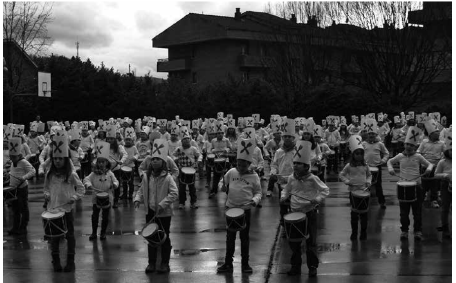
Astelehenean, arratsalde partean arituko dira danborra jotzen HH zein LHko ikasleak.

■ 16:10 Lehen Hezkuntzako ikasleen danborrada, Agerialdeko patioan.