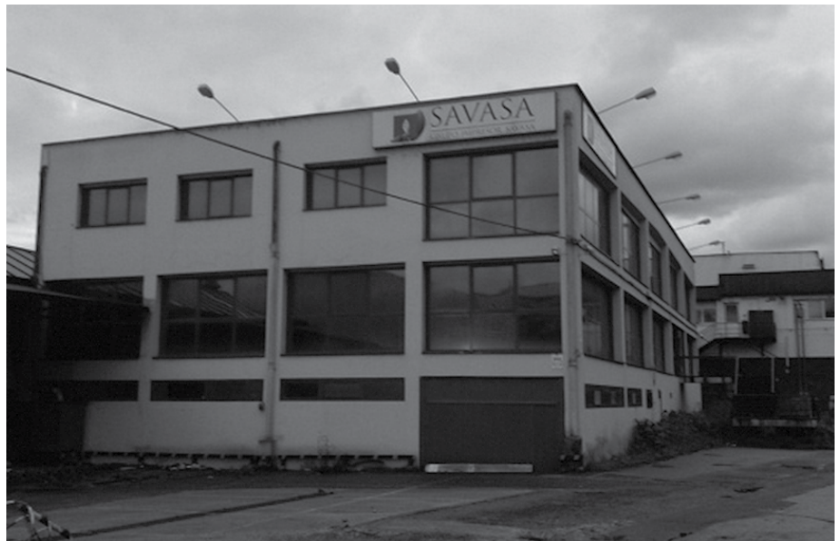
Etiketate sektorean, aitzindari izatera iritsi zen Savasa. Datorren urtean 50 urte beteko lituzke.

Hiru lantegien funtzioa honela deskribatzen da web orrian: