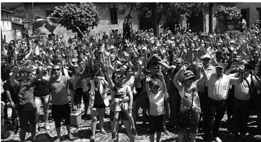
Arratsaldeko 19:00etan hasiko da dokumentalaren proiektzioa.

azko ekainaren 8an giza kate erraldoi batek lotu zituen Durango eta Iruñea, eta giza kate horren atzean ziren pertsonen hitzak batu dituzte 'Jostunak' dokumentalean. Abenduaren erdialdean aurkeztu zuten ikusentzunezkoa eta orain herriz herri hasi dira proiektatzen. Ostiral honetan, Sutegin ikus ahal izango dugu, 19:00etan hasita.