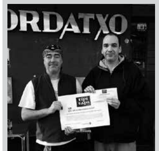
Urtarrilaren 4ko zozketa Bordatxon egin zen.

Zorioneko herritar gehiago. Hurbilago Elkarteak antolatutako urtarrileko pintxo festak ere beste bi saritu utzi dizkigu. Hilaren 4ko Tipi-Tapa amaieran, Bordatxo tabernan ospaturiko zozketako zenbaki sarituak, honako hauek dituzue: -150 euroko erosketa balea, 1.531 txartel zenbakiaren jabeak egokitu zaio (argazkian). -2 laguntzako afaria, 5.052 txartel zenbakiaren jabeak. 2015eko hurrengo Tipi-Tapa, otsailaren lehenean.