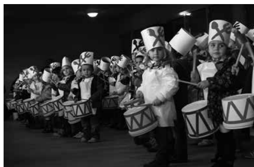
Goiko argazkian, Zubietako ikasleak. Azpian, Udarregikoak. Azken hauek Agerialden aritu ziren.