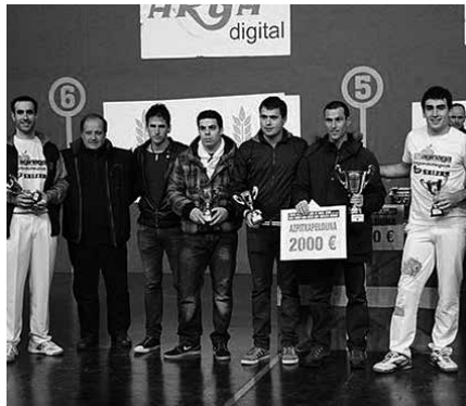
Euskal Herriko Klub Arteko Txapelketaren finalan, hiru partidetan gailendu zen Galdakao.

Usurbildarrak txapeldunorde ditugu, estreinakoz Amezketan ospatu den Euskal Herriko Klub Arteko Pilota Txapelketan. Igandean Galdakaoko Adiskide taldekoen aurka jokatu zuten finala, 3-0 galdu zuten usurbildarrekin. Hiru modalitateetan jokatu behar zuten; banaka lau t'erdian, banaka frontoi osoan eta binaka. Aipatu moduan, txapeldun izateko faboritoak ziren arren, galdakaoztarrak nagusi, Larrunarri frontoian. Usurbildarrak bigarren, txapelketa bikain baten ostean.