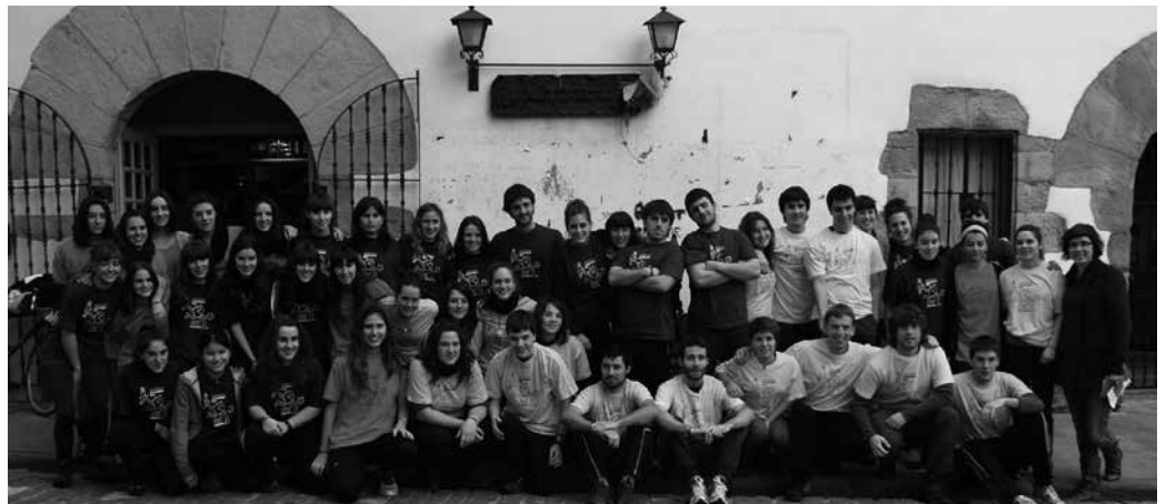
Martxoaren 22an pasako da Korrika Usurbildik. Argazkia artxibokoa da, duela bi urteko Korrika Ginkanan egina.

Gogoan izan, abenduaz geroztik salgai dagoela euskaltegian baita, martxoaren