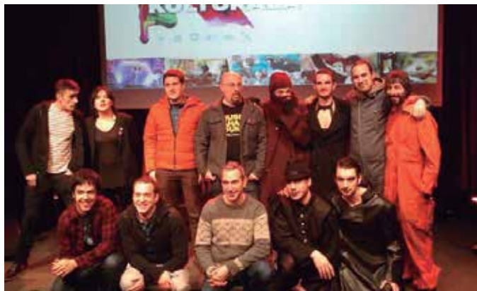
Duela bi aste aurkeztu zen Korrika Kulturala.

Korrikaren app berri horren zain, hainbat ikuskizun programatu dituzte Euskal Herrian; “Fausto” antzezlan, “Gosariak”, “Hor dago ardoa!”, Pirritx, Porrotx eta Marimototsen ikuskizun berriena, Bertso Korrika eta Bertsozalearen sekretuak. Hiru