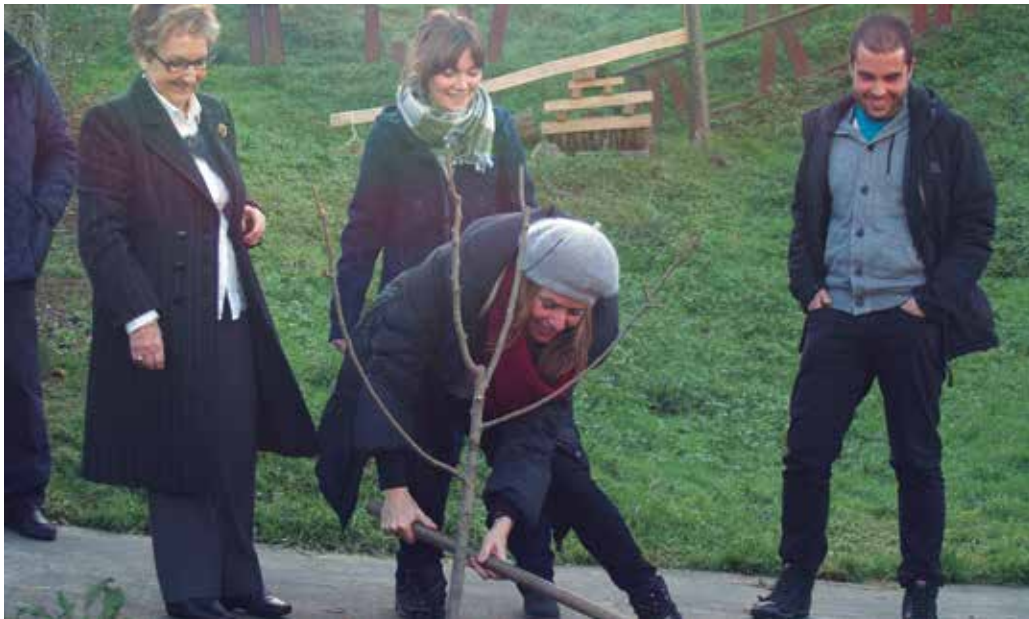
Astigarragan eman zitzaion hasiera "ofiziala" sagardotegi garaia. "Loreak" filmeko aktoreena izan zen ohorea.

USURBILEKIN ELKARLANA SUSTATU NAHI DU ASTIGARRAGAK