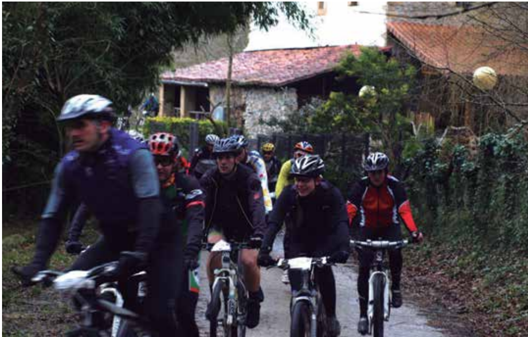
Adin guztietako txirrindulariak atera izan dira aurreko edizioetan.

Zuek bezala bizikletak ere sufrituko du proba hauetan. Nola prestatzen duzue bizikleta?