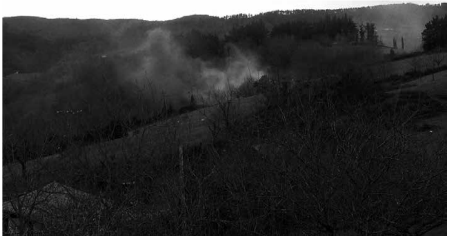
Urtarrilaren 15ean, goizeko 10:30ak aldera piztu zen sua Aginaga aldean.

■ Sute bat ikusten baduzu 112 telefono-zenbakira deitu lehenbailehen. Deitzean adierazi zein den biderik egokiena hara iristeko, betiere kontuan