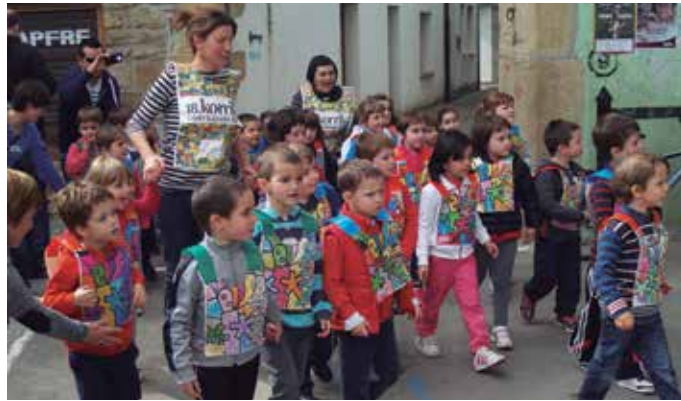
Korrika Txiki ere antolatuko da martxoan partean.

M artxoaren 22an, igandez igaroko da 19. Korrika Zubieta, Usurbil eta Aginagatik. “Lekukoa Hipodromo zubian (Lasarte-Orian) hartuko dugu eta herriko hainbat kale eta auzo zeharkatu ondoren, oriotarrei pasako diegu Mapilen”, Etumeta AEK euskaltegitik esan digutenez. Korrika ahalik eta parte hartzaileena sustatu nahi dute. Horregatik, beste herrietan bezala, Usurbilen ere Korrika Batzordea osatzera animatzen gaituzte. Lehen bilera, ostiral honetarako, urtarrilaren 23rako deitu dute, arratsaldeko 18:00etan, Etumeta AEK euskaltegiaren egoitzan (Kale Nagusia 43, behea. Zumarte ondoan).