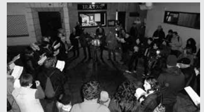
Urtarrilaren 31n larunbata, arratsaldeko 19:00etan hasiko da kantu-jira.

Donostia egunez egokitu da aste honetako entsegua. Jai, beraz. Datorren astetik aurrera ohiko martxari helduko diote berriz. Hurrengo hitzordua, urtarrilaren 27an, 18:30-19:30 artean Udarregi Ikastolako kantu gelan. Ikastaroan izen emateko ere aipatu ordu eta lekura joan besterik ez dago. Prezioa; 10 euro.