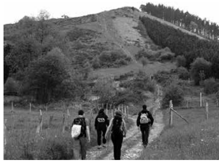
17 kilometroko ibilbidea osatuko dute.

rol Taldeko irteeretan parte hartzeko ezinbestekoa izango da aseguraturia egotea. Federatu txartelik gabe zaudetenok, adi ohar hauei. Tramitazio orria andatzamendizale.info web orrialdean eskura dezakezue, "Federatzeko 2015" atalean. Datu pertsonalak bete eta ordainketa egin, orrian bertan agertzen den kontu zenbakian. Izen emate orria modu honetan helarazi dezakezue Andatzakoengana: