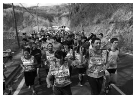
Iaz Aginagatik iritsi zen. Aurten, Zubieta-Usurbil-Aginaga norabidean egin beharko da lasterka.

Santueneko zubitik Atallu industriagunera. Bizkarretik Kalezarretera. Kalezarretik, Bordatxo aurreko errotondara. Eta handik behera, Zubiaurrenea kaletik Kale Nagusira. Kale Nagusitik San Inazioko