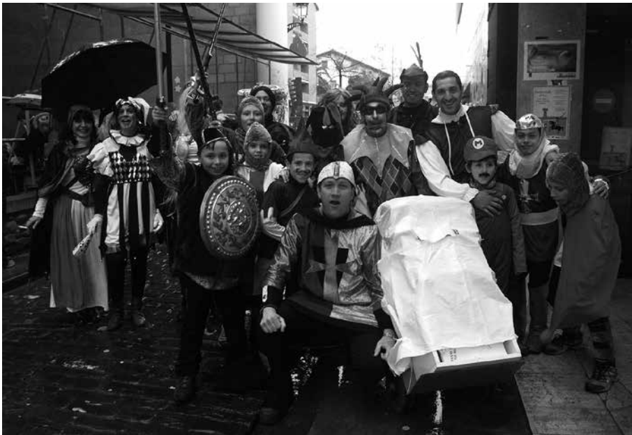
Afarirako txartelak otsailaren 11ra arte egongo dira salgai. Beraz, alde z aurretik erostea komeni.

Ipuinzaleen mozorro festarako afaritarako txartelak asteburu honetatik aurrera salgai, otsailaren 11ra arte, NOAUA!ko egoitzan, Irratin eta Bordatxon. Prezioa; 14 euro. Menua: