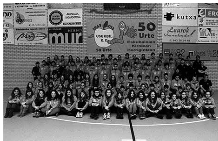
Jubenil neskek, jubenil mutilak eta kadete neskek txapelkun, eta kadete mutilak txapelkunorde.

Gipuzkoako Txapelketako lehen bi postuetan sailkatuta, lau taldeok Euskal Ligarako igoera jokatu dute asteburu honetan, urtarrilaren 30etik otsailaren 1era. “Euskal Ligarako igoera sektoreak jokatuko dituzte. Talde bakoitzak beste hiruna aurkari izango ditu. Sektore bakoitzeko lehen biak, Euskal Ligara igoko dira eta Espainiako Txapelketa jokatzeke aukera