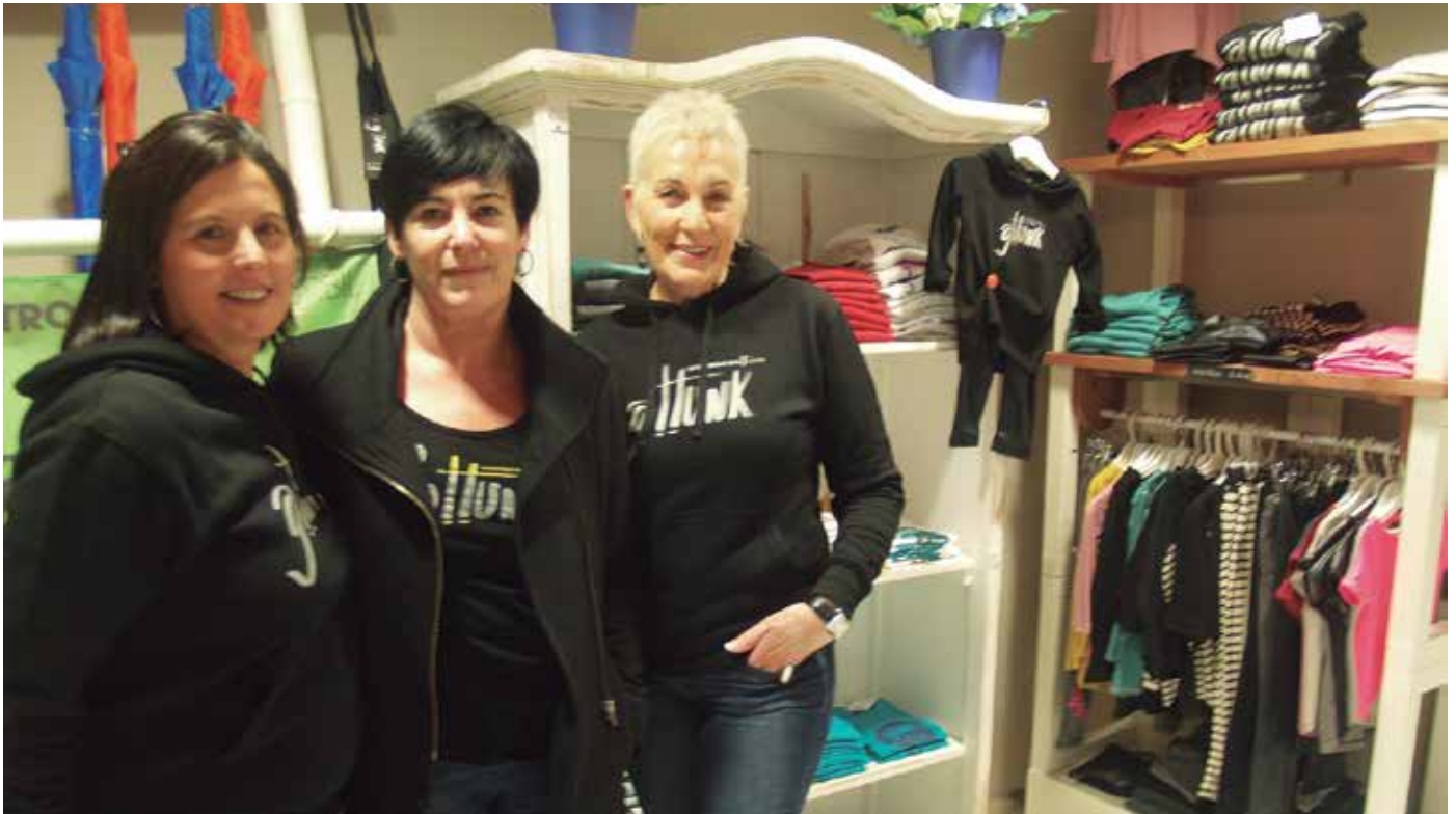
“Herriko jendea bakarrik ez, badira kanpotik propio dendara arropa erostera etorritakoak: Mutrikutik, Zumaiaitik, Hernanitik, Tolosatik...”

D endako atea ireki eta ixten izan dute etenik gabe. Eginak zituzten aurreikuspen onenak ere gaituta borobildu zuten eguberrietako kanpaina. Herri-kanpotik nahiz kanpotik, espresuki dendara etorritako lehen bezero “uholdea” igarota, orain lasaia dabilta. Baina atsedean hartzeko tarterik gabe lanean, datorren denboraldirako prestatzen. Hurrengo urtarorako eskaintza antolatzen. NOAUA!-ri aurreratu diotenez, udaberri koloretsua omen datorkigu martxotik aurrera. Kolore bizi eta alaietz bete. Hala dio, Kilometroak 15 ekimenaren aldeko Gattunk denda kudeatzen ari den lan taldeak. Jada, arropa kontuetan aditu ditugun herri-tarrek.