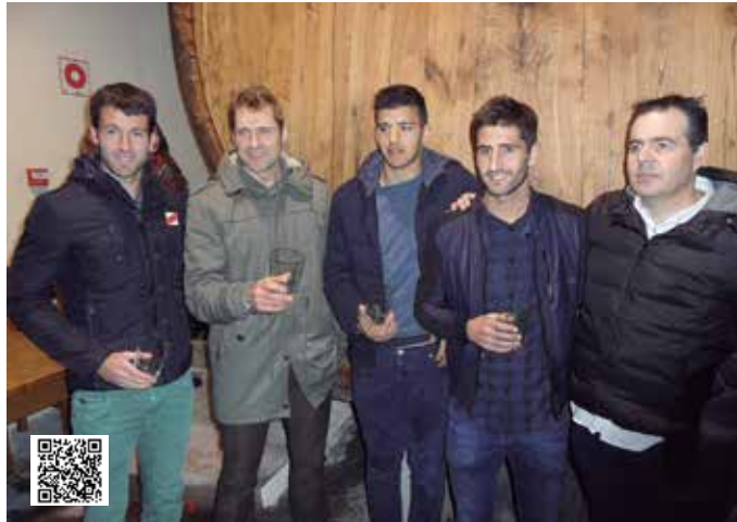
Imanol Agirretxe, Julian Iantzi, Geronimo Rulli, Markel Bergara eta Napo Lertxundi, aurreko osteguneko irekiera ekitaldian.

hurbildu zen Saizar sagardotegiko ekitaldira; David de Jorge sukaldaria edota Inaxio Perurena harri-jasotzailea, esaterako. Eta herriko ordezkari zabala ere bai, noaua.com web orrian ipini genuen bideoan ikusiko