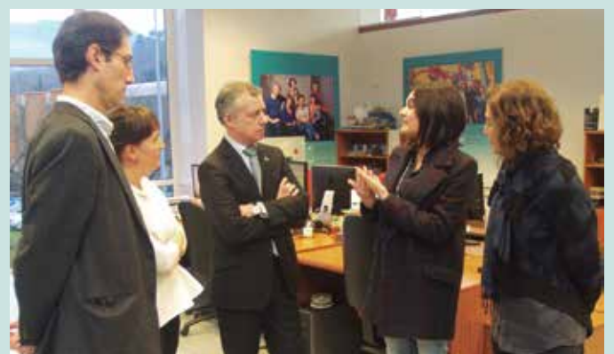
Iñigo Urkullu, Elhuyar Fundazioako kideen azalpenak adi entzuten.

du xedea, egokitu egin ditu, negozio-unitateak, eta irudi korporatiboa, berriz, aldatu”. Unitateotan dihardute lanean; Zientzia, Hizkuntza eta Teknologia, Aholkularitza eta Komunikazioan. Dauden arloetan sendotu eta “indarrez datozen arlo berriak irabazi” nahi dituzte, “euskal gizartearen erreferentziatzeko gune bihurtu, eta Euskal Herritik kanpo dugun kokapena hobetu”.