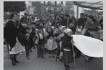
HH, LH eta DBHko ikasleak kantari aterako dira.

Otsailaren 4an berriz ere usadio zaharrak berriztera irtengo dira Udarregi Ikastolako ikasle eta irakasleak. Santa Ageda bezperan, baserriar jantziekin eta makilak eskutan abesten ikusiko ditugu herri erdigunean berrera, HH, LH eta DBHkoak. Bakoitzak bere ibilbidea osatuko du, 14:45-16:30 artean. HH eta LHkoek, arratsaldeko 16:00ak aldera frontoian amaituko dute kalejira.