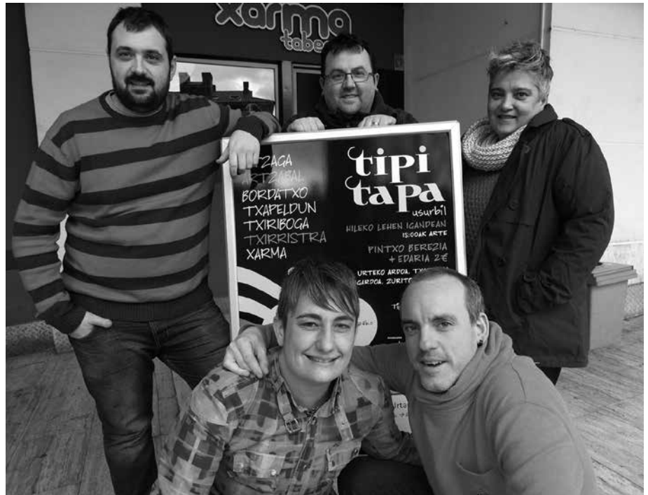
Igandeko honetako zozketak Txapeldun tabernan egingo dira, 15:00etan. Hori bai, aurretik, Aitzaga, Artzabal, Bordatxo, Txapeldun, Txiriboga, Txirristra eta Xarma tabernetako zigiluak batu beharko dira.

Otsailaren leko pintxo festa, azkena izango da Xarmakoentzat. Borda Berri kalean kokatua dagoen tabernak atek