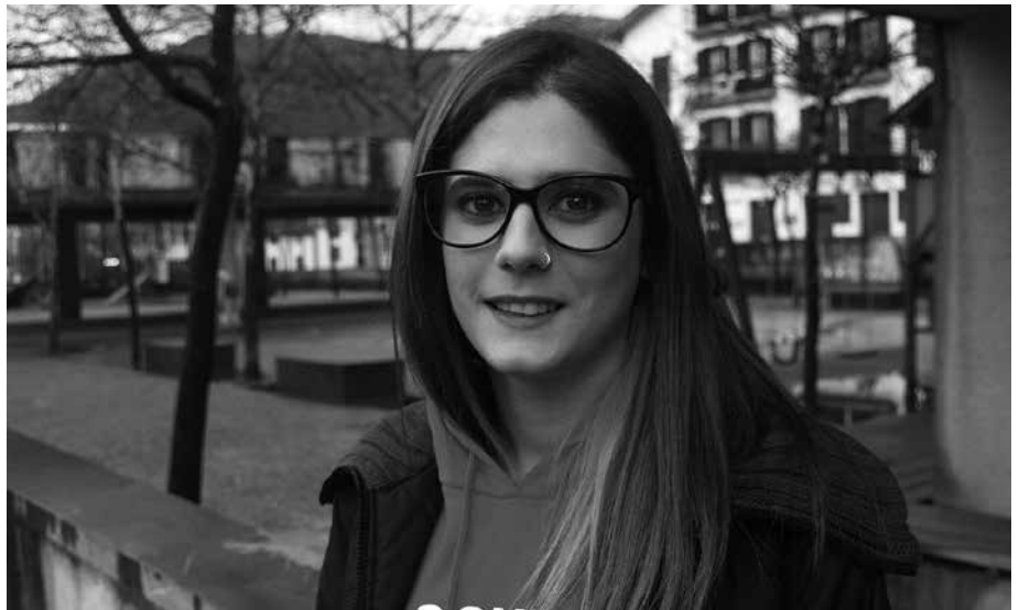
"Saioan zehar, denetarik sortzen da. Azken finean, errealitatea bezalakoa da".

Hasieran kosta egiten zitzaidan. Neure gauzetaz hitz egitea asko kostatzen zait. Lehen asteburuan, urduritasunagatik ez nuen jan ere