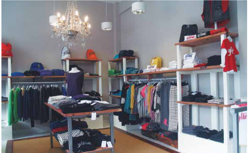
“Guztira hamasei lagun gara eta bi arduradun. Bi pertsonako zortzi talde osatu ditugu”.

Guztira 16 lagun gara eta 2 arduradun. 2 pertsonako 8 talde osatu ditugu. 4 talde goizez aritzen dira lanean, eta beste 4 arratsaldez. Talde bakoitzak hilean astebetean lan egin behar du goizez edo arratsaldez. Hori teorian. Abendua salbuespena izan da, taldeak indartu behar izan genituen eta ordu gehiago