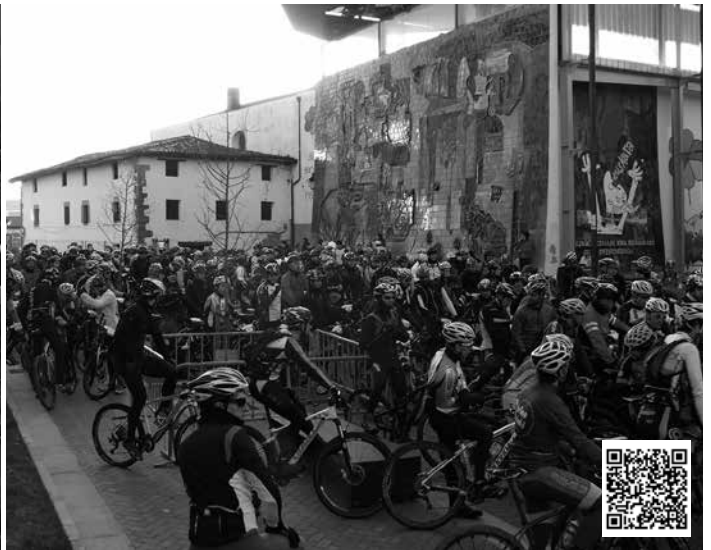
Irteerako bideo bat topatuko duzue noaia.com web orrian. QR kodearen bidez, eskuko mobilean ere ikus dezakezue bideoa.

Ehunetik gora lagun zeuden izena emanda aurrez kirolprobak.com atarian. Parte hartzaile kopurua ordea, bikoiztu eta gehiago egin zen proba egunean. Arrakatsua, urtarrilaren 25ean Irisasi BTT