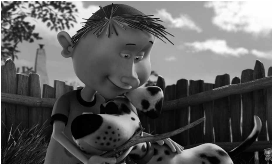
"Freddy Igeldegi" izeneko pelikula eskainiko dute, arratsaldeko 17:00etan hasita.

G aztetxoentzat, ez da erraza helduekin bizitzea. Film honetako 10 urteko Victor eta bere lagunentzat, adibidez. "Euren mundua heldu serioz josita dago eta gainera Freddy Igeldegi herriko harroputzari aurre egin behar diote. Egun batean zirkua herrira iristen da eta zuzendariak Kanoi Erregeak bere azken