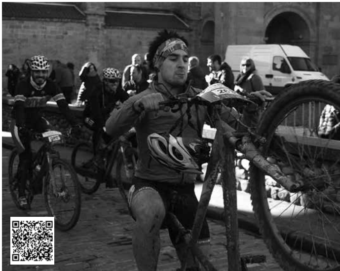
Giro ederrean burutu zen Irisasi BTT lasterketa. Argazki ugari atera genituen eta NOAUAko argazkitegian aurkituko dituzue (baita QR kodearen bidez ere).