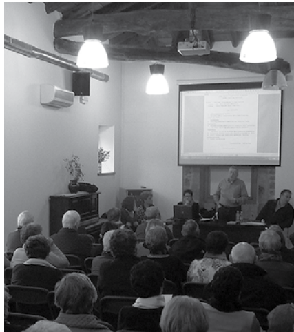
Batzar Nagusia Artzabalen egingo da arratsaldeko 16:30ean.

Urteko batzarra egin ostean, bazkideen arteko txapelketetan lehiatzeko aukera izango dute Gure Pakea Elkarteko bazkideek. Ekimenotan parte hartu nahi dutenek, otsailaren 6ra arteko epea dute izen emateko.