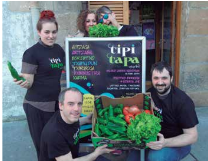
Igande honetan Aitzagan, Artzabal, Bordatxon, Txapeldunen, Txiribogan eta Txirristran. Zozketa 15:00etan egingo da Txiribogan.

Ez ahaztu pintxoak dastatzen joan ahala, Tipi-Tapa txar-teleko zigiluak biltzeaz. Zigilu guztiak lortzean, sartu txartela,