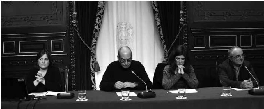
Foru Funttsaren likidazioa positiboa izan da. Horri esker, Usurbilek 34.561,82 euro jasoko ditu.

2 014ko Foru Funttsaren likidazioa positiboa izan da, azken zazpi urteotan lehen aldiz, Finantza Kontseiluak ezagutzera eman dako datuen arabera. Ondorioz, Gipuzkoako Foru Aldundiak guztira, 4,1 milioi euro itzuliko dizkie herrialdeko udalei. Kopuru horretatik, 34.561,82 euro Usurbilgoari.