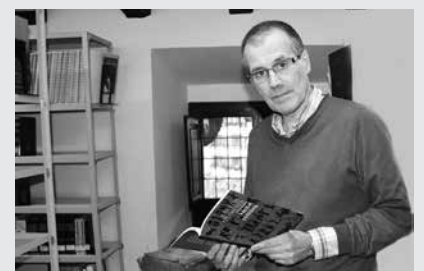
Kapital publikoa (Susa) liburuarekin errezitaldi ugari eskaini ditu Azpeitiko poetak. Datorren astean, martxoak 5 osteguna, errezitaldia eskainiko du Potxoenean. 19:30ean hasiko da.