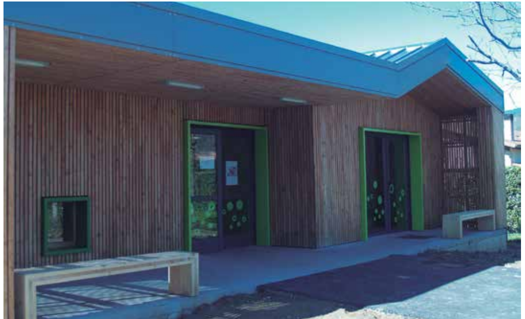
“Kanpotik azalera txikia zuela iruditzen zitzaigun. Barruan egonda, eskolak askorako ematen du”.

A kabo lanak. Eta lanak amaituta, ikasle, irakasle eta gurasoen aspaldiko eskaria gauzatu da; Zubietako Eskola Txikiak, eraikin berria du. Haurrak baldintza onenetan ez ziren aurrefabrikaturiko eraikinak utzi, eta jada, handitu diren instalakuntza berrietan daude. Oso pozik, eskolatik NOAUA!ri adierazi diotenez. “Oso polita geratu da. Oso atsegina da, beroa, epela da, sentsazioa oso ona da. Espero genuena baino handiagoa. Kanpotik azalera txikia zuela iruditzen zitzaigun. Barruan egonda, eskolak askorako ematen duela ikusten da”.