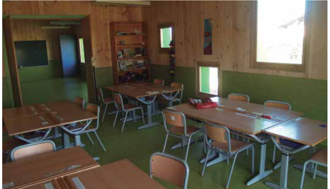
Eguerdiko 12:00etan hasiko da inaugurazio ekitaldia.

Eraikin berria zabalik dago, baina larunbat honetan, otsailaren 28an irekiera ekitaldi ofiziala egingo dute. eguerdiko 12:00etan. Eusko Jaurlaritzako eta Donostia zein Usurbilgo udal ordezkariak espero dira hitzorduan. Eta gerturatu nahi duen oro. "Gonbidatuak zau-