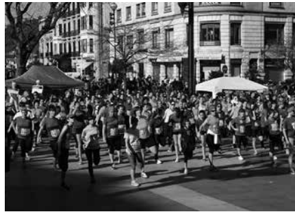
Bulebarrean, #Kilometroak15 egunaren aldeko salmenta postua ipiniko dute igande honetan.

Asteotan, martxoaren 1eko lasterketan parte hartzeko auzo eta adin tarte ezberdinetako 40 bat emakumek eman dute izena. Apuntatu