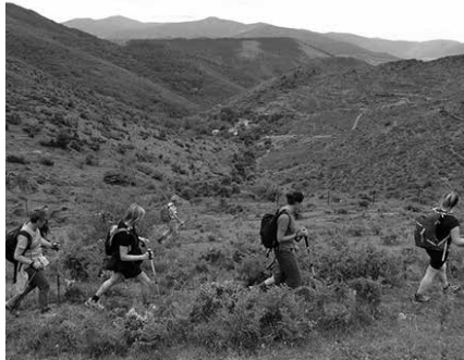
Goizeko 7:30ean irtengo dira kiroldegitik. Autobusez joango dira Gorritiraino. Izen-ematea, 10 euro. Hori bai, alde zurretik egin behar da.

irteeretan parte hartzeko derrigorrezkoa da, mendiko federatua izan eta aseguru txartela indarrean edukitzea.