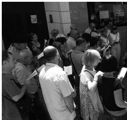
Honakoan, iluntzean beharrez eguerdi partean arituko dira kantuan.

12:00 Kantu-jira, Mikel Laboa plazatik abiatuta. 14:30 Bazkaria Saizar sagardotegian. Antolatzaileak: Usurbilgo eta Gasteizko kantu taldeak. Babeslea: Usurbilgo Udala.