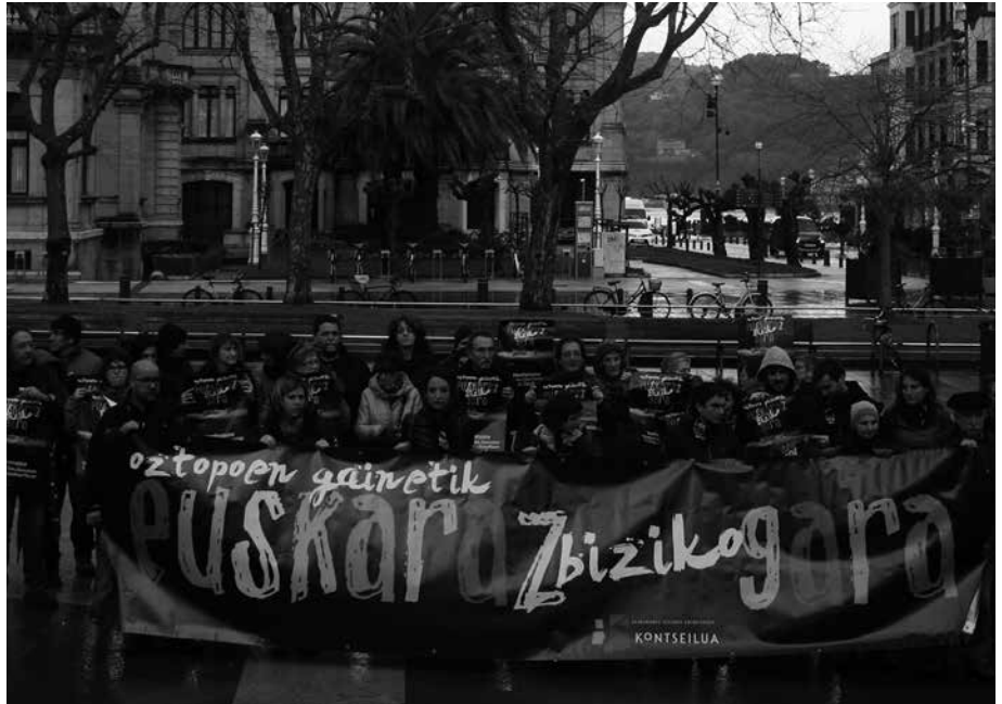
Larunbateko manifestazioa Donostiako Gipuzkoa Plazatik abiatuko da, 17:30ean.

Oztopoen gainetik euskaraz biziko gara lemapean, manifestazioa deitu du Kontseiluak, larunbat honetarako, otsailaren 28rako Donostian, 17:30ean Gipuzkoa Plazatik abiatuta. Hizkuntza-politiketan azken aldian Estatuaren zein Nafarroako Gobernuaren bidez jasandako injerentziak salatzea eta hainbat administrazioetako arduradunek aurrera egiteko hartu duten determinazioa txalotzea da mobilizazioaren helburua. “Bada garaia, horiei, euren aginduak gurean ez dira zilegi esateko. Gure herriaren berezko hizkuntzan bizitzeko eskubidea eta asmo dugula irmo adierazteko. Gure hizkuntzari lotutako erabakiak hartzeko aske izan nahi dugula esateko”, adierazi dute deitzaileek. Euskaraz bizi nahi duten herritar guztiak manifestazioan parte hartzera gonbidatu dituzte.