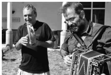
19:00etako sesiorako sarrerak agortuta daude. 22:00etako saioak salgai dira.

Sarrera zozketa, NOAUA!ko bazkideen artean NOAUA!ko bazkideen artean bi sarrera zozketatuko ditugu. Zer egin behar da zozketan parte hartzeko? Email bat idatzi erredakzioa@noaua.eus helbidera eta ostiral honetan, otsailaren 27an, argituko dugu zein bazkidek jasoko dituen bi sarrera. Web orrian, www.noaua.eus,