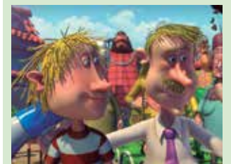
Arratsaldeko 17:00etan hasiko da.