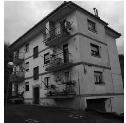
Bi etxebizitzok ikusteko aukera izango da martxoaren 10ean eta 12an.

du Udal jabetzako salmentak enkantearen bidez egin beharra eta, hau horrela izanik, irteera prezioa hobetzen duten eskaintza onenei izendatuko zaizkio etxebizitzak", berri eman du ohar bidez, Usurbilgo Udalak.