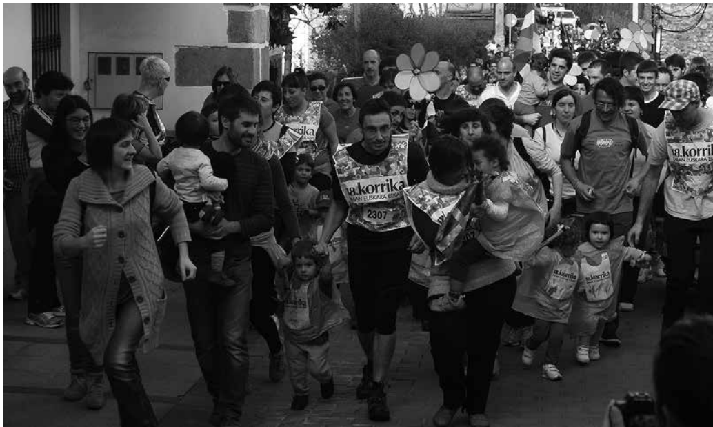
Martxoaren 22an igandea, eguerdi partean igaroko da Korrika Usurbildik.

M artxoaren 22an, igandez inguruotara helduko den 19. Korrikan, NOAUA! Kultur Elkartek hartuko du lekukoa, Zubieta, Usurbil eta Aginagatik barrena osatuko duen ibilbide zati batean. Oraingoan, NOAUA!k bazkideoi eskaini nahi dizue, lekukoa eramateko ohorea. Lekukoa eramateko bazkide talde bat osatu nahi genuke. Animatzen? NOAUA!ko bazkide izan eta lekukoa zure eskutan izan nahi baduzu, deitu 943 360 321 telefono zenbakira edo idatzi elkarte@noaua.eus helbidera.