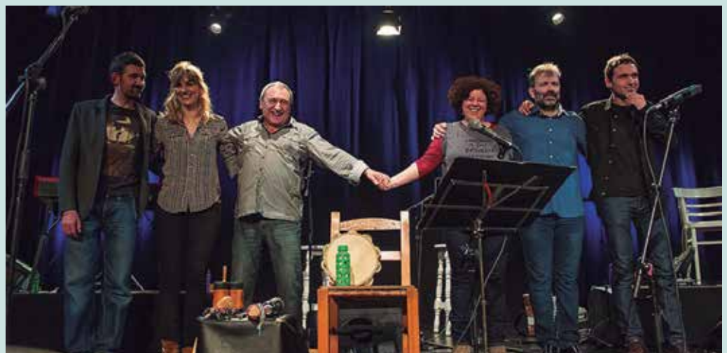
Tapia eta Leturia Taldeak bi saio eskaini zituzten #Kilometroak15 egunaren alde.

Ehunka herritarrek emana dute izena, baina jende gehiagoren laguntza behar da: ekonomia eta arropa salmentan,