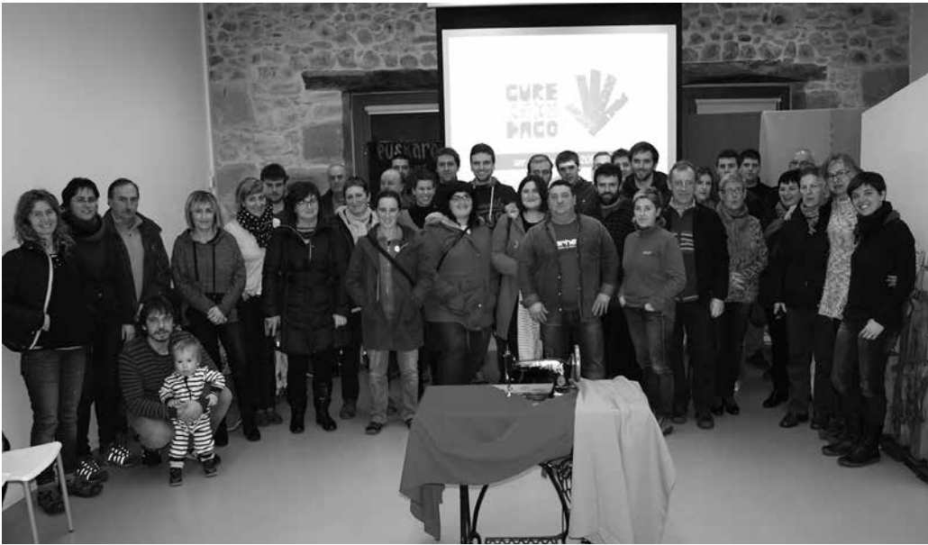
Erabakitze eskubidearen aldeko sarea herritar gehiagoren babesarekin ehuntzen joan nahiko lukete.

E uskaldunon erabakitze eskubidearen alde indarrak metatzen jarraitu nahi du 2015ean, Gure Esku Dago mugimenduak. Euskaldunon erabakitze eskubidearen inguruan herritarren sare bat osatzen ari da. Sare hori herritar gehiagoren babesarekin handitzen, ehuntzen joan nahi lukete 2015erako programatu dituzten ekintzekin. Nazio mailako erronka bat antolatzen ari dira ekainaren 20rako.