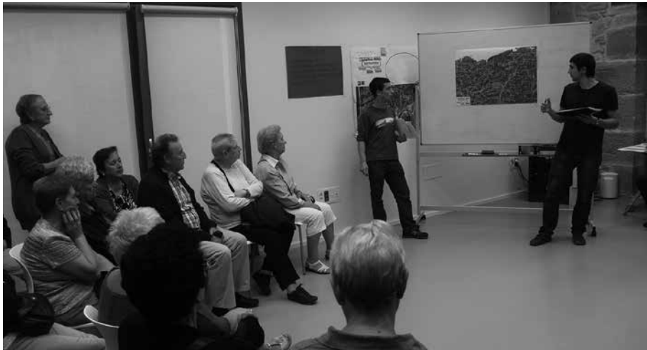
2013ko irailean hasi zen garraioaren inguruko partehartze prozesua.

Azken urte eta erdi honetan, inoizko parte hartze prozesu zabalena bideratu du Gipuzkoako Foru Aldundiak, garraio zerbitzu publikoak berri eta indartzeko. 5.000 ekarpen egin dituzte herritarrek. %75 inguru onartu dira. Horren guztiaren emaitza,