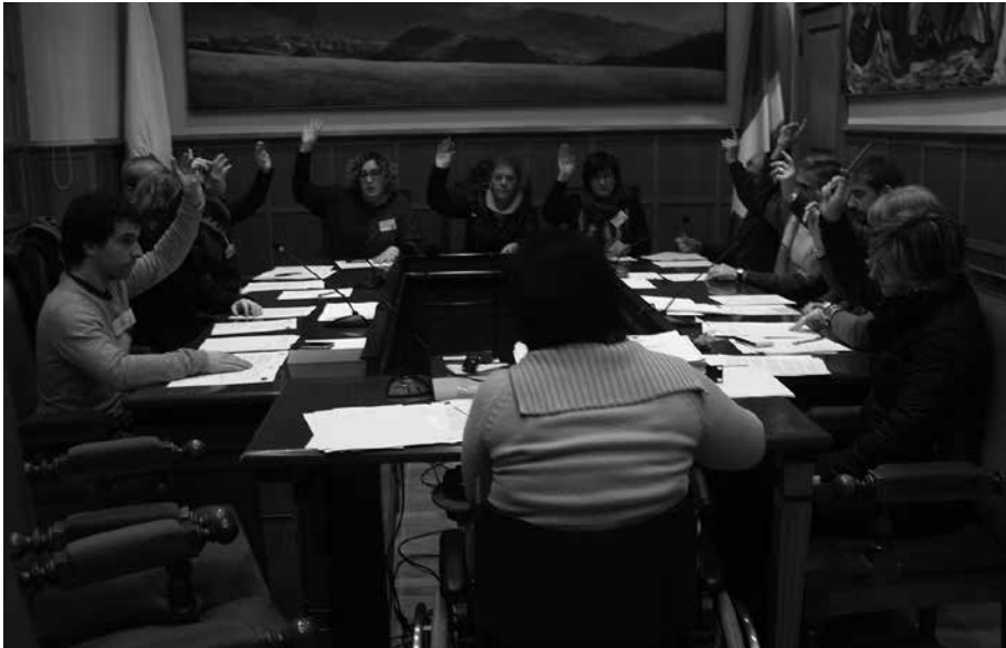
Matrakak taldekoekin antolatu dituzten ekitaldietara joateko deia egin du Udalbatzak.

Aho batez onartu zen otsailaren 24ko osoko bilkuran, martxoaren 8ari begira Usurbilgo EHBildutik aurkeztu zuten adierazpen instituzionala. Datorren Emakumeen Egunean, zer ospatu eta zer aldarrikatua badela dio testuak. Zer ospatua, “mugimendu feministarekin batera euskal jendartearen gehiengo baten egindako borrokari esker abortuaren erreforma” gelditzea lortu delako. Baina zer aldarrikatu eta salatua bada oraindik, udal taldeek aurreko astean erabat babestu zuten mozioaren arabera.