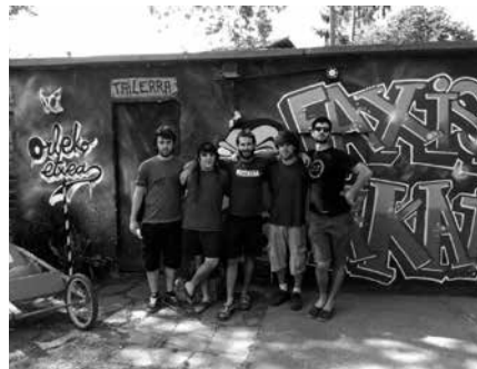
Desegin taldekoak arituko dira Lasarte-Oriako Elebeltz gune askean.

20:30 Afari beganoa, borondatearen truke. Falafela, marmitakoa, salda beroa. Ondoren,