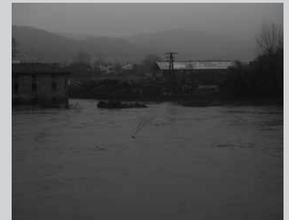
N634 errepidea itxita egon zen otsailaren 26an.

Hilabeteko tartean hirugarren denboralea, bigarrena euriteengatik. Eskualdeko beste zonalde batzuetan kalte askoz handiagoak eragin zituen arren, aurreko asteko euriteek Oria ere bere bidetik aterarazi zuten. Txiki-ierdi-Zubieta ingurua izan zen kaltetuena. Lur jauzi batek N-634 errepidea itxiarazi zuen otsailaren 26an. Trafikoa eten zuen lurjauziaren parean, Txiki-ierdi-Zubietara doan bidea ere itxita zen, zati bat urpean geratu baitzen, errioak gainezka egin ostean. Ostegunean zehar, egoera bere onera etorri zen pixkanaka. N-634 errepideko errail bat goizean bertan ireki zuten, bestea bazkalostean. Goiz berean ireki zuten baita Txiki-ierdi-Zubietara zihoan bidea, bezperan gainezka egin zuen errioaren beharago zetorren eta. Gainerakoan duela hilabeteko euriteen argazki bera. Errioaren bidetik aterata, Zubieta, Usurbil eta Aginaga parean. Oriatik gertuen diren lursailak urak harrapatu zituen.