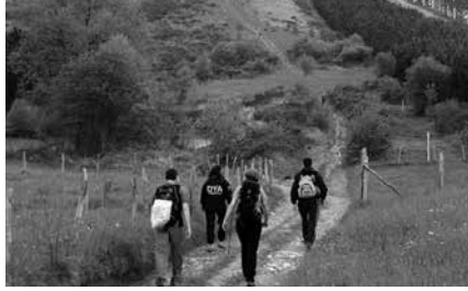
Goizeko 7:30ean abiatuko dira Oiardo Kiroldegitik.

Aurreko asteetan iragarri dugun moduan, Andatza Mendizale Elkartekoek antolatu dute mendi martxa eta goizeko 7:30ean abiatuko dira Oiardo Kiroldegitik. 19 kilometrotako ibilbidea osatuko dute, Ulizar menditik, Gaztelu eta Leaburutik barrena. Tolosatik gero, autobusez Usurbila. Izena aldeztu aurretik eman behar zen.