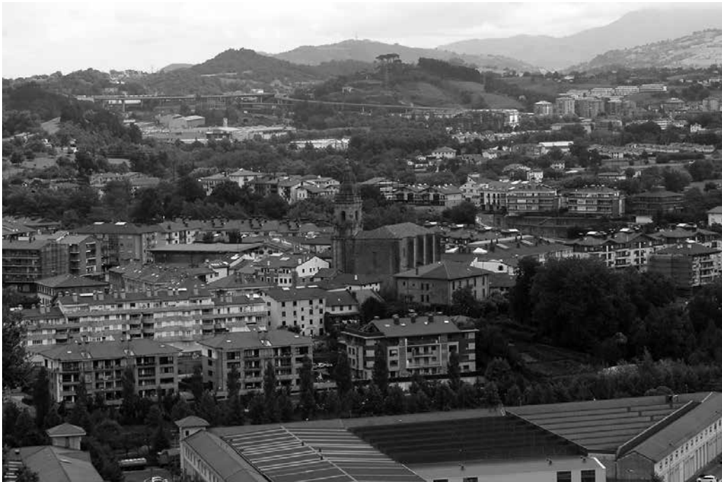
Soziolinguistika Klusterrak aditzera eman duenez, etxean nagusiki euskara darabilten herritarren kopurua ia %12 jaitsi da azken hamarkadan.

E uskara gaitasuna ia %80koa da Usurbilen; euskararen erabilera soziala aldiz, %40ra ere ez da iristen. Etxean nagusiki euskara darabilten herritarren kopurua ia %12 jaitsi da azken hamarkadan. Lehen hizkuntza euskara dutenena berriz, %5. Datuok, udalerrri euskaldunei buruz Soziolinguistika Klusterrak egindako azterketan kale-ratu dituzte.