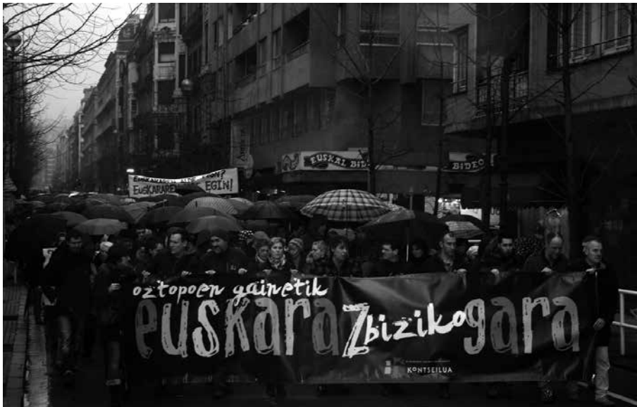
Milaka lagun izan ziren Kontseiluak deitutako manifestazioan, Donostian.