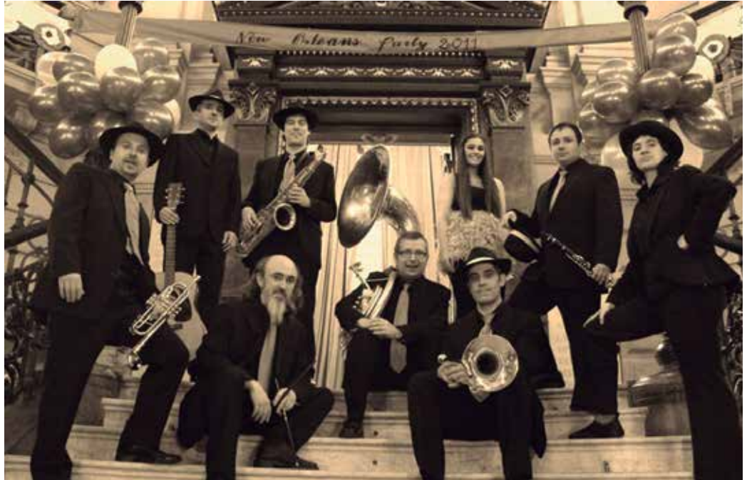
Martxoaren 10ean kontzertu pedagogikoa eskainiko du Mac Jeara's Band taldeak.

Zumarte Musika Eskolak, Usurbilgo Udalarekin elkarlanean josia du, XI. Soinurbil Musika Asteako egitaraua. 2015eko edizioak, Elgoibarko Musika Eskola eta Legazpiko Musika Banda dakartza gonbidatu dituzte, Elizako organoa ezagutzeko aukera izango da, eta bi emanaldi. Bat frontoian; Reunion Big-Band Taldea. Eta Musika Asteari hasiera emango dion kontzertu pedagogikoa azkenik, Sutegin; Mac Jeara's Band. Hitzordu honetarako sarrerak aurrez eskuratu beharko dira, Zumarte Musika Eskolan. Argibide gehiago eta XI. Soinurbileko egitarau osoa, segidan: