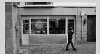
2013an, 6.111 ziren Usurbilen erroldatuak. 2004an, 5.512.