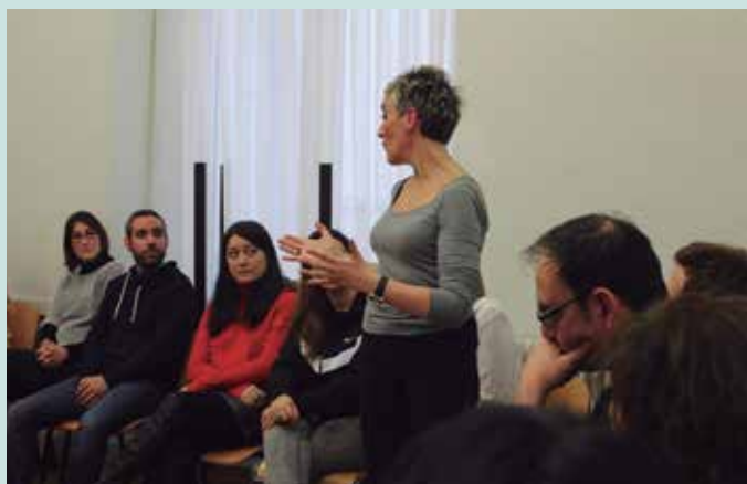
Duela gutxi, Bilbo Zaharra euskaltegiko ikasleekin egin du tailer hau.

Jendea kutxen inguruan dago eserleketan jezarrita, mahairik gabe, eskuko tele-