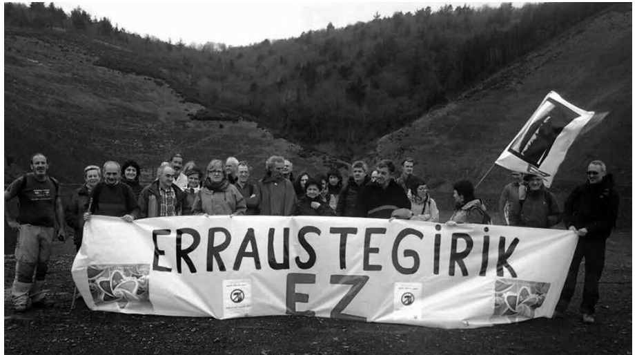
Bi ordutan osatu zuten Hernani eta Zubietako "Zero Gunerean" arteko bidea.

Hernanin Zero Zabor taldeko kide batek mintzaldi laburrean gogorarazi zituen 'EAJ/PNV, PSOE, PP... entzun! Errausketarik EZ, ez Zubietan, ez inon!' izenburua.