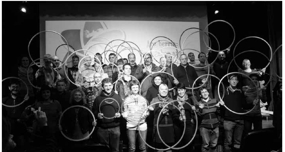
Ekitaldi amaieran, herritar, eragile eta erakundeetako ordezkariak zabal bat igo zen Sutegiko oholtzara. Zero zabor mugimenduaren ikur diren uztaiak dituzte eskutan.

Ingurumen alorreko eragileak, sindikatuak, alderdi politikoak, enpresak, hezkuntza munduko ordezkariak, alkateak, Gipuzkoako Foru Aldundiko eta Gipuzkoako Hondakinen Kontsurtzioko kideak... Eta nola ez, usurbildar eta zubietarrak. Arlo ezberdinetako ordezkariak gonbidatu nahi izan zituzten kultur etxeko auditorioan antolaturiko "Aro berria, zero zabor aroa" ekitaldi-ikuskitzunerara. Guztiak batera, atzera begira jarri ziren lehenik. Ordu erdi inguruko bideo proiektio batekin, azken hamarkadotan hondakinen kudeaketak izandako bilakaera iruditan ikusi ahal izan zuten; erraus-tegiaren mehatxua, proiektu honi aurre egiteko eta alternatibak eskaintzeko sortutako herri mugimendua, gaikako bilketa izugarri igoarazi duten hondakinak kudeatzeko bestelako es-