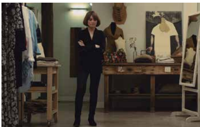
Euskarazko film laburren ekoizpen berrienak ikus ahal izango ditugu martxoaren 26an osteguna, 19:00etan Sutejin.

ibiliko dira biran. Sormen lanen erakusgarri izan ezik, egileak ezagutzera emateko eta sormen lanen inguruan solasean aritzeko aukera paregabea eskaintzen du Laburbirak ezta?