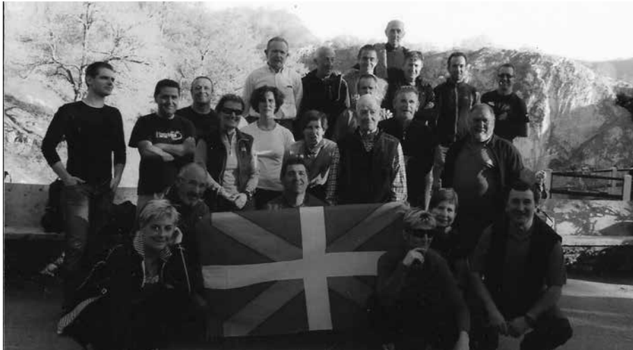
Argazkian, iazko ibilaldiko partehartzaileetako batzuk. Aurrez izena eman behar da.

E gun pasa egiteko "irteera oso polita" prestatu du herritar talde batek, apirilaren 2rako. Azken hiru hamarkadetako ohiturari eutsiz, badira "Ostegun Santu" egunez, urtero Usurbildik Arantzazurako bidea oinez osatzen duten mendizaleak. Usurbildarrak eta ingurueta herrietatik etorritako kideek osatzen dute taldea. Goizean goiz, frontoi atzetik abiatu eta tipi-tapa Gipuzkoako mendietatik barrena Arantzazuraino joaten dira oinez.