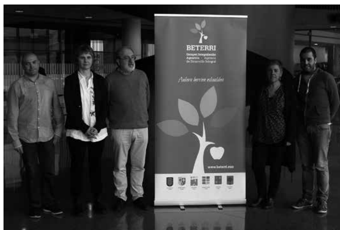
Urnietakoa izan ezik, gainontzeko alkateak batu ziren aurkezpenean.

H alako egiturarik ez zuten Gipuzkoako eskualde bakarra zen gurea. Bere beharra sumatzen zuten. Aurrez elkarlanerako hitzarmen eta proiektu batzuk gauzatu izan dituzte, baina “ez zegoen egitura formalik”. Orain bai ordea. Martxan da jada, Beterri Garapen Integralerako Agentzia. Hedabideen aurrean aurkeztu zuten eskualdeko alkateek, martxoaren 12an Hernaniko Orona Fundazioan.