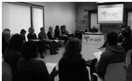
Larunbatean, 11:00etan hasiko da bilera Potxoenean.

U dal hauteskundearen inguruan lanean jarraitzen du EH Bildu koalizioak. Larunbat honetako batzarra, ordea, erabakigarria izango da. Maiatzaren 24ko udal hauteskundeetarako koalizioaren zerrenda eta herri programa erabakiko baitira bertan. Bilerara joaterik ez duenak, ekarpenak egin ditzake helbide honetan: ehbildusurbil@gmail.com