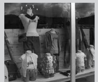
Astelehenetik larunbatara: 10:30-13:00 // 17:00-20:00 (astelehen goizak, larunbat arratsaldeak itxita).