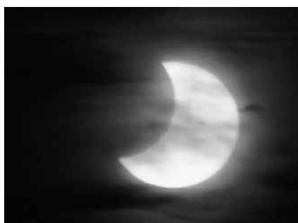
Goiz partean igarri beharko genuke, 9:00etatik 11:30ak bitartean.

Datu gehiago, Iruñeko Planetarioaren atarian. Honatx helbidea: