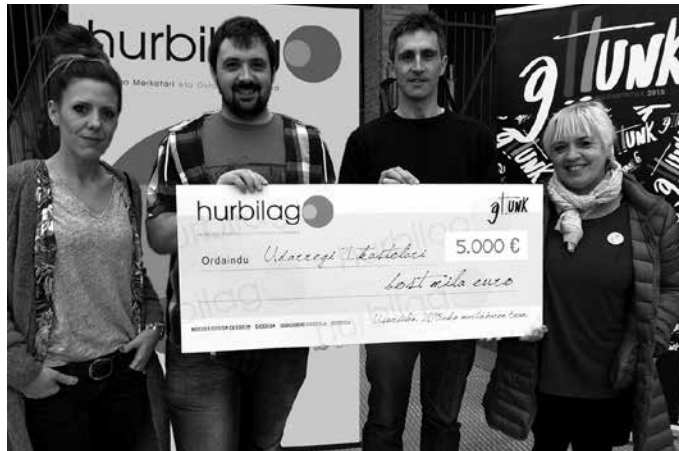
5.000 euroko txeke hau baliatuko du #Kilometroak15 antolaketa batzordeak, Hurbilagoko kide diren establezimenduetan baliatuzeko.

Elkarlan honen baitan, 5.000 euroko diru-laguntza emango dio Hurbilago Elkarteak Udaregi Ikastolari. Hau da, bai urtean zehar antolatuko diren ekimenetarako eta #Kilometroak15 egunerako, antolakuntzak 5.000 eurora arteko gastua egin ahal du Hurbilagoko kide diren establezimenduetan. "5.000 euroko saldo erabilgarria duen Hurbilagoko kreditu txartela entregatuko zaio Udaregi Ikastolari (goiko irudikoa), Kilometroak jaia antolatzeko Hurbilagoko saltoki eta tabernetan egiten diren gastuetarako. Gastu hori Hurbilagoko saltoki ahalik eta gehien artean banatzea bultzatuko da eta horretarako, 5.000 euro horietan