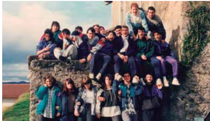
Ziortza Gazte Elkartea belaunaldi ezberdinen aterpe izan da urteotan.