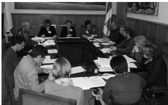
EAJren mozioak oposizio osoaren babesa jaso arren, ez zen onartua izan.