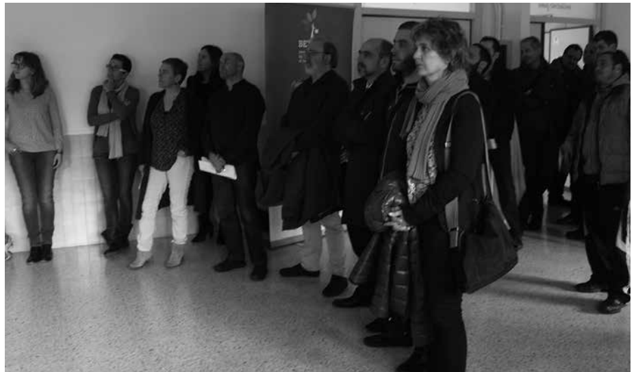
Martxoaren 25ean inauguratu zuten eraikina.