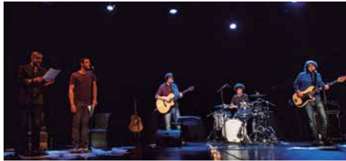
"Nola belztu behar zuria" saioarekin abiatuko da zikloa. Apirilaren 24an ostirala, Sutegin. Sarrerak dagoeneko salgai dira Lizardin.

Joxanen poemak dira errezitatzeko eta kantatzeko dituztenak.