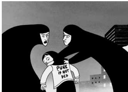
Iranen oinarritzen da Persepolis filmaren trama. Igande honetan, Sutegin ikusgai.

B egirada kritiko eta zorrotz batekin begiratu zion haur, nerabe eta gazte zenean Marjane Satrapik (Teheran, Iran, 1969) bere inguruari. Irani. Aldatzen ari zen herrialdeari. Ikusitakoarekin eta inguruko bizimoduari jarrera kritikoa erakutsiz komiki bilduma bat osatu zuen Satrapik. Persepolis. Bertan, azken 30 urteetan Iranen bizitakoak jaso zituen lau liburutan. Komikiko tirak eszena eta plano bilakatu ziren ondoren. Matrakak taldekoek eskainiko dute igande honetan, 18:00etan Sutegin.