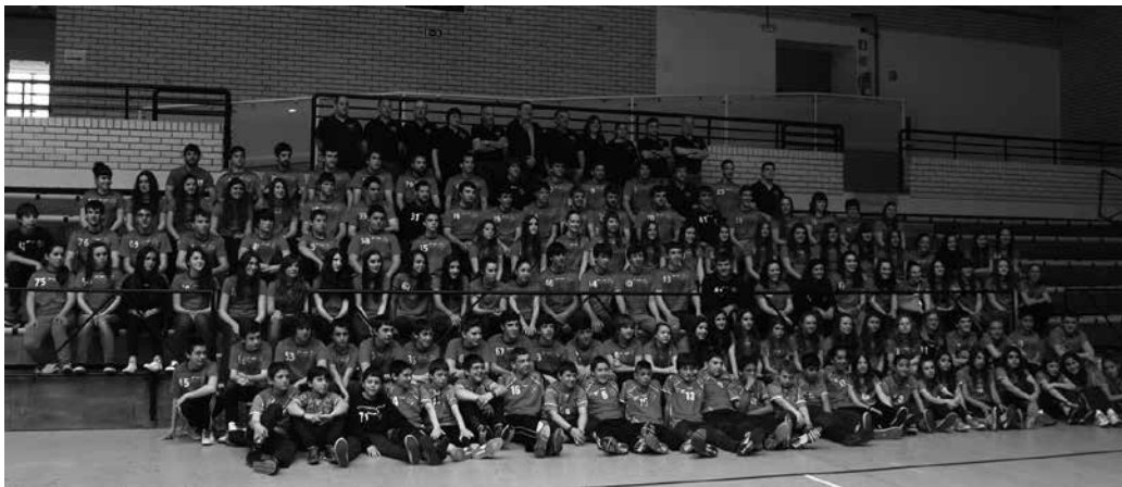
Usurbil KE taldeko jokalarik, entrenatzaile, delegatu eta zuzendaritzako kideak, aurreko larunbatean kiroldegian atera zuten talde-argazkian.

D enboraldi honetan izan duten maila igotzeko neurketak erabakigarriak jokatu dituzte asteburuan, Usurbil Kirol Elkarteko zenbait taldeek. Apirilaren 17tik 19ra, neska-mutil kadete eta jubenil taldeek Euskal Ligarako igoera sektoreak jokatu dituzte. Mutilen taldeen arteko sektorea, Usurbili egokitu zaio antolatzea. Honenbestez, Oiardo Kiroldegian jokatu dira partidak. Eguneko bi neurketa. Neskenak, Bilbon. Momentuz, zehaztasun hauen berri eman dute: