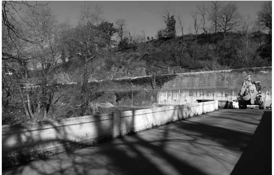
Aliriko zubian lanean aritu dira egunotan. Troia-Aliri itxirik izango da apirilaren 30era arte.

Asteotan Aliriko zubian aritu dira lanean. Lanok amaituta, orain, Troia-Aliri zubi arteko oinezkoen pasabidean hasi dituzte lanak. Eta honenbestez, aipatu bide zatia itxita egongo da, apirilaren 30era arte.