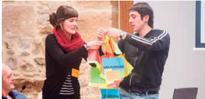
"Proposamenak eskualdearentzako onuragarria eta Aldundiaren eskumenekoa izan behar du", Foru Aldunditik ohartarazi dutenez.