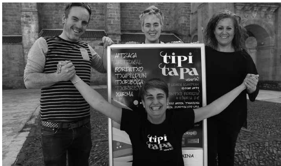
Igande honetan Tipi-Tapan, edaria eta kroketa bi euroren truke.

E ra desberdinetara sukaldaturiko kroketa goxoak dastatzeko aukera ordea sei ez, bost tabernetan aurrerantzean. Otsailean Xarma itxi ostean, Txapeldun taberna itxiko baitute egunotan. Honenbestez, Artzabalen, Borda-