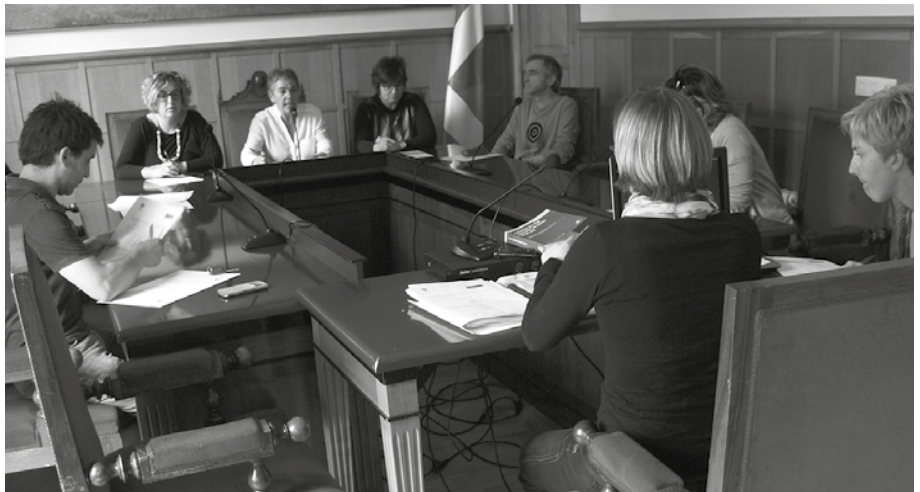
8 mahaietarako 72 herritar hautatu dira. Aste honetan jasoko dute jakinarazpena etxean.

Udal eta foru hauteskundeekin batera, Zubietako Herri Batzar berria osatzeko bozka eguna izango da baita maiatzaren 24a. Kasu honetan ordea, mahai kideen zozketa ez zuten apirilaren 24ko ezohiko osoko bilkuran egin, atzerapen kontu batengatik. Gaia Tokiko Gobernu Batzarraren esku uztea proposatu zuen gober-