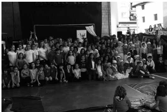
Larunbateko jaialdian jende asko batu zen, oholtzan eta oholtzatik kanpo.

Dantza mugimendua bizi asko dago herrian. Larunbateko jaialdian argi geratu zen, zenbat jende mugitzen duen dantzak Usurbilen. Eta zer nolako maila duten gainera. Arratsaldeko saioa, inoiz baino "internazionalagoa" izan zen. Udalerriko mugak gaintu zituen emanaldiak. Usurbilen dantza estilo ezberdinetan dabilzan herritarrei, Lasarteko Kukuka taldekoak eta Urdiñarbeko dantzariak batu zitzaizkien. Gaueko "Dantzaroa" ikuskitzuzaren estreinaldia, mundiala. Kolorea, mugimendua,