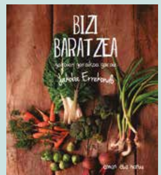
Alkartasuna kooperatiban dago salgai.

Hitzaldietara joaten naizenean beti esaten dut, “ni hona ikastera etorri naiz”. Teknikak, hitzak... etengabe ari naiz ikasten.