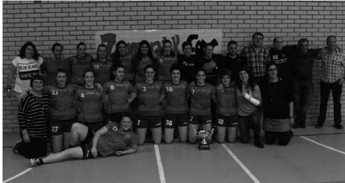
Kopa eta guzti, txapelketa irabazi berritan.

Lehia estua izan da, aurkariek ez diete joko erraztu, baina lortu dute. Lortu du senior nesken eskubaloiko taldeak, gogotik landutako erronka; Euskadiko Txapelketako azken fasea, lehen postuan amaitu dute, asteburuko hiru neurketak irabazi ostean. Eta gainera, Zilarrezko Ohorezko mailara igotzeko aukera eskainiko dien Espainiako Txapelketan lehiatzeko sailkatu dira. Zorionak!!!