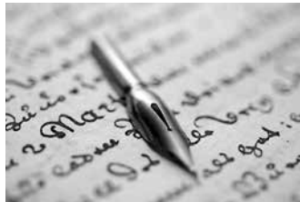
Sari banaketa Sutegin egingo da, eta jaiak baino astebete lehenago.

hartzeko Euskal herriko 16 urtetik gorako edonor izan daitezke.