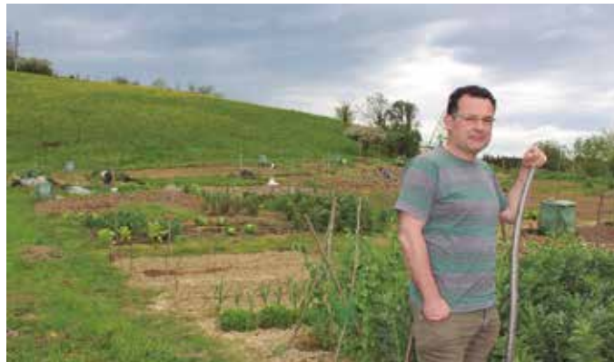
Herri baratzetan, 1.000 familia daude izena emanda Gipuzkoan. Usurbilen ere bada horretarako eremurik, eta bertan atera genituen argazkiok.