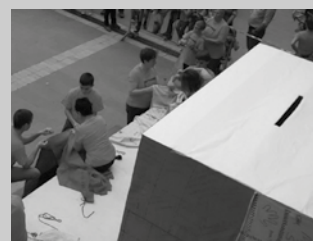
Herri askotan, aurreko asteburuan ospatu zen Ehuntze Eguna. Usurbilen, datorren astean.

■ Txartelak aurrez salgai: Lizardin, Bordatxon, Aitzagan, Irratin eta