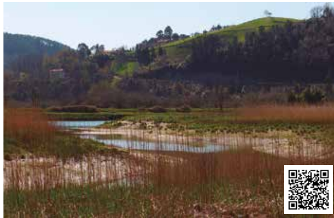
Sariako paduretan hegazti batzuk hasi dira umatzen. Eskubitarra zankaluzek. QR kodearekin bideo bat ikus dezakezue.

Duela bi aste, Sariaren inaugurazioaren berri eman genuen. Baina albiste, ordea,