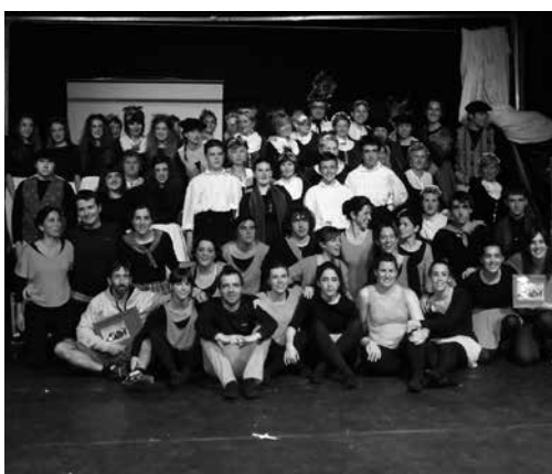
Hilabeteotan lanean aritu dira eta emaitza ikusgarria izan zen. Herri bat aritu zen dantzan. Argazki gehiago: www.noaua.eus