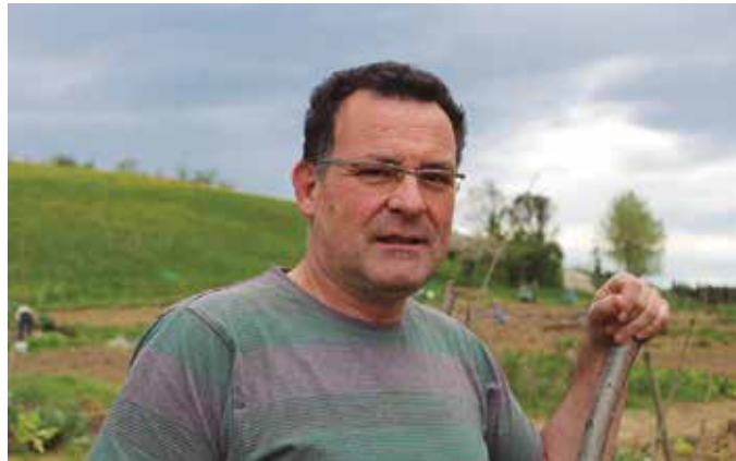
Rock and roll artista handi baten pare dabil. Hilabete eskasean 25 aurkezpen ditu hitzartuak. Larunbat honetan Alkartasunan izango da, eguerdiko 11:30ean.

Barazkiei buruzko fitxa praktikoa ere topatuko ditu irakurleak. Barazki bakoitzari buruzko is-