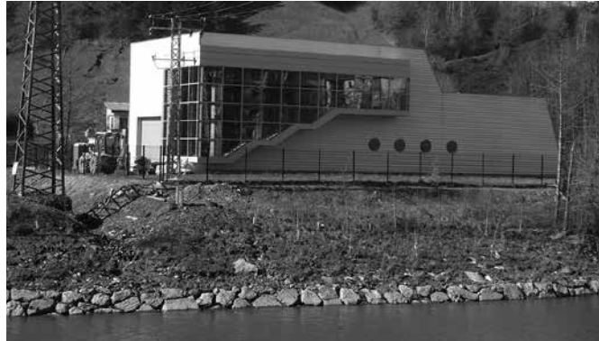
Zubietako ponpa-etxea, Lasarte-Oriako eta Usurbilgo Intertzeptore Nagusiaren osagarri garrantzitsua.

Baina, tamaina alde batera utzita, hauek oso lan garrantzitsuak dira, batez ere Lasarte-Oriako eta Usurbilgo ur zikinak biltzea eta araztegiara eramatea ahalbidetuko dutelako; behingoz ahalbidetu ere. Kontuan izan behar da gaur egun, baten bati beharbada gezurra irudituko zaion arren, Lasarte-Oriako eta Usurbilgo ur beltzak (18.000 eta 6.000 laguneko herriak, hurrenez hu-