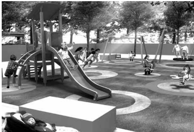
Proposamen ezberdinen inguruko eskuorriak banatu ditu Udalak etxetxetxe. Orain, gustukoena hautatzeko aukera dago.

Hiru proiektu dituzue aukeran, 2-7 eta 8-12 urte arteko haurrentzako guneetarako. Etxean jasoko zenuten eskuorrian dituzue, parke bakoitzaren inguruko zehaztasunak. Gustuko duzuen hautatu, datu pertsonalak idatzi eta Udalak jarri dituen postontziotako batean utzi zuen proposamena; udal erregistroan, Sutegin, Kirodegian, edota ikastetxeetan (Haur Eskolan, Udarregi Ikastolan, Zubieta eta Aginagako Eskola Txikitian).