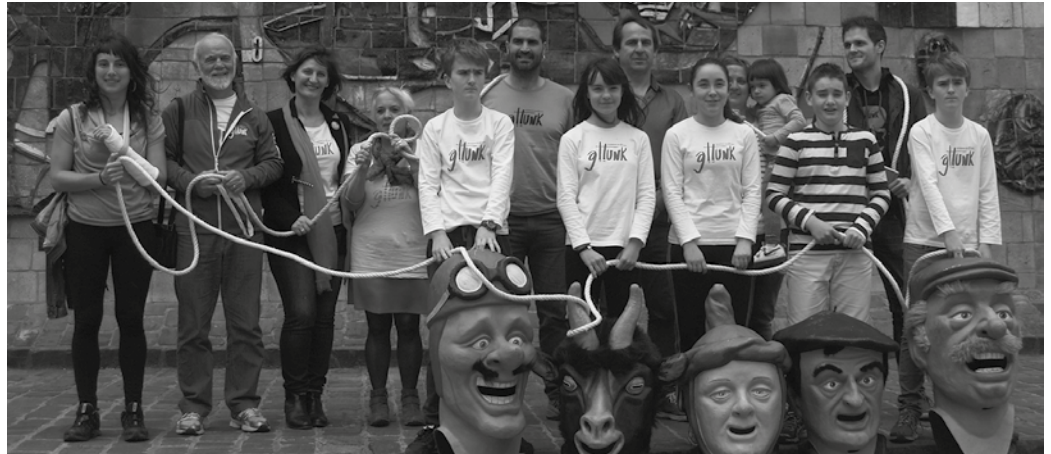
“Esan dezakegu auzolanean egindako sormen kolektibo bat dela”.

“Herri honekin lotura estua duen txalapartarekin ireki