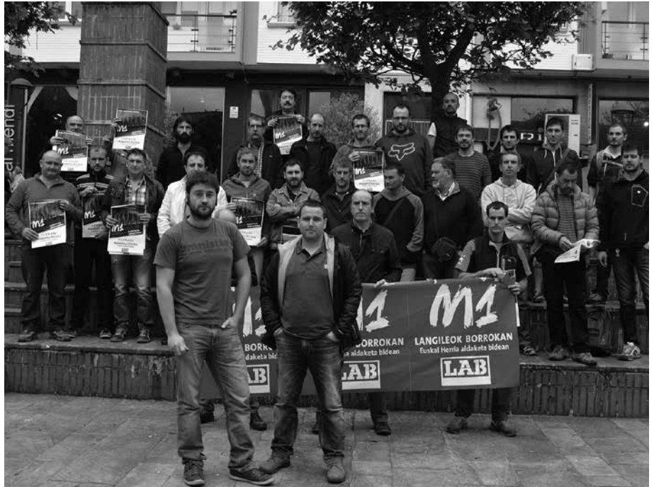
Egurdiko 12:00etan Hernaniko Gudarien Plazatik abiatuko da LABek deitu duen manifestazioa.

E skualdeko manifestazioa deitu du LAB sindikatuak Langileen Egunerako, maiatzaren lehenerako. Egurdiko 12:00etan abiatuko da Gudarien Plazatik, eta amaieran, Tilosetan ekitaldia egingo dute. Deialdia, apirilaren 23an eskualdeko ordezkariekin eginiko batzarraren ostean egin zuten. Zer ospaturik ez, baina harro egoteko arrazoiak badirela aipatzen dute LAB-etik. Harro, aipatu sindikatuko kide izan eta "borrokatzen dugun langileak garrelako". Aurtengo maiatzaren 1ak berezitasunik ere baduela nabarmentzen dute, "40 urte bete berri ditugula burutzen dugulako. Eta ez dugu ezkutatu: harro gaude lau hamarkada hauetan LABek Euskal Herrian egin duen borrokagatik, askapena ekarriko digun bidean egin duen ekarpenagatik; eta harro gaude milaka eta milaka langilek LABen ikusi dutelako zapalkuntzaren kontra borrokatzeko tresna egokia. Hala erakusten dute hauteskunde sindikalen epe trinkoa igaro ondoren datuek, gu izan baikara igo garen sindikatu bakarria Euskal Herri osoan".