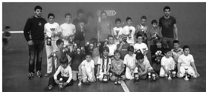
Partehartu zuten guztiak sari bana eman zuten.