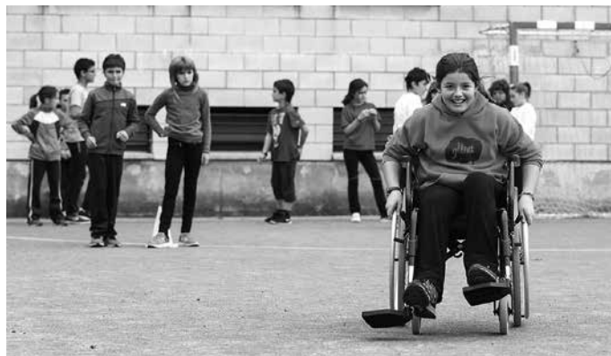
Espazio ezberdinak inklusibitatearen alde egokitzea da helburua.

"Ideia hau ari gara lantzen #Kilometroak15 urte honetan. Hau da, gizartean ditugun espazio ezberdinak, inklusiboaren alde sustatzea. Gizartea kontzientziatzea da