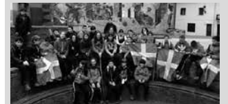
Datorren urtean El Konkis-en saio berri bat egingo dute Gaztelekuok.

Gaztelekuak Konkis izeneko ekintza antolatu du Aste Santuan bigarren aldiz. Guztira DBH1 eta 2ko 30 gazteek hartu dute parte.