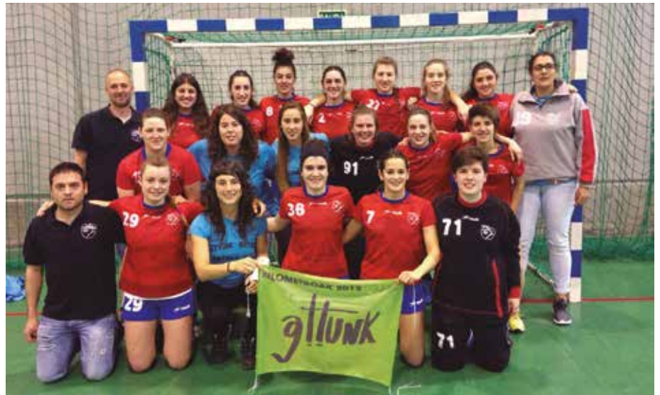
Zer ospatua badute senior neskek. Igoera ez dute lortu baina Euskadiko txapelkun titulua euren da.

Eta ezin da ahaztu beste kontu bat: "Euskadiko txapelkun titulua inork ez die kenduko". Iaz lortu zuten maila igoera baina igoera gauzatzetik ez zen izan. Aurten antza, gauza zitekeen baina emaitzek ez diete ahalbidetu igoera. Hare, bi denboraldiotako garaipen guztiek oroituta, ez da zalantzarik zer ospatua badutela senior neskek. Zorionak!