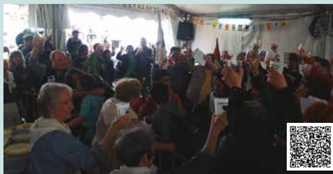
Ohi bezala, eguerdian elkarretaratzea egin zuten. Baina honakoan, talo-egileei urteotan egindako lana eskertu nahi izan zieten txotx batekin.

“Urtero Sagardo Eguneko jaia preso dauzkagun herrikideak gure artean behar ditugula gogoratzeko aprobetxatzen dugu, haiek ere gure artean, sagardo goxoa dastatzen nahi ditugula adierazteko. Gure artean, Gure artera... Izen horrekin hasi zen lanean usurbildar talde bat duela urte mordoia herriko preso eta iheslarien eskubideak aldarrikatuz eta beren senideei laguntza eta elkartasuna ekarriz.