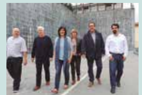
Eskualdeko EAJ-PNVko ordezkariak, aurkezpen egunean.

Hori lortzeko, elkarte anonimoa eratzea proposatzen dute, egitura juridiko-ekonomikoa eta kontrol publikoa bermatua izango dituen. Jarrera sektarioak alde batera utzita, EAJ-PNVk lankidetzaren alde egin du,