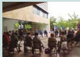
Larunbatean, Sutegi atarian egin zuten ekitaldia EHBilduk.