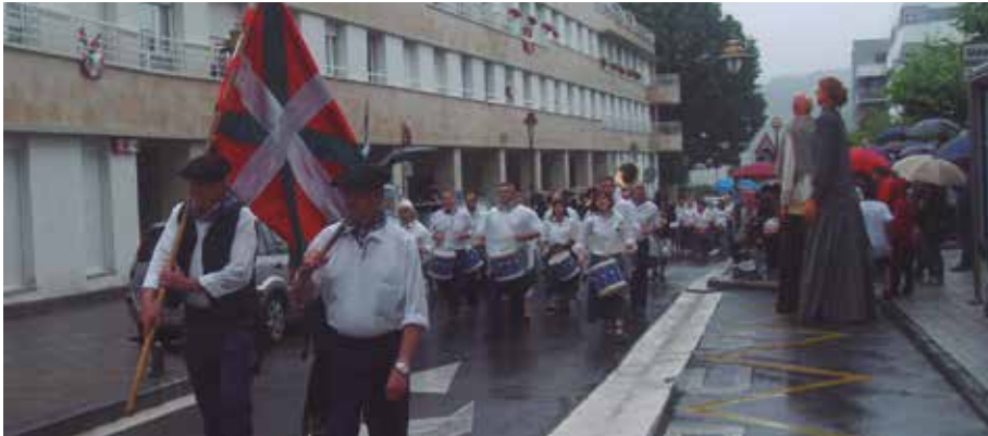
Helduen danborradako lehen entseguak ekainaren 9an eta 11n izango dira. 20:00etan Udarregi ikastolan.