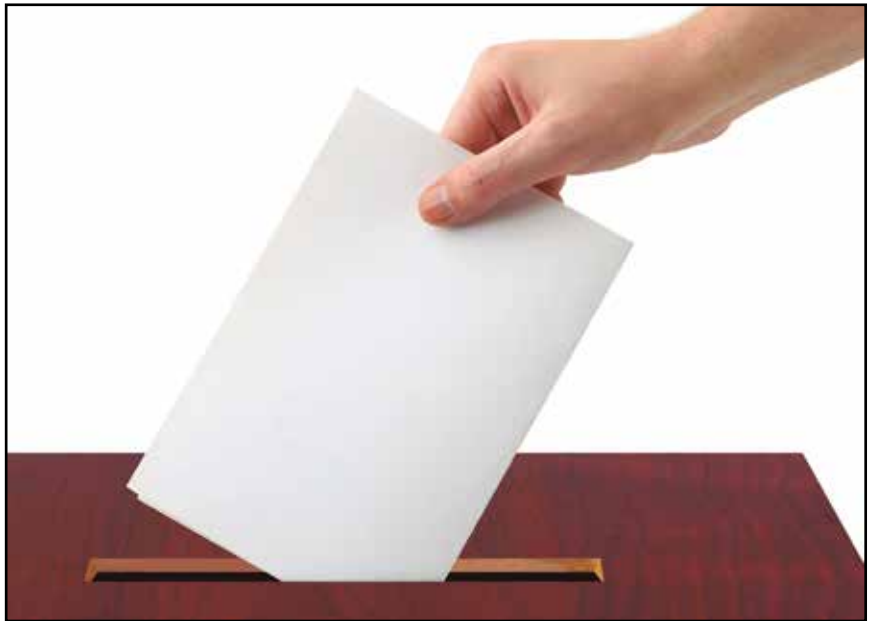
Udal Hauteskunde hauetan, lau dira aurkeztu diren hautes-zerrendak.

Udalak zozketa bidez hautaturiko mahaikideek goizeko 8:00etako egon beharko dute bozka lekuetan. 9:00etik aurrera irekiko dira guneok herritarrek bozka ematen has daitezten: