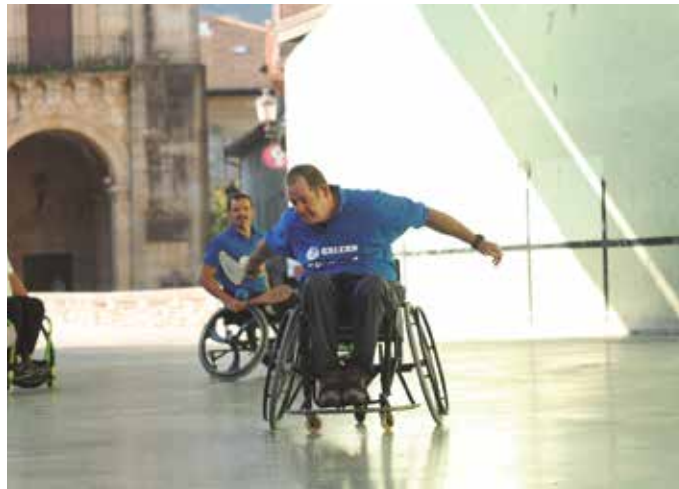
Gipuzkoako Kirol Egokituaren Federazioarekin batera antolatu dute hitzaldia.

Tokia: Oiardo Kiroldegiko pista. Orduetgia: 09:30-11:30 eta 17:30-19:30.