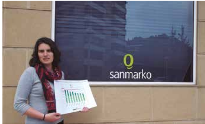
Zero Zabor Ingurumen Babeserako Elkarreak bere balantzearen berri eman du.