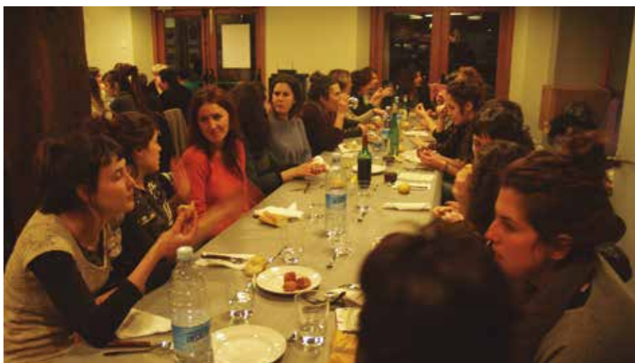
Martxoaren 8an bertso-afaria antolatu zuten. Larunbat honetarako kafe-tertulia prestatu dute.

Larunbat goizeko 11:00etatik aurrera, Potxoeneko lehen solairuan. “Konfiantzazko klima intimo bat sortzea da xedea, egunerokotasunean partekatzen ez ditugun gaien inguruan tertulia zabal bat egiteko. Zerbait informala izango da, gure artean hitz egin eta lagunarteko giroan emakumei eragin eta kezkatzen gaituen gaiei buruz hitz