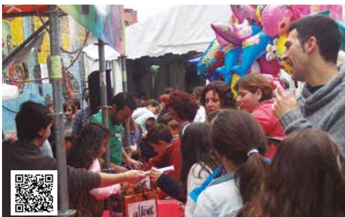
#Gattunk tonbolan jendetza ibili zen goizetik iluntzera arte.