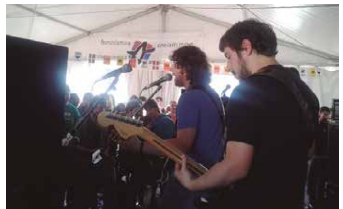
Izeberg eta Erokomeri-rekin giroa pil-pilean izan zen txosna gunean.