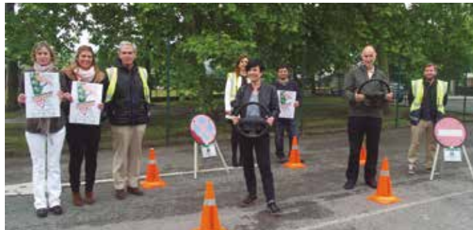
Autoeskoletako ordezkariak prentsaurrekoa eskaini zuten aurreko astean Lasarte-Orian.

Kanpaina duela bost urte abiatu zuten Buruntzaldeko udalek, eta ordutik, laukoiztu egin da bailarako sei udalerrietan, gidabaimena euskaraz ateratzeko hautua egin duen herritar kopurua. 2010ean 34 lagun baino ez ziren izan. Iaz, 2014an, 140.