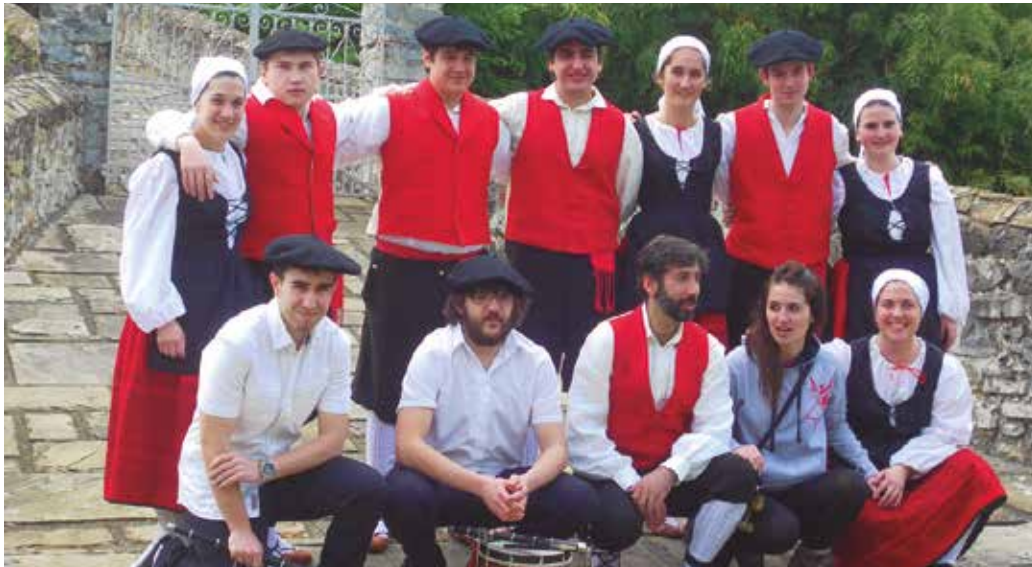
Urte luzez erabili ez diren jantziak konpontzen aritu direnei eskerrak eman nahi dizkiete.

"Asteburuan Zuberoako Urdiñar-be herrian ospatu den Musikaren Egunean parte hartzen izan gara Usurbilgo Dantza Taldeko kideak. Pixkanaka indartzen doan helduen taldeak Gipuzkoako dantzen erakustaldi txiki bat egin dugu jaialdian, bertako talde desberdine-