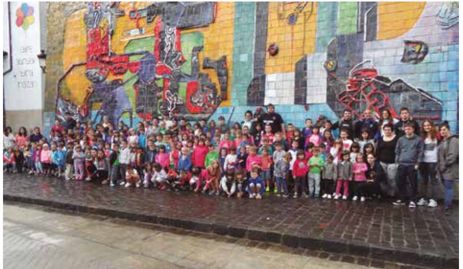
Uztailaren 6an hasiko da Udajolas eta begiraleak behar dira. Ekainaren 5a baino lehen bidali kurrikulum-ak.

Udan hurrekin aisialdi eremuan lan egin nahi duzu, euskaraz eta giro ederrean? Honatz zuzetzako aproposa izan daitekeen lan eskaintza. Uztailaren 6tik 30era Udalarekin batera antolatu dugun Udajolas ekimenean lan egiteko begiraleak behar ditugu. 2 urteko esperientzia eskatzen da begirale moduan, begirale titulua izatea eta EGA edo baliokidea den agiria. Usurbildarrek izango dute lehentasuna. Interesdunok, bidali zuen kurrikuluma ekainaren 5a baino lehen, NOAUA! Kultur Elkarteke egotzara edo elkarte@noaua.eus helbidera.