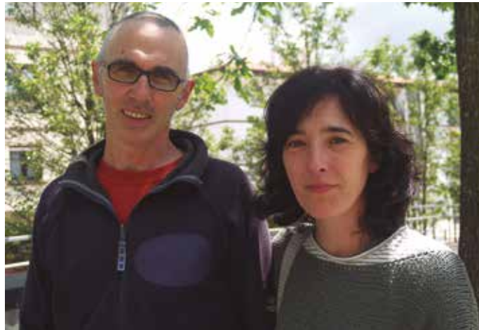
Dokumentalaren egileek esan digutenez, "egun dugun ikastola, haiei esker da".