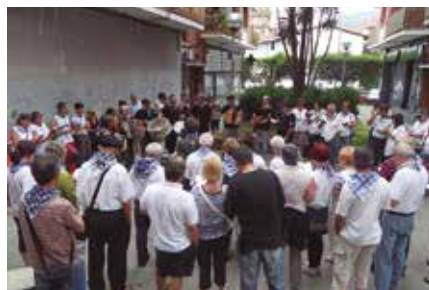
19:00etan abiatuko dira Mikel Laboa plazatik.

Maiatzaren 30ean larunbata, arratsaldeko 19:00etan, Mikel Laboa plazatik abiatuta. Afal ordura arte luzatuko da, Kantu Taldearen hitzordua.