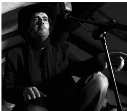
Mikel Laboaren bertsio batzuk joko ditu Igor Arzuagak, Mara ezinez arituko den bakarlariak.