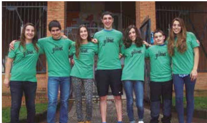
Gazte hauek aurtengo Erronkan hartuko dute parte.

Iazko proba berdina izango dituzte, “oso erakargarriak izan eta ondo funtzionatu izan baitute” antolatzaileek diotenez, baina gaitasun guztiak kontuan hartu nahi dituen, inklusibitatearen balorea guz-