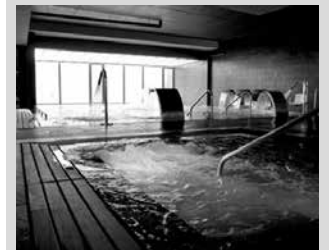
Aisia hoteleko zirkuitu termala.

Oraindik bazkide ez zaretenok, zozketa honetan partehartzeko aukera duzue. Baina lehenbizi bazkide egin beharra duzu. Bazkidetza orria osatu, opari ederra jasoko duzu eta hilaren 17ko zozketa mundialean hartuko duzu parte.