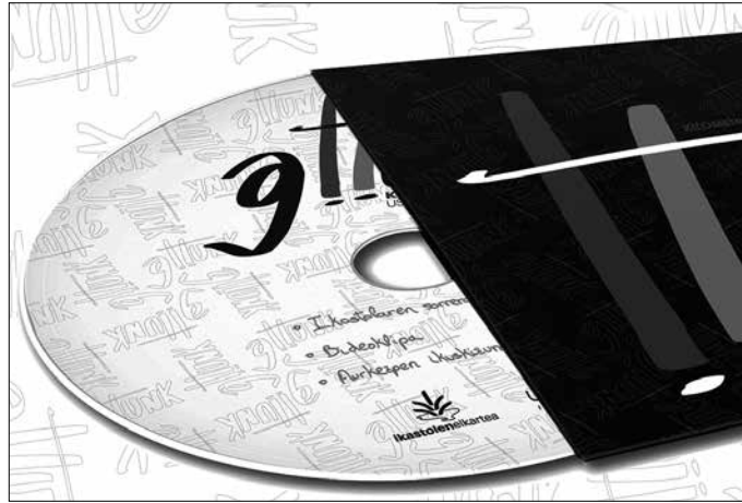
Gattunk dendan, Lizardin eta Lauroken ipini da DVD-a salgai.

“Udaregi Ikastolaren sorrerari buruzko dokumentala, bideoklipa eta aurkezpen ikus-kizuneko bideoa dira 2015ean bideoan jaso ditugun zenbait lan”, #Kilometroak15 lan taldekoek ohartarazi dutenez.