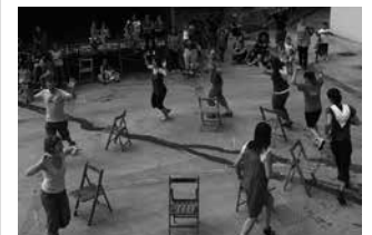
Abuztuak 28-31, auzoko festak.

Ohi bezala, askorentzat oporren itzulera markatuko duen abuztuko azken asteburuan ospatuko dira Atxegaldeko jaiak; abuztuaren 28tik 30era. Haurrentzako jolas, afari, kontzertu eta txapelketa artean joango da 48 orduko etengabeko festa giroa. Egitarau zehatza datorren astekarian argitaratuko dugu.