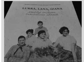
DVDa doan banatu da. Liburua ordea, salgai ipini da. NOAUA!n duzue eskuragarri.

Martxoaren 8an Sutegin estreinatu zen dokumentalaren DVD-a doan banatu berri du Udalak etxeetan. Ikusgai duzue baita youtube atarian.