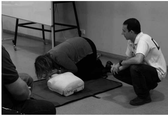
Ikastaroa Usurbilen eskainiko dute, uztailearen 29an eta 30ean.

“Ikastaro teoriko-praktiko honekin bihotz biriken geldialdia identifikatzen, oinarrizko bihotz-biriken suspertze (BBS) mugimenduak burutzen eta KDA (Kanpoko desfribilagailu erdi-automatikoak) erabiltzen ikasiko da. Ezaguera errazak, eskuragarriak eta erabilgarritasun handikoak, bereziki bere lana pertsona ugari dagoen guneetan burutzen dutenentzat, baita arrisku lanbideetan, gaixoeekin, orden publikoko zerbitzuetan eta segurtasun-gorputzetan, Babes Zibileko talde, suhiltzaile, osasun sorospeneko eta erreskate taldeentzat...”, antolatzaileen esanetan.