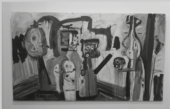
Koadro berriak ere ikusgai ipini ditu Zarauzko Merkatu Plazan.

Gernika koadroa izango da akaso deigarriena, handiena ere, hura delako. Baina