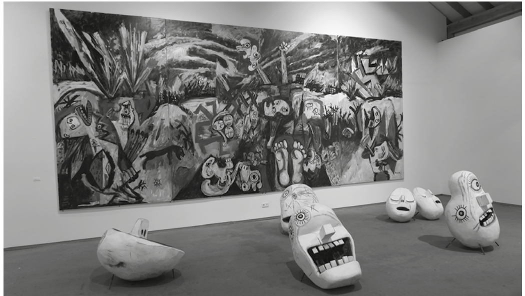
Egunero zabaltzen dute erakusketa, ordutegi honetan: 11:00-13:30 / 18:30-21:00 (Argazkiak, Joxe Luis Arrastoa).

■ Uztailaren 29ra arte ikusgai. 11:00-13:30 / 18:30-21:00.