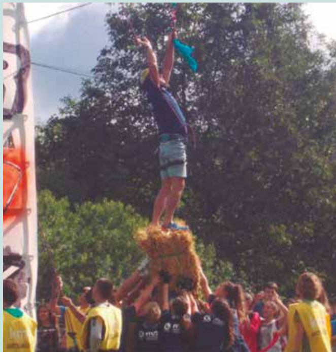
2013ko Kilometroak jaietan hasi ziren Erronka antolatzen.

Irailean izango dute bigarren proba; aurkezpen bideo lehiaketa. “Taldea erronkari bakoitzak, 3 minutuz azpiko aurkezpen bideo bat diseinatu, grabatu eta editatu beharko du”, adierazi dute antolatzaileek. Emaitzak web orrialde batean ikusgai jarri eta lehiatuko dira. Iraileko proba ere, ekainekoa bezala, urriaren 4ko Erronka egun handirako pun-