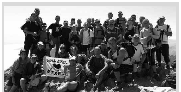
Andatzakoak, giro ederrean. Aurreko asteburuan, 34 mendizale batu ziren Hiru Erregen Mahaia eta Anie (argazkikoa) mendietara eginiko ibilaldian. Argazki gehiago andatza.com web orrian topatuko dituzue.