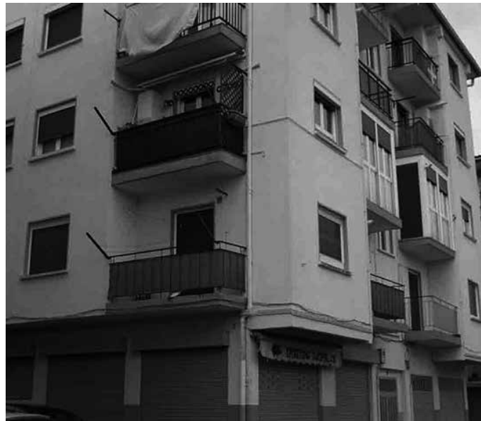
Enkantea desertu deklaratzeari erabaki du Udalak.

Uztailearen 10eko Gipuzkoako Aldizkari Ofizialaren bidez berri eman duenez, Usurbilgo Udalak Santuenean jabetzan dituen bi etxebizitzek enkantea desertu deklaratzeari erabaki du. Gogoan izan, ekainaren 22ra arteko epea zuten interesdunek, eskaintzak aurkezteko. Bi etxebizitzek "irteera prezioa hobetzen duten eskaintza onei izendatuko zaizkio etxebizitzak" iragarria zuen Udalak.