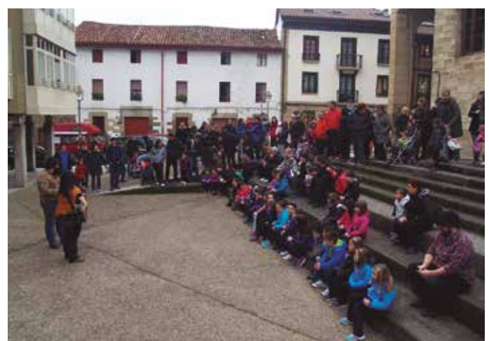
6 2015/3/21-22 : Badok15 jaialdiak, 19. Korrika eta #Kilometroak15 ekimenak batu zituen.