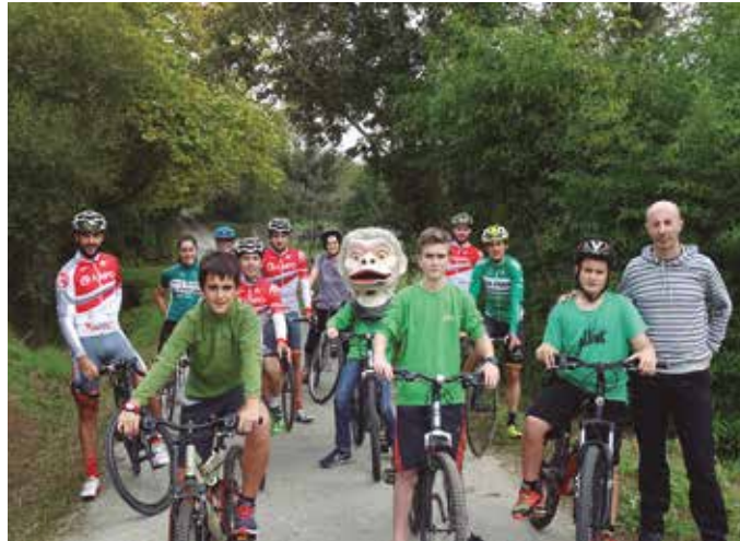
Bizikleta Martxa iragartzeko, herriko txirrindulariak eta txirrinduzaleak bat eginda. Zubietako bidea "bide gorri" gisa baliatuko da. Zubietarrek ezingo dute autorik erabili Kilometroak egunean. Larrialdi egoeran, telefonoz deitu Udaltzaingora: 943 361 112.

Atxegaldeko Mahaspildegia elkarre azpian, Urdaigana, Harane eta Araetako aparkalekuan.