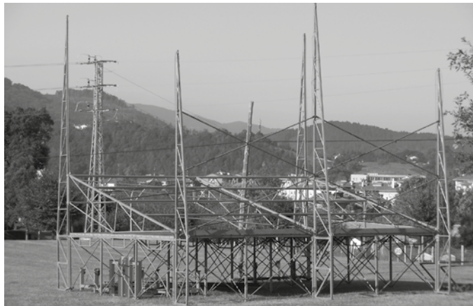
Astelehenean hasiak zituzten azpiegitura ezberdinen muntaia-lanak.

gandean ospatuko da Gattunk jaia eta herria datorrenarako prestatzen ari da. Laguntza behar harko da egunotan, muntaketa lanetan bereziki. Antolatzaileen esanetan, asteazken-ostegunetik asteburura bitarte, eskertuko lukete ahal duten herritar guztien laguntza, iganderako azpiegitura guztia prest egon dadin. Berdin, igande arratsaldetik aurrera ere. Jaialdiko ekitaldiak bukatzen joan ahala abiatuko baita desmuntaketa lan guztia.