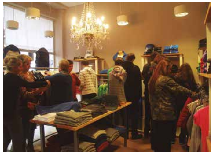
4 2014/11/30 : Gattunk Denda ireki zuten. Bezeroen joan etorria etenik gabekoa izan da ordutik.