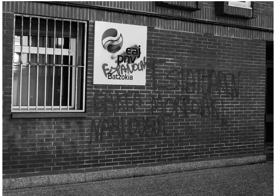
Irailaren 23an agertu ziren pintadak herriko hainbat tokitan eta baita EAJren Batzokian ere.

Azken hilabeteotan hizpide izan den inklusibitateari aipamena egiten diote oharrean. "Usurbilen hainbeste bultzatzen ari garen inklusibitate gaiarekin honela azaltzen da dekalogoan aipatutakoa: herritar gisa dagozkigun eskubideak eta aukera-berdintasuna bermatzea guztion esku dago. Hortaz, legeetatik harago, behar beharrezkoa da jendartearen eraldaketa sozial eta kultural sakona inklusiorantz".