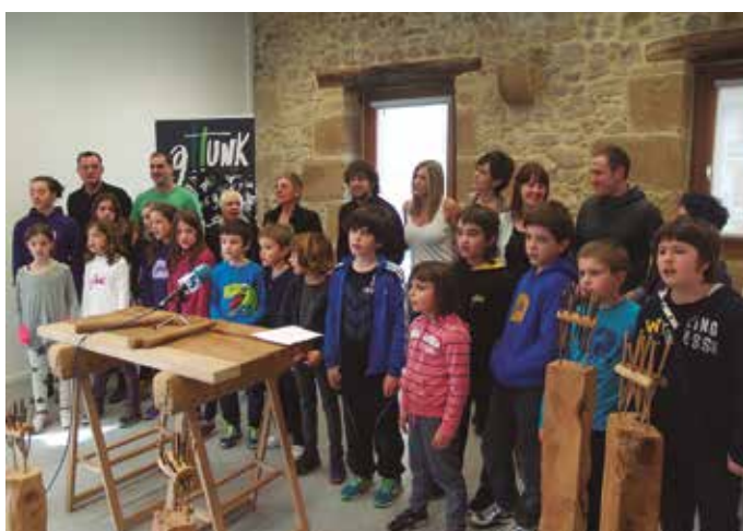
5 2015/3/18 : "Gattunk, Gattunk lotzen gattun harira..." kantua aurkeztu eta berehala hasi ginen abesten.