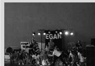
Eganekoak, umeez inguratuta.

Aginagako Eskola Txikiaren eguna izan zen aurreko larunbatekoa. Festa borobiltzeko, Egan taldekoak aritu ziren frontoiko giroa epeltzen.