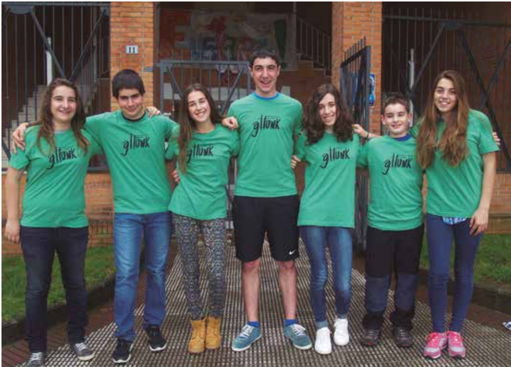
Argazkian, Udarregi Ikastola ordezkaturako duen erronkari taldea.

K ilometroak15 egunez ospatuko da Erronka handia. Parte hartzea nabarmen igo da iaiztik hona. 100 erronkari berri erakarriko baititu Usurbilgo jaialdiak.