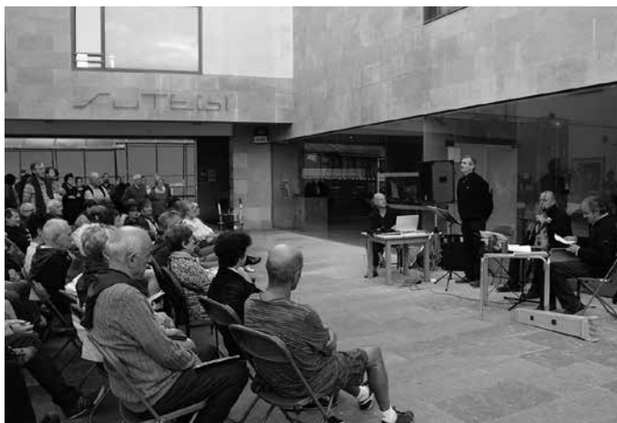
Kantu Jiran ibili ziren, baina Sutegi aurrean geldialditxo bat egin zuten.

Kantu jira berezi honetan, Kantu Taldea, Kilometroak 2015 eta Jexux Artze Kultur Elkarteak aritu ziren antolatzaileran lanetan.