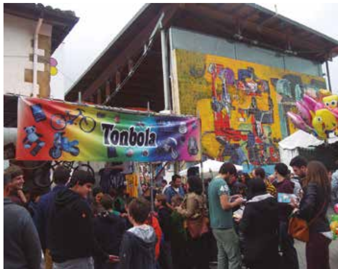
Igandean, Oiardo Kiroldegi aurrean topatuko duzue Gattunk Tonbola.

Luzea, oso luzea da Gattunk Tonbolak banatu nahi dituen oparien zerrenda; antolatzaileek aurreratu digutenez, Real Sociedad talde-