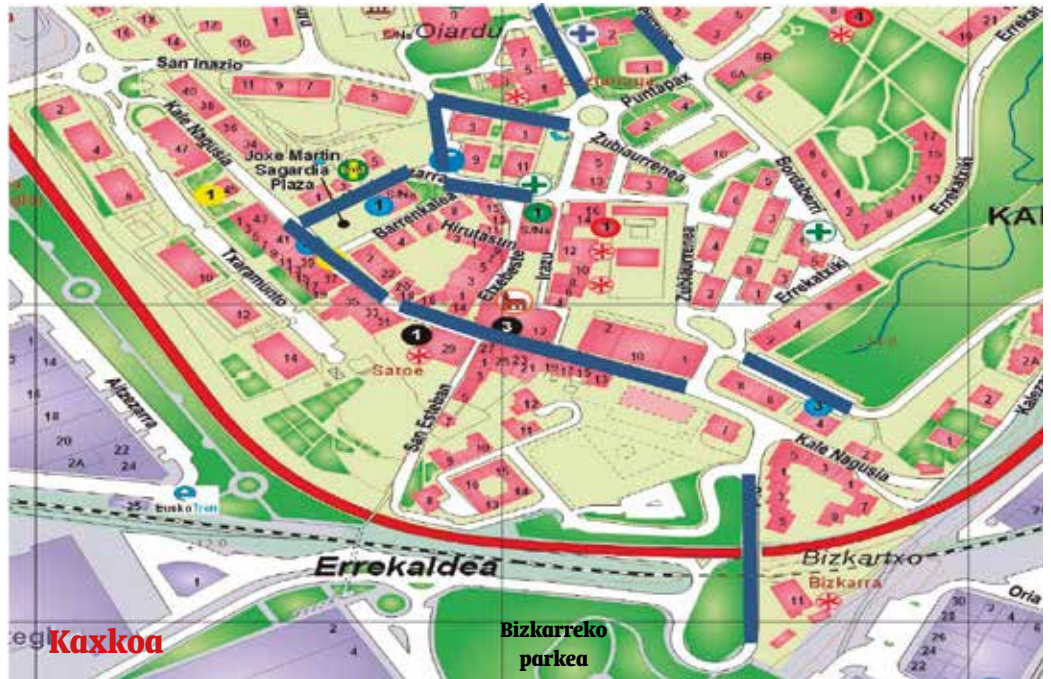
Urdinez dauden guneeetan hustu egin beharko dira aparkalekuak larunbat honetan, eguerdiko 12:00etarako.

Igande horretan baimendu gabeko ibilgailuek ezin izango dute kaleetan zehar ibili eta “larrialdiren bat ematen bada, gurekin harremanetan jarri beharko duzue (telefono zenbakia 943361112)”.