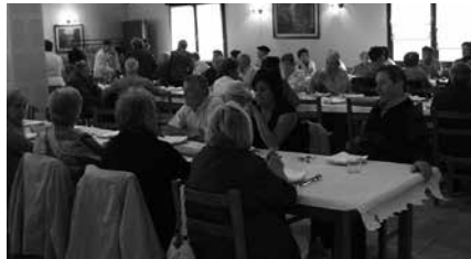
Larunbatean, mezaren ondoren hamaiketako Aginaga Sagardotegian.

15:30 III. Emakumezkoen trainerilla txapelketa eta IX. Gizonezkoen trainerilla txapelketa.