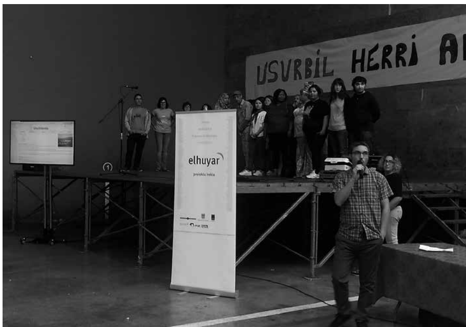
#Kilometroak15 egunari buruzko artikuluekin jarri da martxan Usurbilpedia. Beste hamar hizkuntzetara itzuli dute.

Usurbilen bai, baina beste leku batzuetan egin dira horrelakoak aurrez. Donostiako Amara auzoan egin zutena izan dugu erreferentzia guk.