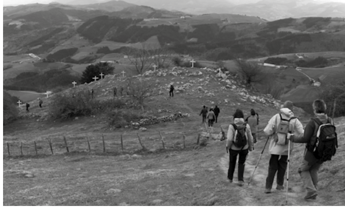
Goiz-pasa izango da eta amaieran, autobusez itzultzeko aukera egongo da.

A ndoain, Lasarte, Urnieta eta Usurbil lotzen dituen bide sareak badugu. Beste kontu bat da, ia lotuneok ezagutzen ote ditugun. Horretara, bideok ezagutu eta bailarako paisaia eta txokoz gozatzeko gonbita luzatzen digute eskualdeko udalek, beste behin. Buruntzaldeko Ibilbideen 8. Eguna izango dugu urriaren 11, goizez, 09:00-14:00 artean. Amaieran, itzultzeko autobus zerbitzua izango da. Zehaztasun gehiago, datorren astekarian.