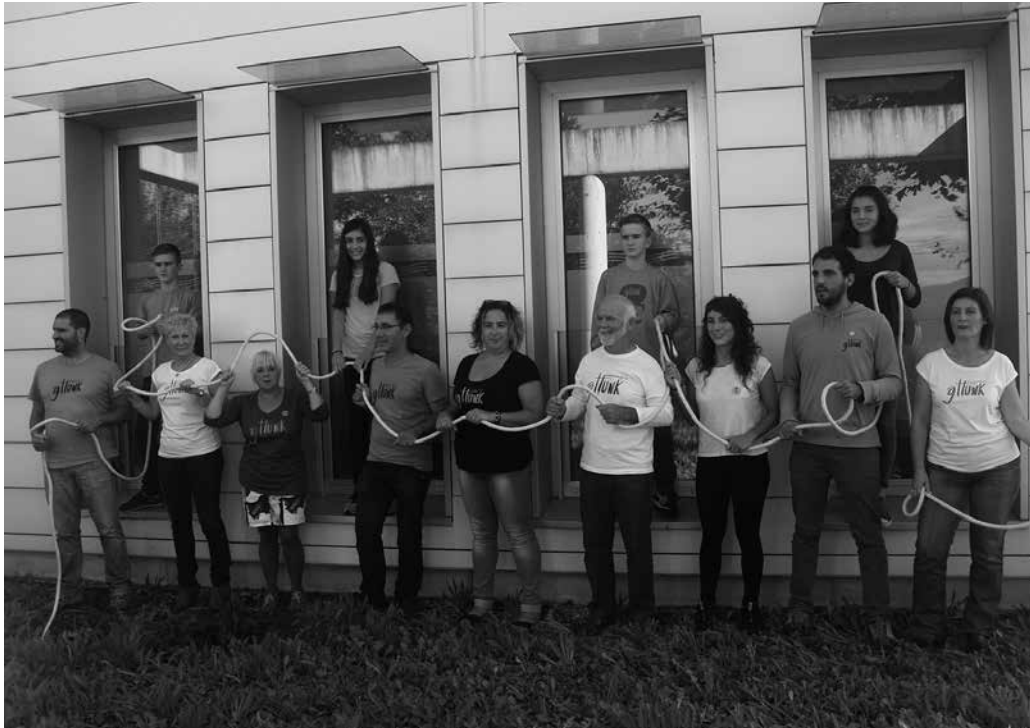
“Urtebeteko lana ikusiko dugu igandean”, hala adierazi zuten hedabideen aurrean.

Auzolanean buru-belarri egongo garen usurbildarrok prest egongo gattunk zuei ahalik eta ongi etorri beroena egiteko. Gonbidatuak zaudete guztiok, zuen zain egongo gattunk”. Urriaren 4an Usurbilen ospatuko den #Kilometroak15 ekimenera etortzeko antolatzaileek eginiko gonbita, egitaraua aurkezteko aurreko astean Ikastolen Elkartean hedabideentzat deitu zuten agerraldian.