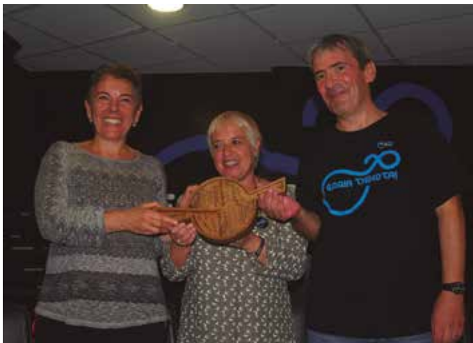
1 2014/10/05 : Emozio handiko unea. Lekuko hartzea, Orioko Kilometroak 2014 jaialdian.