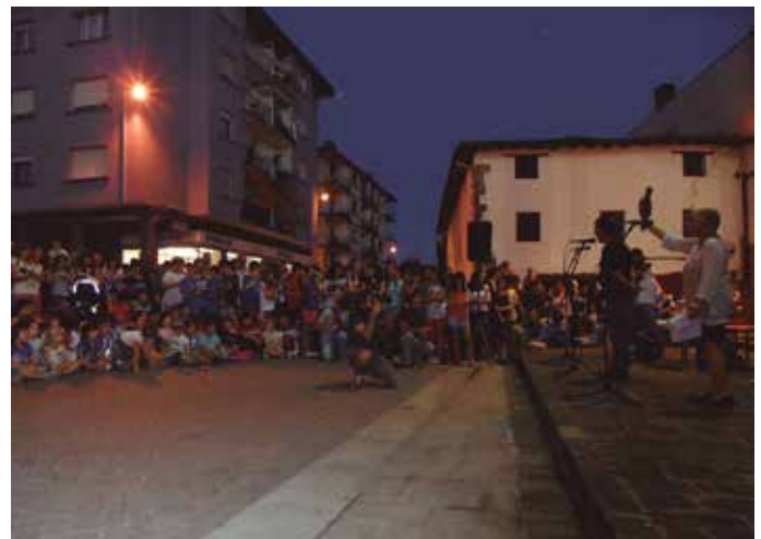
2 2014/10/17 : Lekukoa herrira iritsi zen, eta herritarren eskuetara heldu zen.