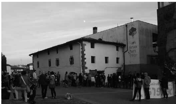
Irailaren 24ko elkarretaratzean sakabanaketarekin amaitzea eskatu zuten.

E skaera bikoitza oraingoan. Usurbilen Nahi Ditutugu bilguneak deituriko azken ostiraletako elkarretaratzean, euskal preso eta iheslarien eta haien senideen eskubi-deak errespetatzea galdegin zen irailaren 25ean, sakabanaketa amaitzea exijitzearekin batera. Egun berean, Espainiako Auzitegi Nazionala, hainbat euskal presoak euskal herriratzeko eskatzeko aurkezturiko helegiteak aztertzen hasi zen. Tartean, martxoaz geroztik jada kalean behar zuen arren, 2017. urtera arte espetxean jarraitu behar-