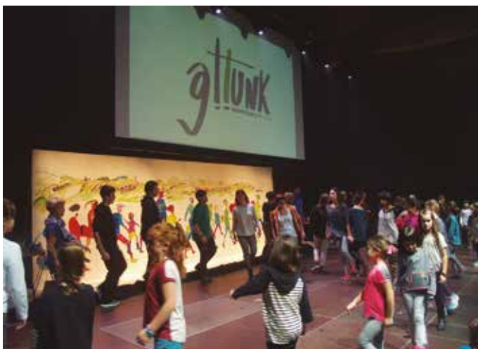
3 2014/11/29 : Gattunk markaren aurkezpen ikuskizun ederra Oiardo Kiroldegian.