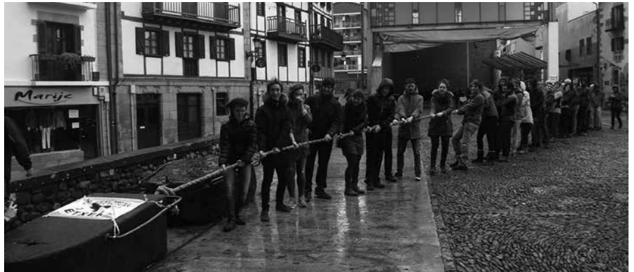
Larunbat honetan Bilbon eta Baionan egingo diren ekitaldiak babestu dituzte.

Urtarrilaren 9an arratsaldeko 17:00etan, euskal preso, exiliatu eta deportatuaren eskubideen alde manifestazioak deitu dituzte Sarek eta