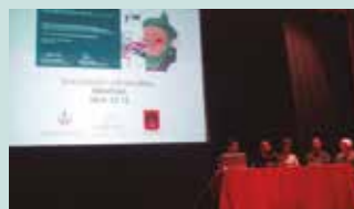
Eguberrien atarian egin zuten #Kilometroak15-eko balantzea.

Kilometroak egunak emandakoa erreparatu zuten baita Sutegiko ekitaldian. 60.000 lagun batu zituen festan, 1.600 lagun aritu ziren auzolanean. “Kopuru oso handia” antolatzaileen esanetan. Eguneko irabaziei dagokienez, “ekonomikoki eutsi” zitzaiola adierazi zuten, “aldez aurretik eginiko gastuen kudeaketa zorrotzari esker”. Egunean zehar ospaturiko ekitaldiei dagokienez, Erronka nabarmendu nahi izan zuten. Gipuzkoako 24 ikastoletatik 21-ek parte hartu zuten, 450 bat ikasleek guztira. “Arrakasta handia” izan zuen.