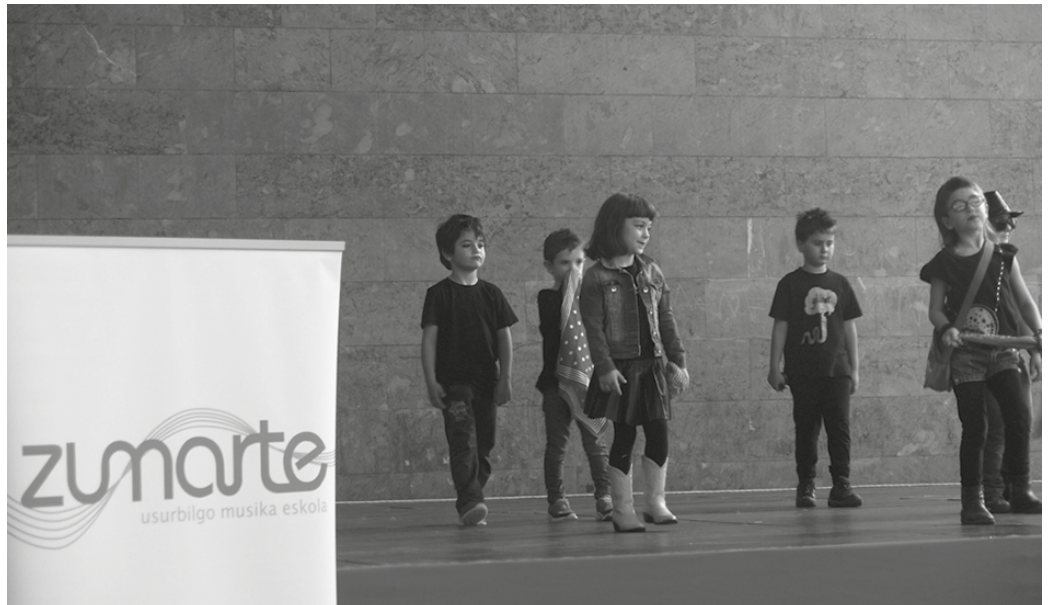
Zumarte Musika Eskola birgaitzeari begira, proiektu bat egingo da 2016an.

Abenduaren 23ko ezohiko udalbatza plenoan, Antolakuntza Batzorde Informatzailea eratzekeo puntua ahobatez onartu zen. Eta Lanpostuen eta Plantilla Organikoaren zerrenda onartu zen,