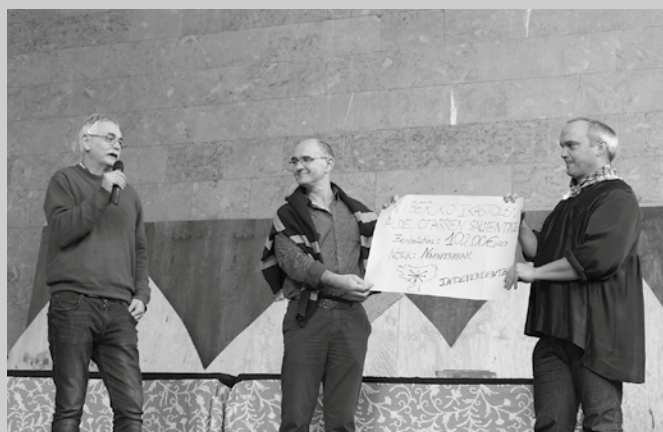
Xiberoatik hainbat ordezkari Santo Tomas azokara hurbildu ziren saria jasotzera.

Nafartarrak taldeak biderratu zuen, beste behin ere, Xiberoako Ikastolen aldeko kanpaina. Otarren salmentaren bidez, 10.200 euro batu zituzten, inoizko gehien, eta batutako dirua eskura eman zioten Xiberoako Ikastolen lehendakariari. Emandako laguntzagatik, eskerrak eman zizkien usurbildarrei.