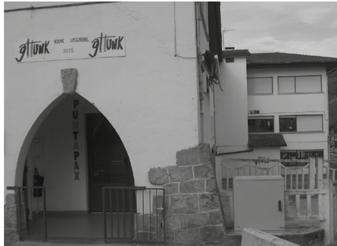
6 plaza berri sortuko dira laguntza honi esker.

la milioi bat euroko inbertsioa, helburu argi batekin onartu berri du Diputatuen Kontseiluak; mota honetako zentroyen instalakuntzak hobetu nahi dituzte, guneotan plaza berriak sortzeaz gain. Honela banatu dute 912.000 euroko laguntza: ■ Oreretako Sanmarkosenea egoitza: 525.000 euro.