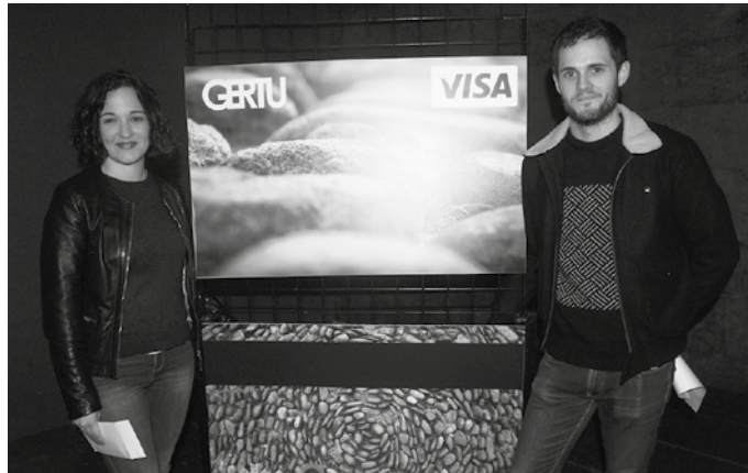
Herritar Txartela udaberriaren egongo da eskuragarri.

Herritar Txartel berriaren diseinu lehiaketara, 18 lan aurkeztu ziren guztira. Horietatik 3, epaimahai batek hautatu zituen. Eta hiru lanotako ba-