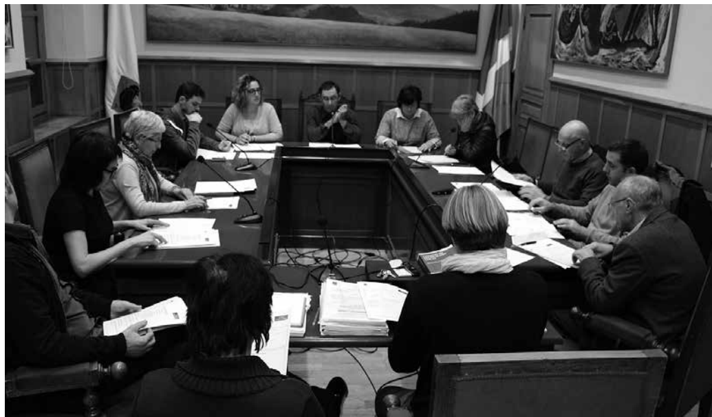
Abenduaren 23ko ez-ohiko udalbatza plenoan aztertu eta bozkatu zen 2016ko udal aurrekontu proposamena.

Nahiz eta Ogasun Batzorde horretan PSE-EEko zinegotziaren proposamen guztiak ez ziren aurrekontuetan islatu, “asko ez zirelako aurrekontuetan zehatz-mehatz jasotzekoak”, aurrera begira oso kontuan hartzekoak direla aipatu