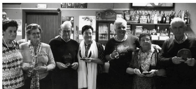
Arrate elkartean egin ziren karta jokoetako txapeldunak.