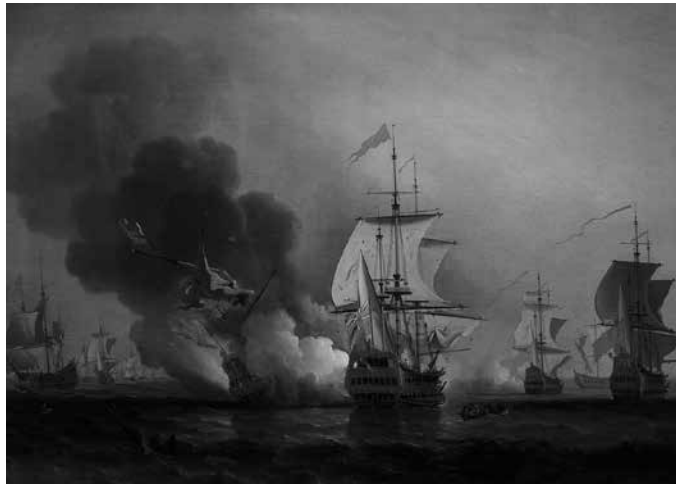
Ingelesen kainoikaderek hondoratu zuten San Jose ontzia. 1708ko ekainaren 7an izan zen. Samuel Scottetek koadro honetan jaso zuen gatazka. Hondoratzen ari dena da San Jose.