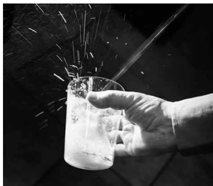
Ikastaroa Potxoenean egingo da, larunbat honetan goizeko 9:00etan hasita.

Ikastaroaren prezioa; 10 eurokoa, Alkartasuna Kooperatibako bazkideek doan. Kooperatibak bertan eman dezakezue ikastarorako izena, 943 361 114 telefono zenbakira deituta edo alkartasuna@usurbil.com helbidera idatzita.