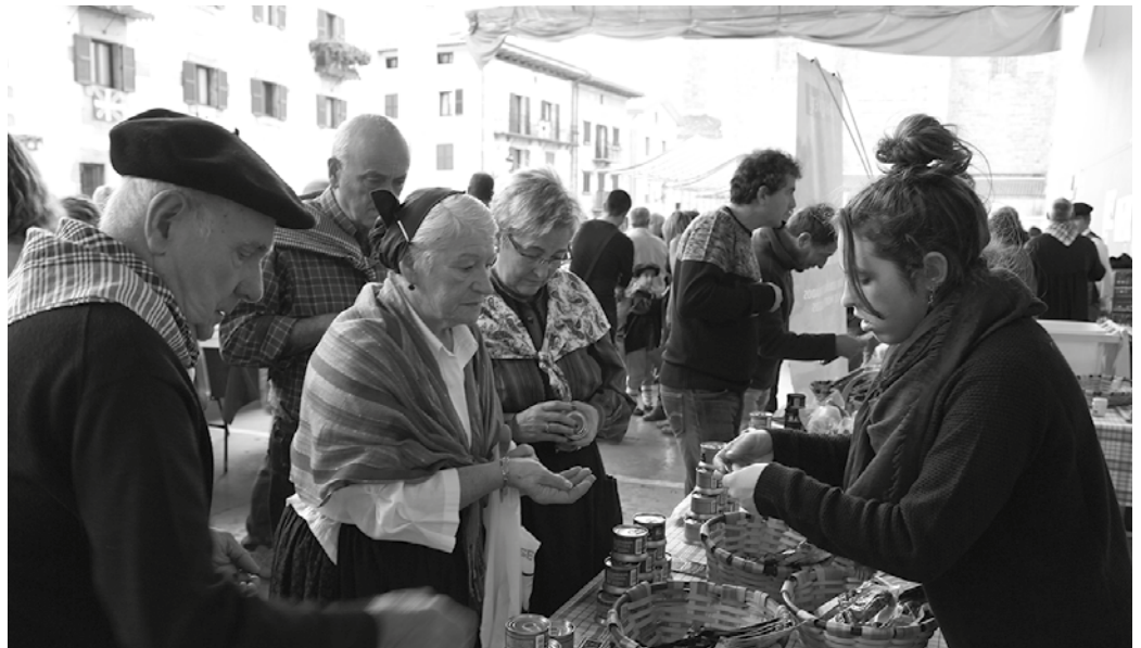
Gero eta gehiago dira Usurbilgo Santo Tomas egunean baserritarrez jantzen direnak.

Fotokolen argazkia atera zuten artean zozketa egin genuen eta 139 izan zen zerbaki saritua. Saria, Erri Gorako saskia. Zozketa unean ez zen irabazlea agertu. Zerbakiaren jabe bazara, NOAUA!tik pasa saski bila.