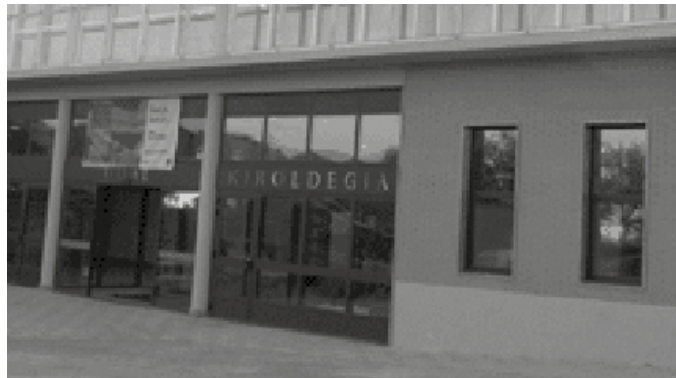
Lehorreko nahiz uretako ikastaro ugari iragarri dituzte urte berrirako.

Kiroldegiko abonua berri edo aldatzeko garaia da orain. Iraupen ezberdinetako abonuen artean aukera daiteke. Abonu mota ezber-