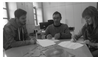
Helduen euskalduntze eta alfabetatze lanen eskaintza sustatzea izango da hitzarmenaren helburua.

"Urte berriarekin batera, euskarra ikasi edo dakizuna hobetu nahi baduzu, aukera duzu Etumeta AEK euskaltegiaren. Euskalduntzeko maila guztiak, B1, B2, C1 edo EGA tituluak prestatzeko klaseak, ordutegi ezberdinetan edo autoikaskuntzan.