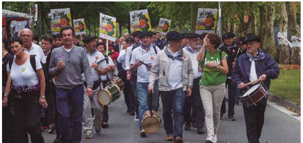
#Kilometroak15 eguneko irabaziak eraikin berria finantzatzeko baliatuko dira, besteak beste.

Dirua bide ezberdinetatik jaso da. Aipatzekoak, urtean zehar